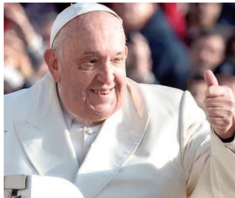
El Papa en franca mejoría.

El nuevo parte médico indicó que son necesarios «más días de estabilidad clínica para resolver el pronóstico».