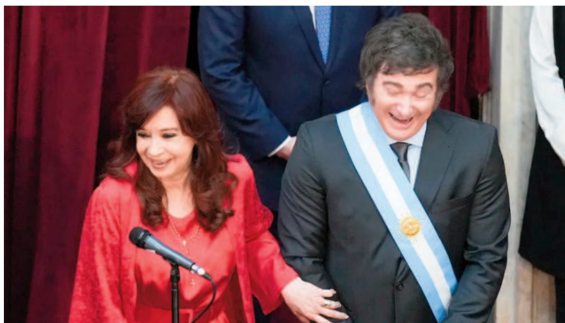
Cristina Kirchner y Javier Milei.

Además de medir la percepción de honestidad, la encuesta analizó el impacto del escándalo de la criptomoneda $LIBRA en la sociedad. El 52% de los argentinos lo considera un hecho "grave",