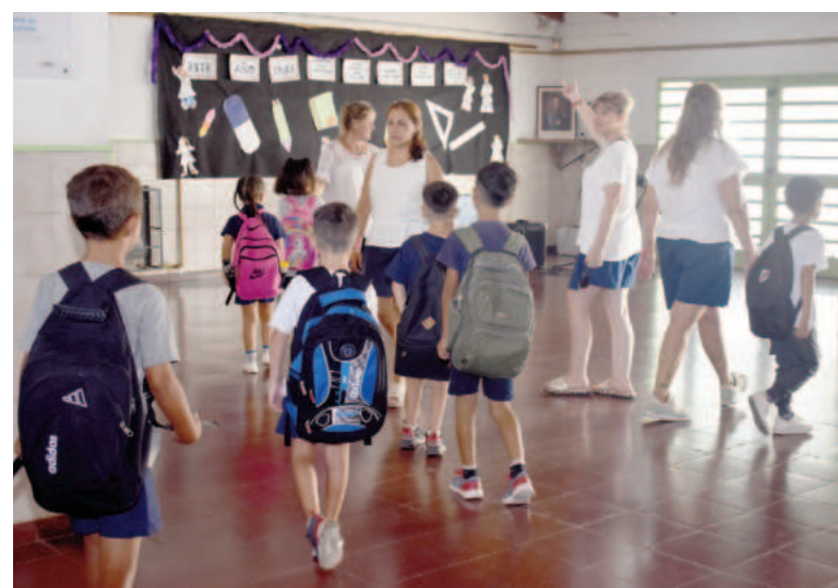
Sin paro, las clases en nuestra ciudad comenzarán el miércoles 5 de marzo. ARCHIVO

Tras destacar que “estas negociaciones obligan a las partes a negociar de buena fe”, la Unión Docentes Argentinos (UDA), la Asociación del Magisterio de Enseñanza Técnica (AMET), la Confederación de Educadores Argentinos (CEA) y el Sindicato Argentino de Docentes Privados (Sadop) informaron que suspendieron la huelga del miércoles próximo y destacaron: “La negociación colectiva es garantía de paz social”. Los sindicatos AMET, CEA, Sadop Y UDA quedamos en estado de alerta esperando la convocatoria en tiempo y forma”, concluyeron.