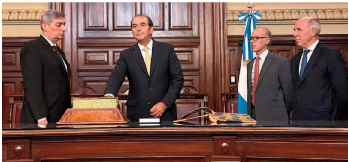
Manuel García-Mansilla jura ante Horacio Rosatti.

Con la incorporación de García-Mansilla, la Corte Suprema ya cuenta con cuatro de los cinco jueces previstos por