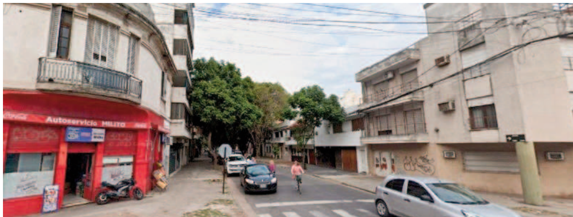
La zona en la que fue hallado el hombre sin vida.

En el departamento se incautó una pistola calibre 40, que habría sido la usada para el hecho bajo investigación, el celular del fallecido y de su pareja.