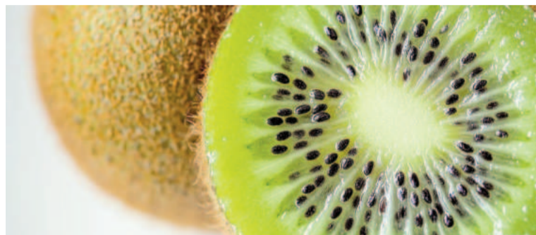
El kiwi ayuda a conciliar el sueño.

De acuerdo con el cardiólogo Aurelio Rojas, el kiwi es una fuente rica en antioxidantes, serotonina y vitamina C, compuestos que desempeñan un papel crucial en la regulación del sueño. En declaraciones recogidas por La Vanguardia , el especialista explicó que incluir esta fruta en la rutina nocturna no solo ayuda a conciliar el sueño más rápido, sino que también mejora su calidad. El estudio mencionado, realizado con 24 participantes de entre 20 y 55 años, evaluó los efectos del consumo de kiwi en los patrones de sueño durante un período de cuatro semanas. Los resultados fueron contundentes: el tiempo