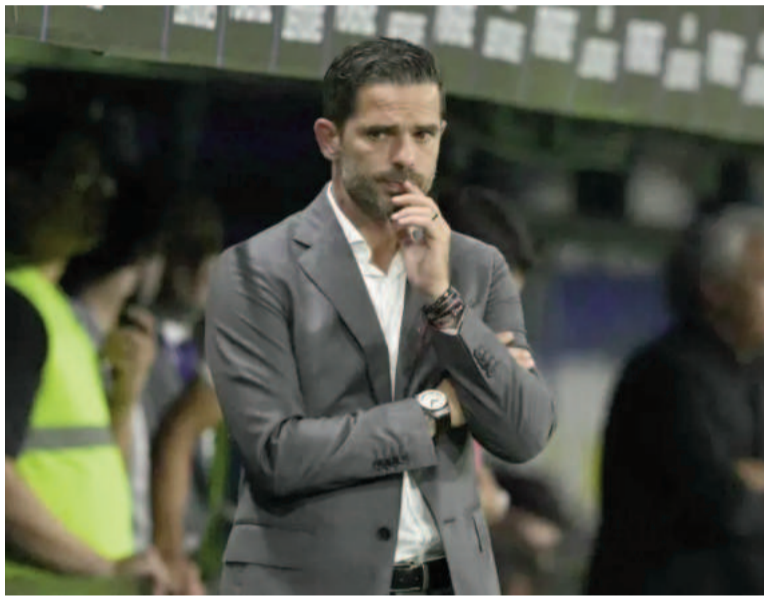
Gago está ante un partido que puede ser el último del ciclo.

Trascendió que en la reunión del miércoles por la tarde en el predio de Boca de Ezeiza, Riquelme finalmente no estuvo (aunque se hizo presente en el lugar) y que Gago conversó con el Consejo de Fútbol que integran Raúl Cascini, Mauricio Serna