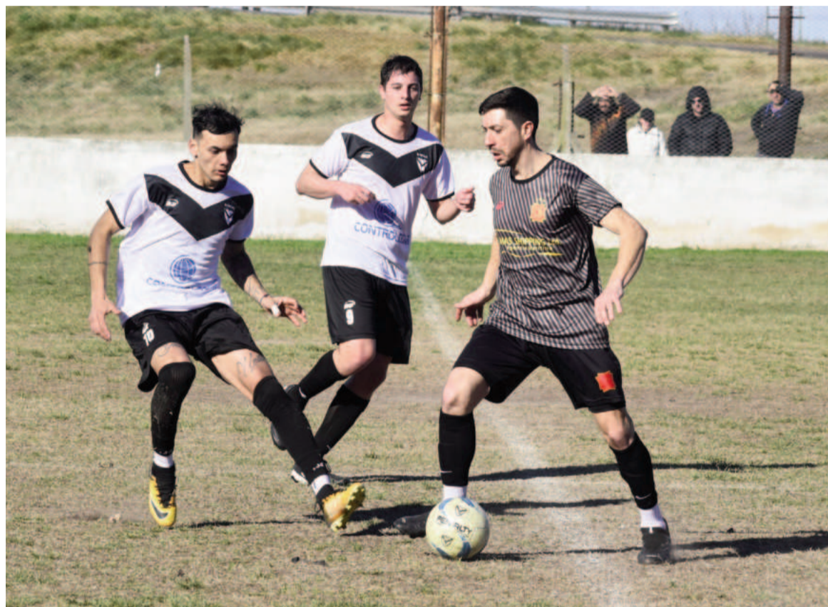
Belgrano y El Fortín se verán las caras esta noche en el Camping belgranense. EL NORTE

Del lado de El Fortín, el objetivo para este año es mejorar la imagen futbolística de la última temporada, buscando salir de la zona