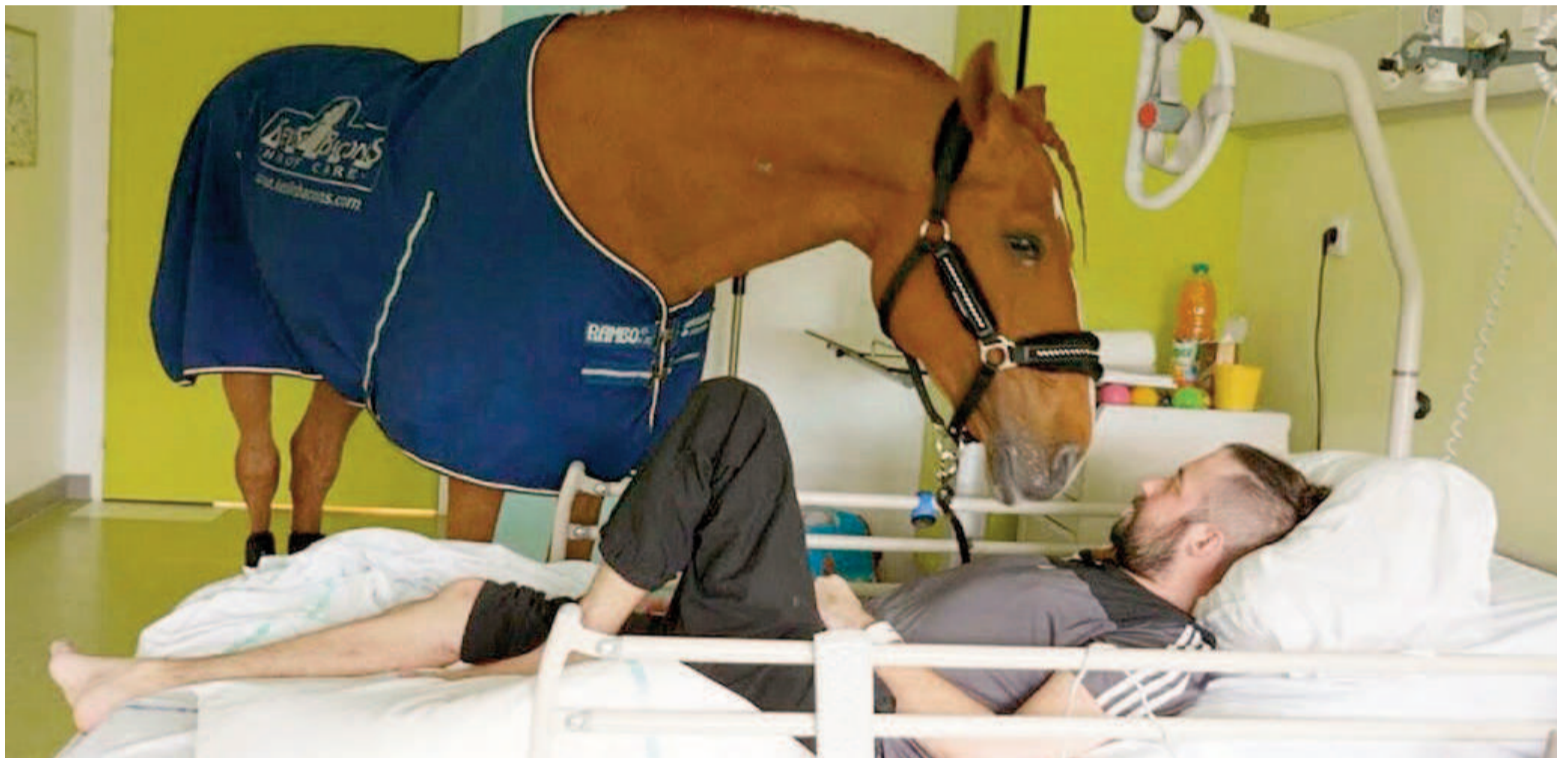
El comportamiento de Peyo ha suscitado el interés de la comunidad científica.

Desde 2016, Peyo y su cuidador colaboran como voluntarios en el Hospital de Calais a través de la or-