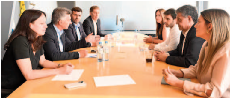
La mesa ejecutiva del PRO.

Mauricio Macri no estará el sábado en la Asamblea Legislativa en la que Javier Milei dará su discurso para abrir el período de sesiones ordinarias del Congreso. Su ausencia será en medio de una tensión máxima entre el macrismo y La Libertad Avanza en la víspera de la disputa electoral. Es que en el PRO que rodea al ex presidente asoma una especie de fractura. Durante la reunión de la Mesa Ejecutiva de ayer quedó desnuda esa disonancia.