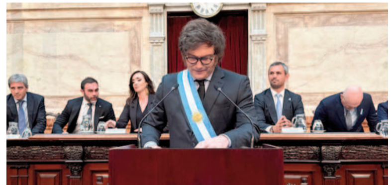
El sábado volverá a darse la escena.

Otro tema que evalúa incluir es el de los hechos de inseguridad. El asesinato de una niña de 7 años que cometieron dos menores de edad durante un asalto en La Plata hizo recrudecer