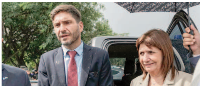
El gobernador junto a la ministra.

Este jueves, con la presencia de la ministra de Seguridad de la Nación, Patricia Bullrich, y el gobernador de Santa Fe, Maximiliano Pullaro, se llevó a cabo la quema de 2,5 toneladas de marihuana en la ciudad de Reconquista.