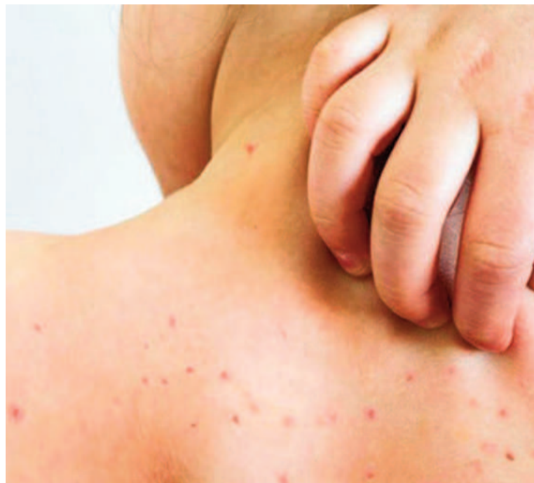
Los niños de entre 13 meses y 4 años que hayan estado en contacto con casos confirmados deben recibir una dosis extra de la vacuna triple viral.

Para facilitar el acceso a la inmunización, la vacuna triple viral se aplica de manera gratuita en distintos centros de salud de la ciudad. En San Nicolás, las personas pueden acercarse al Vacunatorio del Hospital San Felipe, ubicado en Olleros 41.