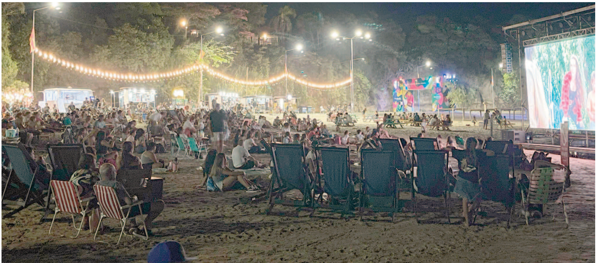
Para esta noche la propuesta es para valientes: se centra en el cine de terror con las películas «Aterrados» y «Longlegs». EL NORTE