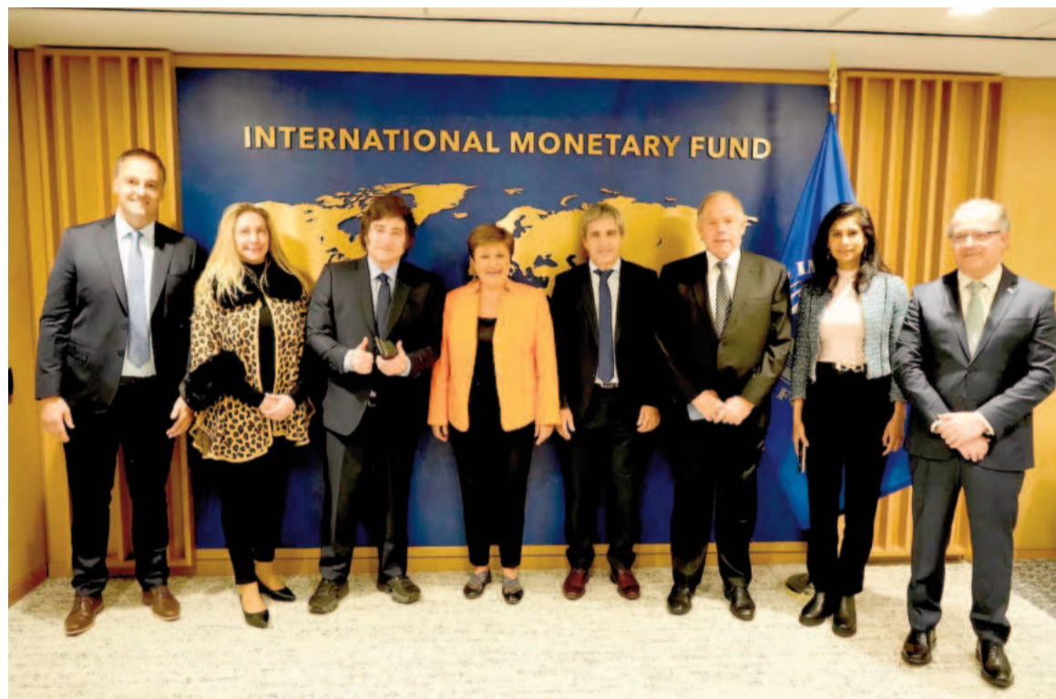
La comitiva argentina junto al equipo del FMI en la sede de Washington.

Antes de la cita con Georgieva, en su primera actividad oficial en Estados Unidos, Javier Milei se reunió con Elon Musk en un hotel cinco estrellas de Maryland para analizar el tablero internacional y las posibles inversiones americanas en la Argentina. El encuentro empezó a las 15:15 (hora del este), y se extendió por una hora.