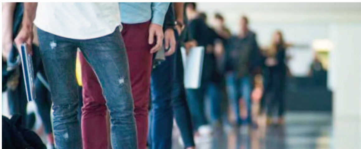
Provincia tiene la desocupación mas alta.

Según la Encuesta Permanente de Hogares (EPH) del Indec, la desocupación de la provincia de Buenos Aires fue de 8,3% en el tercer trimestre del 2024, lo que la ubicó en el peor lugar del ranking en lo que a desempleo se refiere. En total, el organismo de estadísticas contabilizó 700.000 desocupados en la jurisdicción más poblada del país. La diferencia con el resto de la Argentina fue notoria. La segunda provincia con mayor nivel de desocupación fue Tierra del Fuego, con 8,1%, mientras que Chaco, con 7,1%, completó el podio de malos resultados.