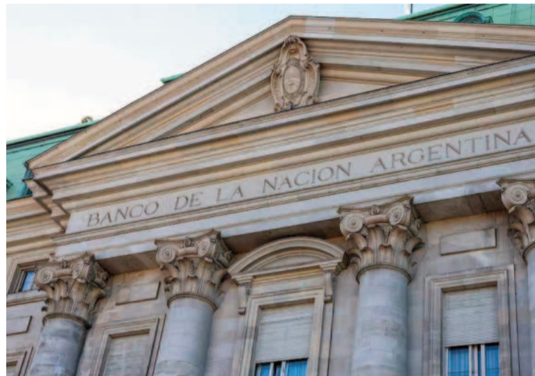
Milei firmó el decreto que convierte al Banco Nación en Sociedad Anónima.

“Banco Nación ya cerró su balance especial de transformación al 31/12/2024 y la nueva Sociedad Anónima tendrá activos por $ 48 billones, depósitos y otras obligaciones por $ 33 billones. En tanto, el Patrimonio Neto (PN) de la SA ascendería a $ 15 billones”, explicaron en aquel entonces.