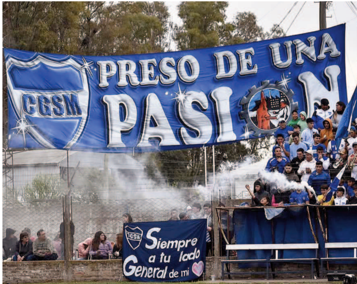
El "General" se suma a la Liga Nicoleña a partir de este año. WEB

Para los nicoleños será el destino más lejano de todos, que hasta el año pasado era Conesa (poco más de 35 km). Más allá de esta "incomodidad", la posibilidad de crecimiento a nivel deportivo, con un nuevo rival de jerarquía y la ocasión de llevar a la Liga a 16 equipos después de muchos años, hizo que