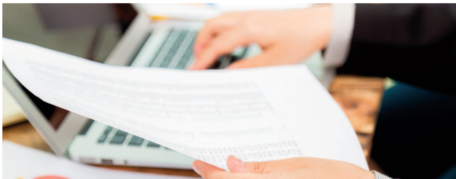
Servicios de telefonía e Internet, estafas virtuales y consumos desconocidos en tarjetas de crédito y débito fueron los reclamos más frecuentes.

Desde la oficina municipal explicaron que el trabajo de mediación resulta clave para garantizar solu-