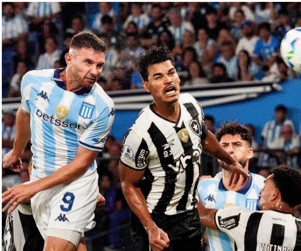
La Academia ganó en la ida y sueña con otro título internacional.