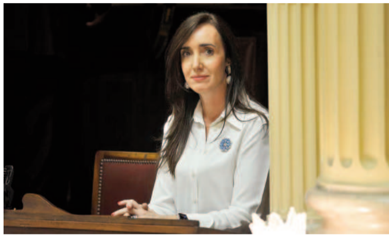
Victoria Villarruel -a cargo del Ejecutivo- presenció la votación desde un palco.

Vigo repitió argumentos del Ejecutivo en relación con el proyecto, en cuanto a que las PASO no significaron ningún "remedio" para la crisis de representación política y que sirven "como una gran encuesta",