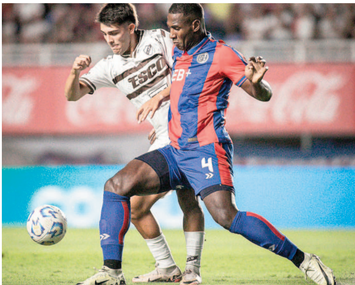
El Ciclón ganó sobre la hora y sigue invicto.