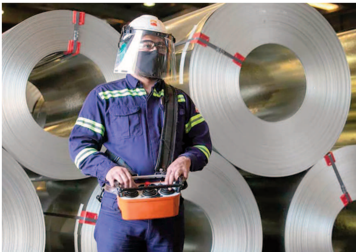
La industria del acero pide revertir la suba de aranceles de Trump.

"Hay una integración productiva entre el sector siderúrgico de ambos países: la industria norteamericana solicitó a la Argentina productos de acero que son insumos para su proceso productivo. Esta importación fue debidamente autorizada por los organismos norteamericanos com-