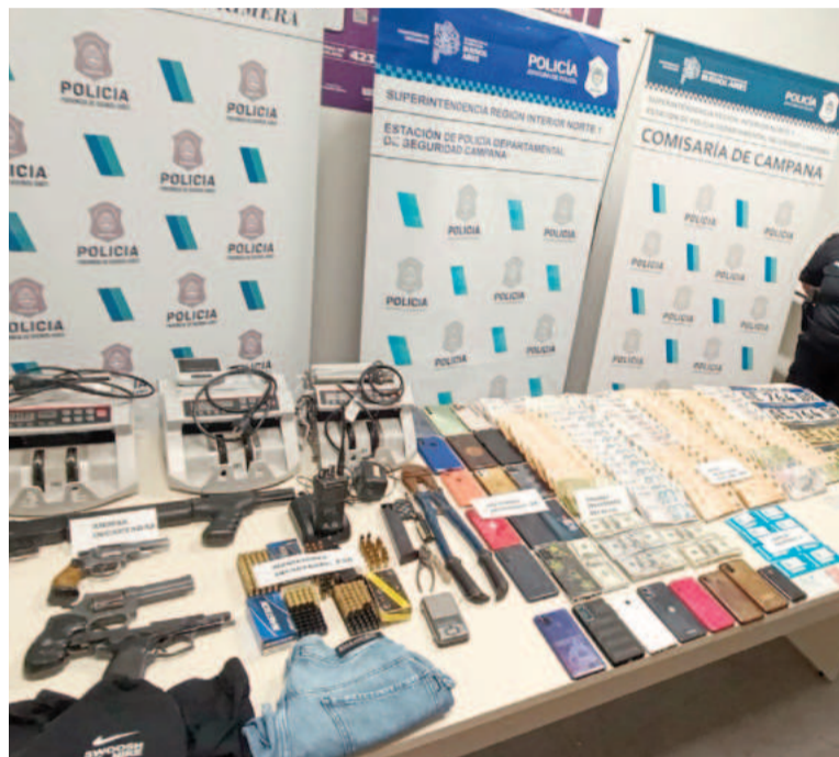
El golpe a la organización se dio el pasado miércoles luego de un megaoperativo que incluyó 15 allanamientos en los que se secuestraron diversos elementos.

Un operativo conjunto de la Superintendencia de Seguridad Interior Norte 1 y la Jefatura Departamental de Seguridad Campana de la Policía bonaerense permitió desbaratar la organización y detener a siete personas acusadas de participar de la banda dedicada al robo de camionetas Toyota Hilux que operaba en las localidades de Zárate, Campana, San Isidro, San Fernando, Escobar, Exaltación de la Cruz y Pilar. El golpe