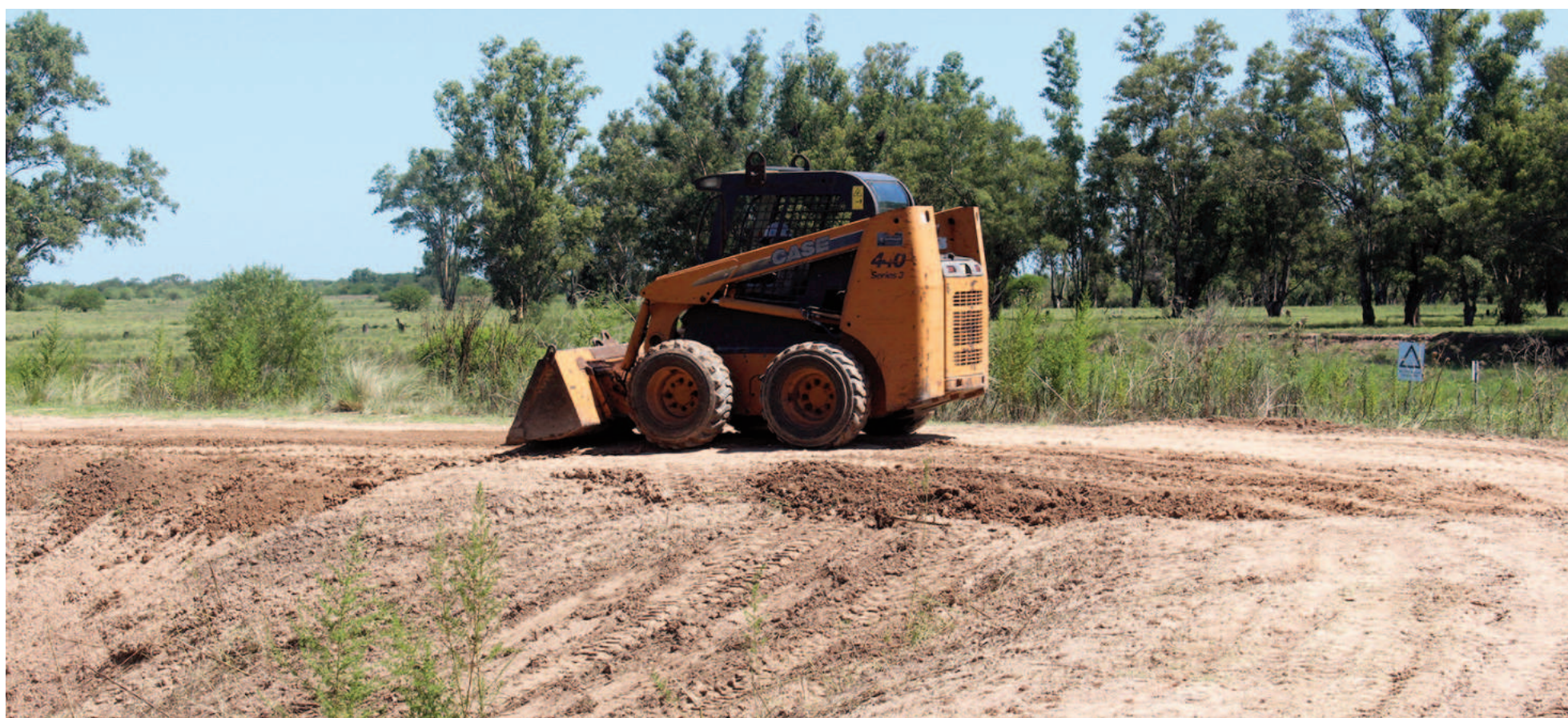
El alteo del terraplén de La Emilia se iniciará una vez completados los trabajos de desmalezamiento que se ejecutan actualmente en toda su traza.

La firma Maragua, que se adjudicó la operación y el mantenimiento de las protecciones hidráulicas de la localidad de La Emilia, inició tareas de limpieza y desmalezamiento. Se trata de trabajos preliminares al alteo del terraplén, una obra que estaba prevista en el pliego de licitación y que se pondrían en marcha las próximas semanas.