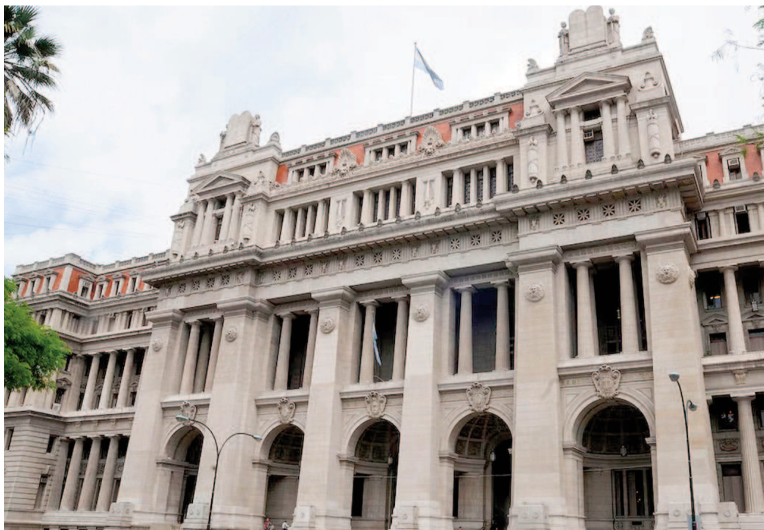
El Palacio de Tribunales, sede de la Corte Suprema.

El debate se reactivó en 2024 con la jubilación inminente de Juan Carlos Maqueda, lo que aceleró la necesidad de una resolución para evitar la acumulación de casos pendientes. Aunque el fallo estaba listo para su publicación el 12 de diciem-