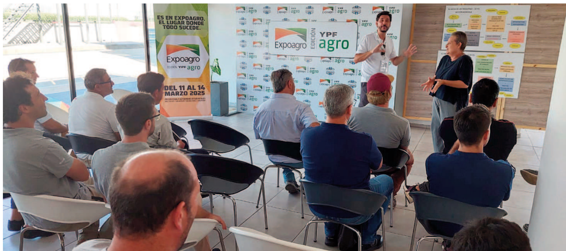
A 17 días del inicio de su edición 2025, Expoagro se reunió ayer en el Predio Ferial San Nicolás con empresas que participarán en el Tecnódromo.