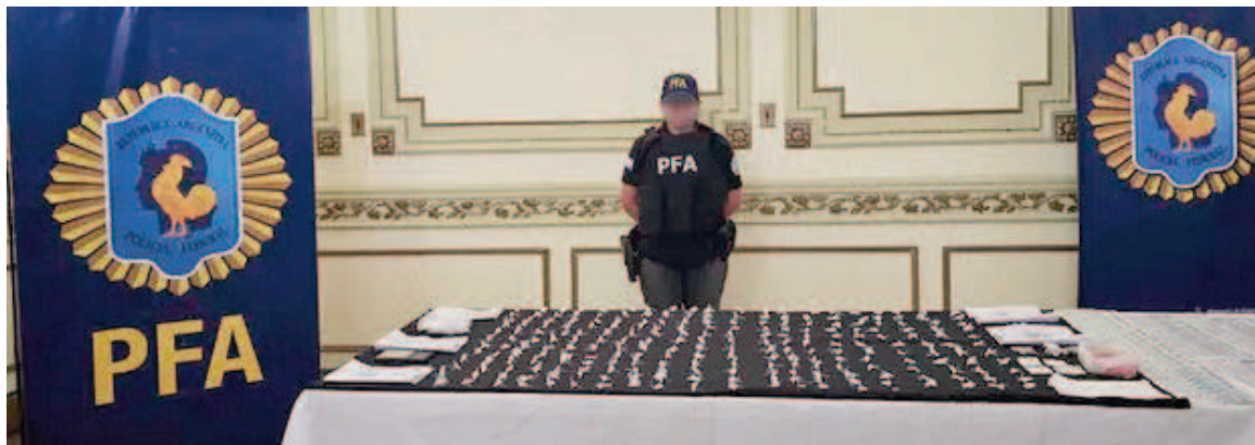
Parte de lo secuestrado por la Policía Federal en distintos allanamientos.

La estructura delictiva podría contar con otros integrantes y tanto la Policía Federal como los fiscales pusieron la lupa en el financista de esta estructura delictiva, quien ya está identificado.