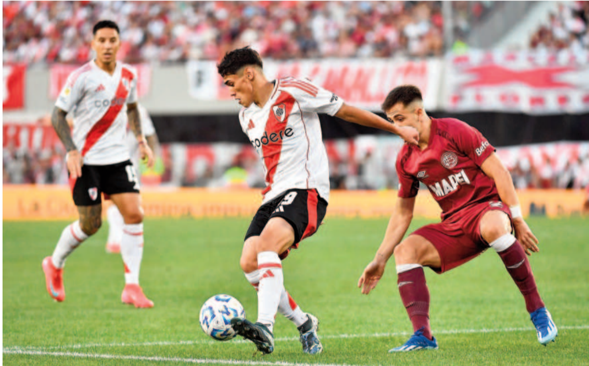
El Millonario va a San Juan por su primera victoria fuera de casa. WEB

Boca se medirá ante Aldosivi hoy por la Zona A, con la intención de cambiar la página tras la derrota en el partido de ida por la Fase 2 de la Copa Libertadores ante Alianza Lima. El encuentro se jugará en La Bombonera a las 19.30 y contará con el