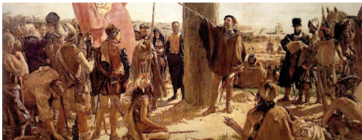
Garay en la ceremonia de fundación de Buenos Aires.

Arquetipo del conquistador español, sin porvenir ni raíces en su tierra natal, Juan de Garay parece haber buscado el poder, la riqueza