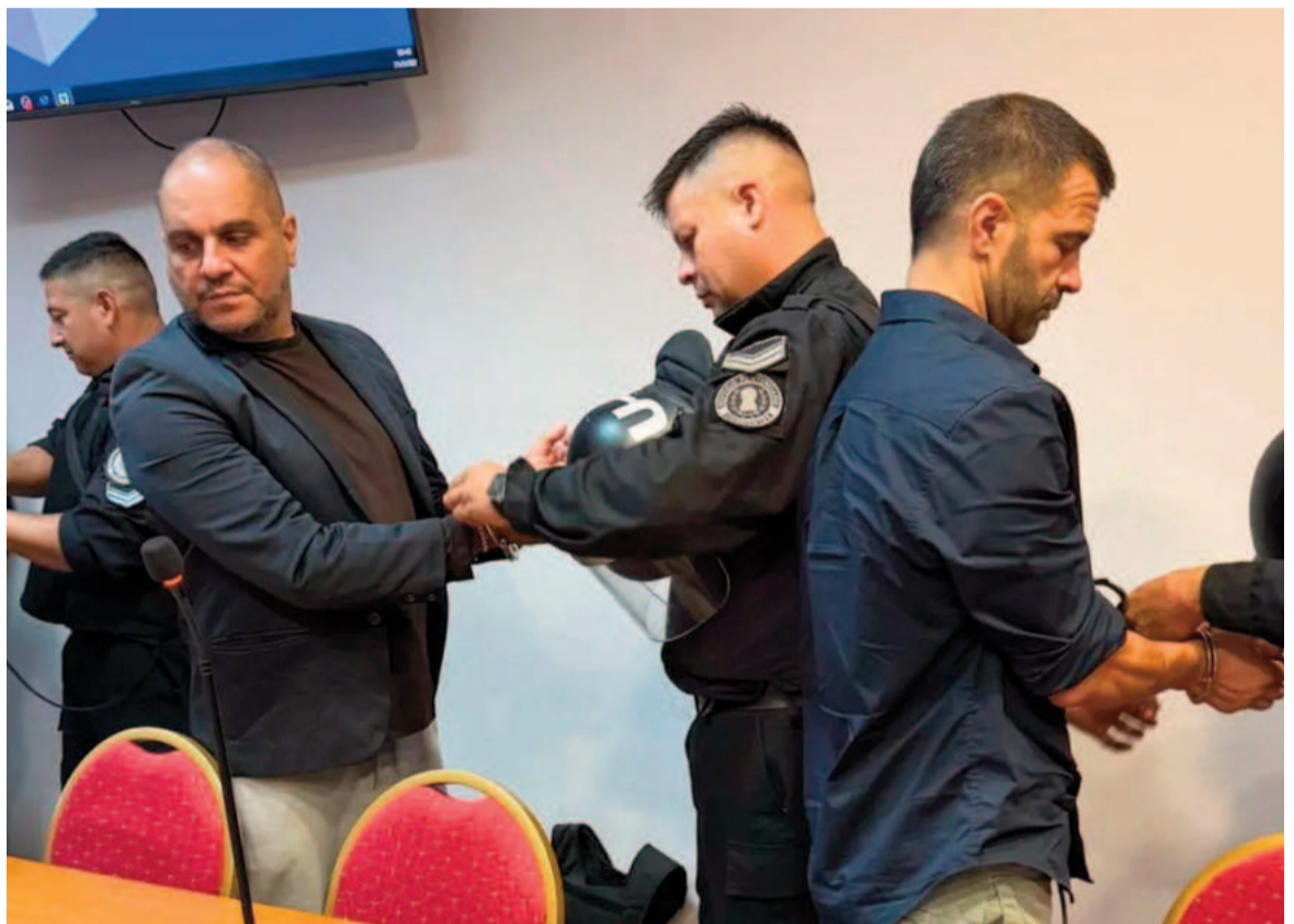
Cositorto fue expulsado de la sala.

En la fundamentación mencionó que "se sostuvo como maniobra el uso de pantallas mediáticas y medios de comunicación y la ostentación mostrando viajes de lujo para construir el engaño".