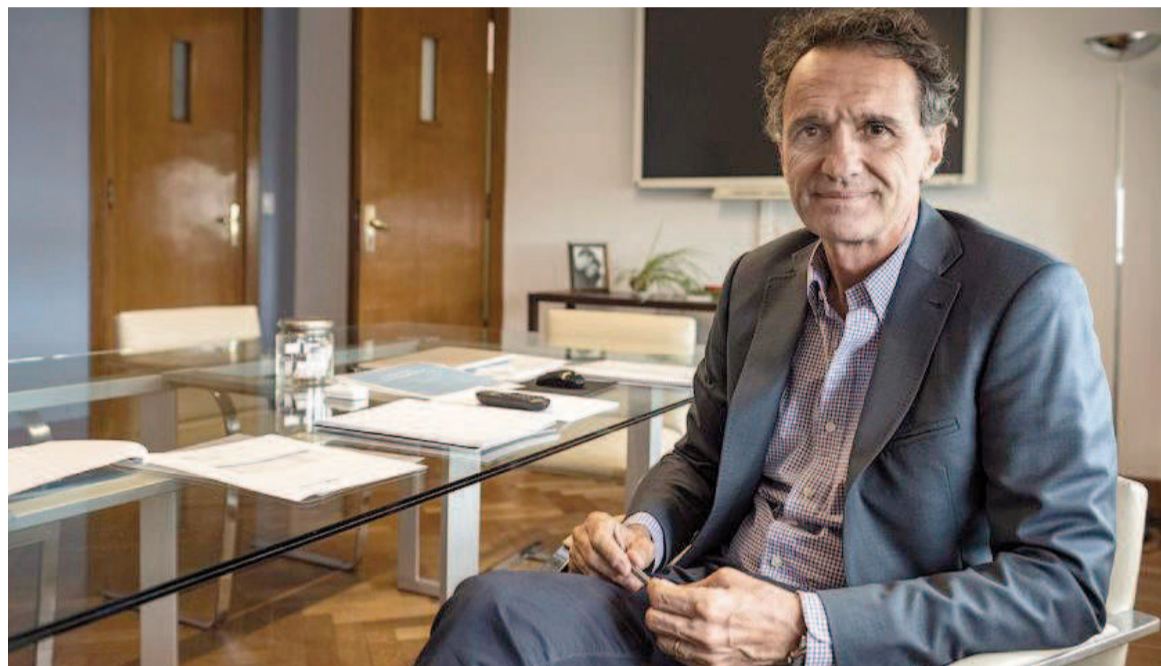
El ministro aspira a la gobernación.

El ministro dijo que las elecciones legislativas de este año pueden servir como “un punto de quiebre” y marcar el nacimiento de un frente político amplio, que “exceda al peronismo”. Y para las generales de 2027, él podría lanzarse como as-