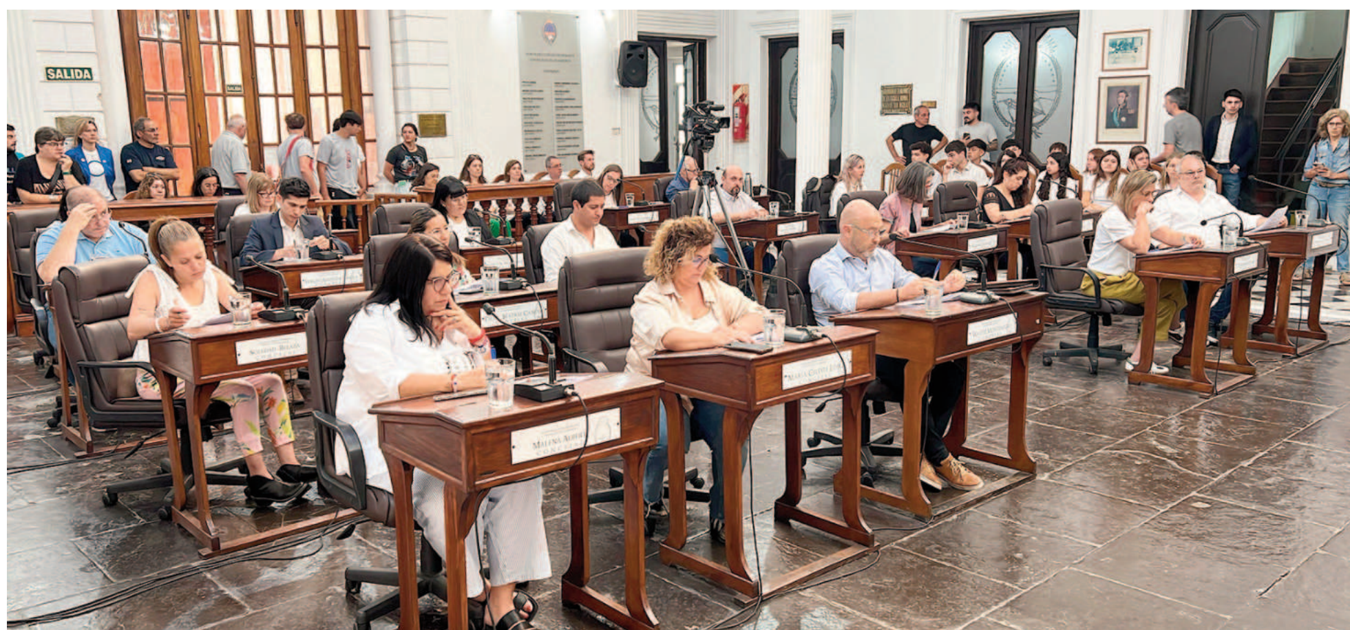
El próximo martes será el reencuentro de los concejales al cabo de dos meses sin actividad en el recinto.