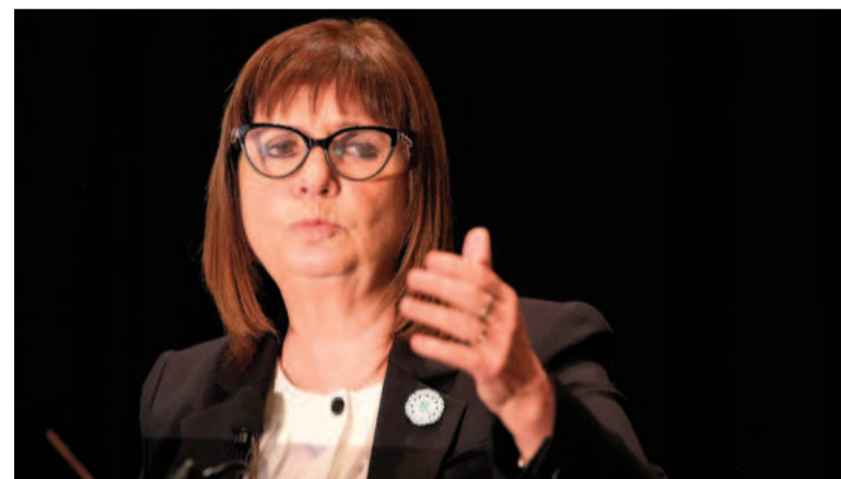
La ministra Patricia Bullrich.

del Ministerio de Salud, el REPROCANN "es una base de datos diseñada para poder registrar a aquellas personas que cuenten con las con-