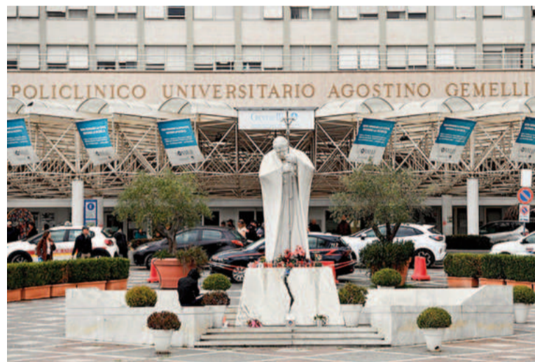
La estatua de Juan Pablo II frente al hospital donde está internado Francisco.

“Está sereno, de buen humor y hasta ha leído algunos diarios,” se informó. No estará presente en el jubileo de los artistas.