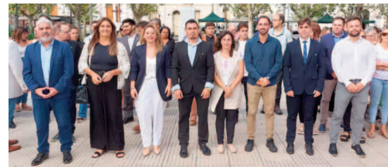
El Intendente junto a las autoridades presentes.

"Es lógico que, viniendo del fracaso del gobierno anterior, había que tomar distintas decisiones", dijo el Intendente, quien advirtió que las medidas actuales, aunque buscan combatir la inflación, no deben sacrificar la producción y el trabajo.