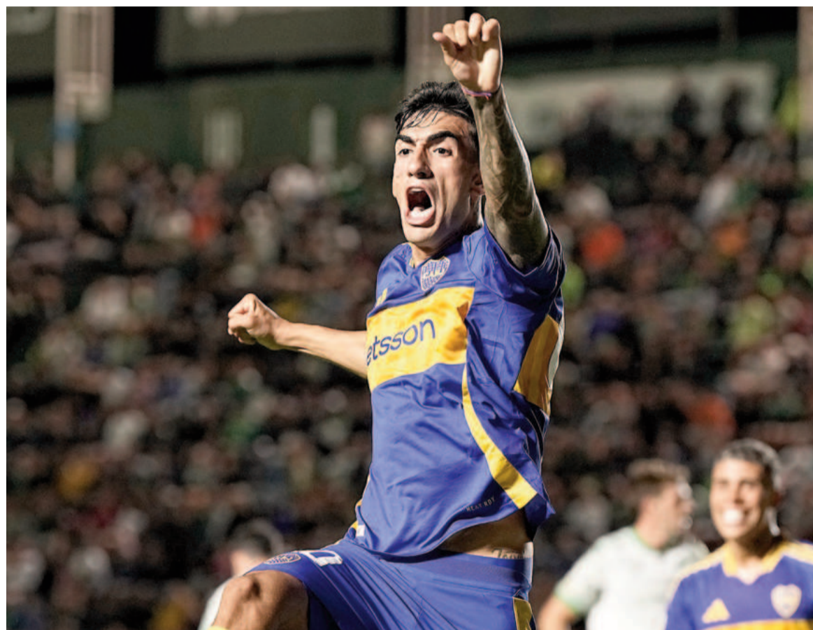
El equipo de Gago ganó con lo justo y subió a la cima.

Antes del debut frente a Alianza Lima, un Xeneize que cuidó algunos titulares sumó su segundo éxito al hilo al derrotar al Taladro por 1 a 0 con gol de Di Lollo y alcanzó a Argentinos y Estudiantes en el liderazgo de zona A.