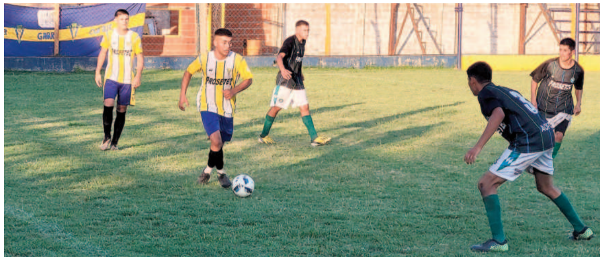
Doce apostará a un triunfo para subir a lo más alto.

El conjunto auriazul se medirá ante Provincial de Pergamino hoy a partir de las 18.00 en el estadio Manuel Santos Podestá buscando un triunfo para desplazarlo del liderazgo de la Zona 8