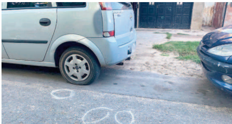
Algunos de los lugares donde impactaron las balas.

El frente de una casa ubicada en Bolivia al 2200, en barrio Belgrano, fue atacada a tiros en la noche de este lunes. Los agresores, aparentemente, abrieron fuego desde un utilitario. La policía incautó en el lugar quince vainas servidas calibre 9 milímetros.