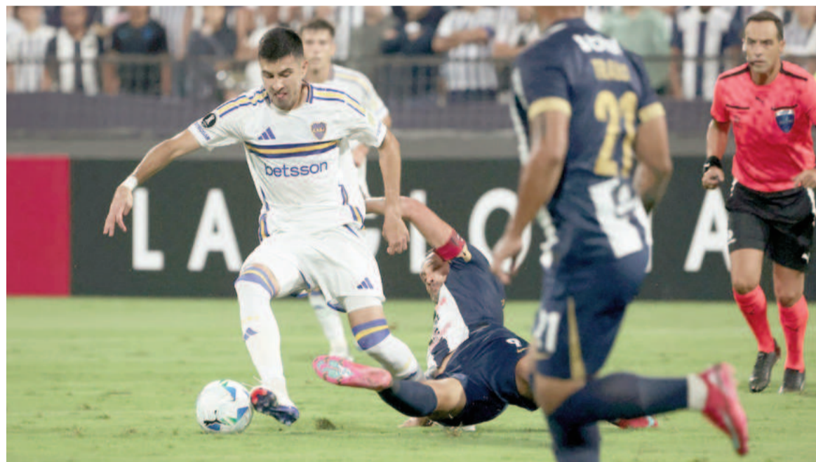
El equipo de la ribera mostró una floja imagen en Perú. WEB

Con un tanto de Ceppellini, el equipo de Gorosito se impuso al Xeneize por 1 a 0 en la ida de la Fase 2 y obligará al equipo de Gago a ganar en La Bombonera para no quedar eliminado.