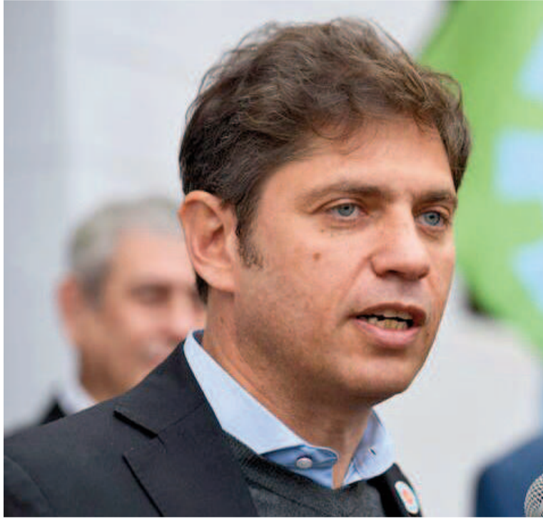
El gobernador Axel Kicillof.

“Había una regla no escrita, pero no por no escrita menos valiosa y justificada, que es que no se puede modificar el modo de votar, el re-