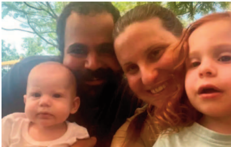
Una familia desmembrada.

Hamás anunció que mañana entregará a Israel cuatro cuerpos sin vida, incluidos los de la familia argentina Bibas, mientras que el sábado liberará a los últimos seis rehenes de la primera fase del alto el fuego en la Franja de Gaza. Así lo confirmó el jefe de su delegación negociadora, Jalil al Haya. Desde la oficina de Netanyahu pidieron cautela hasta que se lleven a cabo los análisis de ADN para comprobar si son ellos.