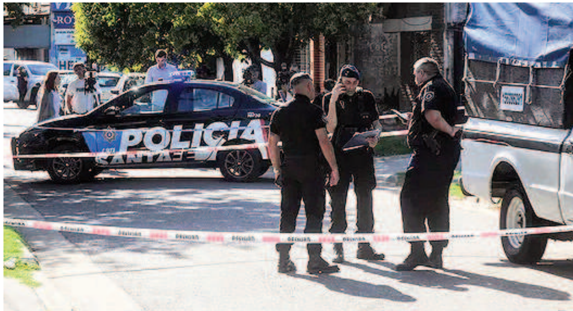
La mujer de 31 años fue baleada cuando salía de su domicilio.

Un hecho violento se registró a la mañana del martes en pasaje Prusia al 6700, inmediaciones de Provincias Unidas y San Lorenzo. Según informó la Unidad Regional II de Rosario, cerca de las 7.30 una comunicación al 911 alertó sobre una mujer tendida en la vía pública