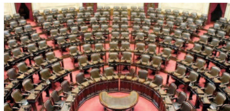
El Senado vuelve a tener actividad mañana.