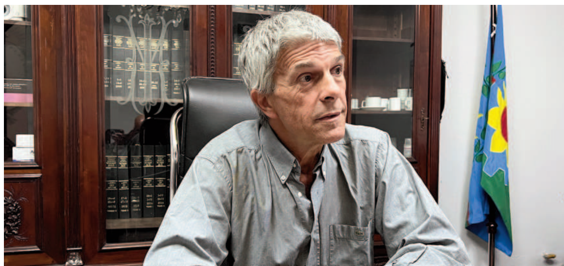
Luchelli dejó entrever que los responsables de dar a difusión recibos de sueldo de miembros del Cuerpo podrán afrontar consecuencias. EL NORTE

“Se han mencionado en la nota presentada por nuestro bloque po-