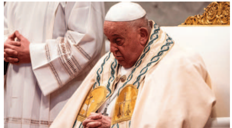
Se confirmó que Francisco padece una neumonía.

eucaristía y, durante el día, ha alternado el descanso con la oración y la lectura de textos", indicó el comunicado. El sumo pontífice "agradece la cercanía que le expresan en este periodo y les pide, con el corazón agradecido, que sigan rezando por él". Pese a los reiterados problemas de salud de los últimos años, entre ellos de cadera, dolores en la rodilla que le obligan a ir en silla de ruedas, operaciones o infecciones respiratorias, el argentino Jorge Bergoglio ha mantenido una cargada agenda y declaró que no tenía intención de bajar el ritmo.