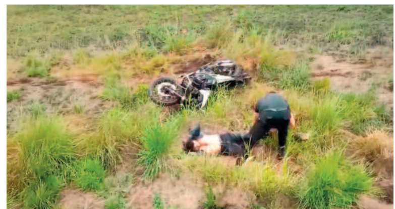
Marcos "Chino" Maidana está fuera de peligro.

Las circunstancias del accidente aún están bajo investigación. Las autoridades ya comenzaron las diligencias necesarias y acudió también personal de la PDI (Policía de Investigaciones) de Las Toscas. La fiscalía correspondiente fue notificada para