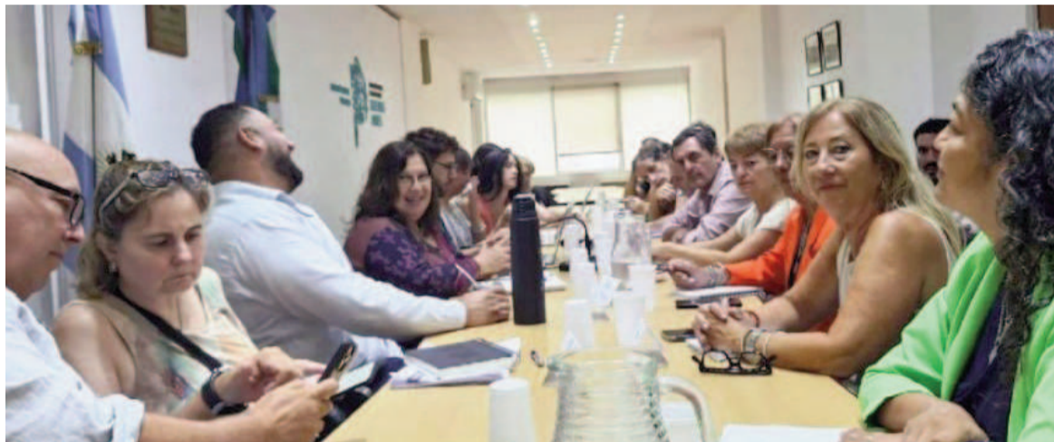
Comenzaron los encuentros paritarios.

El gobierno bonaerense propuso un aumento del 9% en dos tramos para los maestros y profesores. Los gremios debatirán la oferta y responderán mañana miércoles. En el medio habrá otra reunión, para negociar con los empleados de la administración.