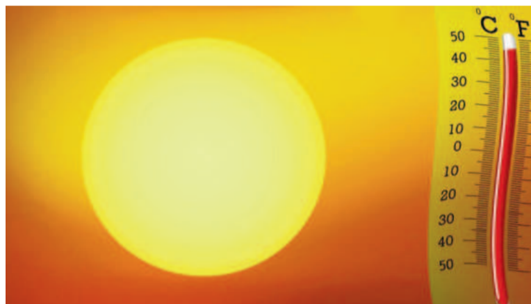
El Servicio Meteorológico Nacional (SMN) prevé una baja de temperaturas.

Algunos gobernadores del interior comenzaron a reclamar a Nación por el inicio de obras que ayudarían, en los próximos años, a aliviar el sistema.