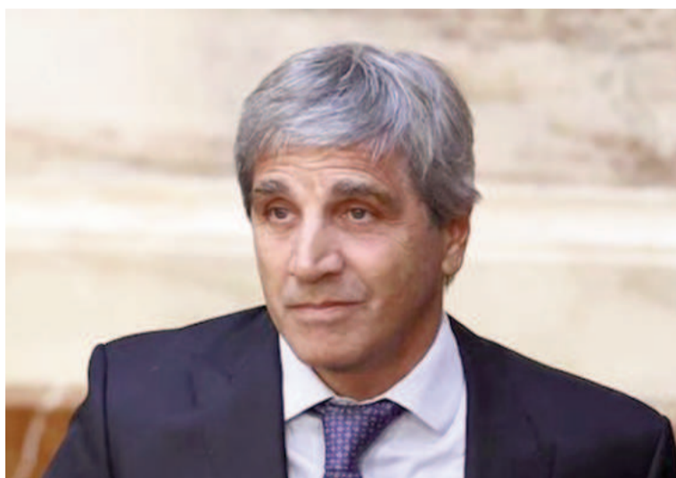
El ministro Luis Caputo.

Asimismo, analizando el resultado financiero, es decir, aquel que incluye el pago de intereses de la deuda pública, se advierte que en 2024 se alcanzó un superávit financiero mayor a $2.700 millones, siendo el primer resul-