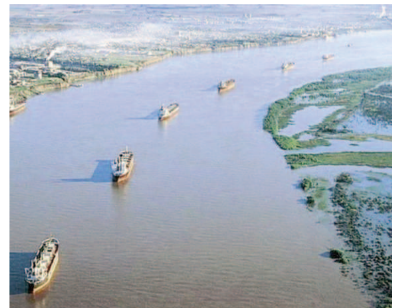
La hidrovía en el centro de la polémica.

Con esta resolución, la ANPYN dejó agotada la vía administrativa, habilitando a Dredging International a recurrir a la Justicia si así lo considera.