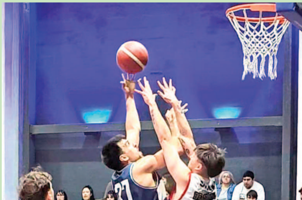
Somisa y Belgrano, los dos representantes que tendrá San Nicolás en la edición 2025 de la Liga Federal.