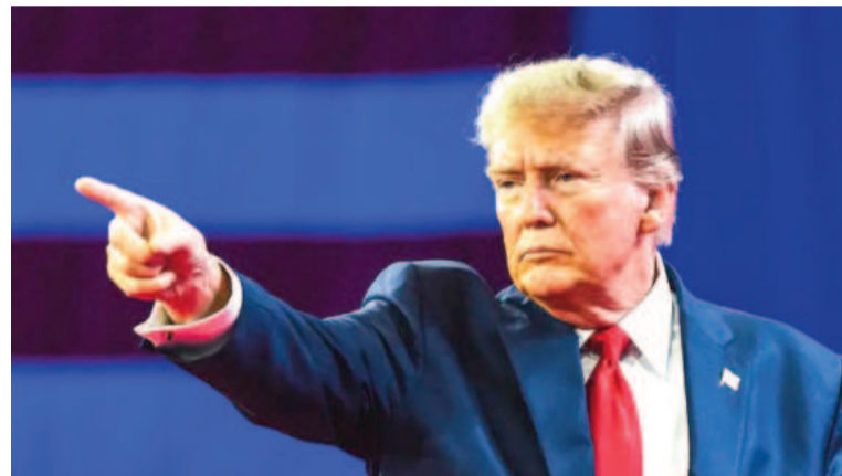
Trump informó nuevos aranceles a ciertas importaciones.

El presidente estadounidense impondrá una tarifa del 25% a todas las importaciones de estos metales, incluyendo a Canadá y México y adelantó más medidas comerciales con aranceles recíprocos.