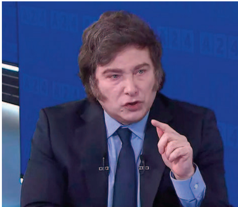
Javier Milei, ayer lunes, en el estudio de A24.

lugar un fenómeno monetario que se genera por la oferta de dinero. El nivel del dólar depende de la escala nominal”, añadió.