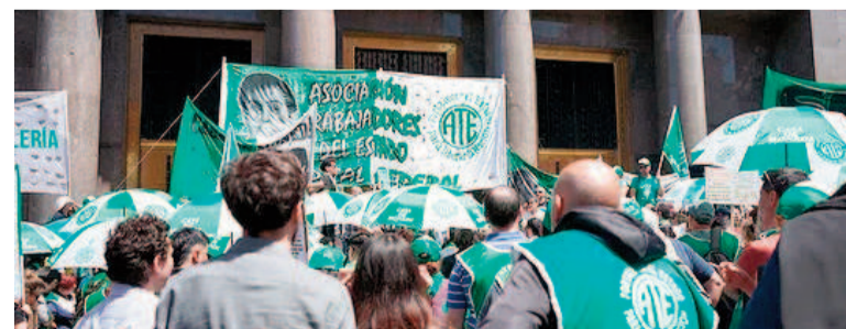
500 trabajadores del Ministerio de Economía a la calle.

A mediados de enero, también se dispuso el pase a disponibilidad de otros 150 empleados estatales del Ministerio de Economía por la disolución