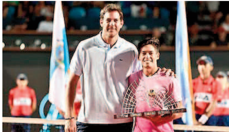
Fiesta argentina completa en Río: Juan Martín del Potro le entregó el trofeo de campeón a su compatriota Báez.