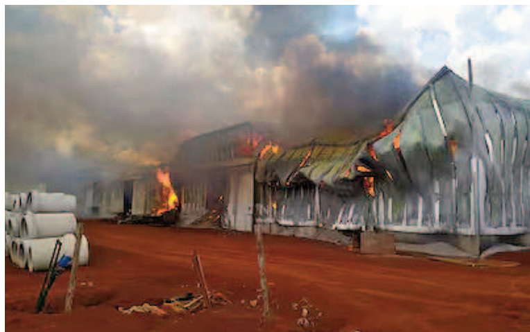
Incendio en una yerbatera.

Trabajadores de la cooperativa Playadito también se sumaron a las