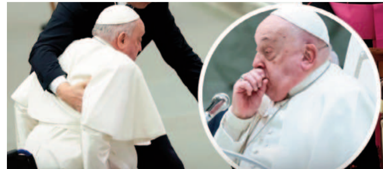
Francisco continúa delicado.

"Que un partido de extrema derecha reciba un resultado así, debe ser algo que no debemos aceptar, yo nunca voy a aceptar algo así".