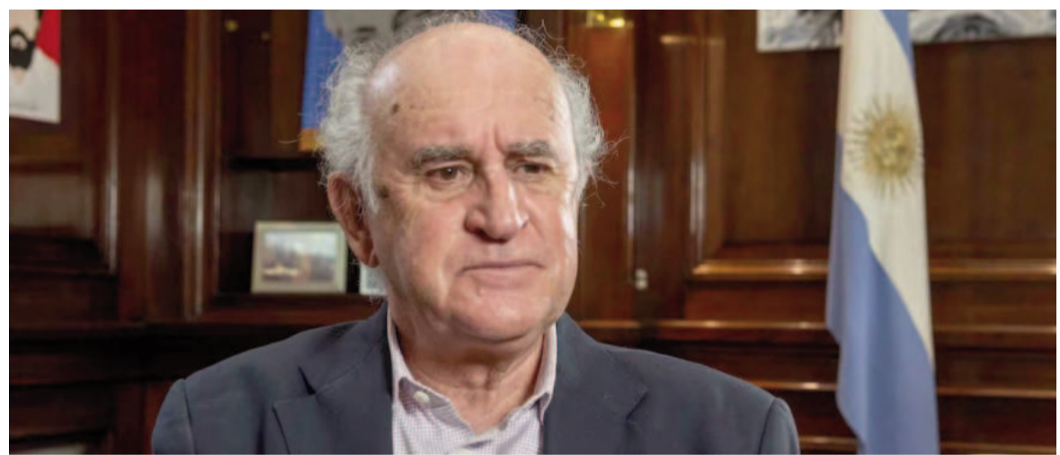
El senador es uno de los referentes del kirchnerismo.

“Hay que unir, y la provincia de Buenos Aires no puede estar ajeno a esto y transformarse en un provincialismo más donde solamente se mire el ombligo a sí mismo como provincia, como es el cordobesismo o pasa con los salteños con Sanz; en Misiones, con Rovira, o en Neuquén y Río Negro, con los movimientos provincialistas”, analizó. Para el ex secretario general de la Presidencia, “tener una mirada netamente provincial frente a lo que está