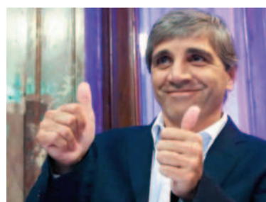
El ministro Luis Caputo.

“El Secretario elogió a Caputo por las medidas de reforma macroeconómica y estructural que reducen la carga de la regulación sobre el sector privado y el tamaño y la influencia del Estado”,