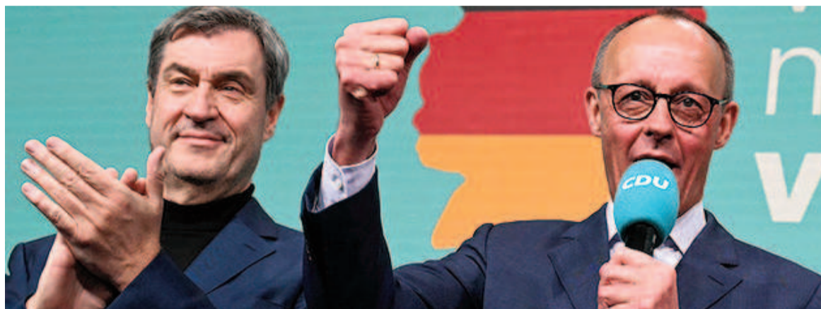
Los conservadores alemanes se alzaron con el triunfo y la extrema derecha se agranda.

El líder del bloque conservador alemán, Friedrich Merz, festejó este domingo la victoria en las elecciones generales y pidió negociaciones rápidas para lograr una coalición de Gobierno en medio de la inestabilidad que atraviesa Europa por las distintas crisis que hay en el mundo.