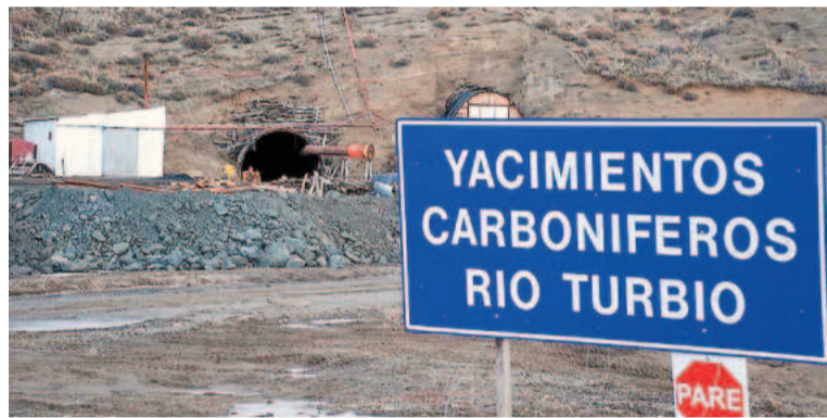
El Gobierno habilitó la transformación del Yacimiento Carbonífero Río Turbio en S.A.

El rechazo a la privatización de Río Turbio fue la primera acción con-