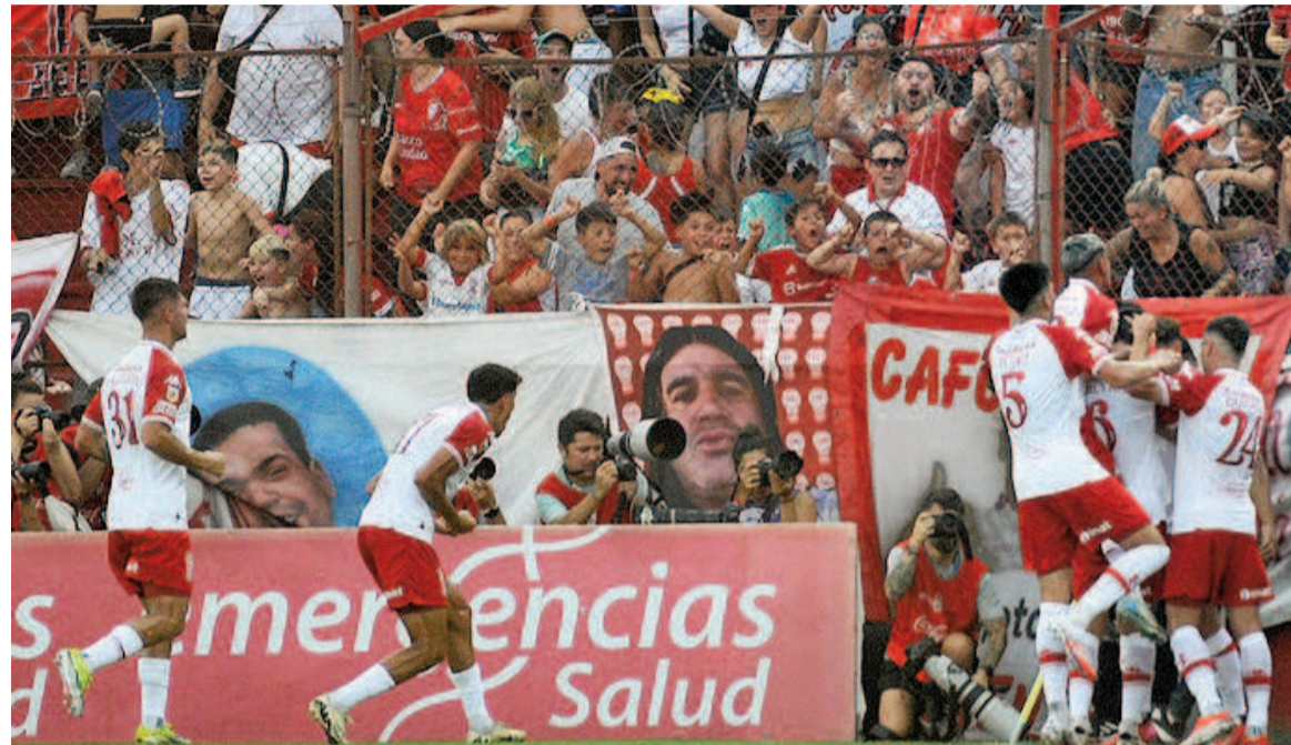
El Globo se hizo fuerte ante el Ciclón.

El equipo de Kudelka demostró superioridad y se impuso por 2 a 0 en el Tomás Adolfo Ducó ante un adversario que llegaba sin derrotas y con un buen presente.