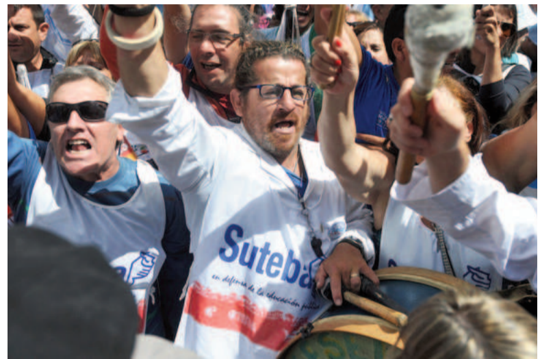
Docentes bonaerenses efectuarán un acto en el Palacio Pizzurno y piden por CTERA.

“Basta de ajuste educativo. Plata para educación pública, salario y trabajo, no para el FMI”, concluyeron.