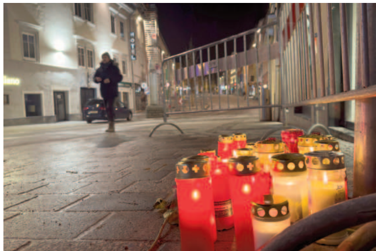
Un adolescente perdió la vida en ataque terrorista.

El sospechoso, que tenía un permiso de residencia válido y carecía de antecedentes penales, habría gritado “¡Allahu Akbar!” (“¡Dios es grande!” en árabe), según testimonios