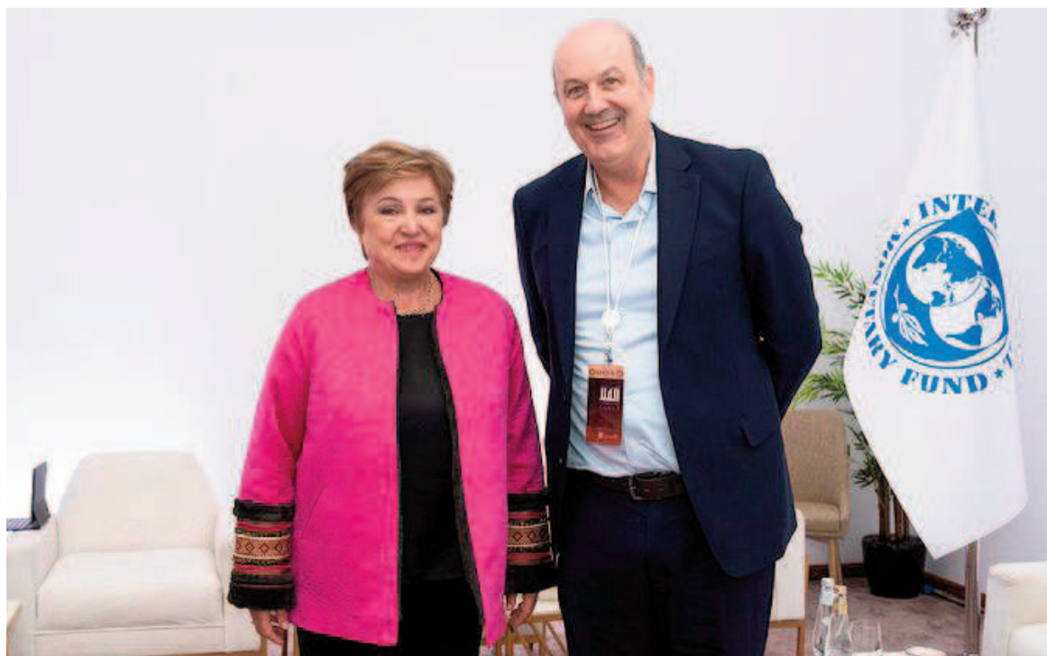
Kristalina Georgieva y Federico Sturzenegger.

El encuentro tuvo lugar en la ciudad de Al-Ula, en Arabia Saudita, que entre este domingo y lunes será la sede del primer evento global del nuevo comité anunciado hace algunas semanas por el FMI, que llevará como nombre "Al-Ula Conference for Emerging Markets Economies" (Conferencia para economías de mercados emergentes). En ese marco, mantuvo una reunión con la directora del Fondo, Kristalina Georgieva, que posteo en su cuenta de la red social X (ex Twitter) unas palabras de elogio al funcionario argentino con una fotografía en la que posan juntos.