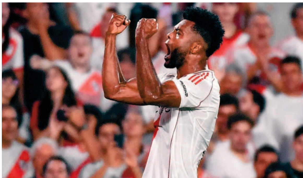
El Millonario ganó en el Monumental y estiró su invicto. NA

El colombiano fue autor del gol del triunfo del equipo de Gallardo sobre Lanús por 1 a 0. Además, el delantero desvió un penal. Con esta victoria el Millonario se ubica en el segundo puesto de la Zona B.