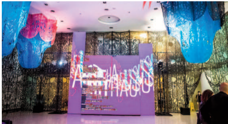
El plazo de inscripción del Premio Arthaus Artes Visuales 2025 finaliza el 10 de marzo de 2025.

El certamen ofrece un primer premio de $2.500.000 (dos millones quinientos mil pesos argentinos) y dos segundos premios de $1.500.000 (un millón quinientos mil pesos argentinos) cada uno. Estos premios no serán de adquisición, lo que significa que las obras premiadas seguirán siendo propiedad de los artistas, y el dinero otorgado deberá destinarse exclusivamente