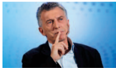
Macri, el líder del PRO.

"El Gobierno anunció una investigación profunda, lo cual es un paso necesario, pero esperamos que este proceso sea riguroso y transparente, que responda todas las preguntas que hoy se hacen los argentinos y que se asuman las responsabilidades