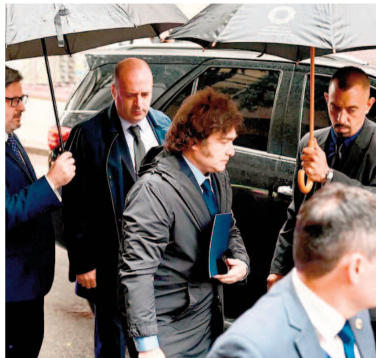
Diputados santafecinos buscan promover el juicio político contra Milei.

Un posteo del presidente Javier Milei (La Libertad Avanza) en su cuenta de X provocó un revuelo que