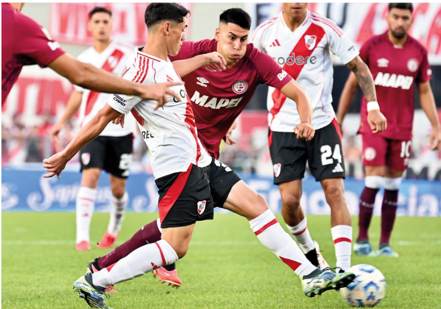
RIVER SUPERÓ A LANÚS EN EL MONUMENTAL Y SE PRENDIÓ EN SU GRUPO

La Cámara de Comercio Automotor registró en enero 2025 un crecimiento del 46,4% en comparación con el mismo mes del año pasado. Ese porcentual se replica en San Nicolás. En las agencias consultadas por EL NORTE coinciden en que los modelos más vendidos son del 2020 en adelante. "La gente prefiere invertir en un auto lo más nuevo posible, todos de 20 millones en adelante", manifestó uno de los responsables. Local 3