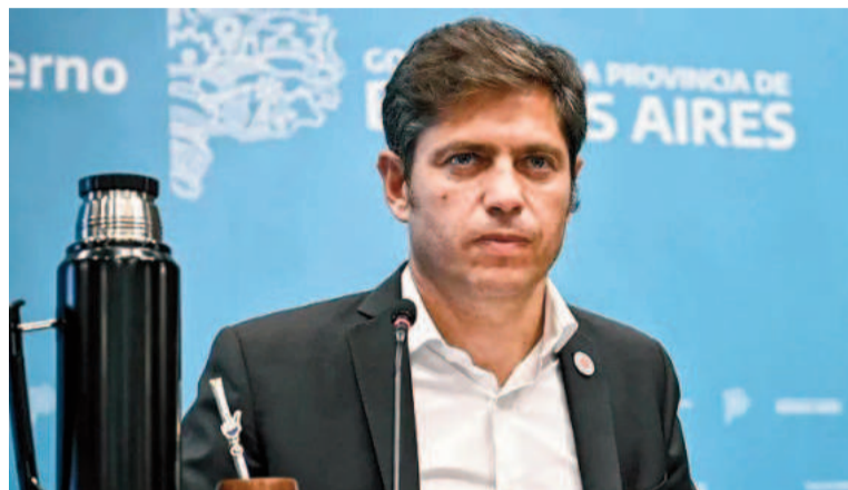
El gobernador de la provincia de Buenos Aires, Axel Kicillof.

De acuerdo con el Gobernador, “para sostener un dólar artificialmente barato, hace falta que el Estado ofrezca dólares en abundancia a un precio falso”. Explica que durante la Con-