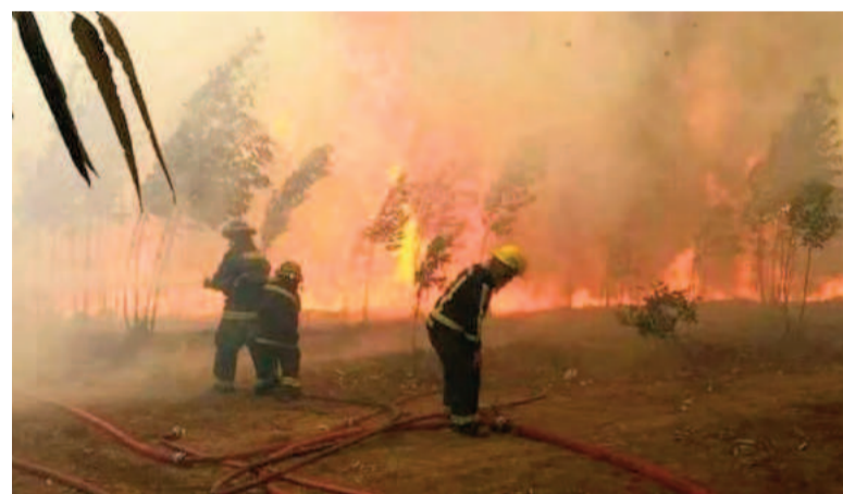
Las llamas ya han consumido 15.000 hectáreas en el Parque Nacional Lanín.

Por otra parte, el Servicio Meteorológico Nacional ha emitido una alerta amarilla por fuertes vientos para hoy lunes en Neuquén y Río Negro, con ráfagas que podrían superar los 95 kilómetros por hora. Ese fenómeno meteorológico representa un doble desafío: acelera el avance del fuego y, al mismo tiempo, impide el uso de aeronaves hidrantes y helicópteros debido a la reducida visibilidad y la turbulencia generada por el humo.