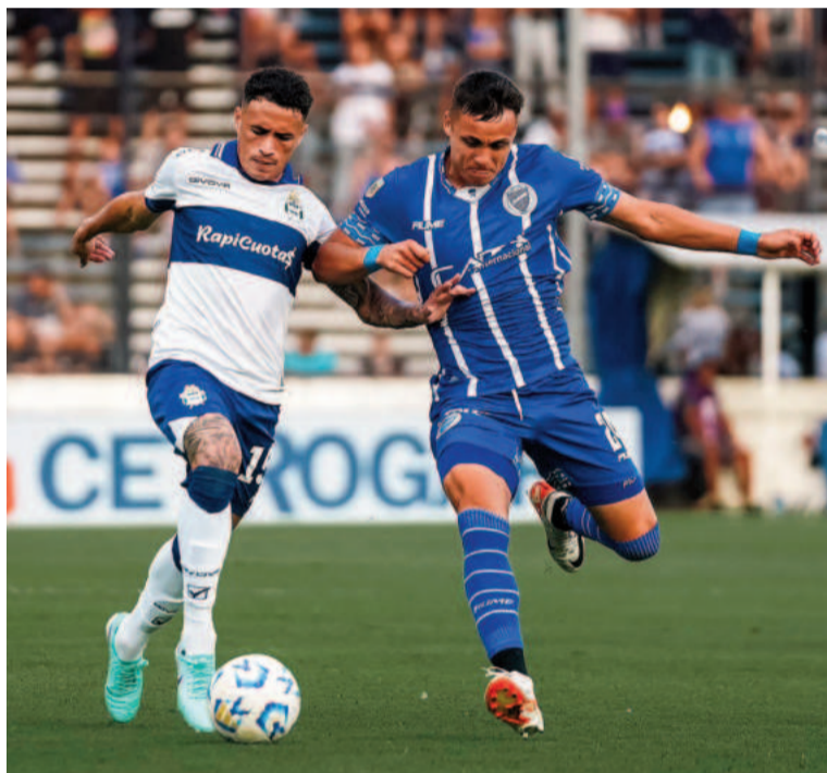
El Lobo logró su primera victoria en el certamen.