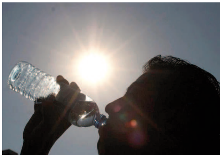
Autoridades sanitarias brindan recomendaciones para afrontar el calor extremo, y prevenir complicaciones de salud.

En el caso de los más chicos y adultos mayores, los especialistas recuerdan que hay que ofrecerles continuamente líquidos, como jugos naturales, agua potable, y en caso de lactancia, amamantar con