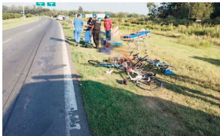
Los cuatro ciclistas se dirigían a Roldán cuando fueron embestidos por la tráfico.

Tras el impacto, personal de emergencia acudió rápidamente al lugar