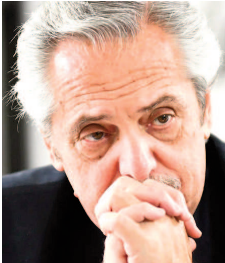
El ex presidente Alberto Fernández.