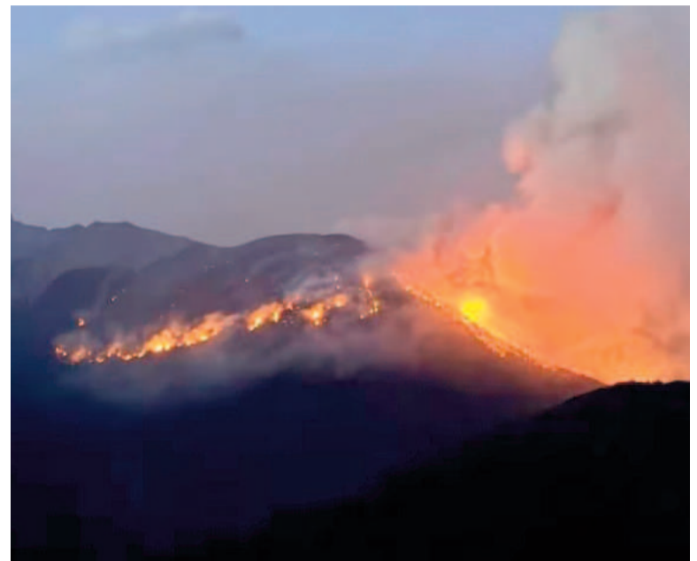
Cientos de hectáreas se están incendiando en diferentes regiones del país.

A través de un comunicado de Guillermo Francos, la administración libertaria afirmó que la mayoría de los incendios «se producen por acción intencional».