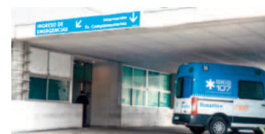
El paciente se encuentra internado en el Heca.

El hombre señaló ante la Policía que el fuerte golpe lo había sufrido por ac-