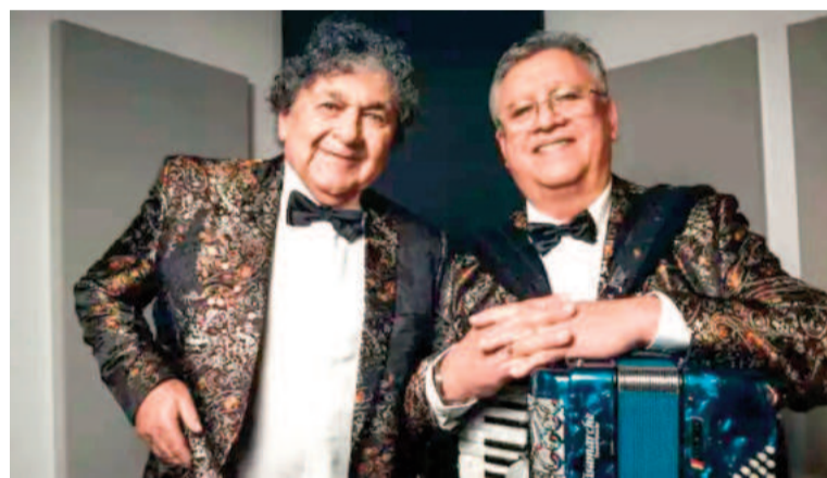
Quedó sellada la continuidad de Los Palmeras.

El acordeonista también dijo que su visita a la casa de Deicas fue un paso clave para limar cualquier tipo de asperezas entre las partes. "Pedí perdón por si en algo