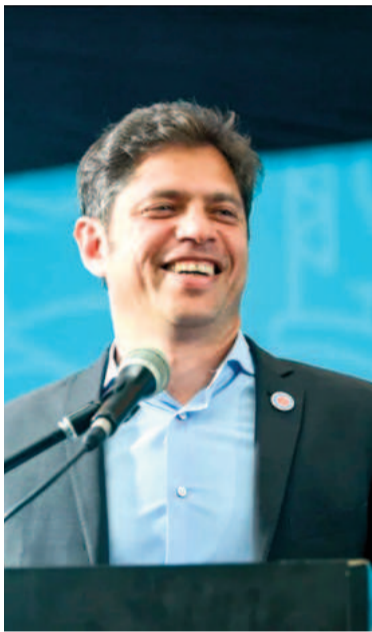
El gobernador bonaerense estaría en la Feliz.

La presencia de Axel Kicillof en la ciudad balnearia aún está en duda, pero los sectores que militan al gobernador dan por hecho su presencia y aguardan novedades por el desdoblamiento electoral.