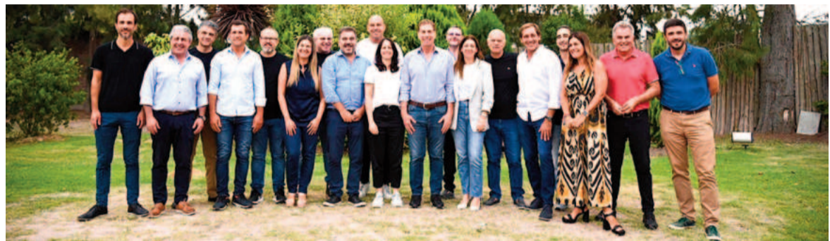
El PRO bonaerense analiza el presente del espacio.

Con el escenario electoral en constante movimiento, el PRO bonaerense se alista para una cumbre clave que definirá su estrategia en la provincia de Buenos Aires. El encuentro, previsto para el 17 de febrero en la sede nacional del PRO en San Telmo, reunirá a los principales referentes del partido con la intención de consolidar su armado territorial y discutir la viabilidad de una alianza con La Libertad Avanza.