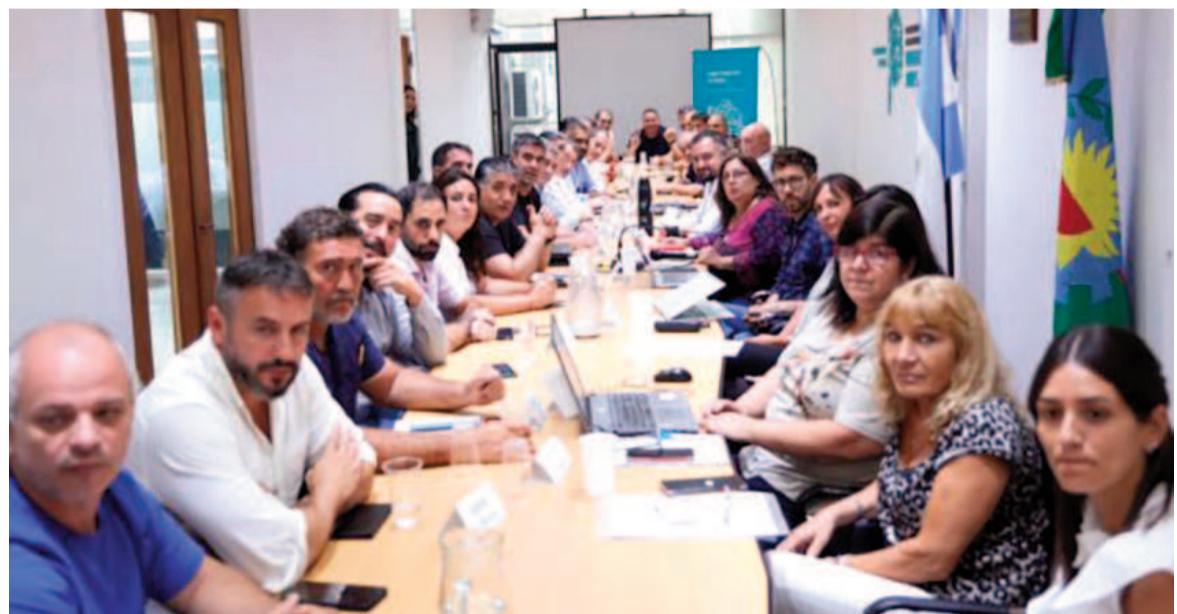
La negociación paritaria concluyó sin una oferta de incremento salarial concreta, pero con la posibilidad de un incremento que se pague en febrero y marzo.

Por su parte, desde el Frente de Unidad Docente Bonaerense (FUDB) reclamaron que "en la conformación de la propuesta la base de cálculo