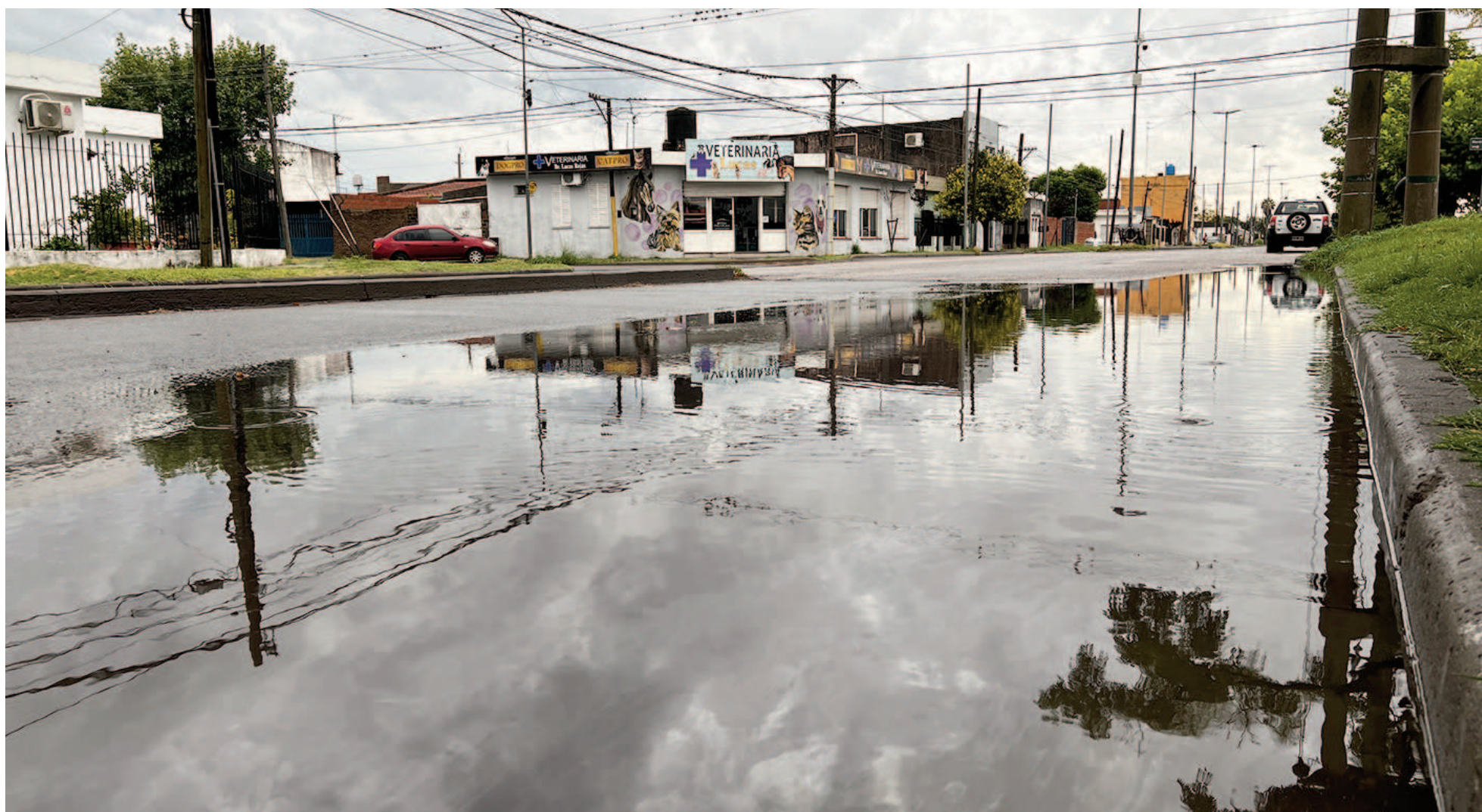
Mientras que en todo el mes de enero llovieron 24,6 mm en San Nicolás, las precipitaciones de una parte del lunes y otra de ayer llegaron a los 100,9 mm. EL NORTE