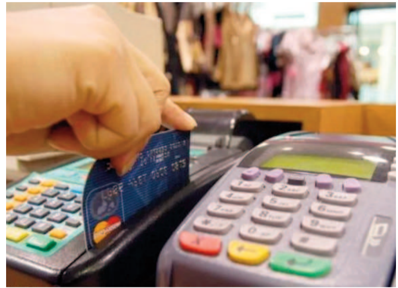
Esta nueva modalidad estará disponible para los comercios que deseen aceptarla a partir del 1 de abril.

El Banco Central también estableció que las reversiones y contracargos solo serán aplicables a la primera cuota. Asimismo, los resúmenes de cuenta deberán identificar estos débitos con la etiqueta "DEBIN programado", incluyendo el nombre del ordenante, el monto y el número de cuota correspondiente. Esta medida tiene como finalidad agilizar las transacciones en dólares mediante débito, ofreciendo una opción alternativa a otros métodos de pago.