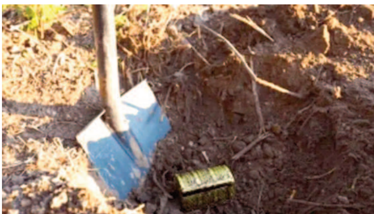
Le robaron las joyas de la abuela.

Quienes cometieron el robo solo cavaron en el lugar donde estaba escondido el balde en el cantero. No ingresaron a la vivienda.