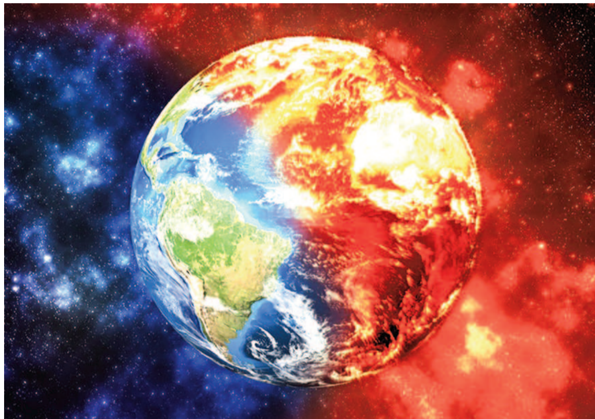
Las actividades humanas como la quema de combustibles fósiles, la tala de bosques y la cría de ganado han contribuido al aumento de los gases de efecto invernadero. ILUSTRACIÓN

El calor extremo puede superar la capacidad del cuerpo humano para re-