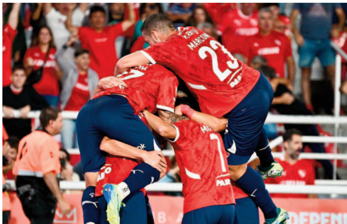
El Rojo fue contundente y recuperó el liderazgo.