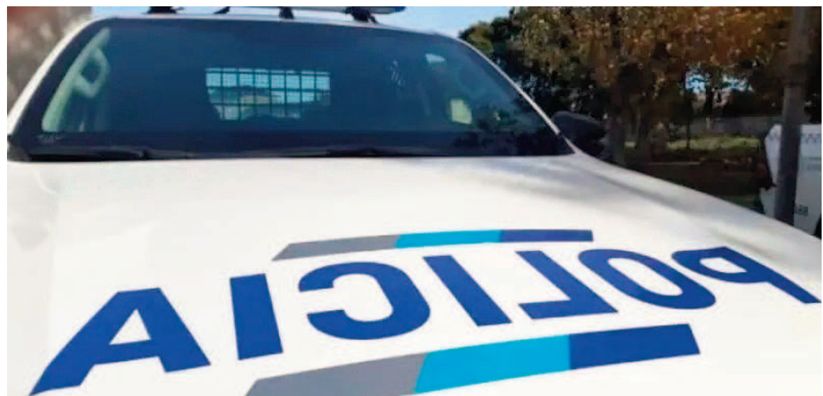
La policía tiene identificado al agresor.

Un grave episodio de violencia tuvo lugar el martes por la tarde en el barrio Otero, cuando un joven de 21 años fue baleado en la pierna derecha en el marco de una discusión por una motocicleta. El hecho ocurrió alrededor de las 18:05 en una vivienda ubicada en la cuadra del 1500 de la calle 123.