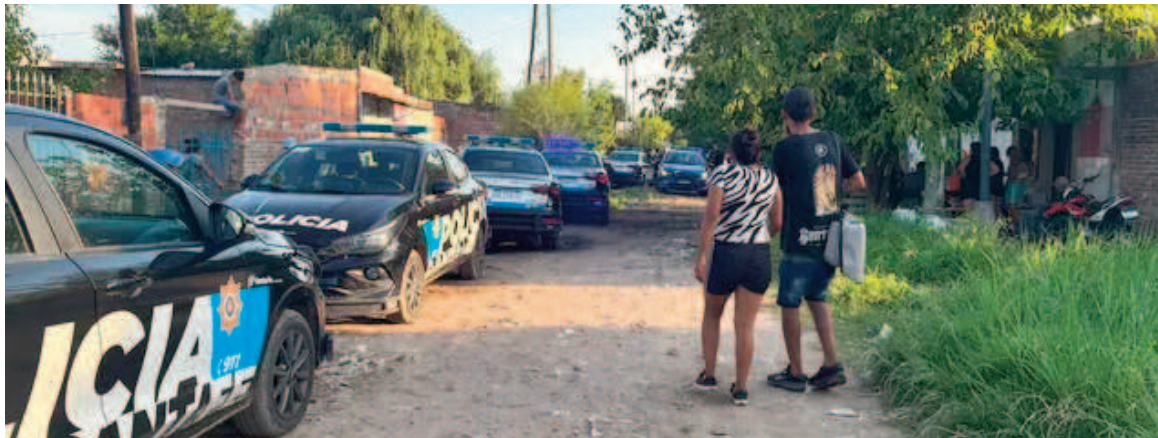
El doble crimen en Santa Fe sucedió el martes en barrio Barranquitas.

perseguida por los asesinos y rematadas frente a una vivienda ubicada en Lamadrid al 3900.