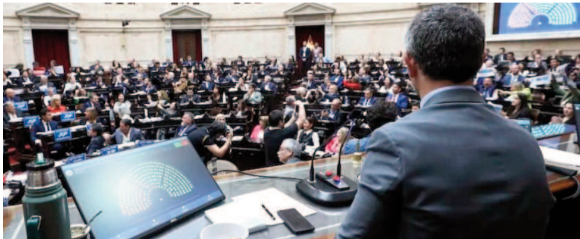
Los diputados aprobaron la Ficha Limpia y ahora pasa al Senado.

Desde LLA, el PRO, la UCR y otros bloques dialoguistas contestaron que la historia de la Ficha Limpia no es de ahora sino que se remonta casi una década atrás, cuando en 2016 se presentó el primer proyecto de ley, y la ex presidenta no había sido siquiera procesada por la Justicia.