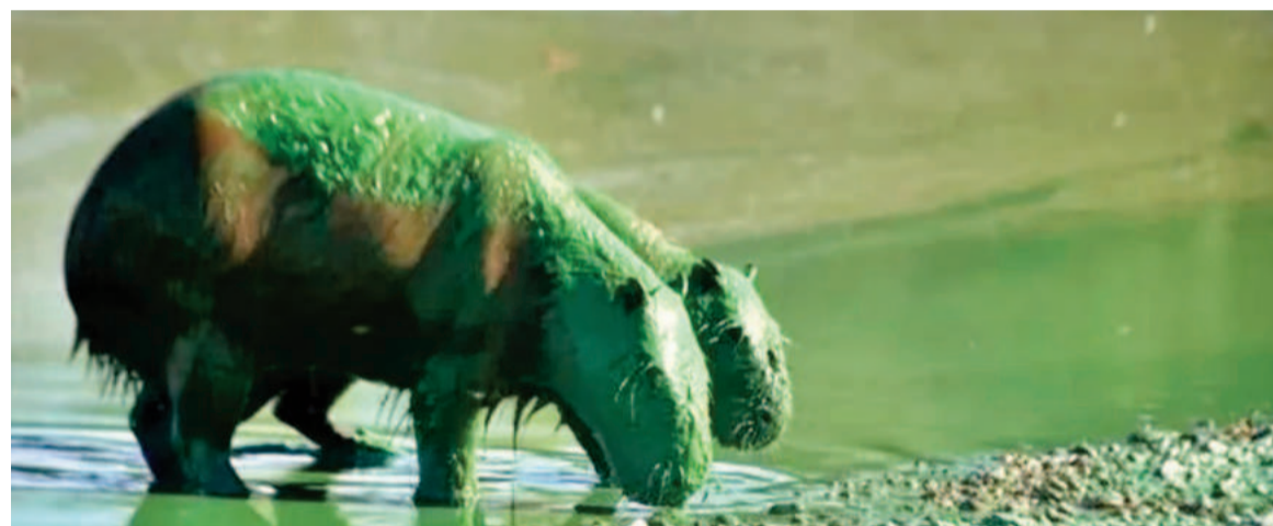
Las cianobacterias provocan el color verde y contaminan el afluente.

Estos animales aparecieron recubiertos por esa tonalidad derivada del verdín en el embalse del Lago Salto Grande de la ciudad de Concordia. El fenómeno natural es producido por una bacteria. Qué precauciones tomar?