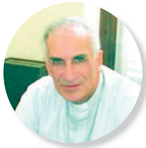
Por el Monseñor Norberto Hugo Santiago Obispo de la diócesis de San Nicolás

1959 - El líder de la Revolución Cubana, Fidel Castro Ruz, toma posesión como primer ministro de Cuba en el palacio presidencial en La Habana, a la que había llegado con tropas guerrilleras luego de derrocar al dictador Fulgencio Batista.