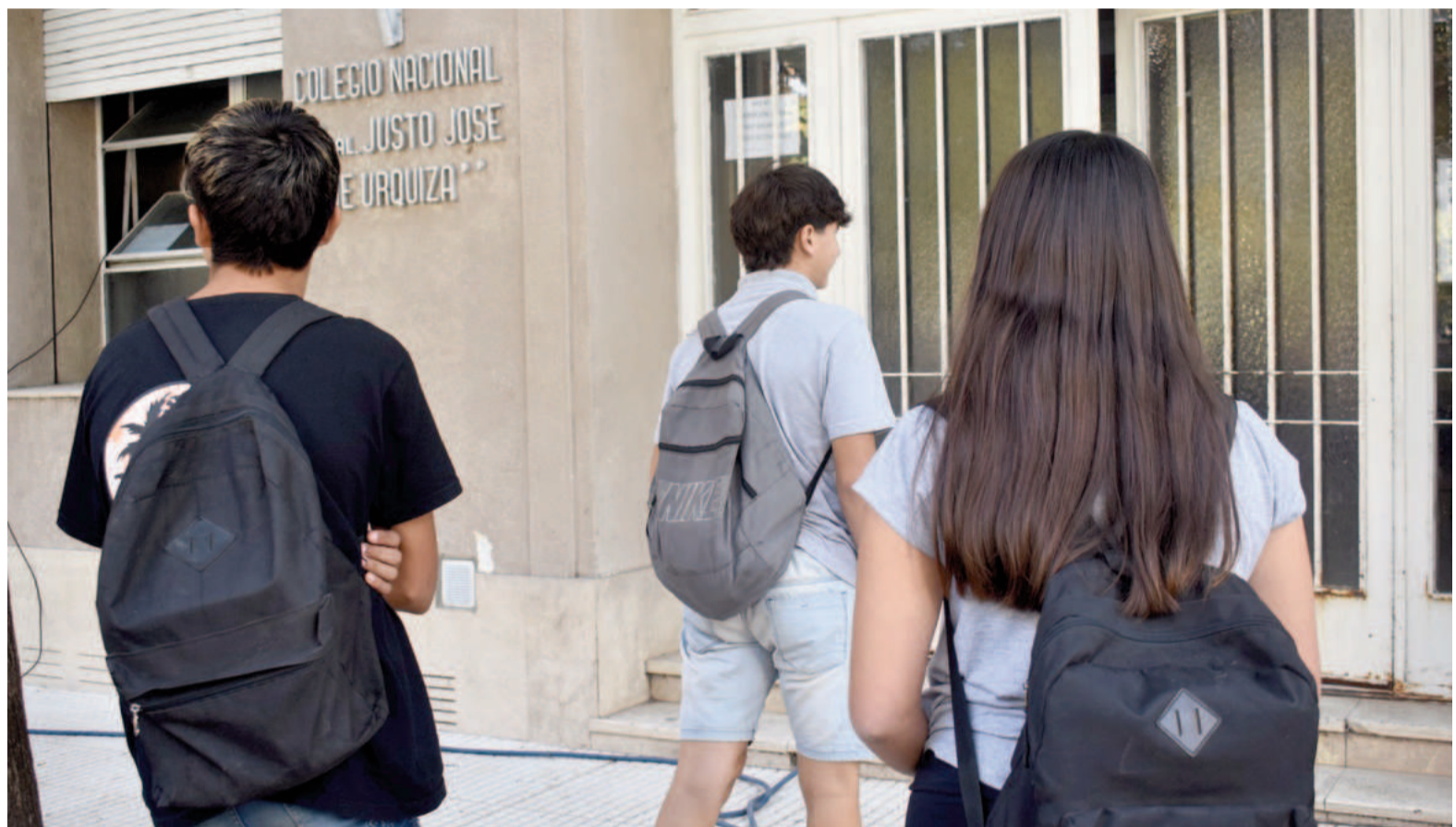
En las próximas semanas se evaluará el impacto real de este nuevo modelo en las escuelas secundarias. FOTO ILUSTRATIVA

En este contexto, desde el viernes, las escuelas secundarias estatales de la provincia de Buenos Aires implementaron un innovador sistema de intensificación de materias, destinado a reforzar las trayectorias educativas y eliminar la repitencia completa. Los Módulos Presenciales de Fortalecimiento