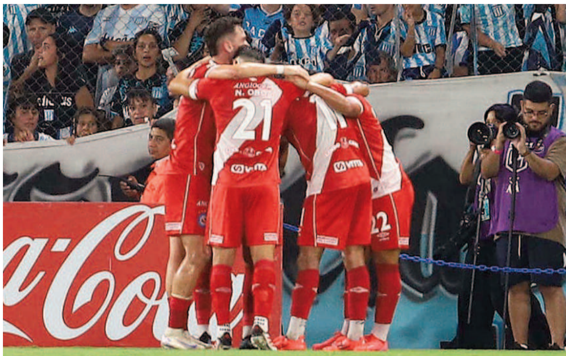
El equipo de La Paternal lo definió en menos de 50 minutos. NA

El bicho superó a la Academia por 3 a 2 en el Cilindro de Avellaneda y quedó como único líder de la zona A. El equipo dirigido por Diez fue contundente y la reacción final del local no alcanzó.