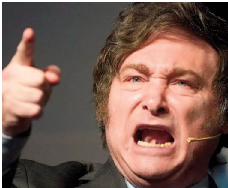
Milei no quiere saber nada con las PASO.

El sistema de las PASO fue implementado en 2009, tras una derrota del Frente para la Victoria en las legislativas bonaerenses. Para Milei, esta estrategia fue una herramienta de la «casta política» que refleja el estilo calculador de los gobiernos kirchneristas. En su entorno, el presidente no duda en criticar con dureza tanto a Néstor como a