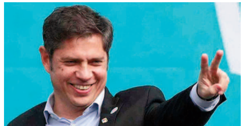
El gobernador Axel Kicillof.