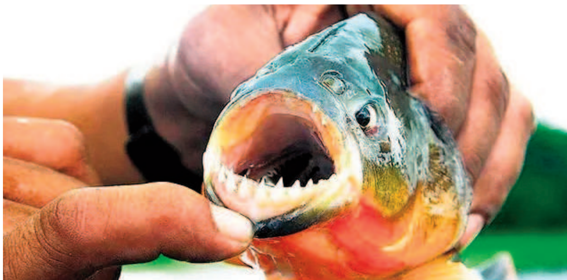
Una mujer fue atacada por una palometa en el río Paraná frente a Granadero Baigorria.

«Nos tiramos un par de veces al agua sin ningún problema. Después me quedé sentada en el bote, con los pies en el agua, mientras tomaba mate. Sentí una mordida en el dedo gordo del pie derecho. Me encontré con que me faltaba