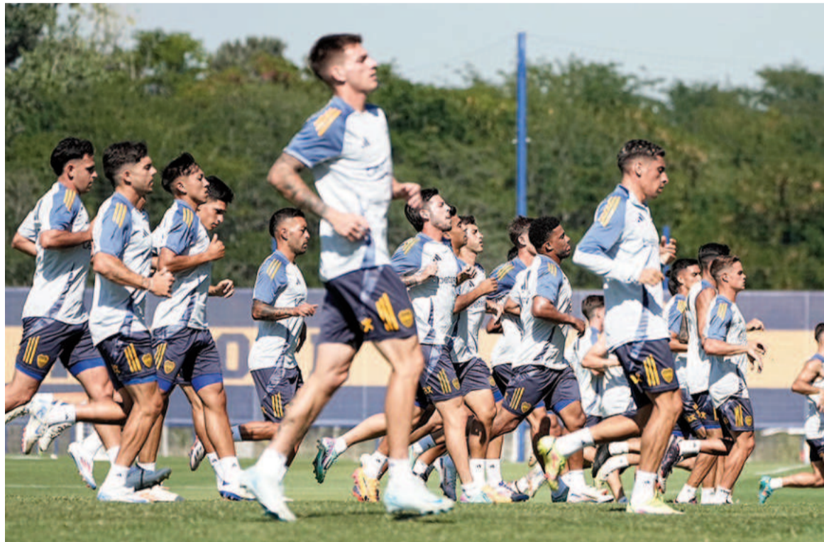
El Xeneize entrenó ayer en Ezeiza y hoy repetirá antes de viajar a nuestra ciudad.