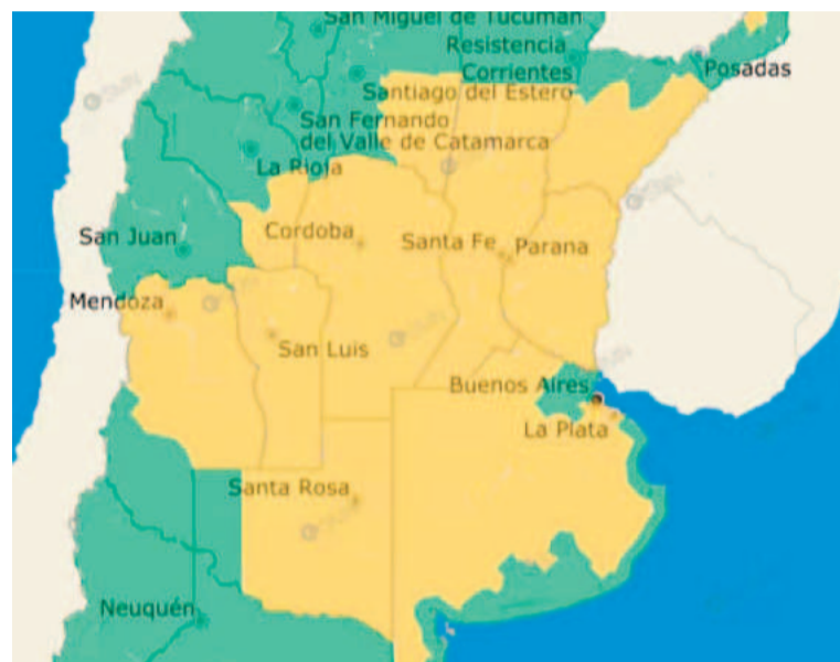
Ayer empezó una semana de altas temperaturas en el país.

leve a moderado en la salud, de acuerdo al sistema del SMN. Implica que las temperaturas pueden ser peligrosas, sobre todo para los grupos de riesgo, como niños y niñas, personas mayores de 65 años, con enfermedades crónicas.