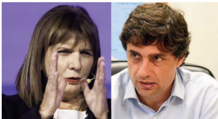
Bullrich – Lacunza.

eligió su cuenta en la red social X para responderle en un extenso posteo en el que incluso colocó fotos de notas periodísticas que reflejaron los dichos de la titular de Seguridad. El ahora vicepresidente primero de Racing Club de Avellaneda le remarca que obvió una parte de sus declaraciones cuando hizo referencia a la “intolerancia a la