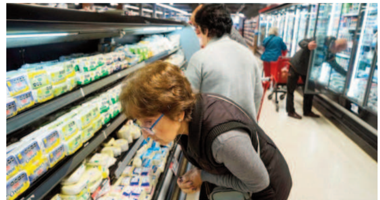
Hoy se conocerá la inflación de diciembre.

Al tomar como referencia dicha medición, se observa una fuerte reducción en la proyección trazada a finales del 2023 para el año pasado, ya que la estimación daba una inflación del 213,0% interanual, 95 puntos porcentuales menos que la prevista en el último reporte. A modo de anticipo, la inflación de la Ciudad de Buenos Aires en el mes pasado alcanzó el 3,3%, una décima más que en noviembre, cuando había igualado la medición de octubre, generando el freno del proceso de desinflación. Con la leve aceleración, la variación de precios en el territorio