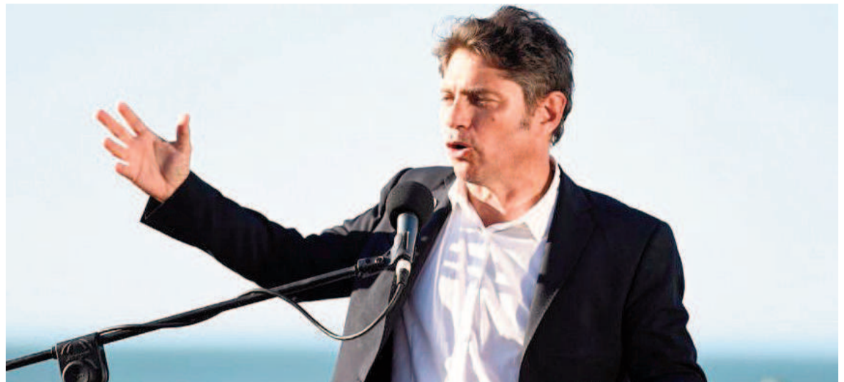
Kicillof criticó al presidente de la Nación.

“Le queremos decir al presidente de la nación que su obligación es fomentar el turismo en la Argentina. Lo