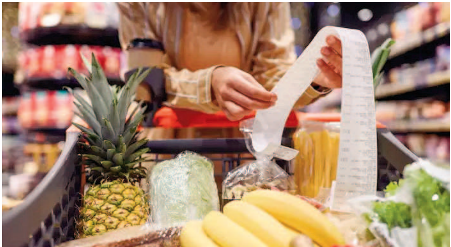
El promedio de inflación esperada cayó.

El descenso de las expectativas inflacionarias se observa en todas las regiones del país, con el interior registrando las previsiones más bajas. En detalle, el interior proyecta una inflación anual del 38,8%, mientras que en el Gran Buenos Aires la cifra asciende a 44,5% y en la Ciudad de Buenos Aires alcanza el 47,6%. Todos estos valores reflejan una disminución respecto a diciembre, cuando