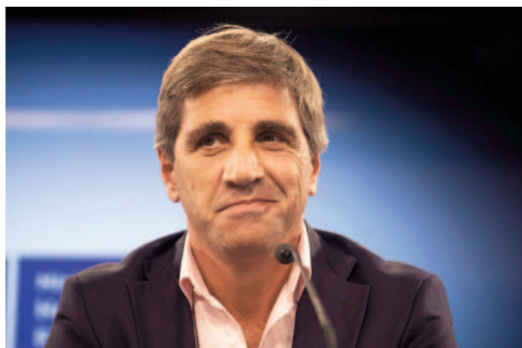
Caputo apuntó contra los dichos de la exfuncionaria, quien sostuvo que Milei «ataca a mujeres y homosexuales».

íses que están fracasando es el virus mental de esa ideología. Esta es la gran epidemia que debe ser curada, es el cáncer que hay que extirpar. Colonizó las instituciones más importantes del mundo», sostuvo. Además, agregó que el «wokismo» fue el que «marcó el pulso de la conversación global de las últimas décadas» y que, hasta que no se supere dicha ideología, no se podrá «avanzar en dirección al progreso». A ello siguieron declaraciones todavía más polémicas. Opinó que el «wokismo» es «un régimen de pensamiento único, sostenido por distintas instituciones cuyo propósito es penalizar el disenso». «Feminismo, diversidad, inclusión, equidad, inmigración, aborto, ecologismo, ideología de género, entre otros, son cabezas de una misma