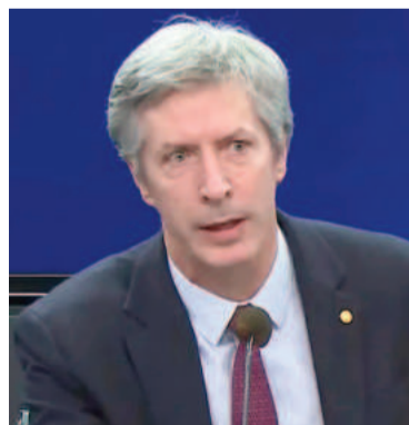
Santiago Bausili, el presidente del Banco Central.

Una tasa más baja era leída por el mercado como el paso siguiente de la política monetaria del BCRA de la mano de un tipo de cambio oficial con una devaluación más lenta. El dato de inflación de diciembre - 2,7% - fue algo más alto que el 2,4% de noviembre y que incluso el 2,5% que estableció como criterio el Poder Ejecutivo antes de reajustar el esquema cambiario, que en el caso del