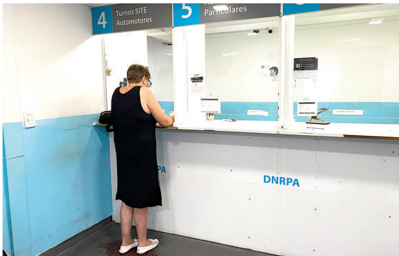
El Gobierno explicó que se trata de "los Registros Seccionales que no estén a cargo de un encargado titular, sino que se encuentren intervenidos". EL NORTE

De los 155 registros alcanzados por la resolución, 71 están en la provincia de Buenos Aires. La mayoría es del conurbano, pero también hay otros del interior bonaerense, además de San Nicolás: tres de la localidad de América en el partido de Rivadavia, cuatro de Bahía Blanca, tres de Bragado, tres de Brandsen, dos de Guaminí, dos de Luján, uno de