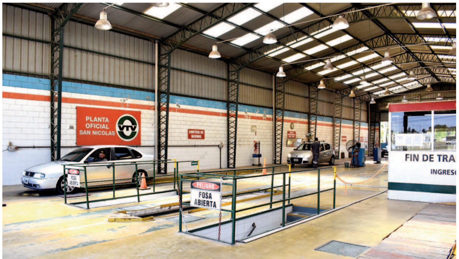
La VTV es obligatoria para los vehículos con más de dos años de antigüedad, o que hayan superado los 60.000 kilómetros recorridos.

La VTV es un requisito obligatorio para todos los vehículos con más de dos años de antigüedad o que hayan superado los 60.000