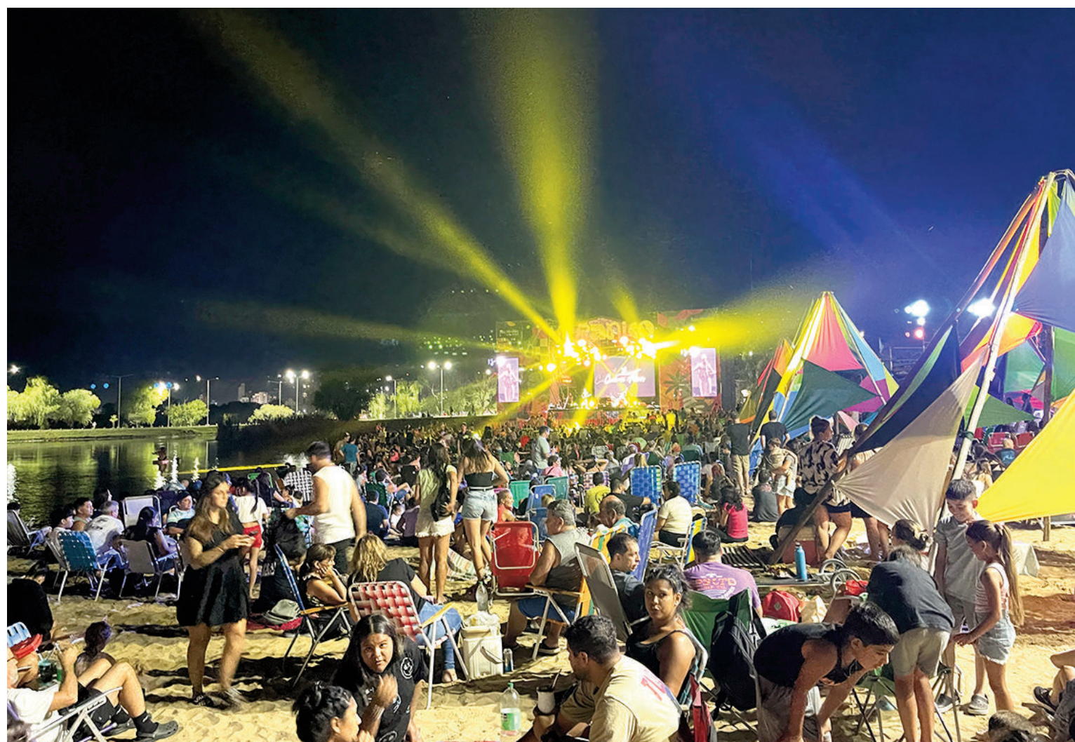
DEBUTÓ «VERANICO» EN LA LAGUNA DESCUBRÍ, EL NUEVO EVENTO DE VERANO

El Ministerio de Justicia de la Nación publicó en el Boletín Oficial la resolución que formaliza el reciente anuncio referido al cierre de 155 Registros del Automotor en todo el país. En un anexo se detallaron una por una las dependencias alcanzadas por la medida. Y aunque en un primer momento se creía que no habría cambios en nuestra ciudad, la lista finalmente incluyó al Registro N° 1 que funciona en Sarmiento 173, donde también quedará desarticulada la registración de motovehículos. Local 3