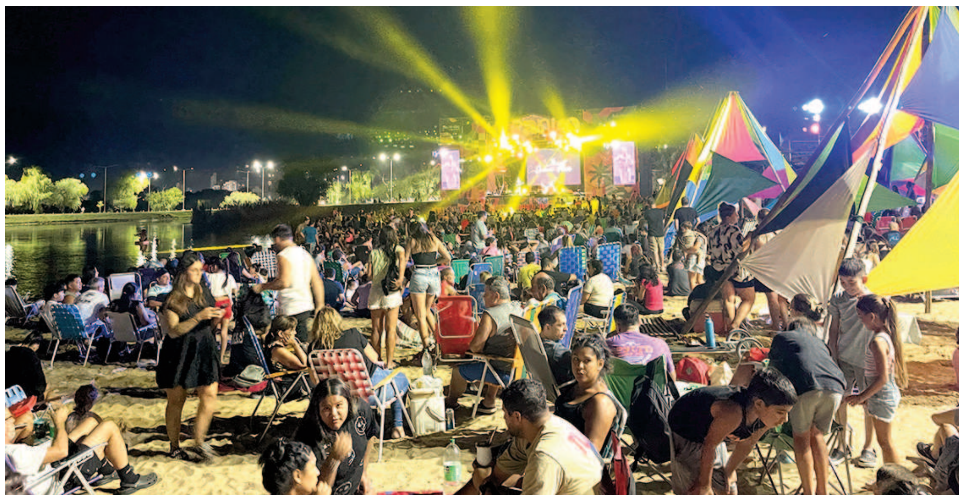
Comenzó “Veranico” en la Laguna Descubrí, un ciclo de verano con actividades nocturnas al aire libre, música y gastronomía.

Con una gran convocatoria, este jueves se inició el nuevo ciclo de verano propuesto por la Municipalidad de San Nicolás, que se extenderá durante cuatro fines de semana, de jueves a domingo, con música en vivo y gastronomía a cielo abierto en la Laguna Descubrí. La apertura estuvo a cargo de Cuervo Hermanos y Undercover en este fin de semana de “Cumbión”, que se completará con las propuestas de hoy, mañana y el domingo.