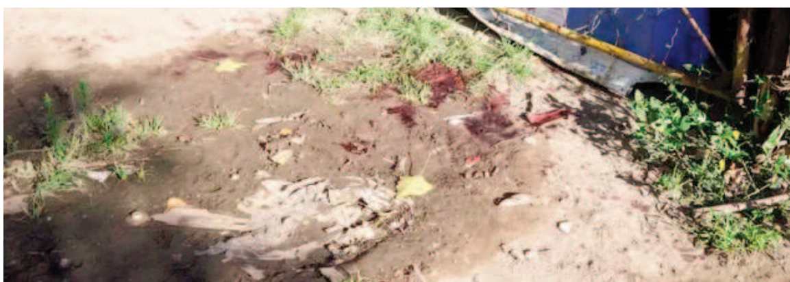
En el pasillo quedaron rastros de sangre luego del ataque.

Fuentes de las fuerzas de seguridad provinciales recogieron algunos testimonios sobre la huida de otro sujeto tras el ataque. Las declaraciones se suman al secuestro de material balístico como las primeras pistas para reconstruir el homicidio en el