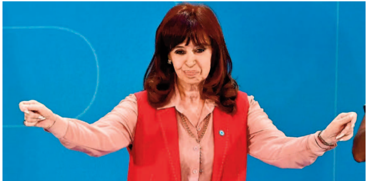
CFK criticó a Milei por calificar a la ideología woke como «la epidemia que hay que curar».

Además, aconsejó al presidente: «Aflojá un poco que vas a necesitar resto para cuando se te acabe la nafta del dólar planchado, el carry trade, el ajuste eterno y la caída del consumo; y, finalmente, los argentinos se den cuenta que el sacrificio que hacen sólo sirve para enriquecer a unos pocos y empobrecer a las grandes mayorías. Porque no tengas dudas que eso, más temprano que tarde,