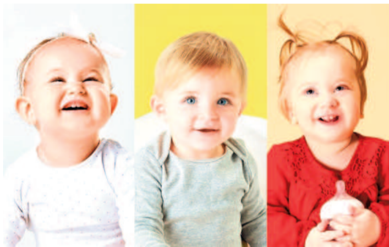
La generación Beta incluirá a los nacidos entre 2025 y 2039.

Los investigadores afirmaron que probablemente serán la primera generación en experimentar el