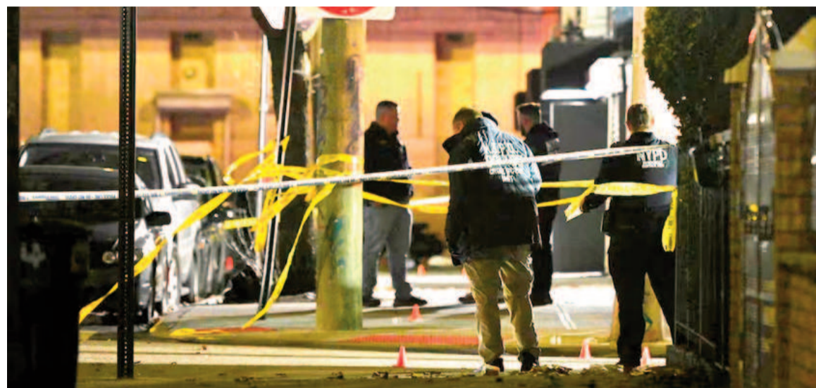
Siguen investigando los motivos detrás del ataque.

Las víctimas fueron trasladadas a hospitales cercanos y ninguna se encuentra en estado crítico. Las autoridades descartaron un acto terrorista.