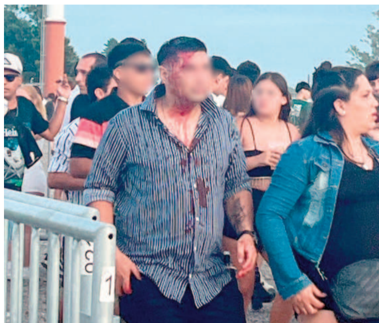
Hubo personas que, ajenas a toda pelea, recibieron botellazos en la cabeza.

También en horas de la madrugada dos hombres fueron heridos con armas blancas tras una violenta pelea. Los efectivos policiales intervinieron en una riña ocurrida en la intersección de Moreno y Alberdi, que dejó a dos personas heridas. De acuerdo con lo informado por fuentes de la investigación, uno de los involucrados, un hombre de 36 años, sufrió cortes con arma blanca en el brazo izquierdo tras una discusión. El otro hombre, de 42 años, recibió durante la reyerta una herida en el hemitórax derecho. Ambos fueron trasladados de inmediato al hospital