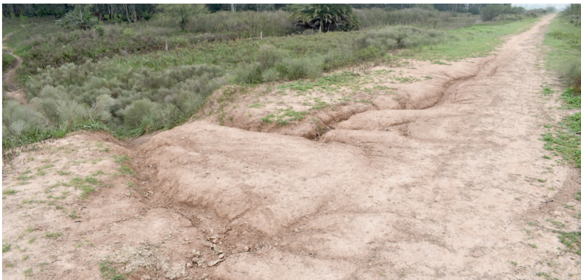
Los trabajos de alteo del terraplén de La Emilia tienen establecido un plazo de ejecución de seis meses.

La obra deberá ser ejecutada por Maragua, la empresa que se adjudicó la licitación pública por la puesta en valor del terraplén y la operación y mantenimiento de la estación de bombeo, ambos en la localidad de La Emilia. De acuerdo con el pliego de licitación, el alteo del terraplén tiene un plazo de ejecución de seis meses.