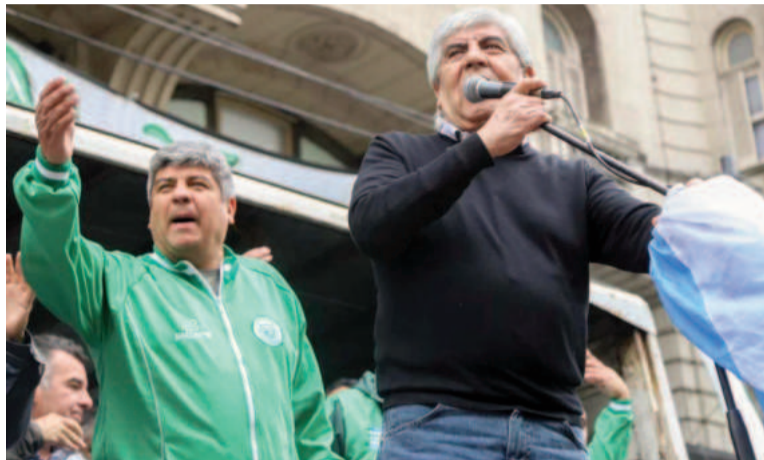
Los Moyano, jefes del gremio de Camioneros.

En el arranque del año, el sindicato de Camioneros se dispone a cerrar un acuerdo paritario de tres meses del 5,5% de aumento, muy por debajo del 15% que pretendía el líder del gremio, Hugo Moyano.