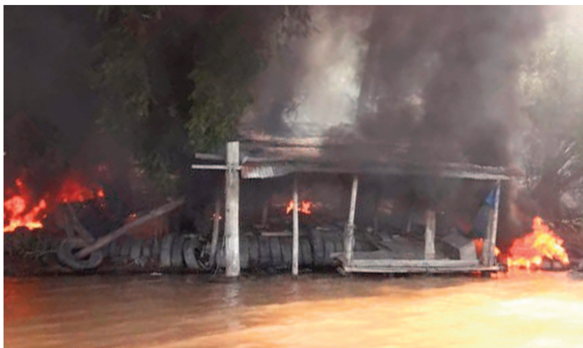
Las llamas consumieron el que fuera un escenario sangriento.