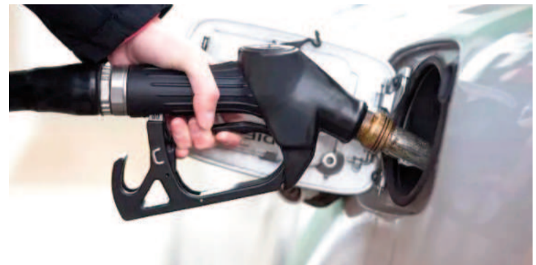
Los combustibles tienen nuevos precios desde este viernes.

Esta actualización se enmarca en el proceso de sinceramiento de precios impulsado por el Ministerio de Economía hace un año, ajustando los valores en función de las variaciones de la inflación.