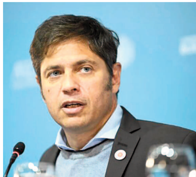
El gobernador de la provincia de Buenos Aires, Axel Kicillof.