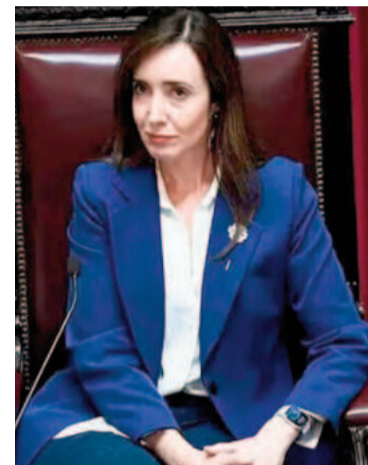
La titular del Senado, Victoria Villarruel.

Para entender el embrollo que se destrabó esta tarde, que la Casa Ro-