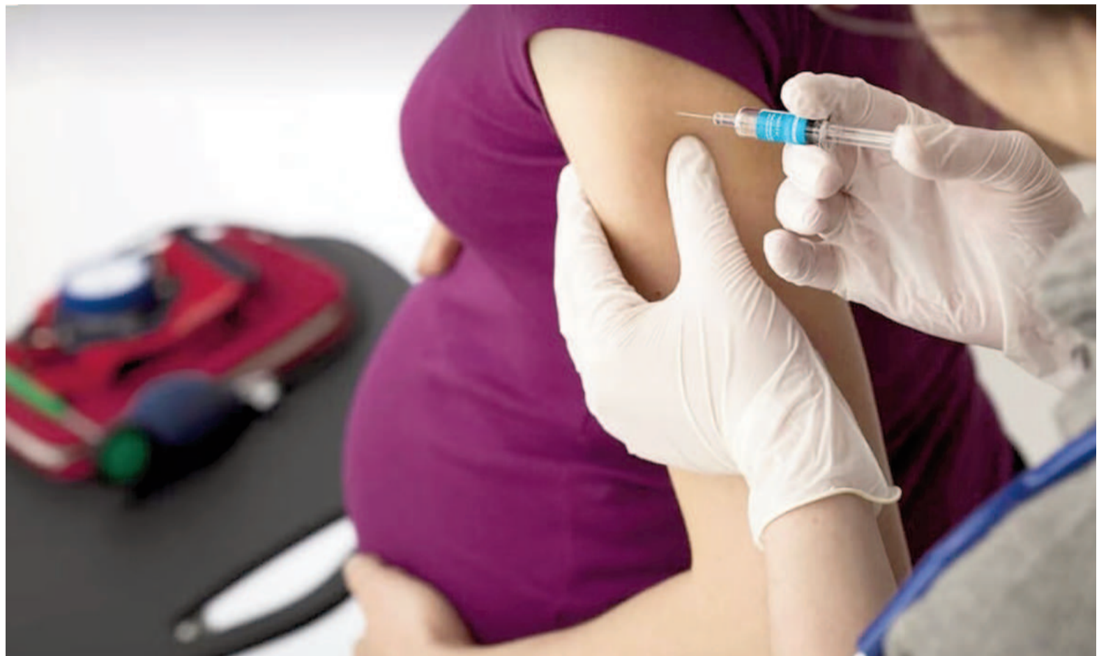
La vacuna contra el VSR se aplica en el vacunatorio del Hospital San Felipe de lunes a viernes de 6:00 a 14:00.

El VSR es la principal causa de infecciones respiratorias agudas bajas (IRAB) en menores de un año y de morbilidad y mortalidad a nivel mundial. Se calcula que provoca un tercio de las muertes durante el pri-