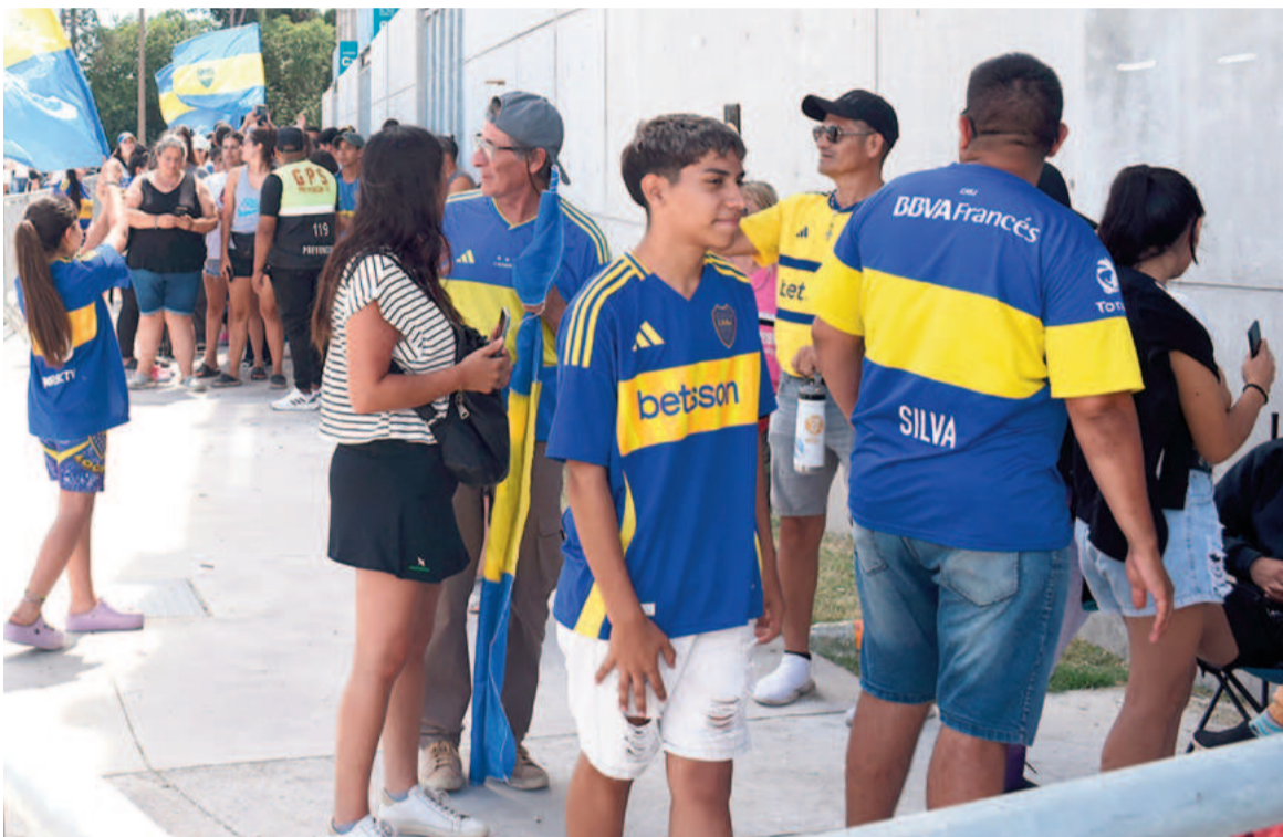
San Nicolás se viste de azul y oro. El miércoles, el Estadio estará repleto.

La preventa de entradas en las boleterías del Estadio San Nicolás fue un éxito. Más de 18.000 residentes nicoleños consiguieron su ticket para ver el amistoso que el Xeneize disputará ante Juventude de Brasil el próximo miércoles.