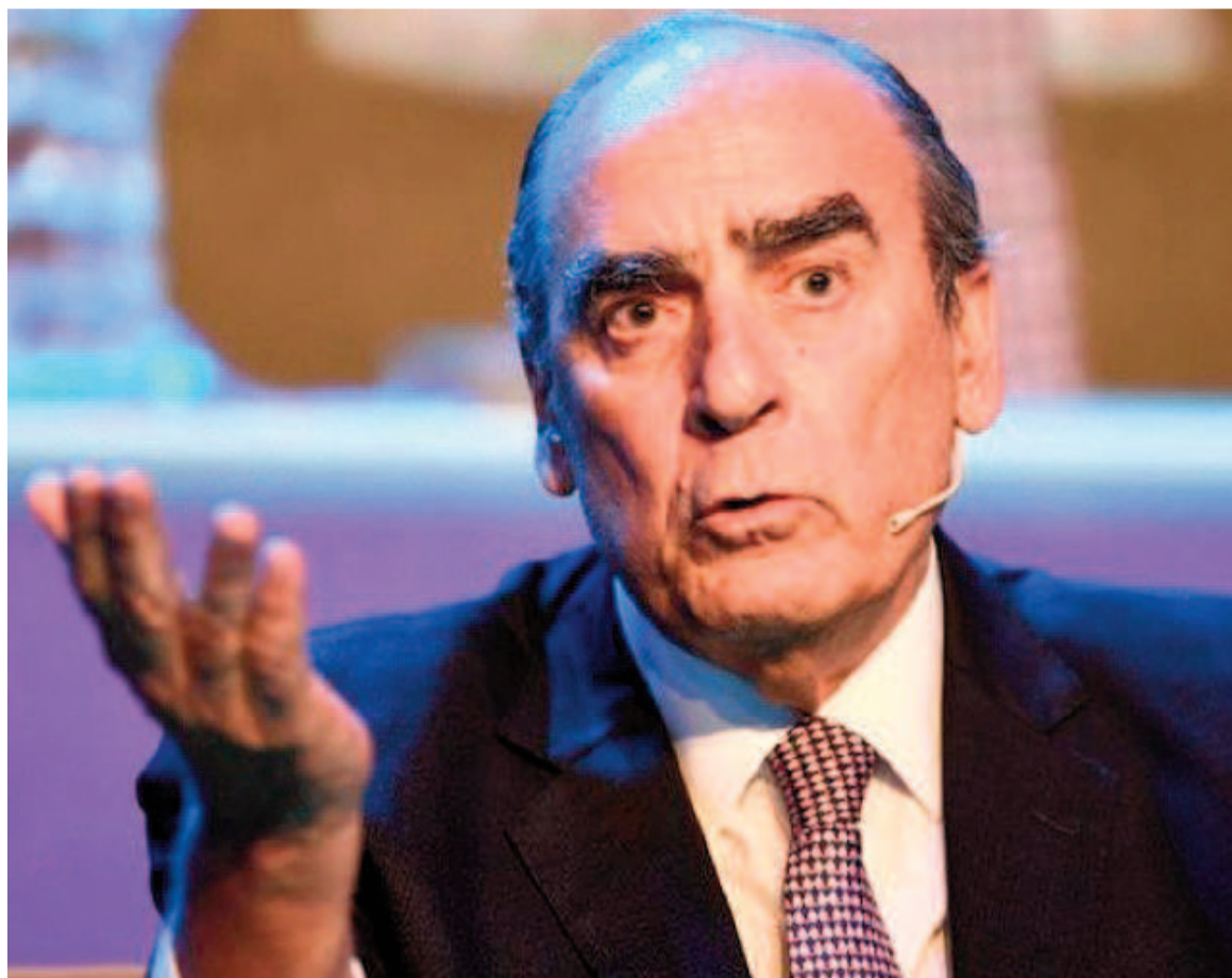
El jefe de Gabinete, Guillermo Francos.

Reconoció que "las discusiones son complejas. No creo que haya unanimidad pero sí hay apoyo para llevarlos adelante. Vamos a ver en la discusión cómo podemos alinear