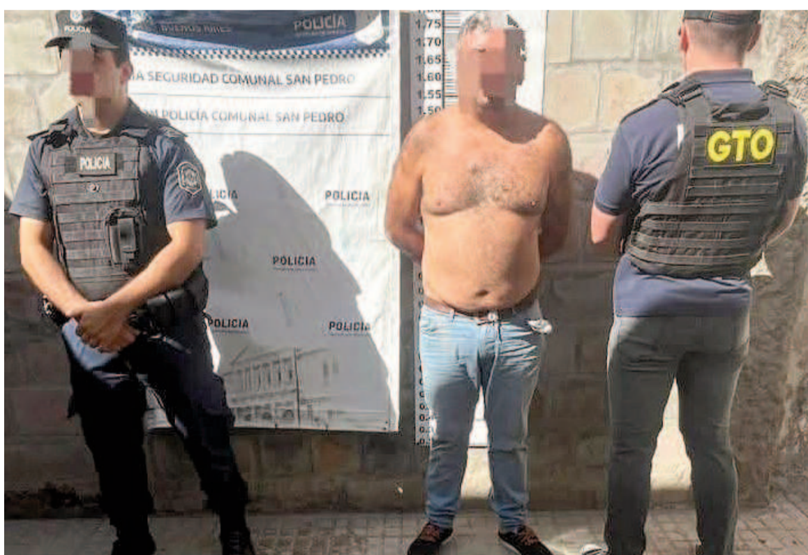
Los detenidos están acusados de los delitos de tentativa de robo agravado en poblado y en banda.

Durante la mañana de este martes se realizaron las audiencias indagatorias a los cuatro sujetos capturados tras protagonizar un intento de asalto en San Pedro. Los integrantes de la banda, un hombre oriundo de esa localidad exdirigente de Uatre y tres nicoleños, habían sido capturados circulando en un auto robado luego de que intentaran asaltar una vivienda de la vecina ciudad. La fiscal María del Valle Viviani, a cargo de la UFI N° 7 de la mencionada localidad, en diálogo con EL NORTE confirmó la realización de las medidas e informó que los imputados se negaron a declarar y permanecerán detenidos a disposición de la Justicia hasta que el Juzgado de Garantías decida su suerte procesal. Están acusados de los delitos de tentativa de robo agravado en poblado y en banda. El intento de asalto había ocurrido durante la mañana del pasado lunes en la vecina ciudad de San Pedro. Cuatro sujetos armados con sus rostros cubiertos ingresaron a un domicilio de calle Obligado, propiedad de un hombre de 64 años. Un llamado alertó a la policía y cuando arribaron los efectivos al lugar los asaltantes huyeron por la parte trasera de la vivienda. Tras un operativo cerrojo los integrantes de la banda fueron detenidos. La organización delictiva estaba integrada por un sampedrino y tres nicoleños, quienes fueron detenidos