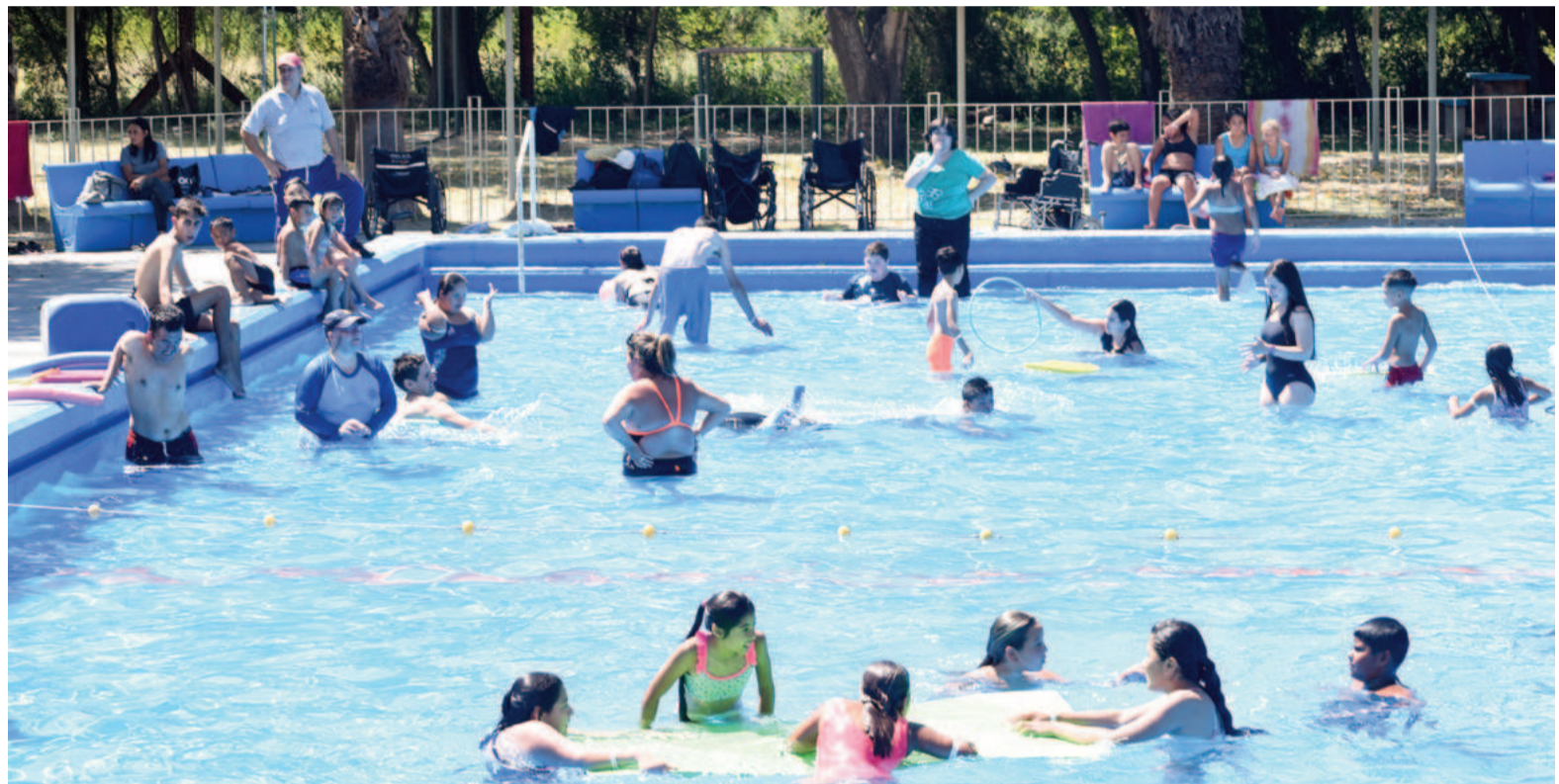
Ayer fue el primer día de pileta para los estudiantes nicoleños que concurren al programa Escuelas Abiertas en Verano.

Mientras que los días de acceso a los predios con pileta son los martes, jueves y viernes. Este año participan del programa los siguientes