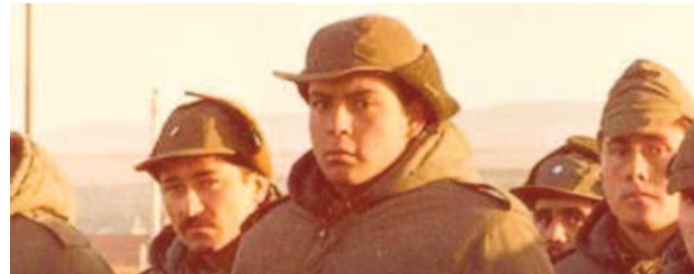
En sus años de conscripto.