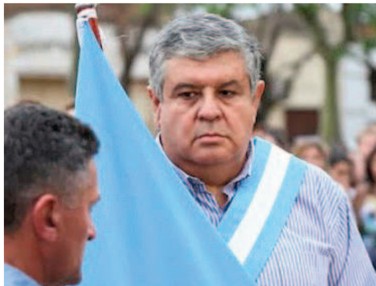
Luciendo orgulloso la "celestes y blanca".

Desde la Fundación con sede en San Nicolás también lamentaron su pérdida: "Hombre que luchó como pocos por los Héroe y Veteranos de Guerra de Malvinas de San Nicolás".