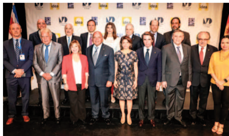
Algunos de los integrantes de Iniciativa Democrática de España y las Américas acompañarán a González.

El líder opositor venezolano, autoproclamado ganador de las elecciones, llegará a Caracas con exmandatarios en apoyo a la democracia.