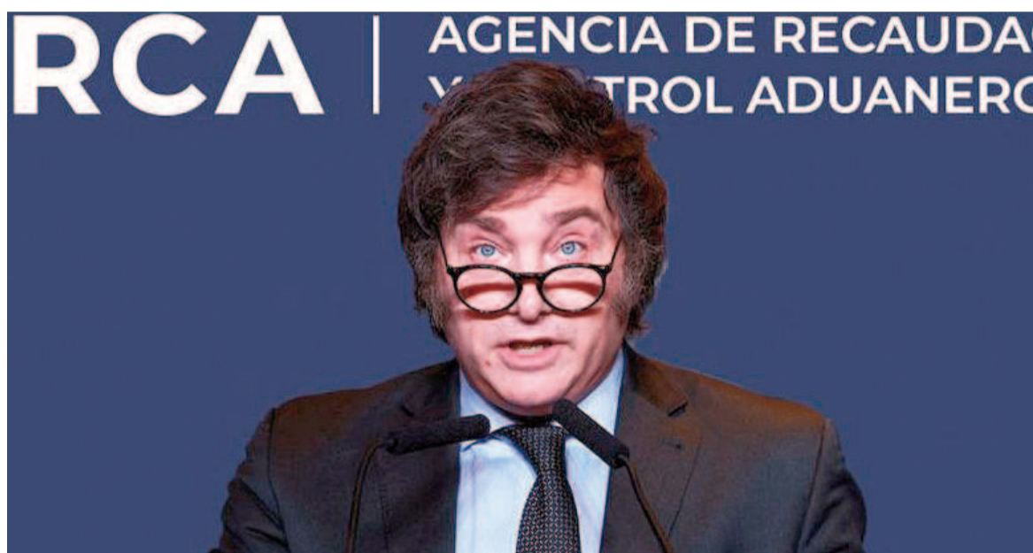
Presidente Javier Milei.

Adorni, fiel a su estilo, había comunicado en su posteo que "se terminan los privilegios y el gasto desenfrenado en ARCA" y señaló que "el presidente de la Nación acaba de firmar el decreto que determina que desde hoy se reduce el sueldo del director ejecutivo y los directores generales en un 80%". Además, puntualizó que "se dispuso una reducción del presupuesto del ARCA destinado a la cuenta de jerarquización del 0,65% al 0,60%, generando un ahorro de 121.000 millones de pesos correspondientes a sueldos de funcionarios durante este 2025". En la misma línea, también precisó que "el Poder Ejecutivo instó a las autoridades del ARCA a que avancen con una reducción de la estructura inferior, estimando que ésta debe situarse en torno al 45%". La reducción de los salarios en el organismo equipara el sueldo del