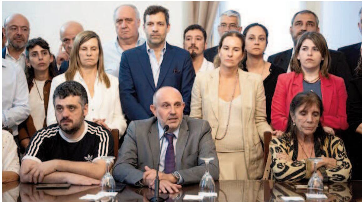
Guerrera, con diputados y senadores de UP.

El encuentro fue anunciado el mismo 27 de diciembre, cuando fracasó el tratamiento legislativo de los pro-