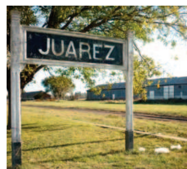
Benito Juárez de luto.

Al momento del accidente, los trabajadores que realizaban sus respectivas tareas en el predio no percibieron la caída del niño e iniciaron la descarga de las semillas