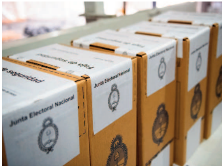
Cinco provincias ya desdoblaron las elecciones.

En el plano político, el distrito condensa las tensiones entre el PRO y La Libertad Avanza (LLA), que se mueve como fuerza opositora a la gestión de Macri. Sus legisladores incluso votaron en contra del proyecto de Presupuesto 2025 y del Código Urbanístico, entre otras inicia-