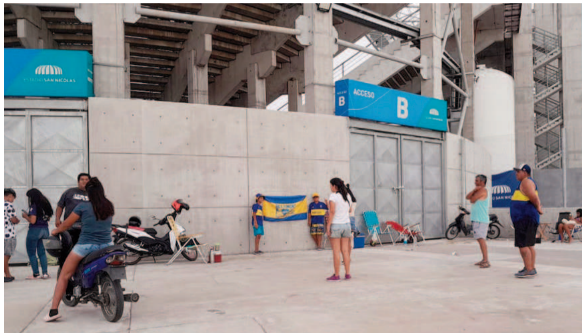
Los primeros hinchas del Xeneize se acercaron al Estadio con más de 40 horas de anticipación.

Pocas horas después de confirmarse el sistema de venta de entra-