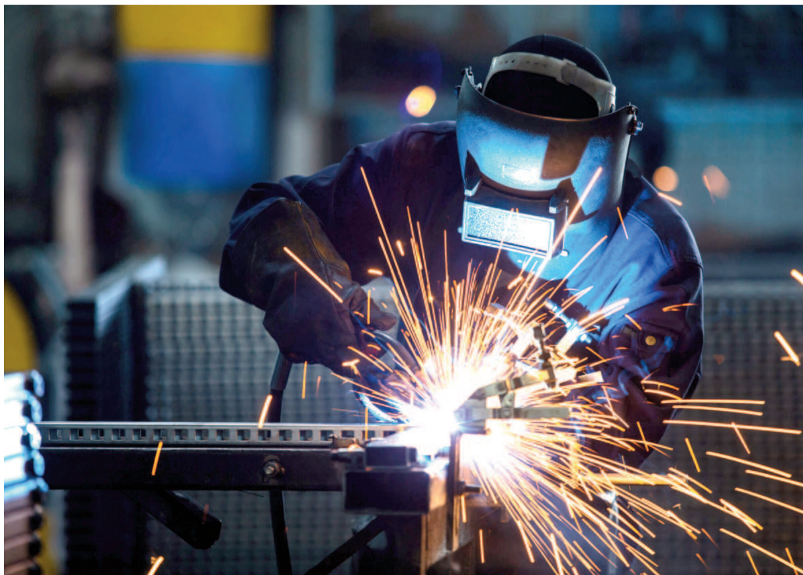
El sector metalúrgico nuclea a más de 17.000 empresas, que generan más de 350.000 empleos directos y exportaciones por US$ 11.500 millones anuales.

Hoy, el sector metalúrgico –incluida la industria automotriz– nu-