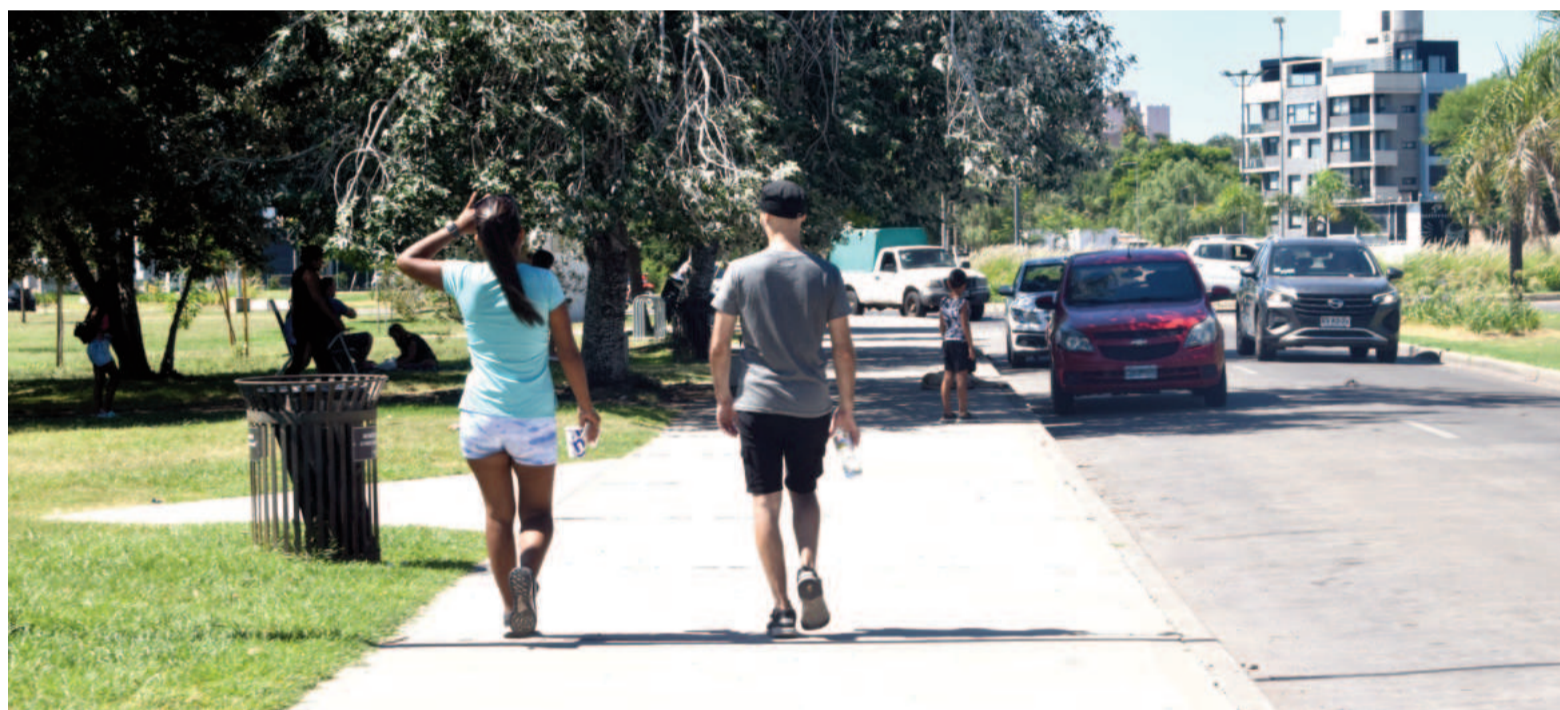
Este martes el Servicio Meteorológico Nacional pronosticaba 36 y 37 grados para las jornadas de domingo y lunes.

El Ministerio de Salud de la Nación tiene definida una serie de recomendaciones para este tipo