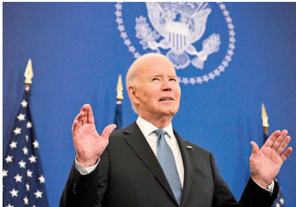
Joe Biden entregará el poder el próximo 20 de enero.

La inclusión de Cuba en el listado fue una de las últimas decisiones que tomó el republicano Donald Trump, en enero de 2021, antes de dejar el poder en su primer mandato. Se prevé que el gobierno entrante revierta esta medida.