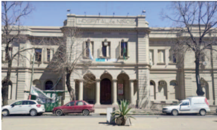
El Hospital de Niños “Sor María Ludovica” de La Plata

El Hospital de Niños “Sor María Ludovica” de La Plata fue habilitado por el Centro Único Coordinador de Ablación e Implante de la Provincia de Buenos Aires (Cucaiba) para convertirse en el primer Centro de implante cardíaco infantil bonaerense, y el segundo del sistema público a nivel nacional, después del Hospital “Profesor Dr. Juan P. Garrahan”.