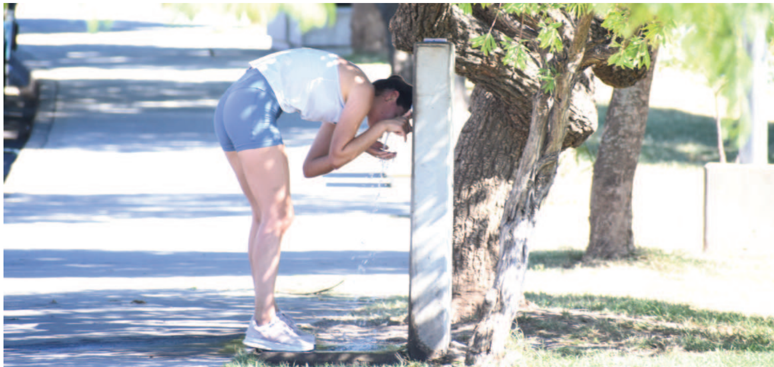
Un poco de agua cotiza igual que el oro para quienes transitan por la costanera de San Nicolás.

La máxima del viernes rondaría los 33°, y hay chances de tormentas aisladas desde la tarde. El sábado habría probabilidad de chaparrones, con registros que no superarían los 32°. Es verdad que la probabilidad de lluvia es apenas de entre 10 y 40 por ciento, pero sería suficiente para generar un ambiente más agradable. Incluso, el domingo la máxima podría tocar los 30 grados y el cielo estaría mayormente nublado.