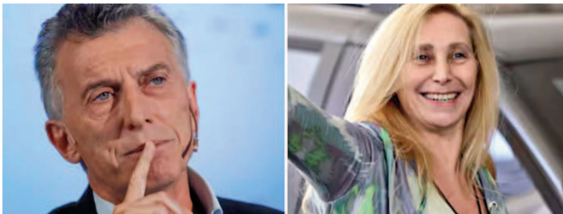
Mauricio Macri – Karina Milei.

Desde ese momento, Macri se convenció de que, con excepción de Milei, los otros dos integrantes del “triángulo de hierro” se complotaban para rechazar cualquier tipo de acuerdo con el PRO. Aun así, el ex presidente ensayó algunas gestiones con Caputo, a pesar de señalarlo públicamente como el responsable, según él, de una gestión deficitaria, que incluyeron una serie de reuniones durante el 2024. El resultado también fue negativo. Antes de Navidad, como publicó este medio, el consultor le envió un mensaje encriptado a través de un colega amigo que habla fluido con el