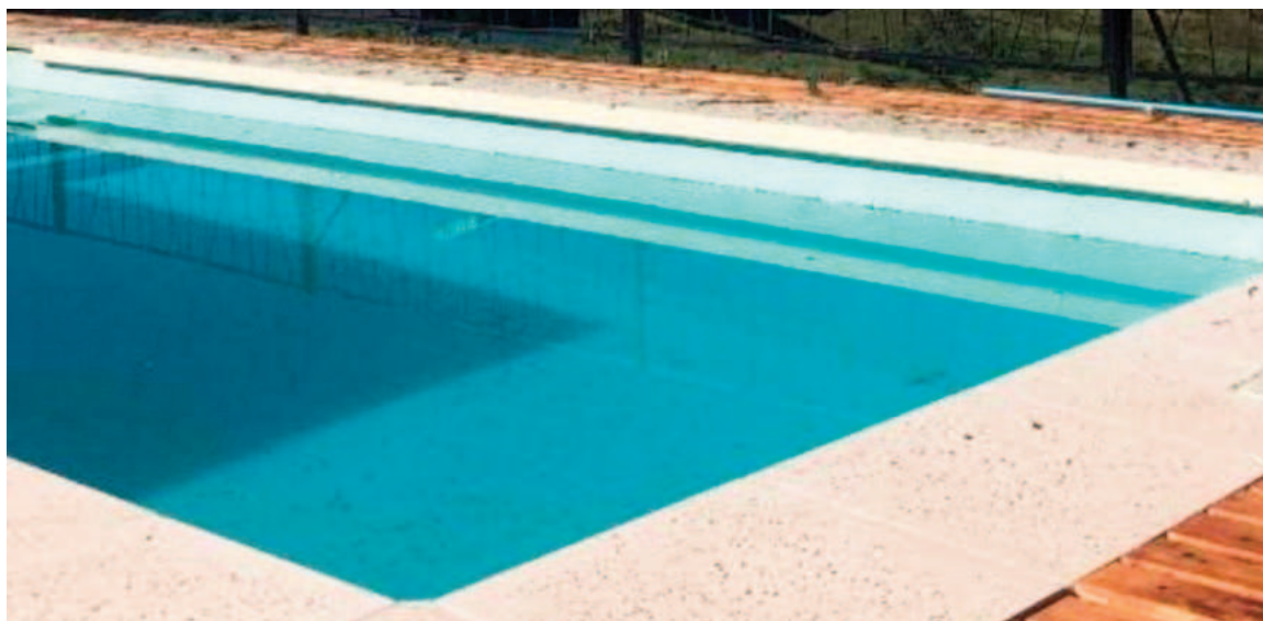
Una niña murió electrocutada.

Según detallaron desde el Ministerio de Seguridad, la niña de 11 años intentó ingresar a la pileta a través de una escalera y en ese instante tocó un cable que se había