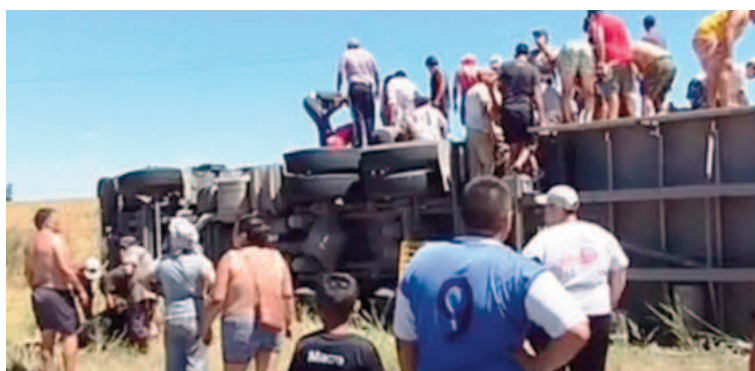
La gente se agolpó en el lugar del siniestro.

"Nosotros pusimos los móviles para resguardar la zona", explicaron. Con todo, la situación tuvo momentos de descontrol, porque decenas de personas se movilizaron para obtener partes del ganado, tanto