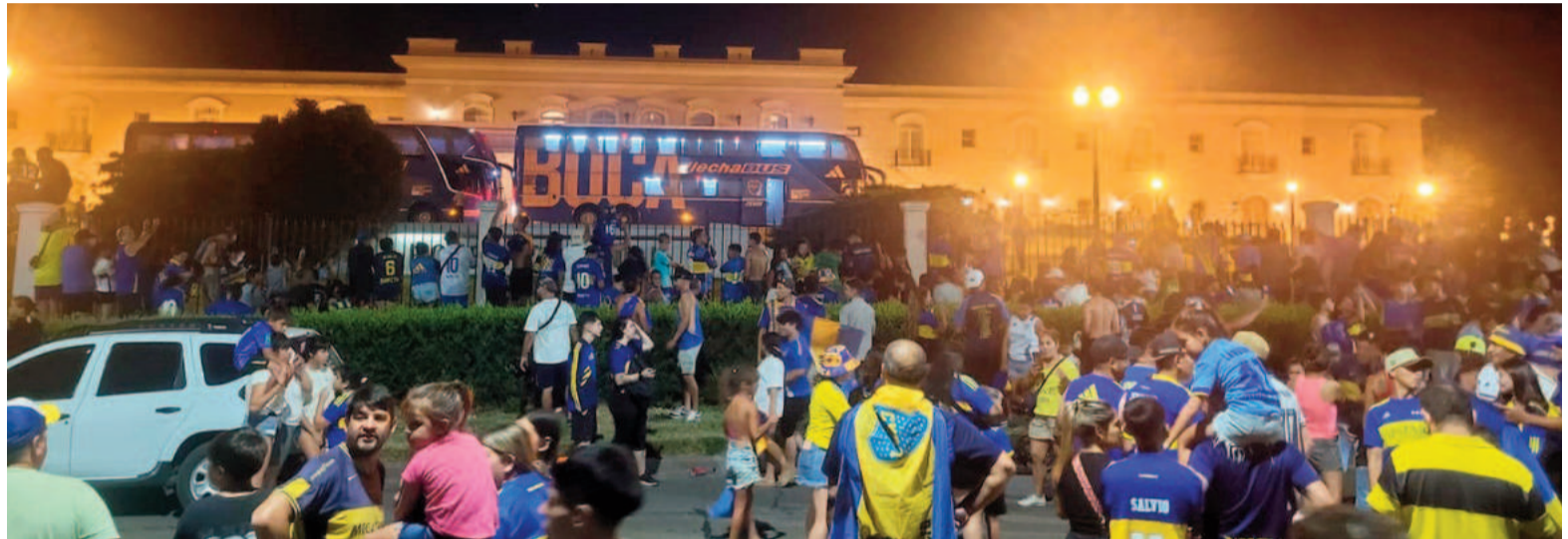
El plantel llegó minutos antes de las 22.00 y fue recibido por una multitud.

El partido ante Juventude de hoy a las 20.00 será el único amistoso que jugará el equipo de Fernando Gago antes de las competencias oficiales, que tendrán su primera parada el miércoles 22 en Santa Fe ante Argentino de Monte Maíz, por Copa Argentina. Para este partido no fueron citados Marcos Rojo, Marcelo Saracchi y Edinson Cavani, pero es posible