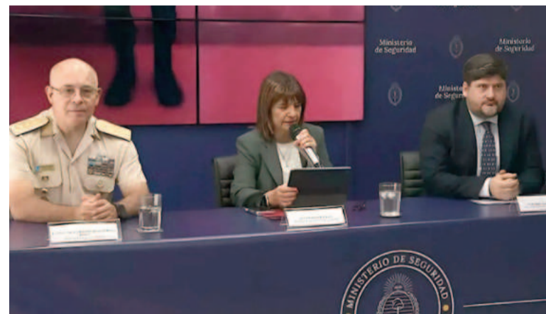
Bullrich comunicó la detención de un terrorista.

En allanamientos simultáneos en domicilios vinculados a Ávila, orde-