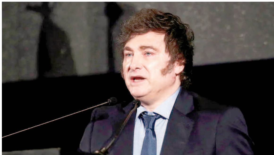
En 2024, bajo la presidencia de Milei, la caída fue del 26,8% interanual.

Este aumento se explica por las transferencias realizadas en el marco del cumplimiento de la Medida Cautelar CSJN 1864/2022 por lo adeudado