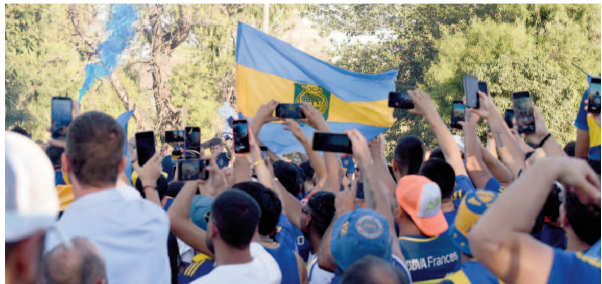
Los simpatizantes se acercaron a partir de las 18.00 a la puerta del hotel.

El histórico amistoso será transmisión de Radio U 89.9 con el equipo de La Deportiva , a partir de las 19.30.