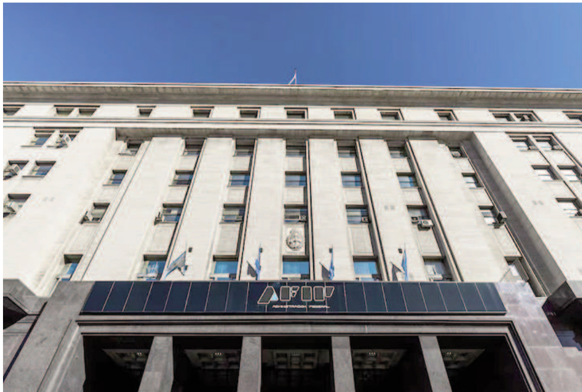
El listado de empresas beneficiadas fue creado en 2016.

En el sistema informático de la AFIP se encuentra la base de datos de toda la población, con registro de sus actividades productivas y las