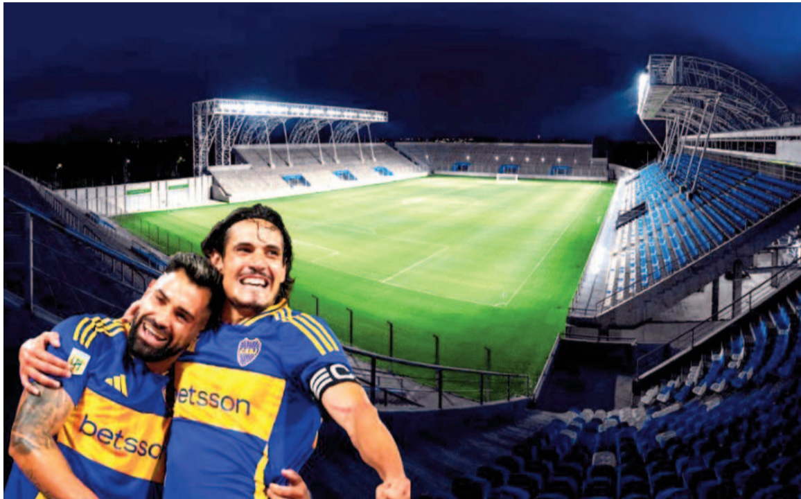
La presencia del xeneize en nuestra ciudad genera gran expectativa. WEB

Lo más complicado en esta negociación pasaba por convencer al futbolista de mudarse a la Argentina. A pesar de que la idea lo entusiasma