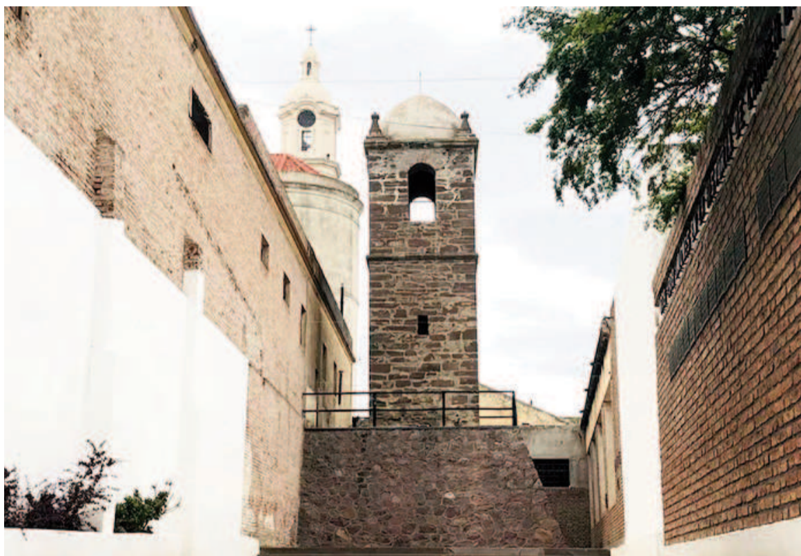
El fuerte de Carmen de Patagones, un pilar histórico y turístico de la Patagonia.

En 1820, tras la autonomía de Buenos Aires, Patagones se integró a su jurisdicción y se convirtió en un centro estratégico durante la guerra con Brasil, destacándose en la Batalla de Carmen de Patagones de 1827.