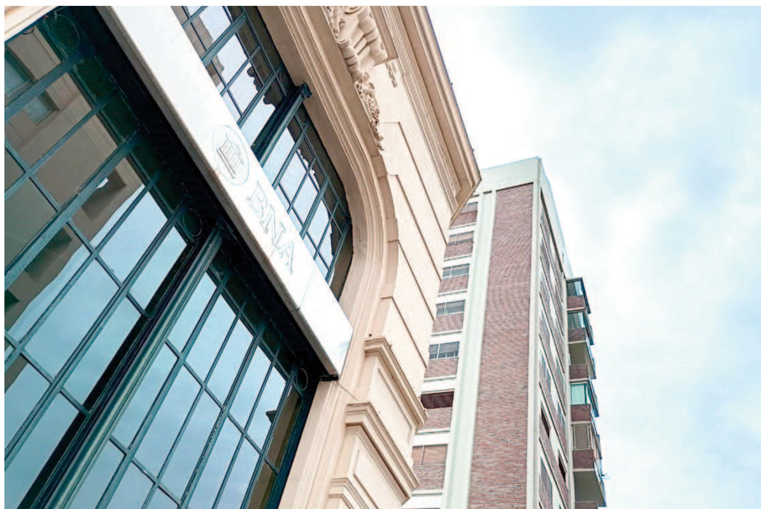
El Banco de la Nación Argentina reportó que a través de su programa "+Hogares" cerró el año 2024 con 3000 créditos hipotecarios acordados.