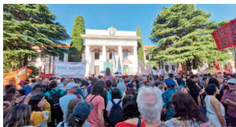
Declaran estado de asamblea permanente en toda la Administración Pública.

La tensión se ha acentuado con las noticias de despidos masivos en distintas áreas del gobierno. Desde diciembre de 2023, se contabilizan más de 36.000 despidos en la administración pública, un número que continúa cre-