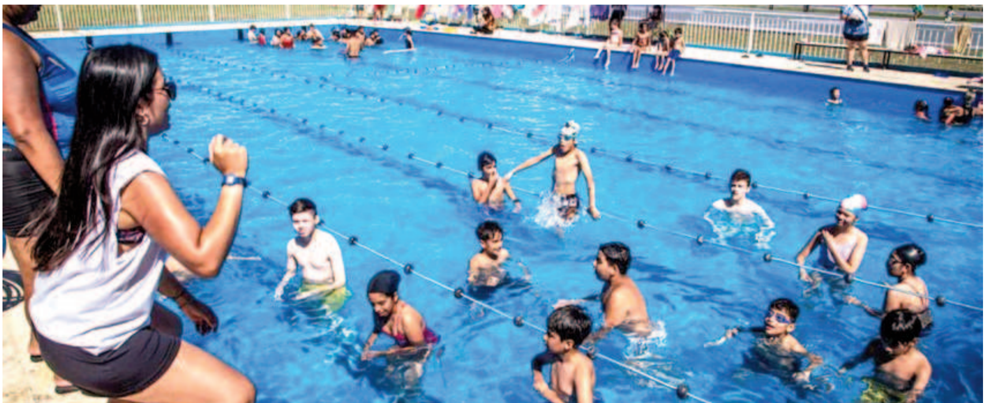
Comienzan las actividades en los espejos de agua para los estudiantes inscriptos en las "Escuelas Abiertas en Verano". ILUSTRACIÓN

El programa -impulsado por la Dirección General de Cultura y Educación bonaerense- viene trabajando en las escuelas-sede desde el 2 de enero, y se extenderá hasta fin de mes. Los martes, jueves y viernes los estudiantes se trasladarán a los distintos predios con pileta para completar las propuestas de docentes de educación física, artística y demás especialidades. El acto formal de apertura será el jueves 9 de enero en el Camping de Luz y Fuerza.