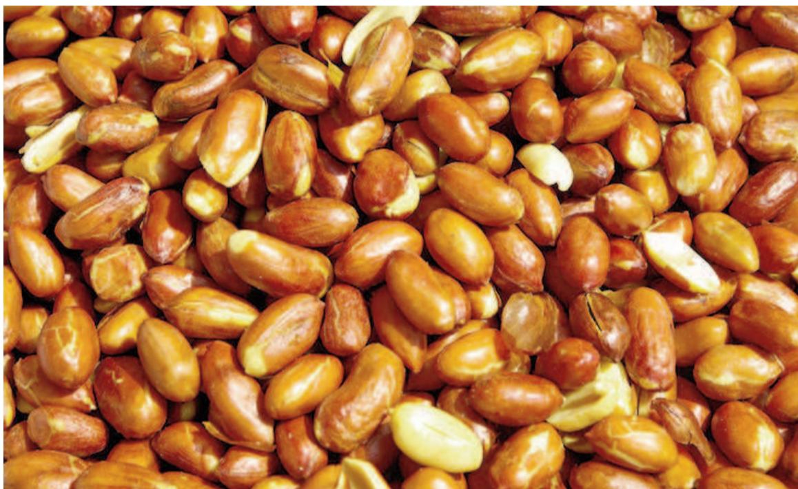
El extracto de tegumento de maní se obtiene por métodos sustentables que utilizan etanol.

En ensayos in vitro realizados en cultivos celulares, el extracto de tegumento mostró una inhibición total del virus dengue serotipo 2 (DENV-2), incluso a bajas concentraciones. Según explicó Carola Sabini, investigadora del Conicet en el Inicsa y líder de la investigación: "Creemos que estos efectos se deben a diferencias en la composición de cada producto. La semilla tiene más componentes lipídicos; en tanto que la piel de maní presenta polifenoles y proantociani-