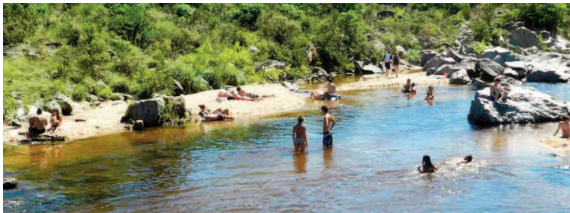
Otro deceso enluta el comienzo de la temporada de verano en Córdoba.

frío un fuerte golpe en el parietal derecho.