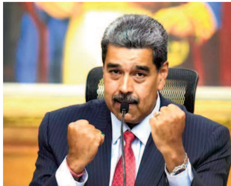
Maduro acusó al gendarme argentino de terrorista.

El líder del régimen chavista volvió a referirse a la detención de Nahuel Gallo al que acusó de formar parte de un plan criminal. Sin exhibir pruebas, involucró al Gobierno argentino.