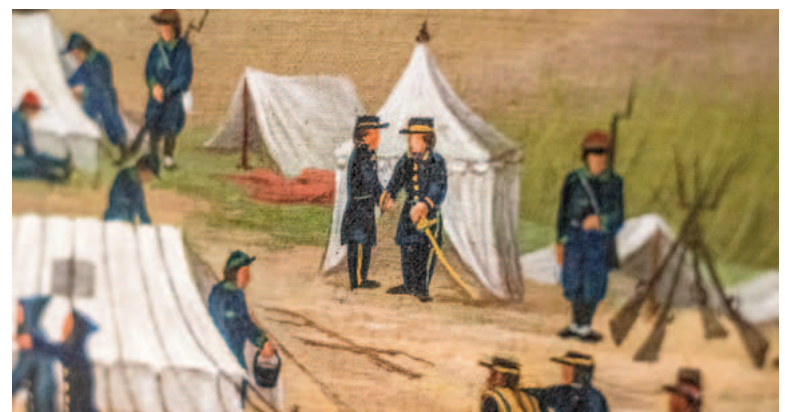
Obra de Cándido López.

La exhibición promete ser una cita imperdible para quienes deseen explorar las memorias de una época marcada por el fuego de la guerra y la sensibilidad artística de un maestro como Cándido López.