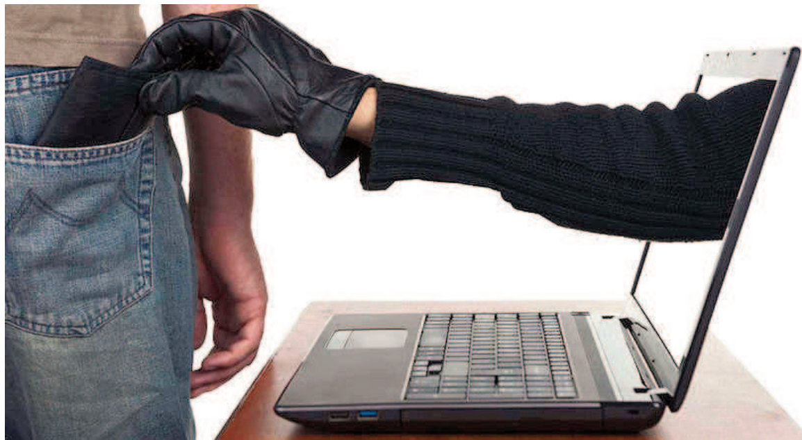
Los informáticos advierten de que los riesgos de fraude son cada vez mayores por el creciente uso de las redes sociales.

La denuncia por estafa fue radicada en la Comisaría Primera por una jubilada de 73 años, quien fue engañada por sujetos inescrupulosos que, tras obtener sus datos, tomaron préstamos a su nombre por una cifra millonaria para luego enviar el dinero a cuentas desconocidas. La víctima relató en sede policial que ingresó a una página de Facebook que simulaba pertenecer a la empresa "Flecha Bus" que ofrecía descuentos para jubilados. Luego de ello recibió una llamada telefónica en la que el interlocutor le indicó que para obtener el beneficio debía descargar una aplicación. La mujer siguió las instrucciones, tras lo cual le cortaron la llamada. Apenas unos minutos después advirtió que le habían bloqueado el teléfono, que ya no veía en el celular su historial de WhatsApp y tampoco la app de Banco Nación. Inmediatamente recibió dos correos electrónicos, uno de ellos informándole acerca de la aprobación de un crédito que la mujer no había pedido y el otro de una transferencia a cuentas desconocidas del monto de ese préstamo por una cifra de tres millones seiscientos mil pesos que habían sido solicitados a su nombre. La causa por estafa tra-