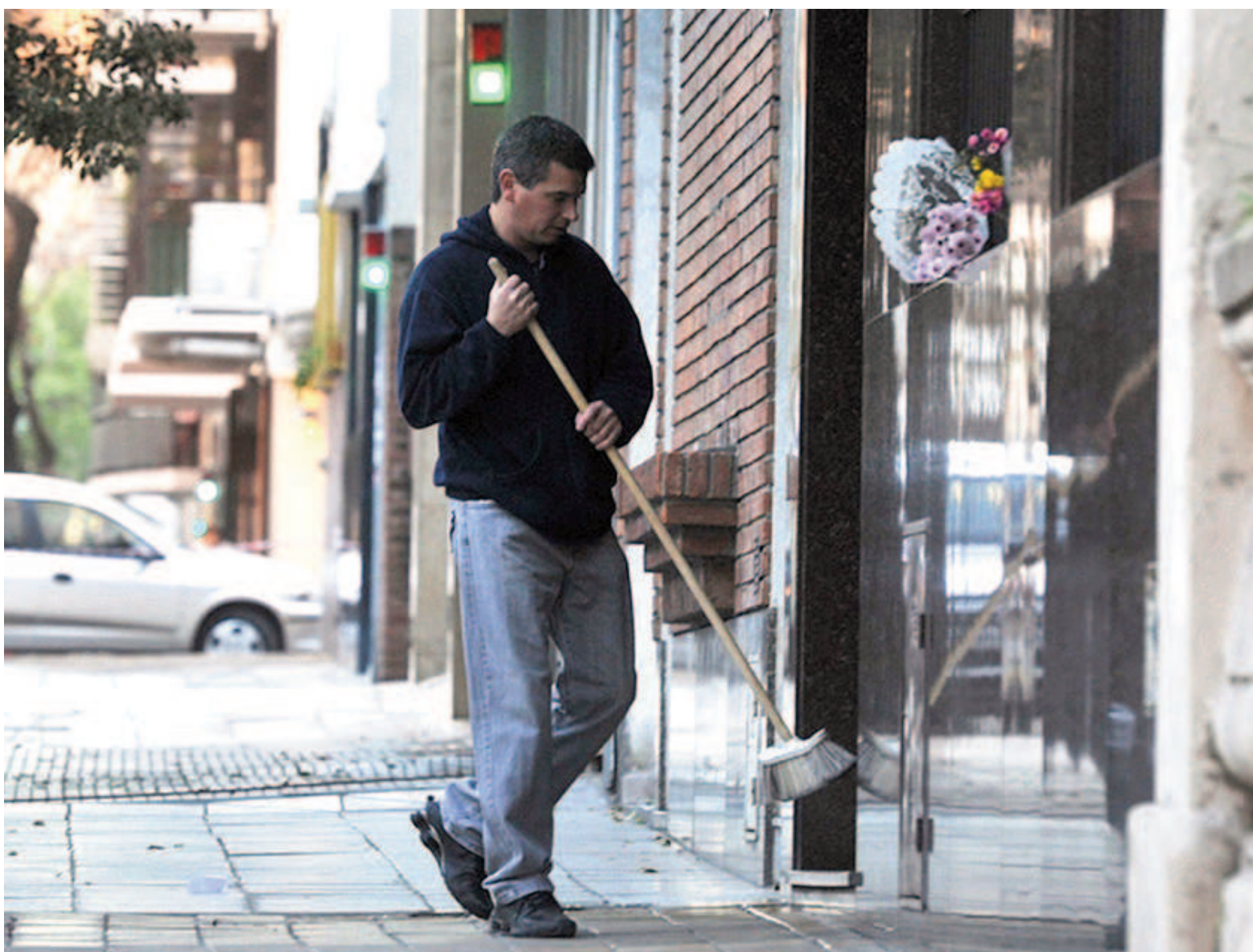
Según un reporte privado, las expensas en los edificios subieron un 4,99% en diciembre y acumularon un alza del 166,69% en 2024.

Con la suba pactada, los encargados de edificios tendrán un sueldo