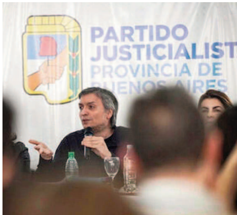
El espacio que conduce Máximo Kirchner cargó contra Pullaro.

Por su parte, y en un guiño hacia Axel Kicillof, le recordaron al mandatario santafesino el envío de más de 50 patrulleros para colaborar con el combate al narcotráfico y la inseguridad que se vive en Rosario. “Esos móviles que pagaron los bonaerenses no estaban en el Conurbano, sino en la ciudad santafesina”, remataron.