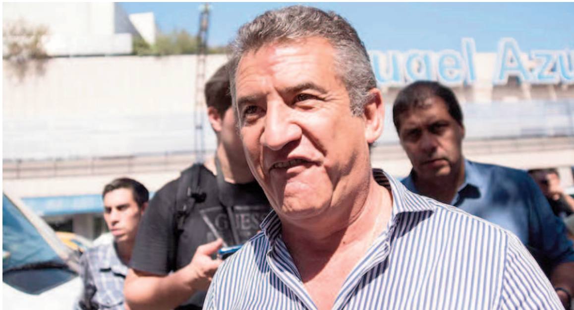
El STJ ordenó revocar por "arbitraria" la resolución que había ordenado la detención de Urribarri.

Carlomagno tuvo a su cargo el primer voto. En su argumentación, sostuvo que, en el caso, la prisión