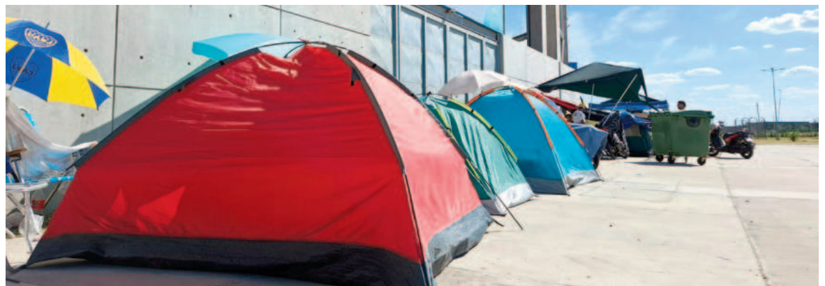
Los hinchas “acampan” en el playón del estadio.

Las entradas se venderán en el Estadio exclusivamente para nicoleños durante hoy y mañana, de 12.00 a 20.00, con un máximo de ocho tickets por persona. Los precios van desde $23.000 las populares hasta $45.000 la platea Del Pozo, que es la más costosa. Se venden también la platea Codo a $30.000 y la amplia tribuna de Rucci a $32.000. Los menores de 3 años ingresa-