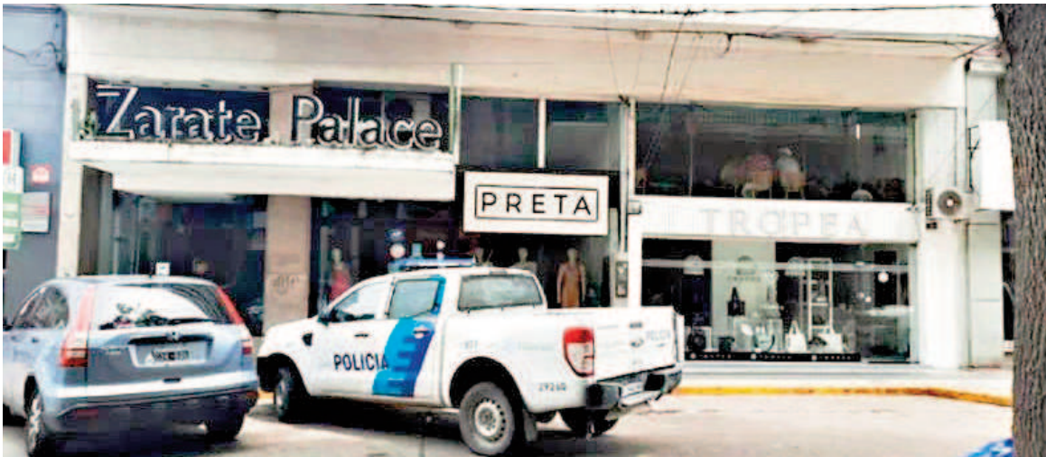
El hotel fue el lugar del sangriento hecho.

Una mujer de 31 años fue detenida tras apuñalar a su jefe, de 68 años, “por no aumentarle el sueldo”. El hombre está grave producto de varias lesiones. El hecho ocurrió en el Hotel Zárate Palace que está ubicado en la calle 19 de Marzo entre Independencia y Rómulo Noya, de la localidad bonaerense de Zárate, donde el gerente fue apuñalado por una empleada luego de que discutieran por un aumento salarial. Según fuentes policiales, la agresora utilizó un cuchillo tipo Tramontina de aproximadamente 20 centímetros para infligirle al gerente tres heridas punzantes en el tórax y ab-