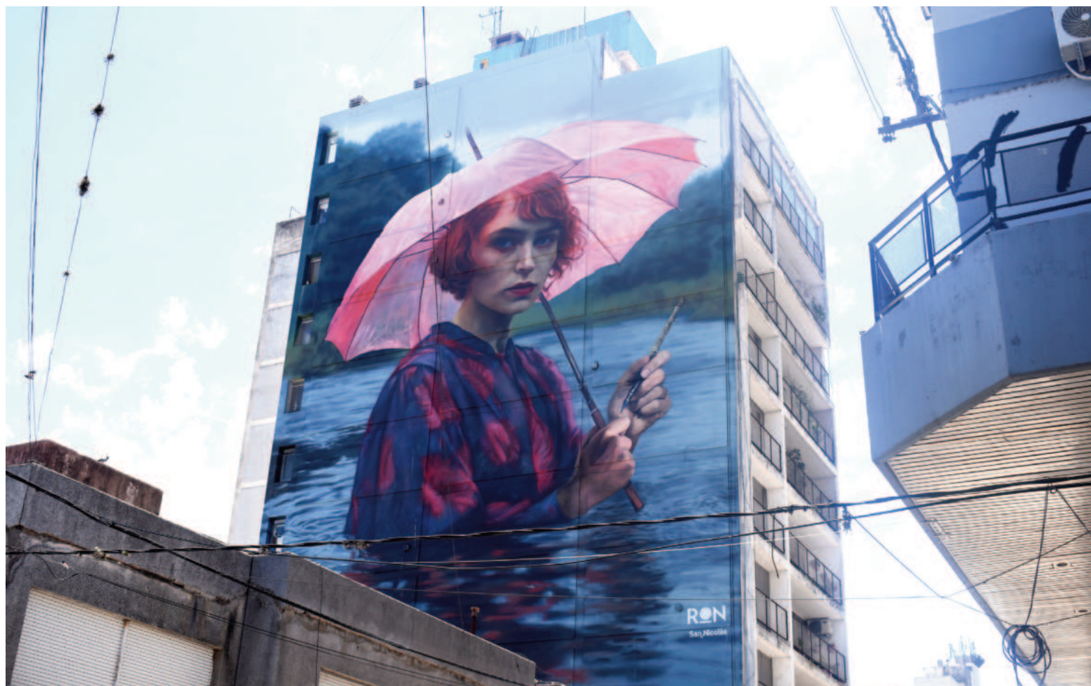
La obra retrata a una mujer emergiendo de un arroyo, protegiéndose de la tormenta bajo un paraguas y sosteniendo en su mano una pluma.

Los nicoleños tienen tiempo hasta el 25 de enero para votar por esta obra que representa a San Nicolás en el certamen internacional. Para participar, los interesados deben ingresar al enlace disponible en el perfil de Instagram de Martín Ron o acceder directamente al sitio oficial del concurso: