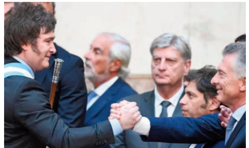
El actual Presidente de la Nación busca un acuerdo con el exmandatario.

Más adelante, el periodista Luis Majul le preguntó a Milei: “¿[Axel] Kicillof