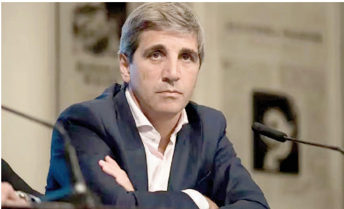
El ministro de Economía Luis Caputo.

Específicamente, Caputo apuntó a aquellas tasas "que su valor no guarde proporcionalidad con el costo de la prestación del servicio, caracterizándose por ser ilegales y arbitrarias", aunque no precisó casos puntuales y con qué criterio se determinará en qué casos hay excesos.