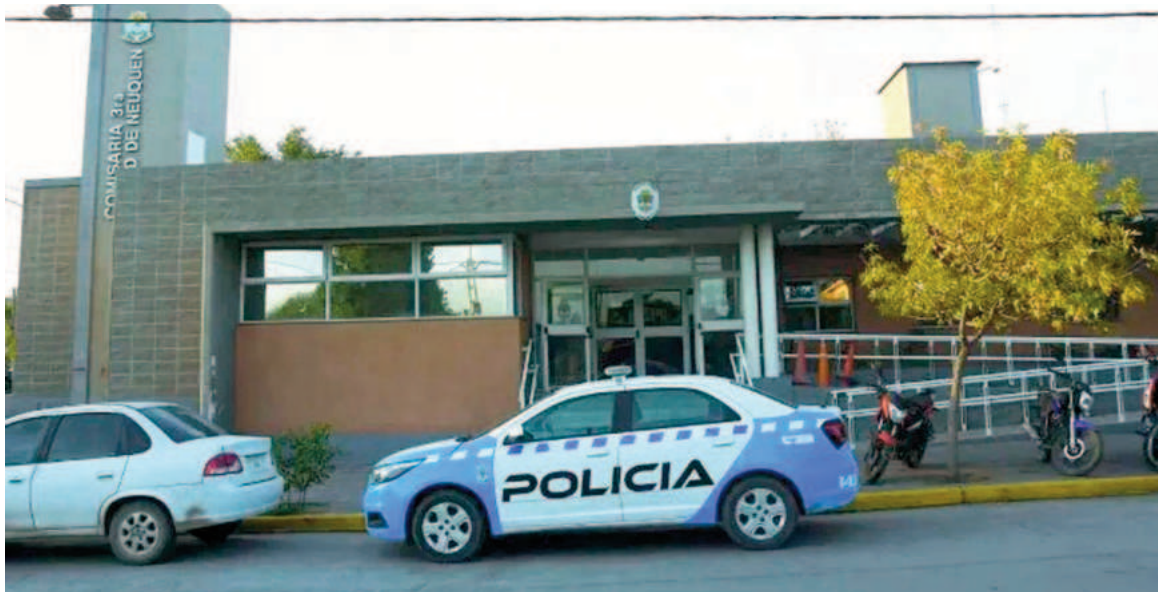
La comunidad neuquina no sale de su estupor.

En estos instantes, la víctima se encuentra en el Hospital Castro Rendón y la fiscalía señaló a la madre por la grave agresión contra el niño y le impuso una medida perimetral de dos meses, a la espera de que su hijo pase por cámara Gesell para conocer