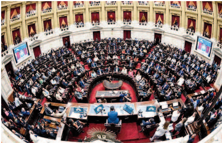
Cámara de Diputados de la Nación.

El Gobierno se encuentra en estas horas evaluando los proyectos de ley que formarán parte del temario de las sesiones extraordinarias que convocará y ratificó que la eliminación de las PASO formará parte, mientras que también es casi seguro que se incluirá el nuevo texto de ficha limpia.