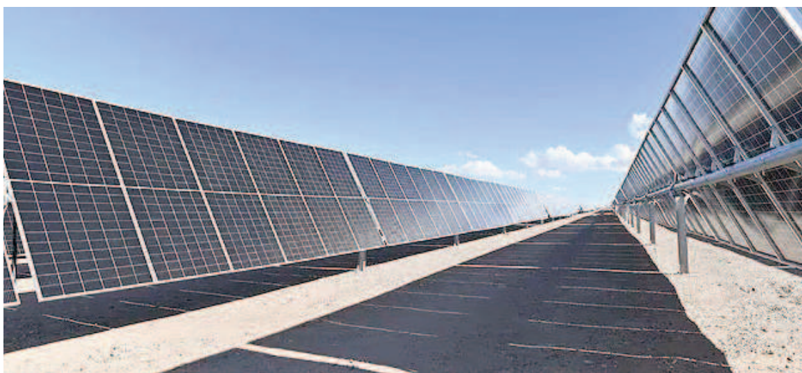
En principio, el Parque Solar El Quemado contará con una capacidad instalada de 200 MW.

En la primera se avanzará con la instalación de paneles solares bifaciales en 350 hectáreas por una capacidad instalada de 200 MW, mientras que en la segunda instancia se prevé completar la capacidad total planeada. El proyecto implica una inversión total de US$211.600.072, de los cuales en el primer y segundo año contados desde la fecha de so-