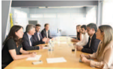
El PRO busca negociar con la LLA.

Cumbre del PRO: Macri ratificó que quiere negociar un acuerdo