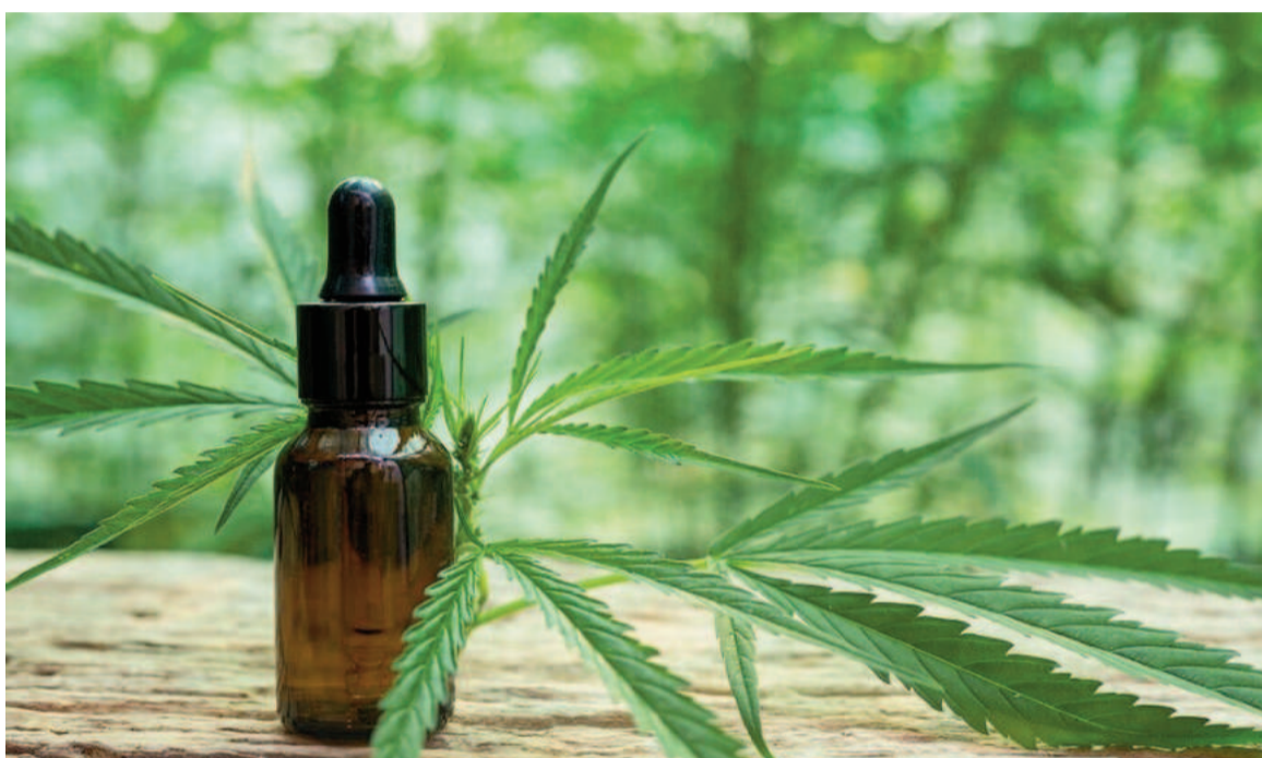
Todo lo que esté fuera de lo que indique el registro de cannabis (Reprocann) se considera tenencia ilegal.