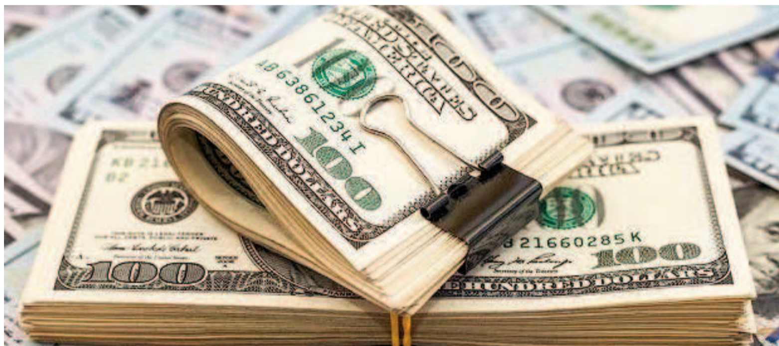
El cepo se levantaría en diciembre próximo.

El documento anticipa que el FMI impulsará la reducción del dólar