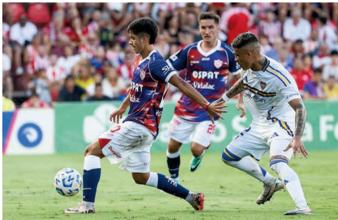
El Tatengue le amargó la noche a Boca en el final.