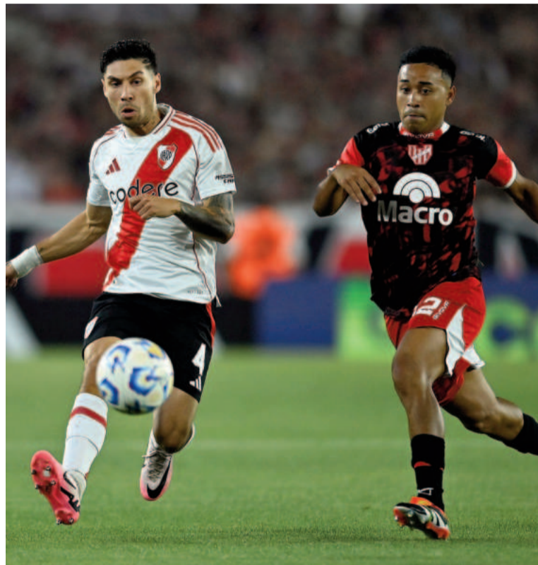
Montiel le dio a River su primer triunfo en el Apertura.