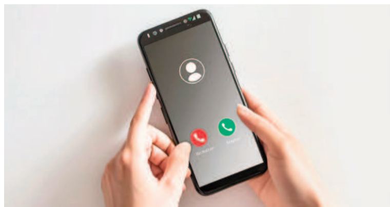
Una señal de alerta es cuando nadie contesta al otro lado de la línea.

Otra pista es la ausencia de una respuesta natural a preguntas o interrupciones, lo que sugiere que se trata de un bot en lugar de un interlocutor humano.