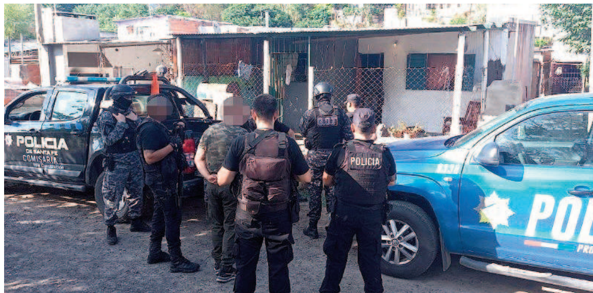
El operativo fue hecho en un asentamiento irregular.

De acuerdo a los datos recolectados, Summer fue arrestado en un operativo que realizó la Agrupación de Unidades de Orden Público de Villa Constitución por una investigación por extorsiones en las que estaba sindicado un menor como presunto autor. Dicho adolescente fue encontrado en el mismo domicilio que el evadido.