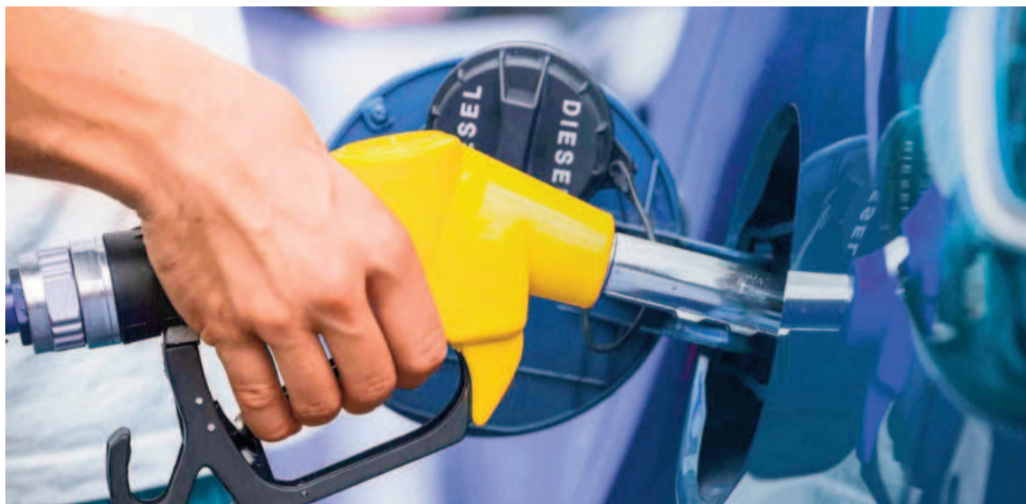
Habilitaron el autoservicio de combustible.

Este formato también está permitido en países como Estados Unidos, Uruguay y Paraguay, además de estados integrantes de la Unión Europea. El anuncio lo había efectuado el año pasado el ministro de Desregulación, Federico Sturzenegger, pero recién se oficializó este miércoles con su entrada en vigencia en el Boletín Oficial. En