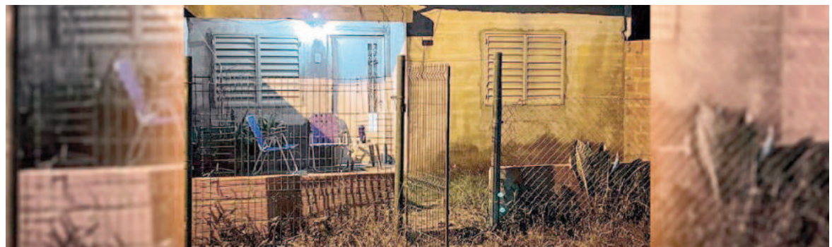
Frente de uno de los domicilios baleados.

En el frente de la casa quedaron marcados los impactos de dos balazos. Un vecino de la cuadra avisó que también su vivienda había sido alcanzada por la andanada de disparos: comprobó tres orificios en el