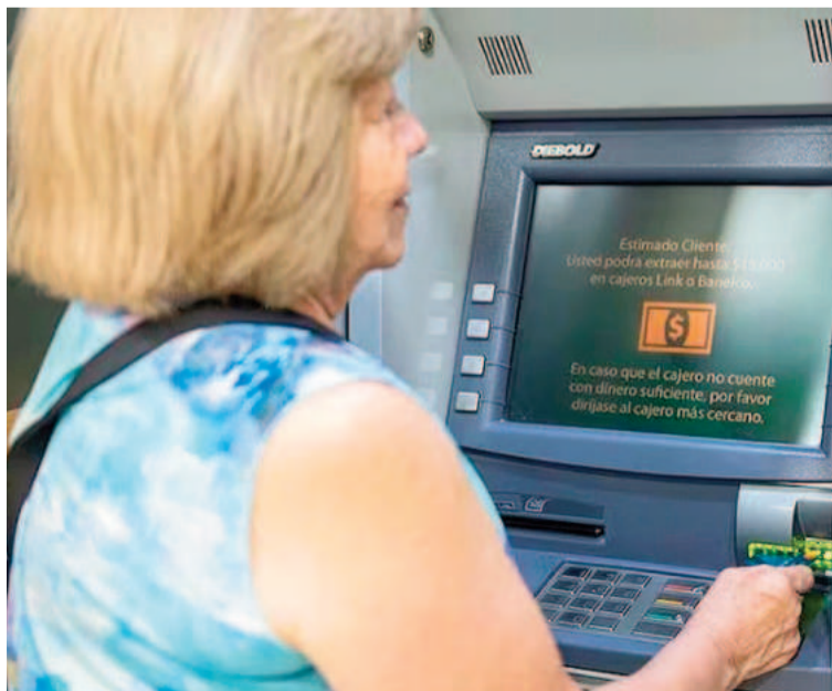
A partir de febrero aumentan las jubilaciones.

Asimismo, se estableció que la Pensión Universal para el Adulto Mayor (PUAM) se ubicará en 218.469,20 pesos, mientras que la Prestación Básica Universal (que