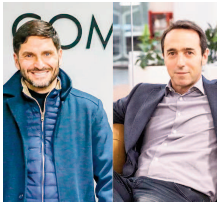
Maximiliano Pullaro y Marcos Galperin.

Este tipo de medidas provocó reacciones de otras entidades, como la Cámara Argentina Fintech, que advirtió sobre el impacto negativo de estas decisiones en la digitalización de la economía. Según la entidad, el incremento de la carga fiscal limita la formalización de la actividad económica, reduce el acceso al crédito y desalienta el uso de herramientas digitales.