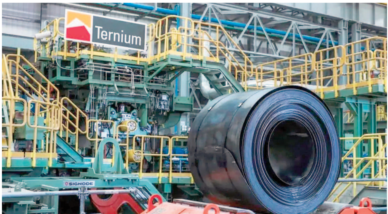
La paritaria de desarrolla en un marco complejo para la industria, con una severa y prolongada caída de la actividad y anuncios de reducción de personal.

La negociación atraviesa a los trabajadores de Ternium Siderar y a los obreros de Acindar, entre otras em-