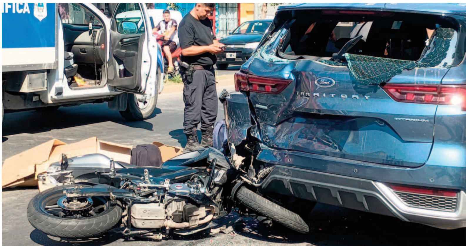
MOTOCICLISTA FALLECIÓ TRAS COLISIONAR CONTRA UNA CAMIONETA ESTACIONADA

AVENIDA SAVIO Y PAVÓN. Ayer a la tarde se registró un accidente fatal en Avenida Savio y Pavón, cuando una moto Bajaj Router NS200 colisionó contra una camioneta Ford Territory que se encontraba estacionada.