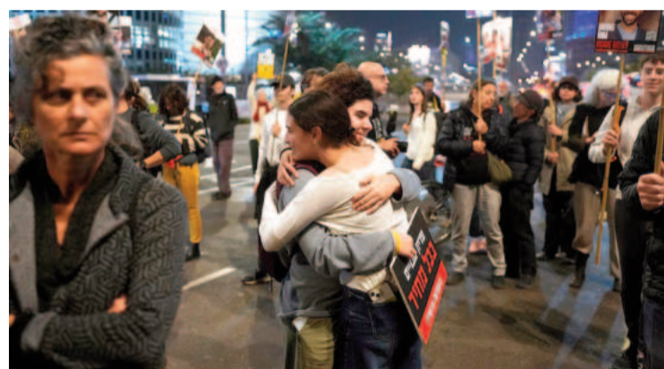
Familiares y amigos de personas asesinadas y secuestradas por Hamás y llevadas a Gaza participan en una manifestación.

Hamas desencadenó la actual guerra cuando atacó Israel el 7 de octubre de