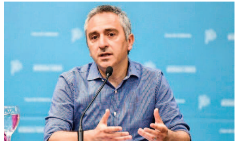
El ministro de Desarrollo de la Comunidad, Andrés Larroque.

vencimiento de los impuestos patrimoniales, que debería además liquidar a valores del año pasado si no se aprueba el proyecto de ley fiscal, lo que impactaría negativamente en la recaudación. La demora el convocar a la discusión salarial a los gremios estatales tal vez sea la materialización más temprana de esa dificultad.