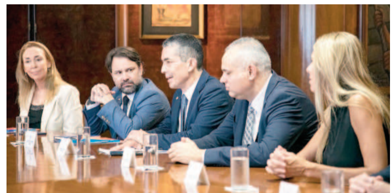
Autoridades sanitarias al efectuar los anuncios.

Durante el encuentro, también se celebró el acuerdo firmado entre la