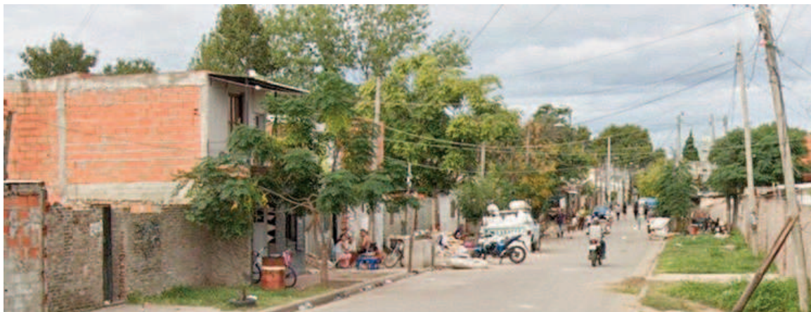
El crimen ocurrió en Rubén Darío al 2000.

resultó con una herida de bala en el lado derecho, a la altura de la cintura y con roce en el tórax, con orificio de entrada y salida.