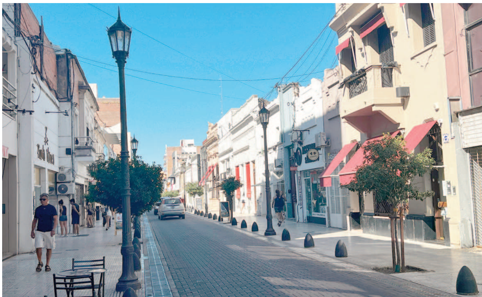
Entre los rubros predominantes, el sector alimenticio lideró con el 37% de las habilitaciones, compuesto principalmente por almacenes y dietéticas.

De cara a 2025, Rodríguez se mostró optimista, asegurando que habrá "mayor movilidad" en el sector comercial. Según el funcionario, las expectativas