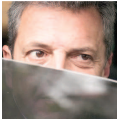
Sergio Massa le pide definiciones al Kicillof.

Respecto de la posibilidad de eliminar las PASO en el Congreso, en el massismo aseguran que la fuerza