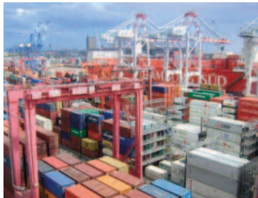
El Gobierno busca abaratar las importaciones.

"Las bicicletas cuentan con medidas antidumping desde hace más de 20 años, lo que encarece su precio. Lo mismo ocurre con productos como planchas eléctricas y calefactores, que tienen precios mucho más altos que en otros países: las planchas cuestan más de $100.000, mientras que en Europa valen menos de la mi-