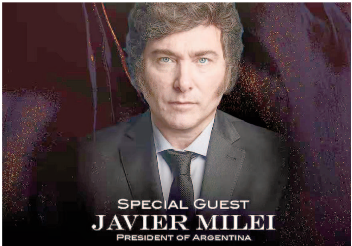
Javier Milei nuevamente reconocido.

«El liderazgo del presidente Milei es un poderoso ejemplo de coraje y convicción en el escenario mundial. Su presencia subraya los valores compartidos de libertad, oportunidad y resiliencia que honramos en esta celebración histórica», agregaron.