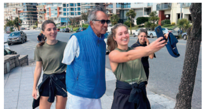
Daniel Scioli en la "Ciudad Feliz".

otros vamos a plebiscitar la gestión. Así que no importa tanto que los candidatos sean tan buenos o conocidos, lo que importa es la marca de La Libertad Avanza", dijo un funcionario del riñón karinista. En el incierto escenario electoral del oficialismo, ayer Martín Menem pareció contradecir la línea de Santiago Caputo y Karina Milei. Mientras que en la Casa Rosada patearon cualquier definición sobre un acuerdo con PRO después de los mensajes cruzados entre Javier Milei y Mauricio Macri y dejaron en vilo a los amarillos, el titular de la Cámara de Diputados habló con bastante certeza de la viabilidad de un pacto: "Seguro vamos a confluir electoralmente con el PRO. Ese es mi deseo. Además, hemos trabajado todo 2024 espalda con espalda con el PRO y han sido incondicionales con las ideas que estamos llevando adelante y este 2025 va a ser de la misma manera", aseguró.