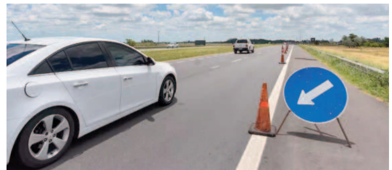
El Ejecutivo comenzó la privatización de las rutas nacionales.

Por su parte, el Gobierno consideró: "Con el fin de reducir el gasto público resulta conveniente delegar