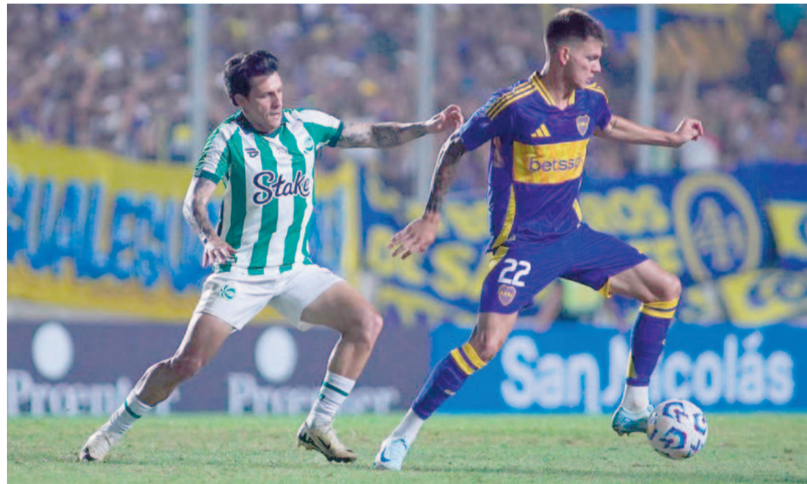
El equipo de la ribera comenzó el año ganando ante miles de nicoleños.

Con un tanto de Kelvi en contra y otro de Merentiel, el equipo de Gago se impuso por 2 a 0 sobre el equipo brasileño en un estadio repleto. El Xeneize contó con la vuelta de Blondel.