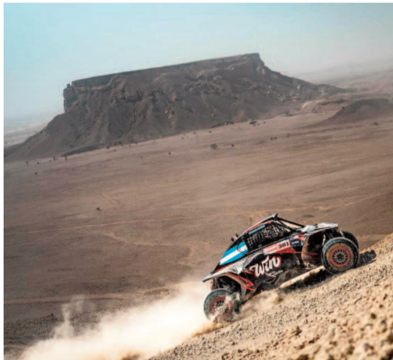
Cavigliasso está a un paso de quedarse con el título en Challenger. NA

Este resultado le permitió al argentino mantenerse cuarto en la clasificación general, donde se en-