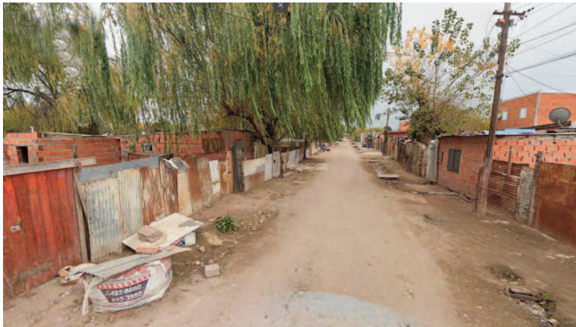
En el pasaje San Francisco de Asís al 2400 ocurrió la muerte.