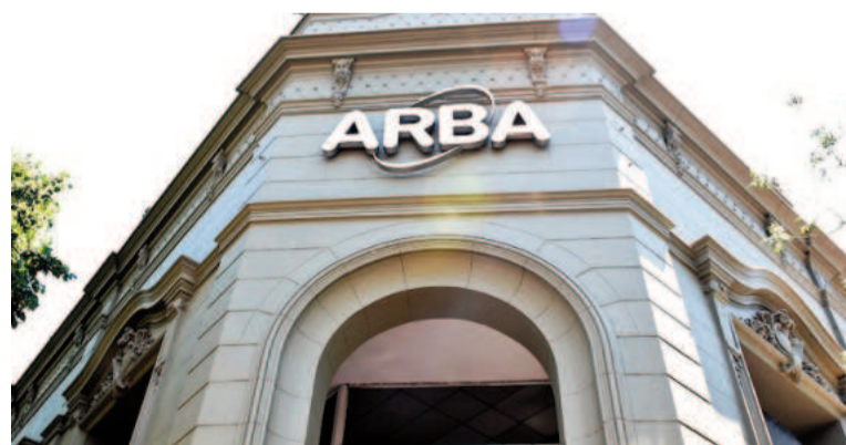
La sede de ARBA en La Plata.

cularidad: el vencimiento de febrero del Inmobiliario podría retrasarse unas semanas y pasarse a marzo, mes en el que también comienzan los vencimientos de patentes, debido a que deben readaptar la liquidación