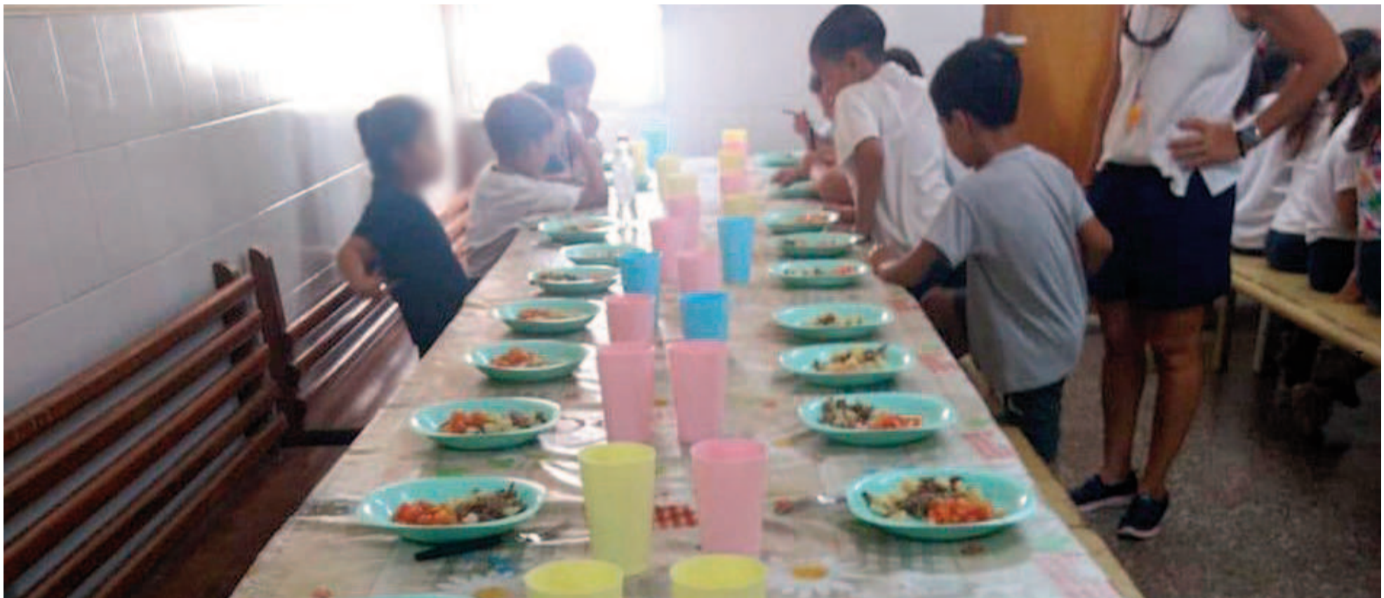
Crece la demanda de Servicio Alimentario Escolar por parte de instituciones educativas nicoleñas.