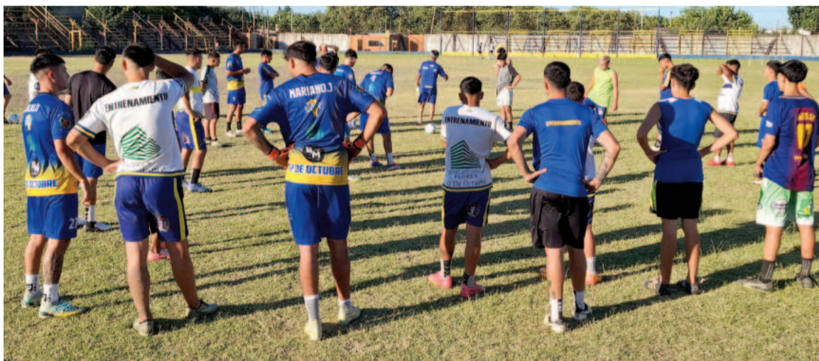
12 de Octubre entrena todos los días con más de 25 futbolistas en el plantel.

El fin de semana del 18 de enero se pondrá en marcha una nueva edición de la Copa Federación, el certamen que organiza la Federación Norte de Fútbol y que otorga al campeón un lugar en el Torneo Regional Amateur 2025. Participarán 38 clubes que se dividirán en 10 zonas: 8 de 4 equipos y dos de tres equipos. La Liga Nicoleña tendrá tres representantes: 12 de Octubre y Argentino Oeste compartirán el grupo 8 con Provincial de Pergamino y Juventud Obrera de Manuel Ocampo. Matienzo, en tanto, jugará uno de los triangulares, el grupo 10, con Agricultores de Gobernador Castro e Independencia de San Pedro. Jugarán todos contra todos a dos rondas en cada grupo, y los ganadores de cada uno (10 equipos) clasificarán directamente para octavos de final. Todos los segundos, más los dos mejores terceros de los grupos de cuatro equipos (12 clubes en total), jugarán un repechaje de 16avos de final, a un solo partido.