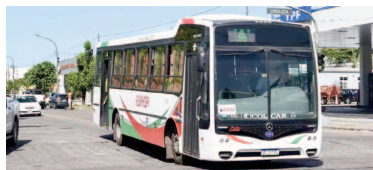
Con el mismo dinero que un nicoleño destina a un pasaje de colectivo, un usuario de CABA puede hacer tres viajes.

A lo largo de 2024, el pasaje nicoleño acumuló un incremento del 336% hasta llegar a su actual valor de $1161. El primer aumento se había aprobado en febrero y había sido del 159%. Llevó el pasaje local de $266 a $690. A partir