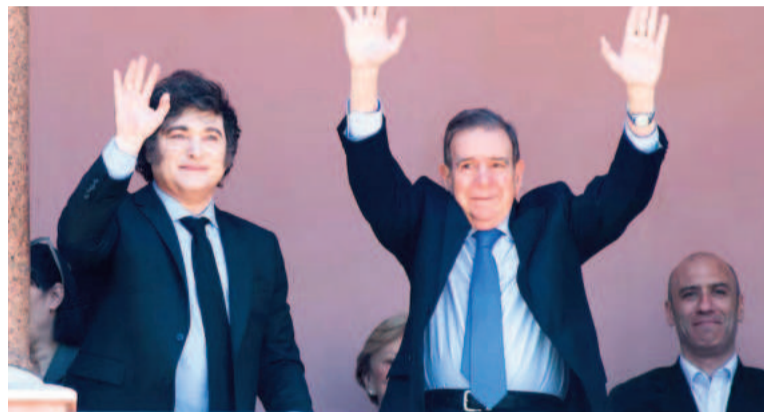
Milei y González Urrutia en el balcón de la Rosada.

González Urrutia no puede pisar Venezuela, acusado de los delitos de conspiración, usurpación de funciones, forjamiento de documentos, desconocimiento a las instituciones del Estado e instigación a la desobediencia