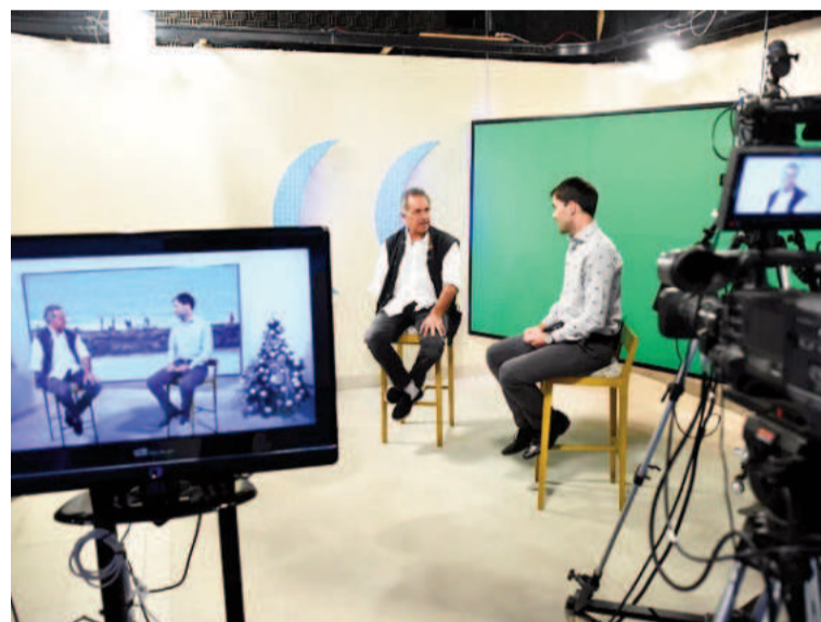
Daniel Scioli en los estudios de Canal 2 de Mar del Plata.

El inicio de la temporada de verano fue uno de los temas en los que