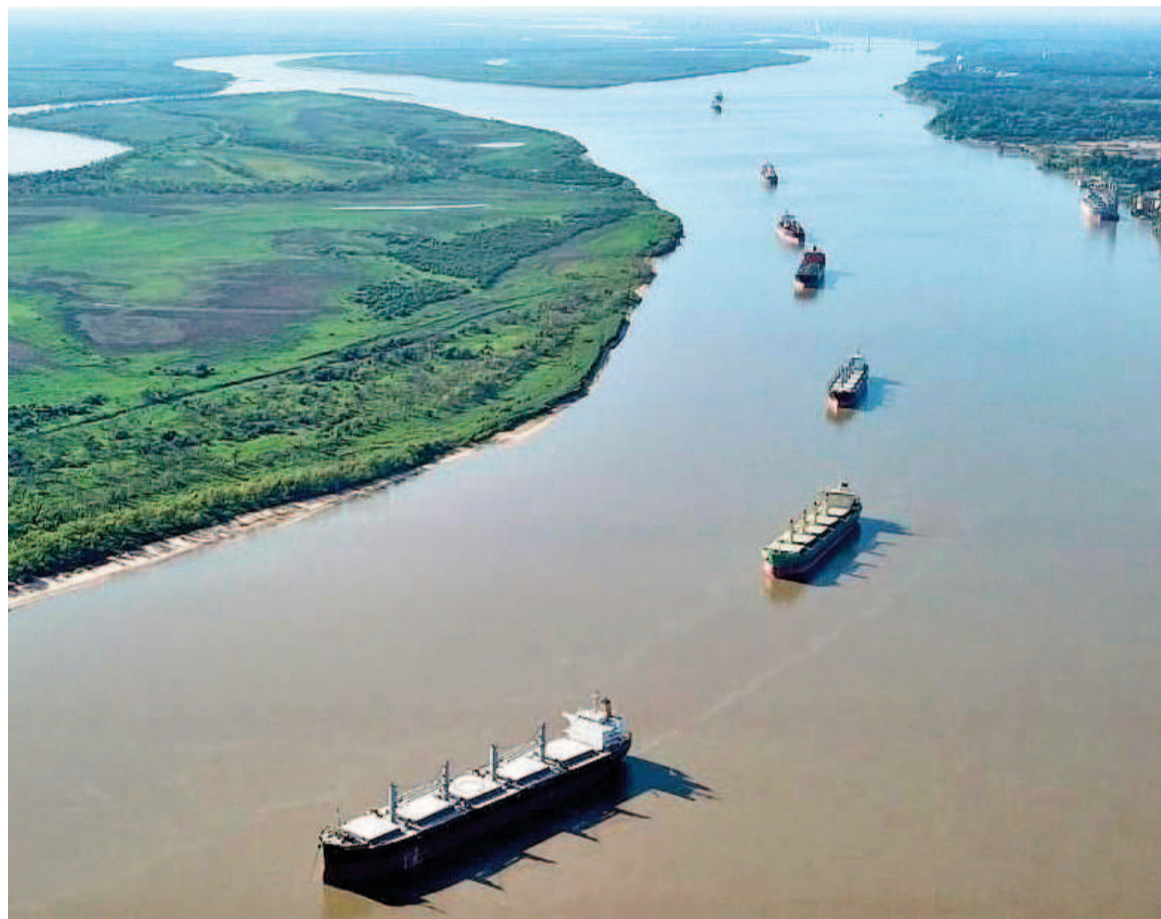
La Agencia Nacional de Puertos y Navegación estará a cargo de la Hidrovía.

Uno de los organismos a los que refiere el funcionario es la Subsecretaría de Puertos y Vías Navegables, área administrativa encargada de la licitación de la Hidrovía Paraná-Paraguay, que aún continúa vacante y representa una de las principales rutas comercia-