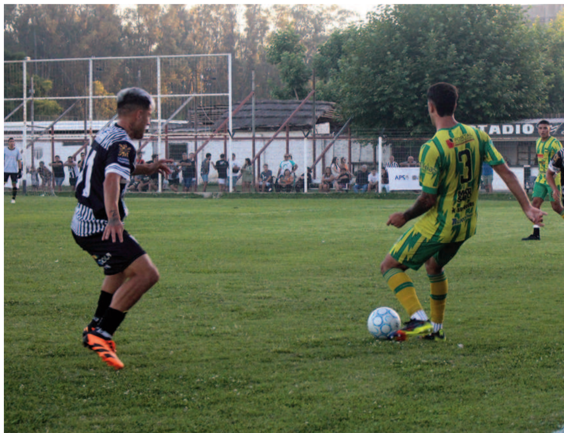
El Pañero buscará un triunfo como visitante. EL NORTE

En la ida el equipo de Brandsen se impuso por 1 a 0, por lo que el team azul naranja deberá preva-