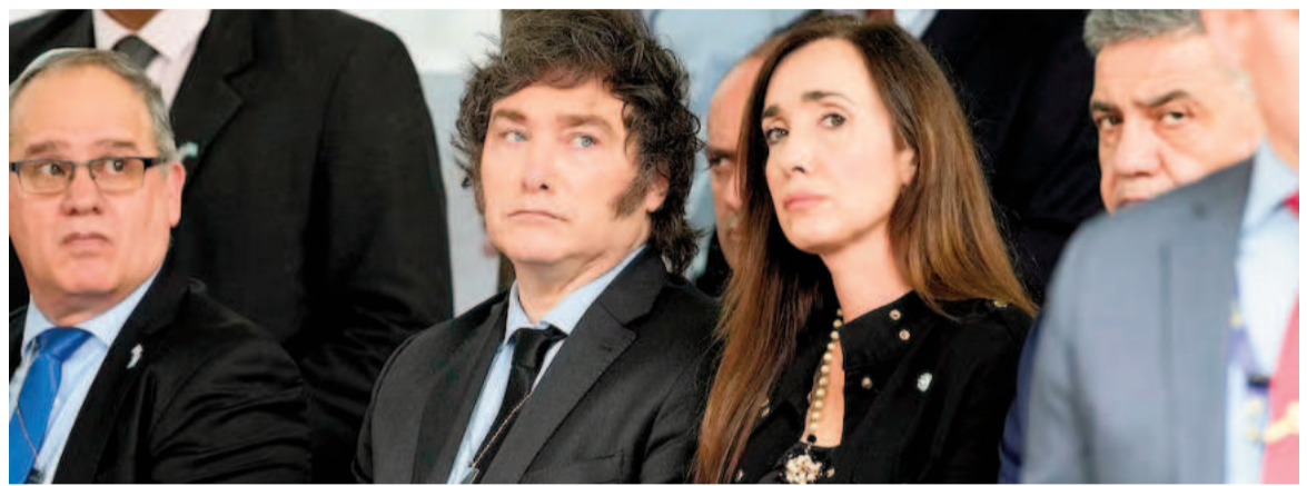
Milei - Villarruel, una relación rota.

“Soy la que menos cobra de todos los funcionarios de primer nivel”, sostuvo la vice.