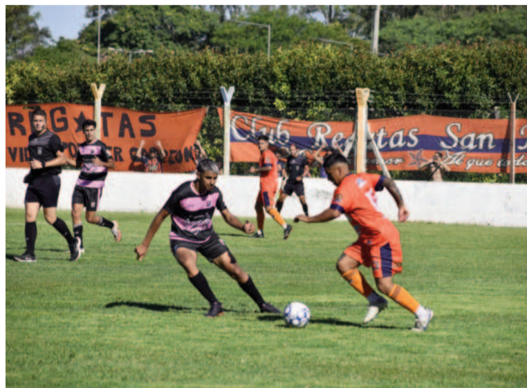
El Náutico tendrá un rival de riesgo esta tarde. EL NORTE

Por su parte el Lobo, que es dirigido por el ex arquero Alberto Salvaggio, tras adueñarse de la zona 12 escoltado por Bragado Club, dejó en el camino a Colón de Chivilcoy, Atlético Roque Pérez y Náutico Ha-coaj de Tigre. A este último lo goleó