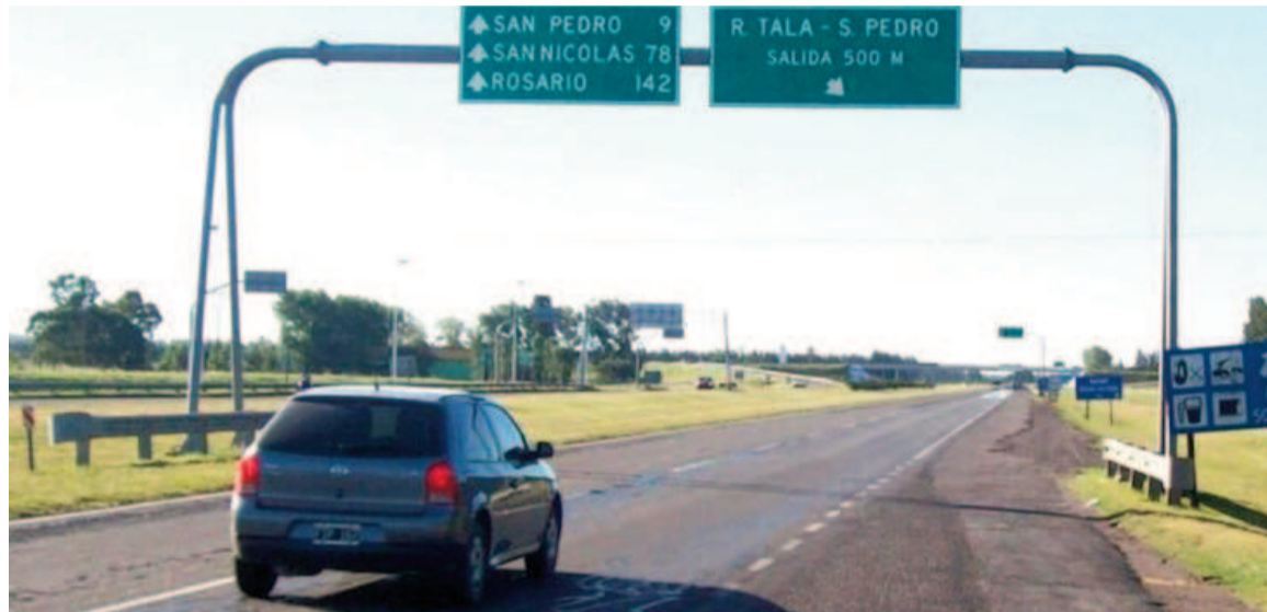
La inversión sería de 600 millones de dólares.

La compañía le reclama al Estado Nacional unos 300 millones de dólares y aduce un incumplimiento del contrato y atraso de tarifas. CRUSA propuso obtener una extensión del contrato y a cambio dar de baja su juicio contra el Estado. En la discusión está incluido el aumento del peaje de Zárate en