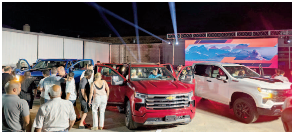
Durante la exposición, los presentes pudieron conocer en detalle las principales características de cada modelo. EL NORTE

destacando aspectos como tecnología, confort y prestaciones de alta performance. El evento combinó un ambiente festivo con una muestra de excelencia automotriz. Los asistentes tuvieron la oportunidad de interactuar con cada vehículo, apreciar su diseño innovador y recibir información de primera mano sobre las novedades que Chevrolet tiene para ofrecer.