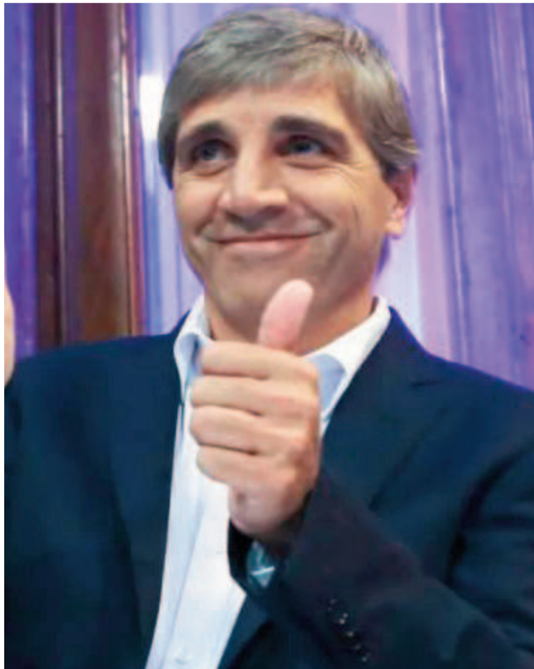
El ministro Luis Caputo.