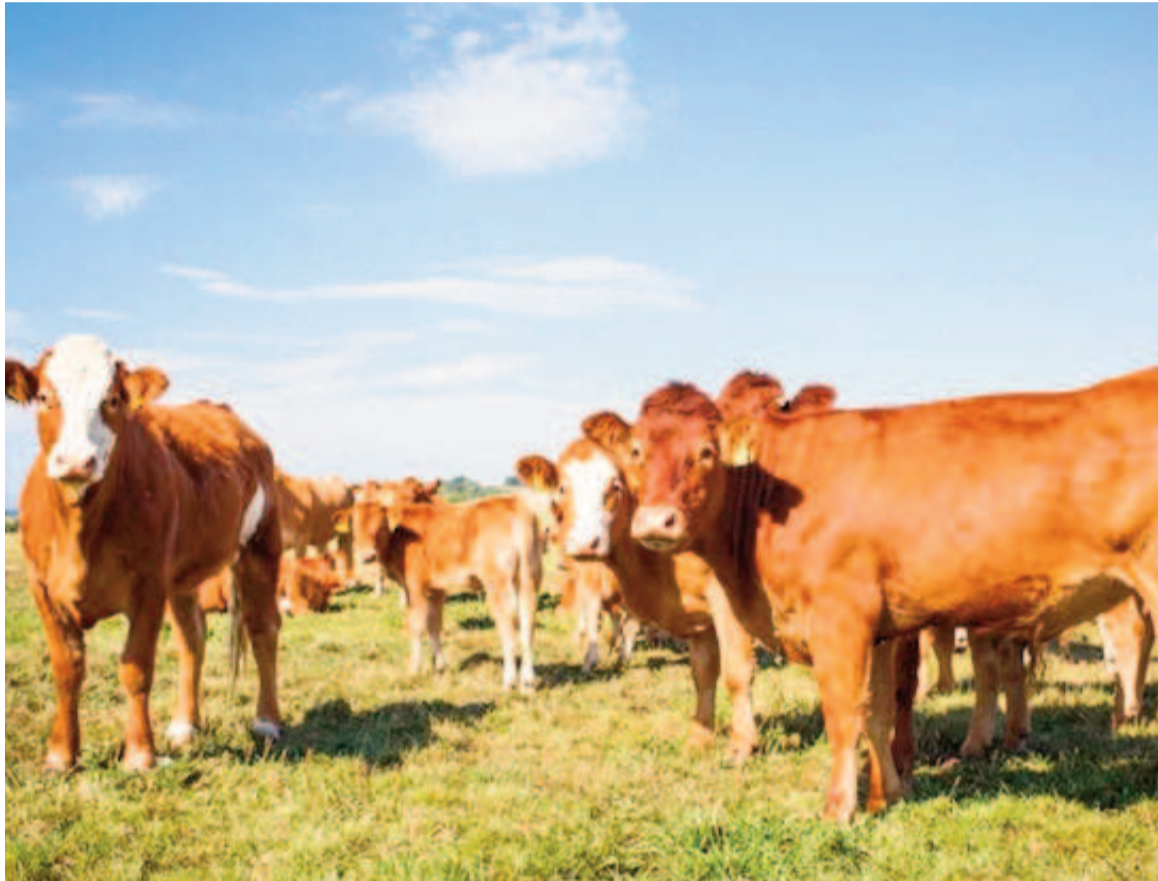
Se detectaron casos de aftosa en Alemania.

La medida responde a la alerta sanitaria emitida por el Ministerio de Agricultura de Alemania y notificada a la Organización Mundial de Sanidad Animal (OMSA). Según informó el organismo alemán, se detectaron tres casos de fiebre aftosa en búfalos de agua en el distrito de Märkisch-Oderland, en la región de Brandeburgo. Ante esta situación, la Autoridad Veterinaria alemana activó protocolos de contención, que incluyen la delimitación de zonas de protección y vigilancia, y la prohibición de movimiento de animales desde el área afectada. En línea con estas acciones, el Senasa determinó la suspensión de las importaciones de semen bovino y de productos y subproductos de ori-