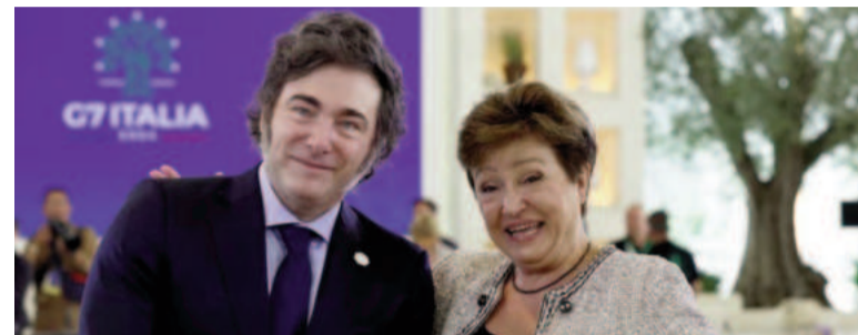
Georgieva elogió al gobierno de Milei.

La deuda argentina representa el 27,7% de la cartera de créditos pendientes de pago del organismo. Se trata de una deuda muy significativa, considerando que el siguiente deudor del