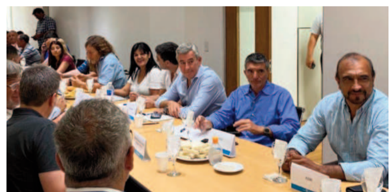
Gremios le piden al gobernador que reabra las paritarias.

Cabe recordar que en diciembre pasado los estatales y docentes de la provincia no tuvieron aumento, por lo que el último reajuste de salarios que se otorgó fue en el mes de noviembre.