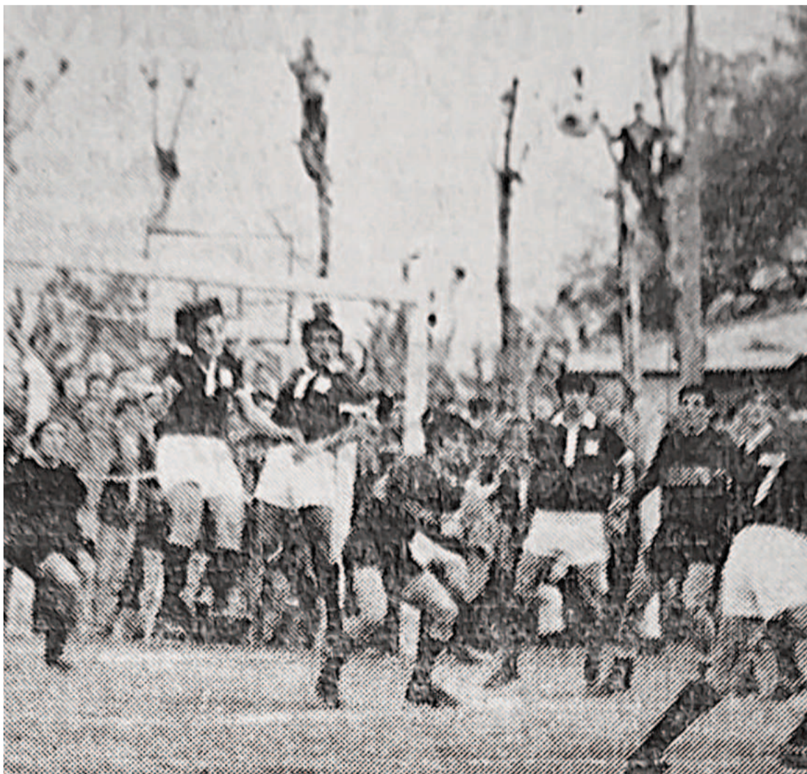
Boca se presentó en San Nicolás por última vez en 1971, en cancha de Paraná.