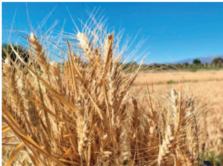
Malas noticias para los campos bonaerenses.

En Baradero y San Pedro la situación de los cultivos es crítica. Según los asesores, los maíces de primera están ya en grano, casi pastoso, un tercio de diente,