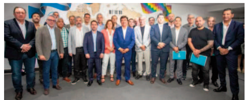
Integrantes de la FAM.

7. Ambiente: afectaría la implementación de políticas ambientales clave, como la gestión de residuos, el reciclaje, y la protección de los espacios verdes y la biodiversidad. Por otra parte, el comunicado expresa la “preocupación” de los alcaldes por las políticas del Gobierno y recomiendan que el ministro debería apuntar a: