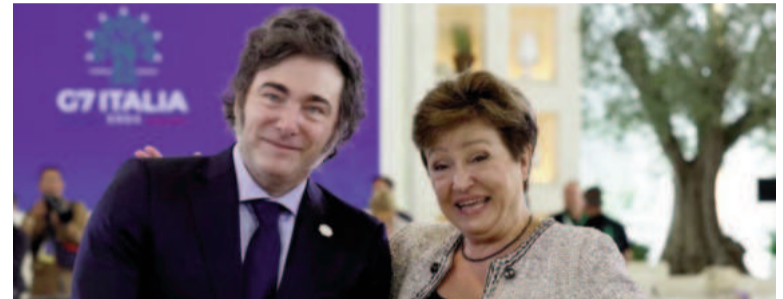
Georgieva elogió al gobierno de Milei.

La deuda argentina representa el 27,7% de la cartera de créditos pendientes de pago del organismo. Se trata de una deuda muy significativa, considerando que el siguiente deudor del