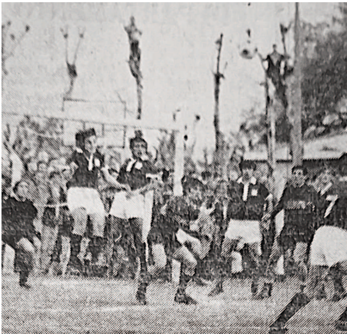
Boca se presentó en San Nicolás por última vez en 1971, en cancha de Paraná.