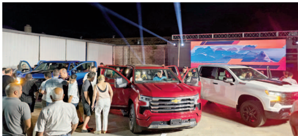
Durante la exposición, los presentes pudieron conocer en detalle las principales características de cada modelo. EL NORTE

destacando aspectos como tecnología, confort y prestaciones de alta performance. El evento combinó un ambiente festivo con una muestra de excelencia automotriz. Los asistentes tuvieron la oportunidad de interactuar con cada vehículo, apreciar su diseño innovador y recibir información de primera mano sobre las novedades que Chevrolet tiene para ofrecer.