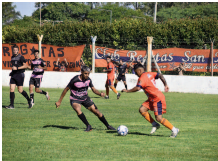
El Náutico tendrá un rival de riesgo esta tarde. EL NORTE