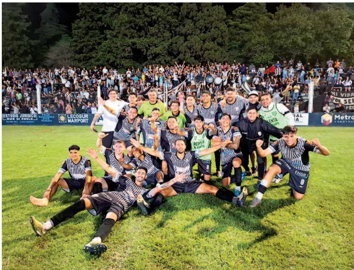
El Pañero ganó los dos partidos frente a los somiseros y ahora va en busca del título.