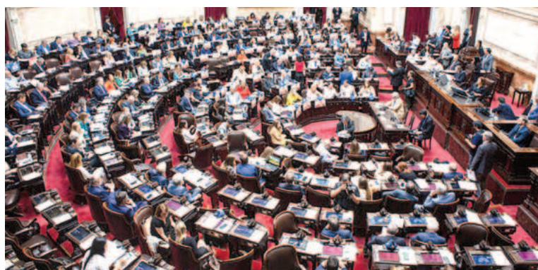
La fallida sesión dejó tensiones entre los partidos de Macri y Milei.

En un tono más agresivo, el partido de Milei respondió a las acusaciones del PRO, calificándolas de «mentiras» y «oportunismo político». La Libertad Avanza argumentó que la sesión estaba destinada al fracaso