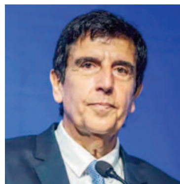
Melconian advirtió sobre retrasar tarifas y tipo de cambio.

«Está claro que a este tipo de cambio no le sobra mucho, aunque tampoco es