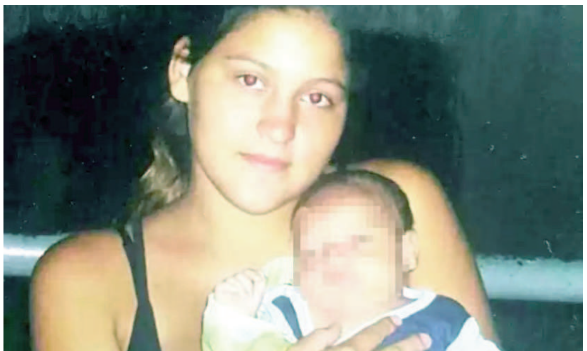
El femicidio de Rocío Gómez se cometió en 2011. Su bebé fue encontrado abandonado en cercanías del campito de la Virgen de San Nicolás.

"Me enteré de cómo fue su muerte cuando llegué a la adolescencia, mi papá había preparado una carpeta