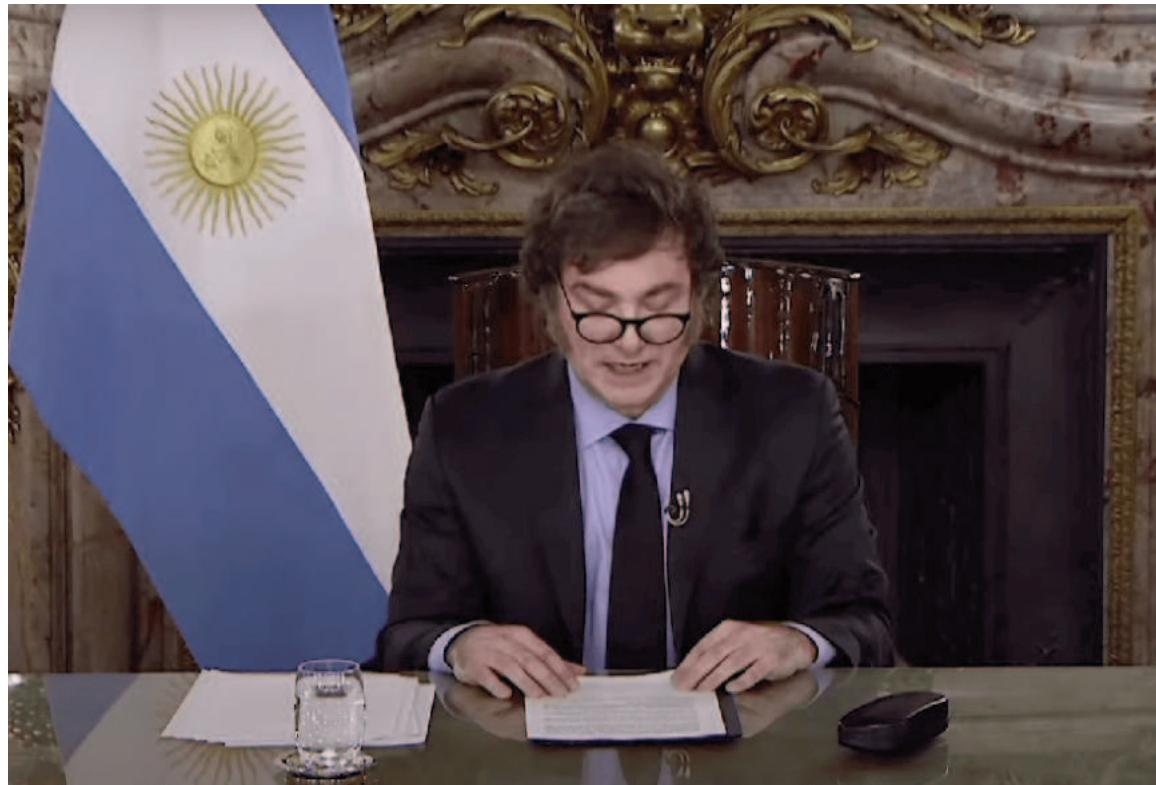
El presidente Javier Milei prepara cadena nacional.

En esa misma jornada, aunque no de manera conjunta, el Presidente de la Nación sostendrá encuentros con cinco economistas reconocidos a nivel global, entre ellos Tom Sargent, ganador del Premio Nobel de Economía en 2011