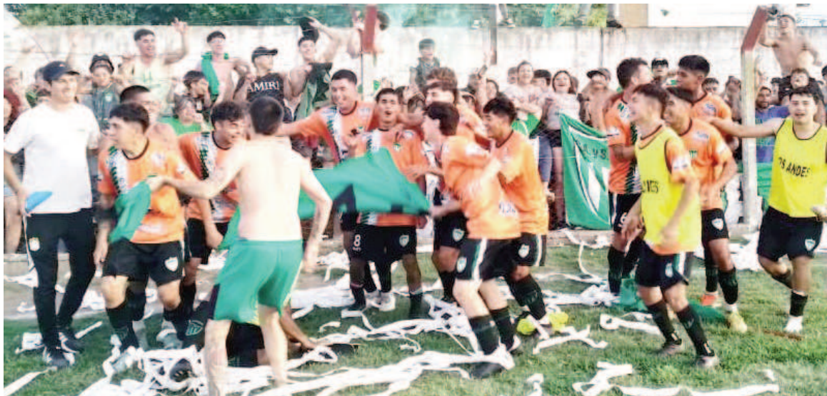
El Verde de Villa Ramallo jugará la segunda final de su historia.