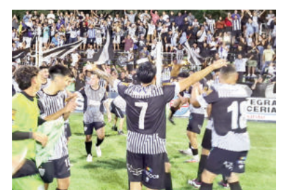
Deportes 24 y 25

La Emilia y Los Andes, finalistas del torneo Clausura