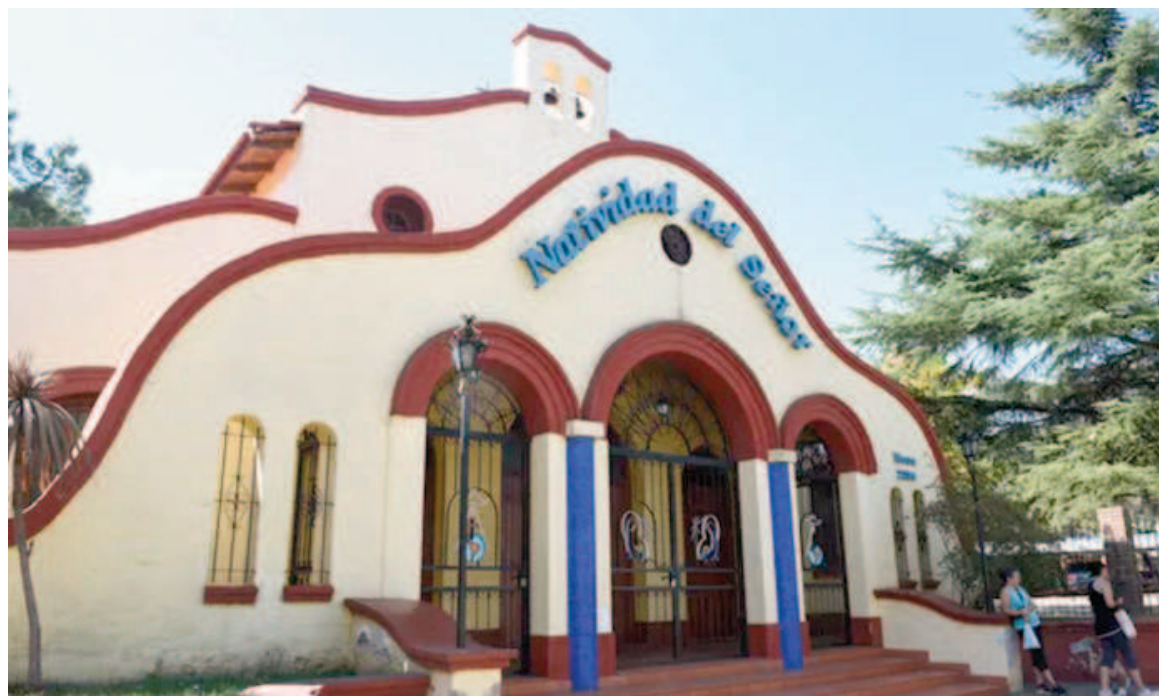
La parroquia Natividad del Señor fue blanco de un ataque.