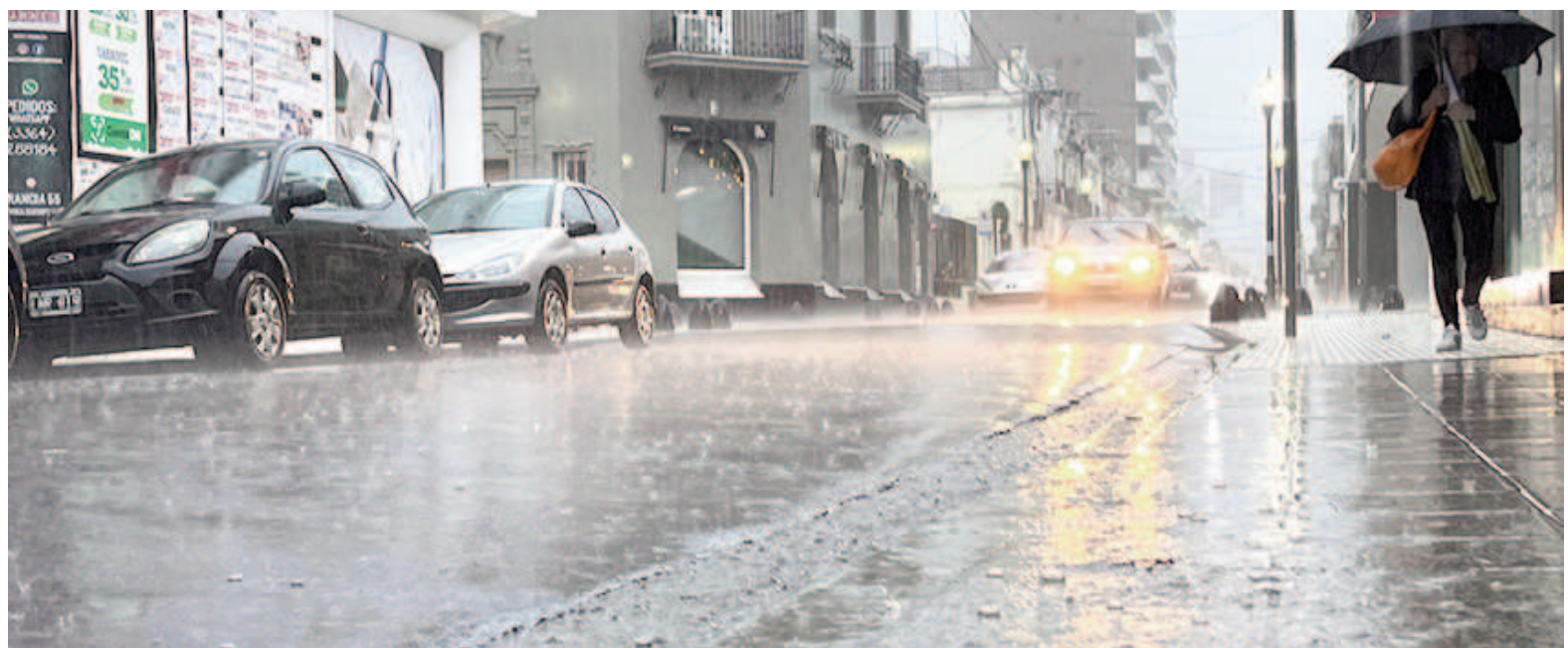
Hoy domingo se prevén valores de precipitación acumulada entre 20 y 60 mm, pudiendo ser superados en forma puntual.

Como siempre, se recomienda no sacar la basura, evitar actividades al aire