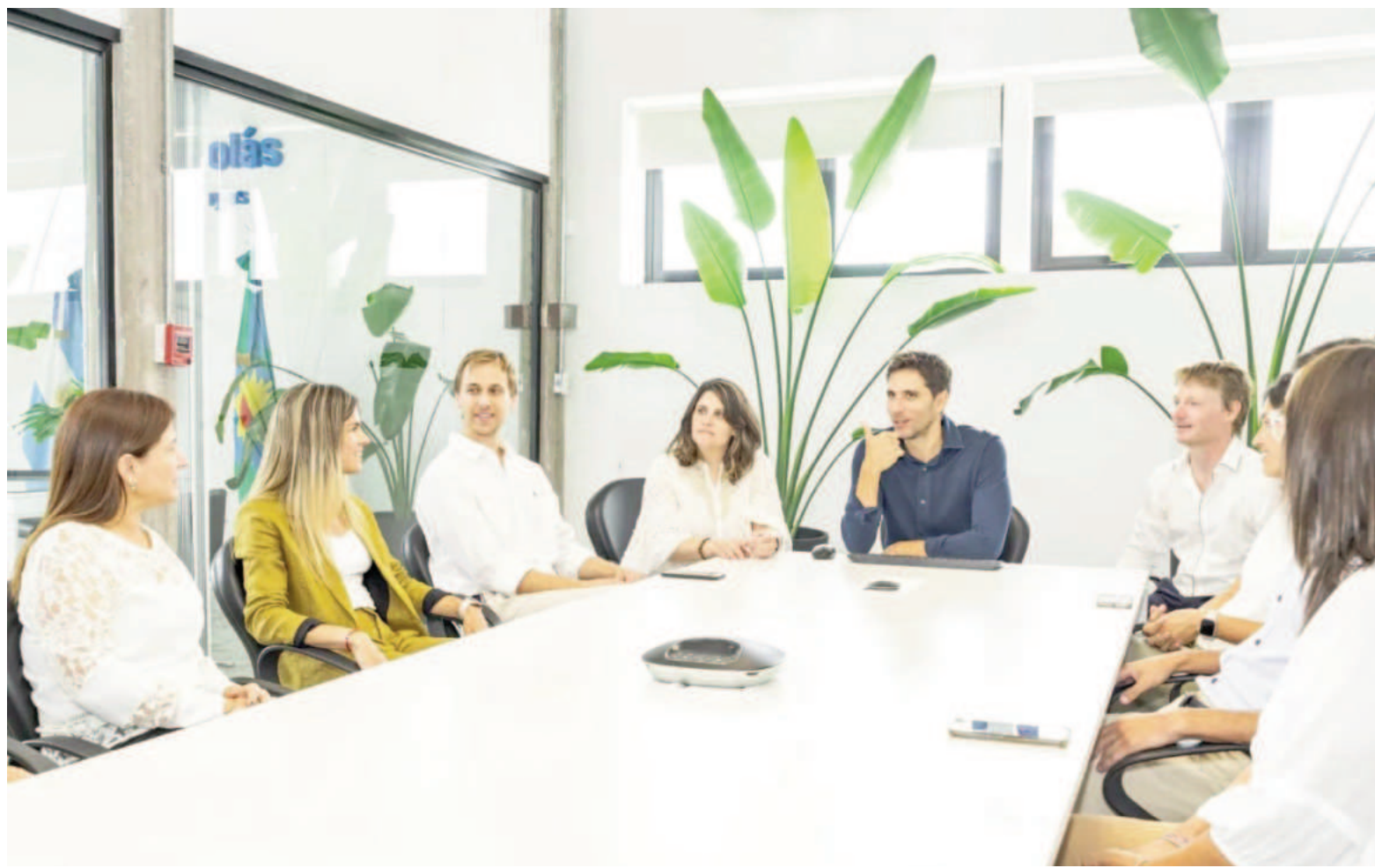
Desde el gobierno municipal indican que el RIGI representa una herramienta fundamental para atraer capitales destinados a proyectos industriales.

El quinto artículo de la iniciativa local faculta al Departamento Ejecutivo Municipal para suscribir con el Estado Nacional los convenios pertinentes.