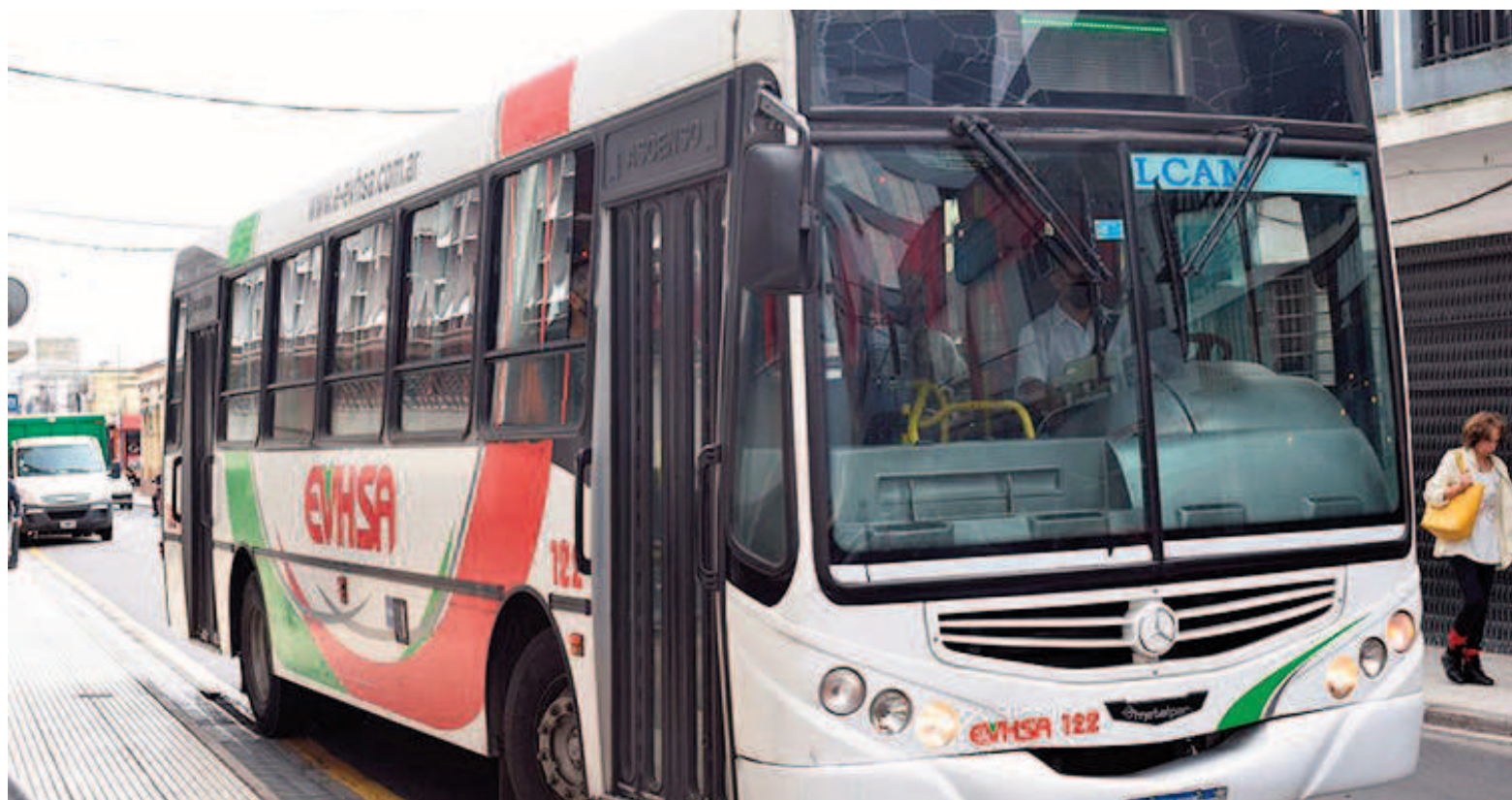
Desde hoy domingo 1º de diciembre, el transporte público en San Nicolás tendrá un incremento del 5,93% en sus tarifas.

Cuando el 10 de diciembre pasado se iniciaba en el país la era Milei, el boleto de colectivo costaba en San Nicolás $266. Hacia fines de febrero de este año el Concejo Deliberante de San Nicolás aprobaba un incremento del 159%. Pasaba a costar $690. Y a partir de entonces comenzaba a implementarse el actual sistema tarifario, con valores atados a revisiones mensuales por inflación. El pasaje de $690 pasó a $772 cuando se le aplicó el IPC de febrero (11,3%). Y después a $859 en virtud del IPC de marzo (11,3%). Llegarían luego los IPC de abril (8,8%) y mayo (4,0%), que se aplicaron juntos llevando la tarifa de $859 a $969,27. Y luego, la actualización a $1096,09 tras la aplicación –en conjunto y de manera acumulativa– de los IPC de junio, julio y agosto, hasta el aumento que rige desde hoy, de $1161,23.