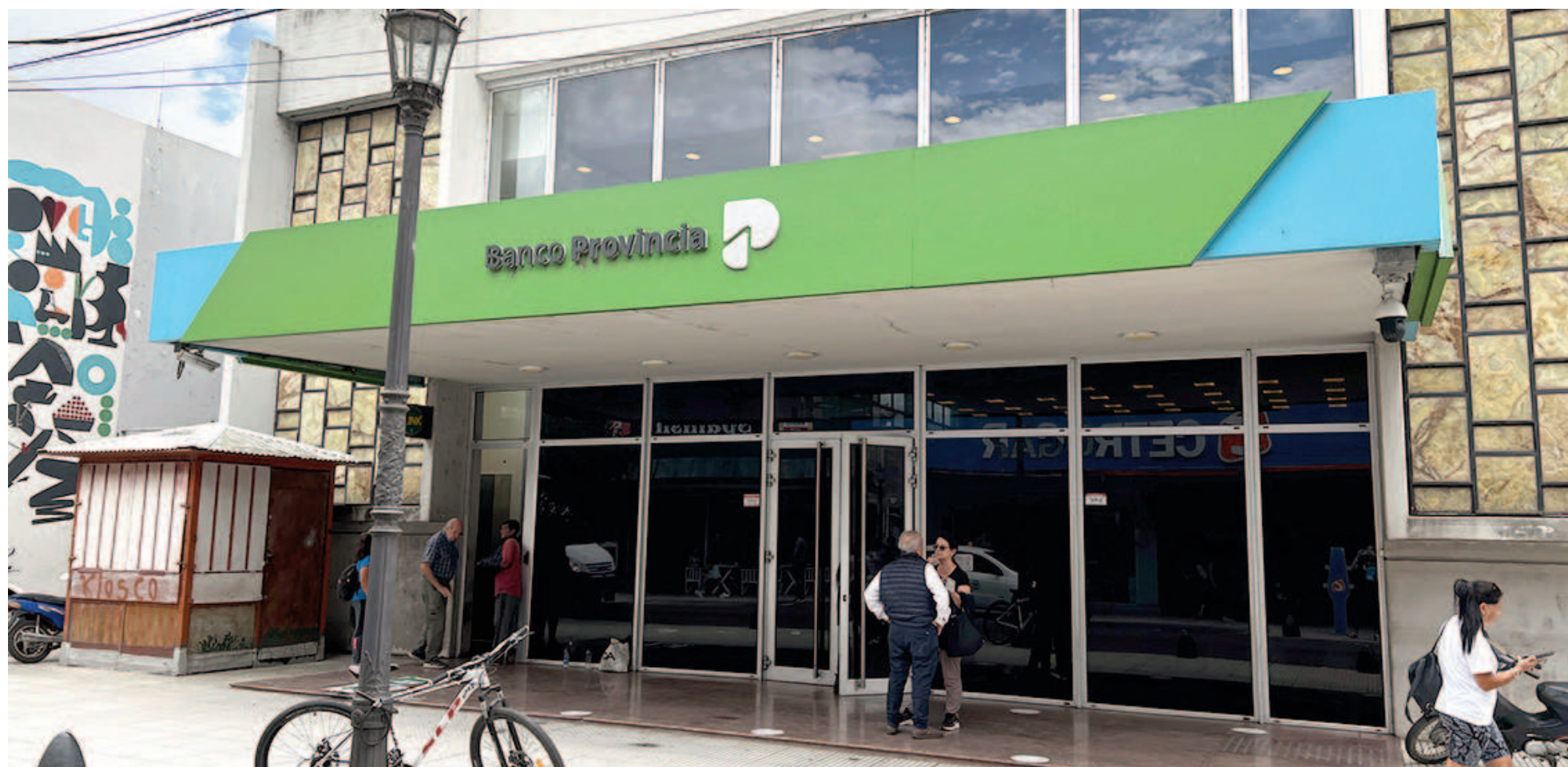
Las autoridades centrales del Banco Provincia advirtieron que “el inconveniente afectó a menos del 2% de las tarjetas de crédito del banco”.

Cientes del Banco Provincia en todo el suelo bonaerense sufrieron débitos excesivos en sus cuentas por pagos de sus tarjetas de crédito. Desde la entidad indicaron que se debió a un error de sistema y que el dinero ya fue reintegrado. En San Nicolás unos 570 clientes de la sucursal de calle Mitre registraron los movimientos irregulares.