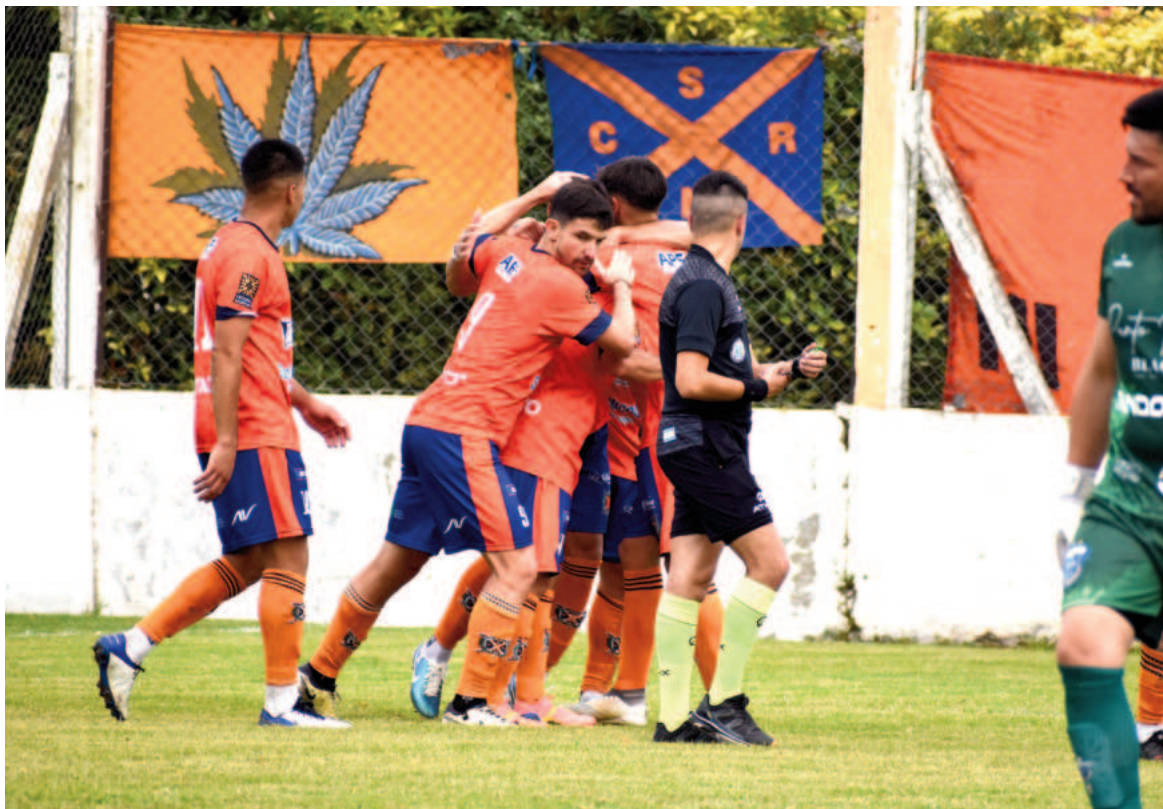
Regatas buscará ganar en el partido de ida ante los sampedrinos.

En el marco de los partidos de ida por octavos de final de la Región Pampeana Norte, Regatas recibirá a Mitre de San Pedro y La Emilia será local ante Gral. Rojo.