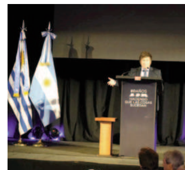
El presidente Javier Milei recibió un premio.

Luego de participar en la capital uruguaya de la LXV Cumbre del Mercosur y Estados Asociados, el presidente destacó en el marco de la premiación