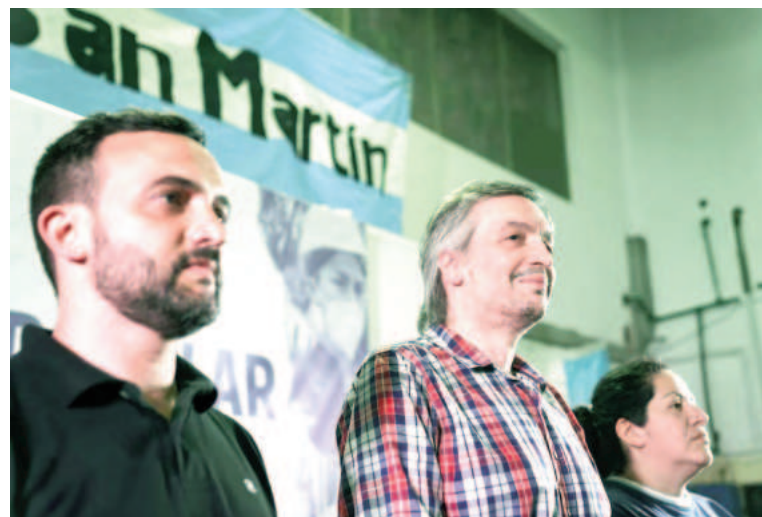
Máximo Kirchner hizo un llamado a la unidad del peronismo.

De este modo, Kirchner hizo un llamado: "Tenemos que organizarnos y patear la puerta del desánimo para que cuando llegue el momento en que un argentino o argentina con