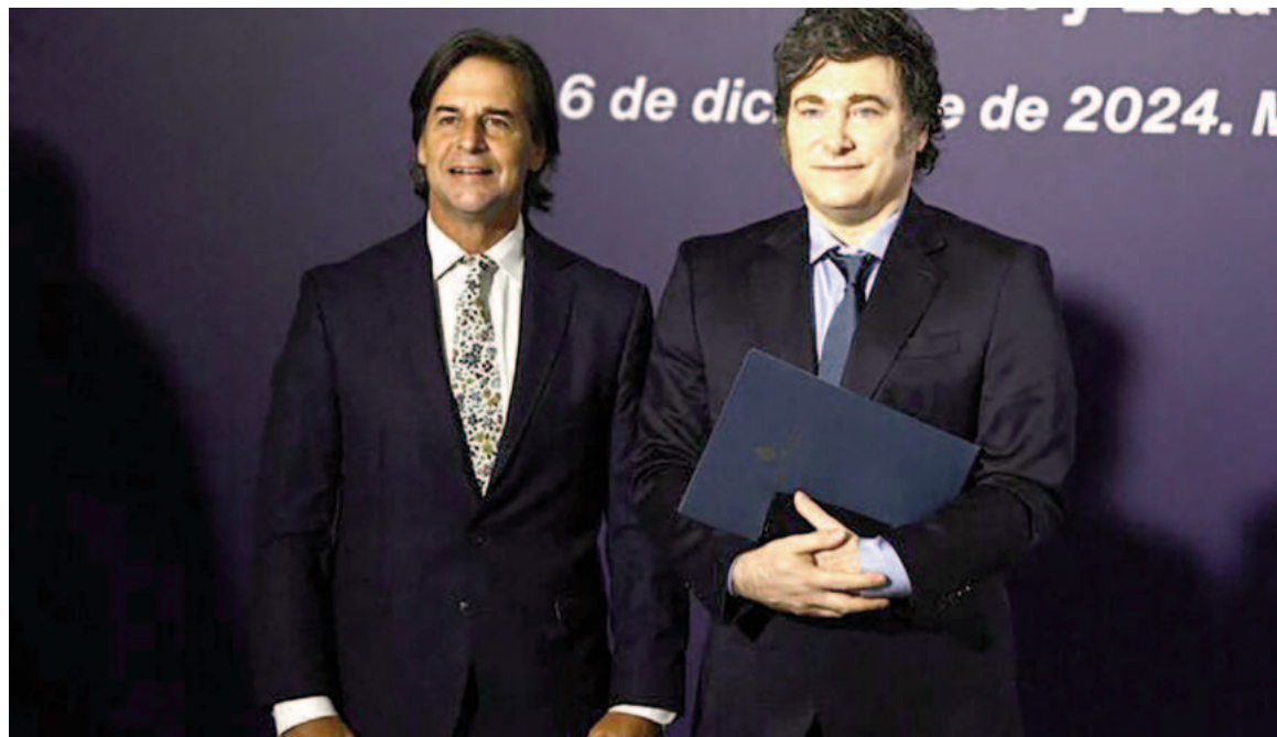
Milei reemplazó a Lacalle Pou al frente del Mercosur.

Pese a sus críticas, echó por tierra las chances de romper con el bloque, aunque deslizó la posibilidad de "disolución" de mantenerse el funcionamiento actual del bloque. "Tenemos dos caminos: o aceptamos que el Mercosur no funciona y lo disolvemos, lo cual no es la voluntad del gobierno argen-