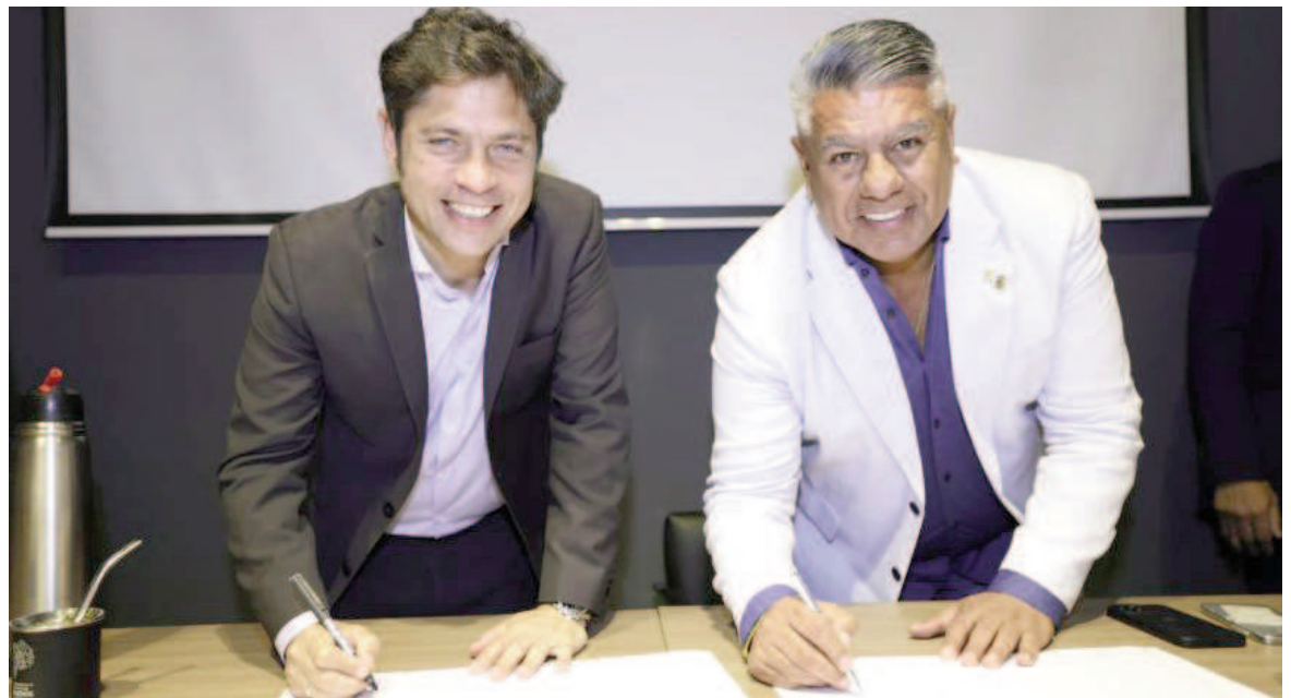
El Gobernador Axel Kicillof y el presidente de la AFA, Claudio «Chiqui» Tapia.

La idea es reposicionar al estadio como sede deportiva, apuntando como objetivo de máxima a que la selección mayor dirigida por Lionel Scaloni juegue un partido de eliminatorias rumbo al Mundial 2026 en junio o septiembre. En esos meses Argentina recibirá a Co-