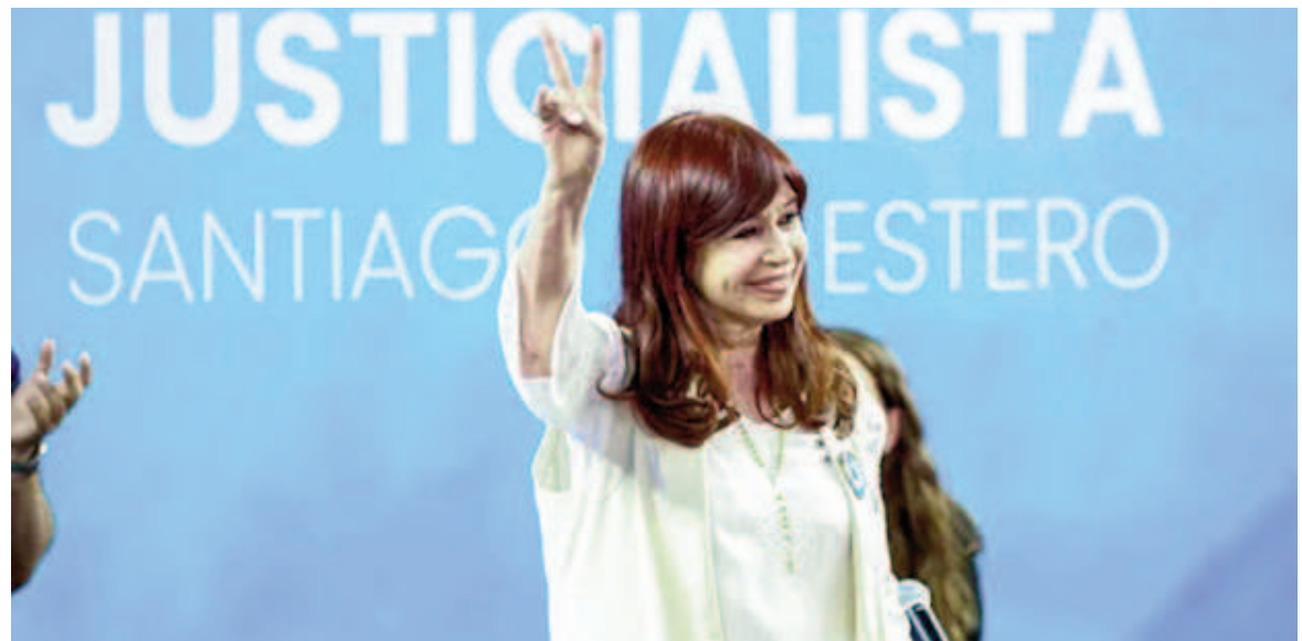
La ex mandataria Cristina Kirchner asumirá el miércoles como presidenta del PJ.

Fuentes partidarias indicaron a la Agencia Noticias Argentinas que la presencia de Fernández de Kirchner está «confirmada», mientras Massa ultimaba detalles y Ki-