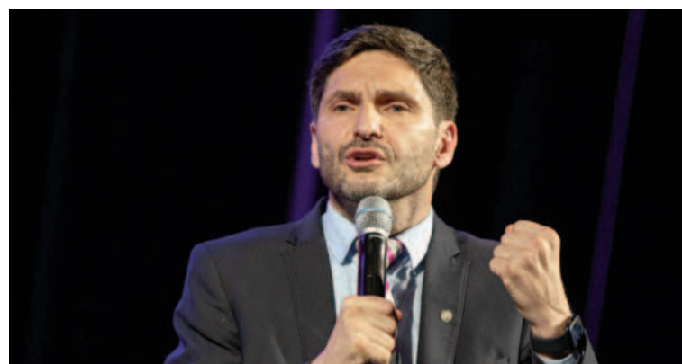
Habilitaron la reelección de Pullaro.

Desde el gobierno santafesino adelantaron que "el espíritu de la reforma es modernizar un texto que tiene más de 60 años y está desactualizada respecto de los cambios que necesita hoy la so-