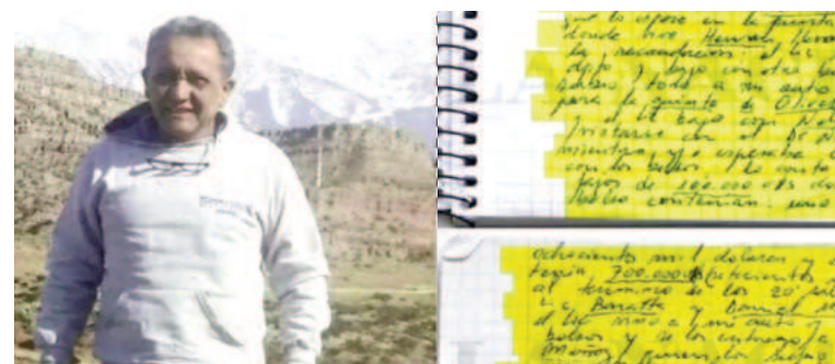
El juicio por los Cuadernos comenzará el 6 de noviembre de 2025.