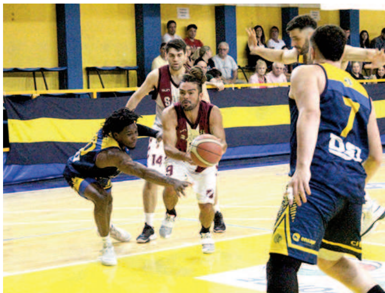
Sacachispas no pudo con Los Indios en Junín.

Por otro lado, en la Región Sur, por la etapa reclasificatoria, ascendió Centro Basko de Necochea (superó por 2 a 0 a Racing de Olavarría),