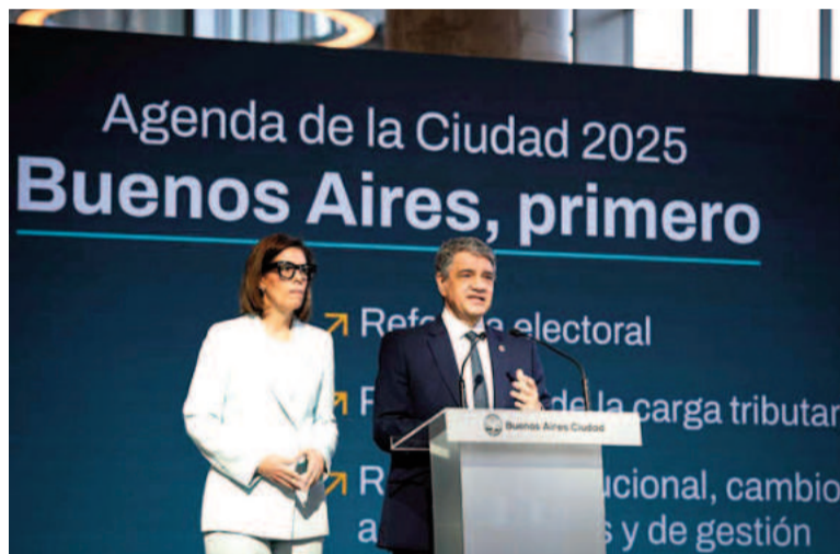
El jefe de Gobierno porteño, Jorge Macri junto a Laura Alonso.

Además, indicó: "Queremos que ese dinero no salga del bolsillo de los porteños y podamos utilizarlo en otras prioridades. Que ellos puedan elegir a sus legisladores sin tener que pagar el costo de un mecanismo que la política tiene que poder resolver hacia adentro, construyendo sus propios consensos y acuerdos internos". "Con el jefe del Gabinete nacional, Guillermo Francos, coincidimos en el ahorro de 200.000 mil millones de pesos que significaría eliminarlas. Los argentinos no podemos darnos el lujo de gastar ese dinero cuando hay otras prioridades más relevantes", aseveró.