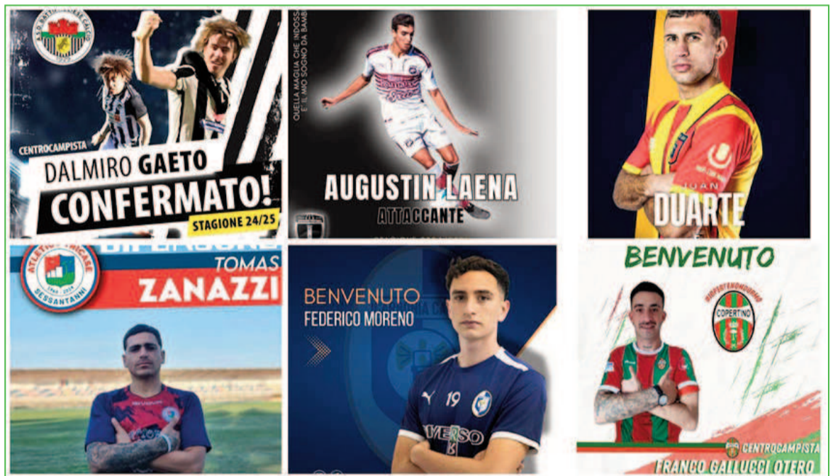
Benvenuti a tutti! Los futbolistas de nuestra Liga desembarcan en Italia. WEB