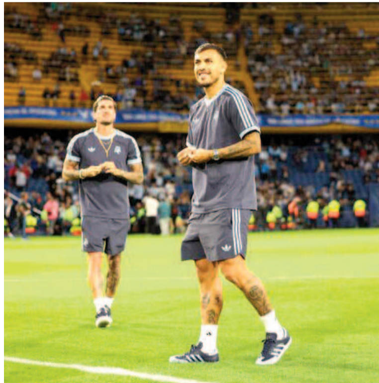
El club de la ribera quiere que regrese Leandro Paredes.

Así las cosas, la decisión en Boca es clara y es la de avanzar fuerte por el futbolista bicampeón de América y campeón del mundo. De todas maneras, si por algún motivo las charlas no prosperaran, el ofrecimiento del Xeneize seguirá en pie para junio, momento en el que, de no darse antes, seguramente se concretará el