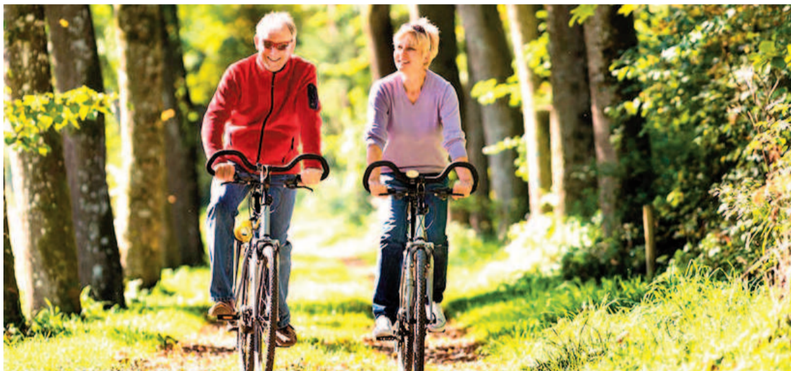
Realizar al menos 150 minutos semanales de ejercicio aeróbico de intensidad moderada a vigorosa se asocia con reducciones significativas en el peso corporal y la grasa acumulada.

En este contexto, un metanálisis reciente publicado en JAMA Network Open analizó 116 ensayos clínicos aleatorizados, involucrando a 6880 adultos con sobrepeso u obesidad, para explorar los efectos del ejercicio aeróbico en la reducción de peso y grasa corporal. Liderado por un equipo internacional de investigadores de instituciones del Reino Unido e Irán, el estudio destacó que realizar al menos 150 minutos semanales de ejercicio aeróbico de intensidad moderada a vigorosa se asocia con reducciones clínicamente significativas en la circunferencia de la cintura, el peso corporal y la grasa acumulada. Adicionalmente, la investigación identificó beneficios incrementales al extender la duración del ejercicio a 300 minutos semanales. El trabajo, alineado con investigaciones anteriores, refuerza la posición del ejercicio aeróbico como una herramienta clave en los programas de modificación del estilo de vida