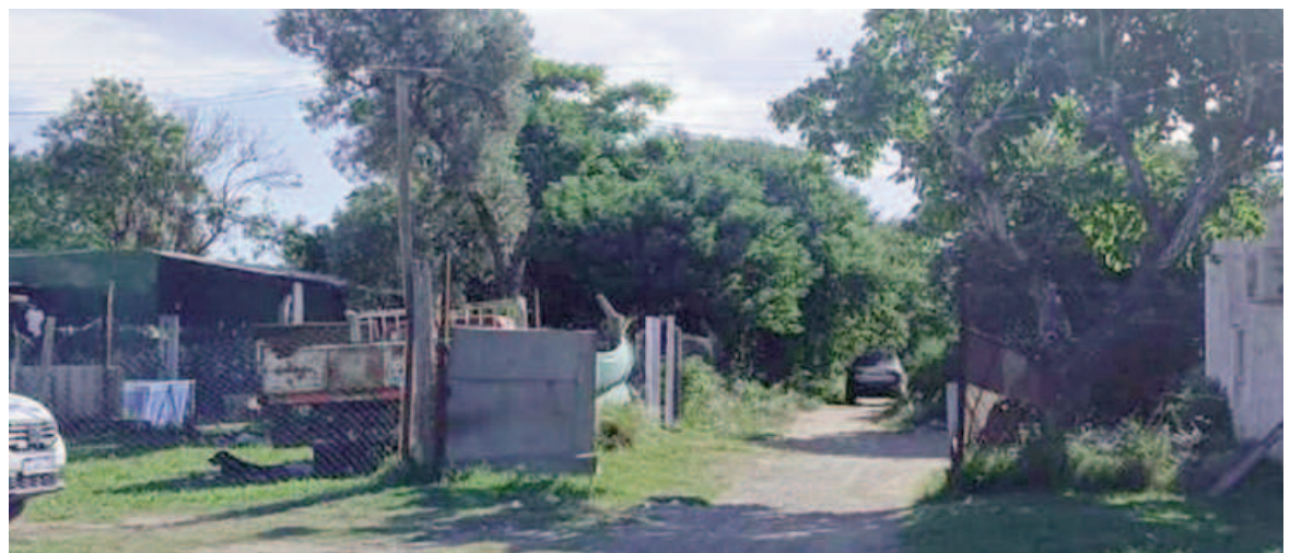
El crimen tuvo lugar en Puerto San Martín.

caso. Entre las medidas dispuestas por el fiscal, se incluyó el trabajo del gabinete criminalístico para realizar un exhaustivo relevamiento de cámaras de seguridad públicas y privadas en el área, la recolección de rastros en la escena del crimen y la toma de testimonios a vecinos y posibles testigos. Aunque aún no se ha identificado a los autores del homicidio, las autoridades avanzan con líneas investigativas para esclarecer las circunstancias del ataque y determinar responsabilidades. La violencia del hecho y la aparente premeditación del ataque generan conmoción en la comunidad, mientras la investigación continúa en curso.