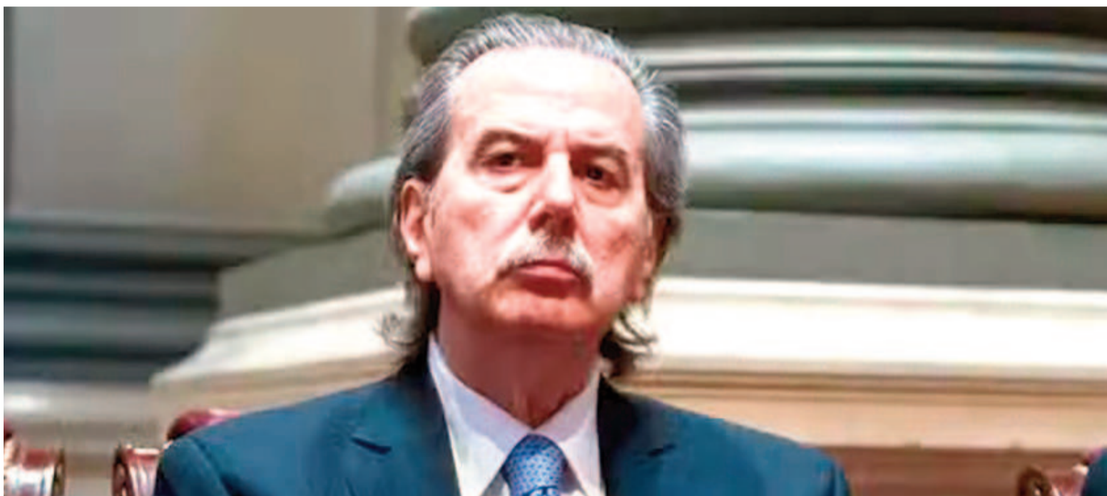
Ex juez de la Corte, Juan Carlos Maqueda.

Esta situación también se produce porque el Senado aún no aprobó los pliegos propuestos por el oficialismo para que se designe como miembros del alto tribunal a Ariel Lijo y Manuel García Mansilla. Lijo y Mansilla expusieron su postulación en agosto pasado ante la Comisión de Acuerdos del Senado, pero solo tenía posibilidades de avanzar la postulación del juez federal.