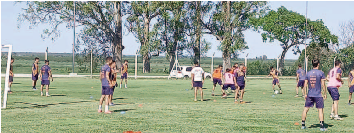
Regatas trabajó ayer y descansará hoy y mañana. EL NORTE

Cambia el año pero el Regional Amateur sigue en marcha con la etapa decisiva de cada una de sus regiones. El Náutico y el Pañero no pararon durante las fiestas pensando en las revanchas de cuartos de final, en las que deberán revertir las derrotas de la ida.