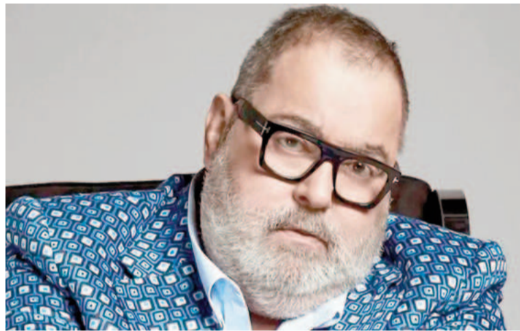
A los 64 años falleció Jorge Lanata.

Ayer lunes 30 falleció el periodista Jorge Lanata. Había nacido hace 64 años en Mar del Plata y comenzó su carrera periodística a los 14 años en Radio Nacional. Tras el regreso de los gobiernos constitucionales fue parte de distintos proyectos como El Porteño, Rock & Pop, El Periodista, pero su mayor salto fue el lanzamiento de Página 12, del que fue uno de los fundadores. Lo dirigió desde 1987 hasta 1994, con lo que vivió los tormentosos años del final del gobierno de Alfonsín, con las leyes de impunidad y la crisis económica, pero también los primeros del menemismo. Página 12 fue en esos momentos una renovación del periodismo, con sus tapas críticas e irónicas. Tenía en sus páginas y en su público a sectores progresistas que buscaban en sus páginas temas como derechos humanos y las peleas de los organismos y familiares de desaparecidos, la corrupción, con recordadas investigaciones sobre las privatizaciones y las políticas del menemismo. Como parte de ese perfil, Lanata fue parte de la construcción de un "mapa de medios", mostrando quienes eran los dueños de las empresas periodísticas y exponía el poder del grupo Clarín.