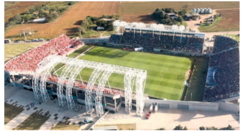
Vélez vs. Argentinos, el partido más convocante del año.

Una vez más, Defensores hizo de local en nuestra ciudad en el Federal A y tuvo la mejor temporada de los últimos años. Ganó su grupo en la primera fase y rápidamente aseguró su permanencia, objetivo que en las dos temporadas anteriores había podido con-