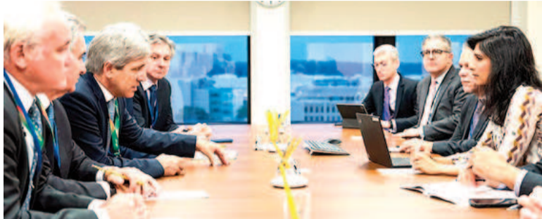
Inician conversaciones para un programa nuevo.

El Fondo Monetario Internacional debatirá en los próximos días una evaluación Ex Post del programa actual vigente con la Argentina, un paso necesario previo a la concreción de un acuerdo nuevo como el que busca el Gobierno de Javier Milei y que auditará el funcionamiento del Extended Fund Facility (EFF) firmado durante el mandato de Alberto Fernández.