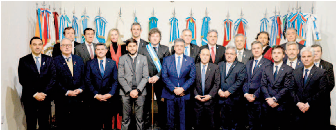
El presidente de la Nación junto a los demás firmantes del Pacto de Mayo.

El presidente valoró que a pesar de las diferencias los asistentes hayan suscripto el Acta “respondiendo al llamado que les hace el pueblo argentino”, y aseguró que “es sin