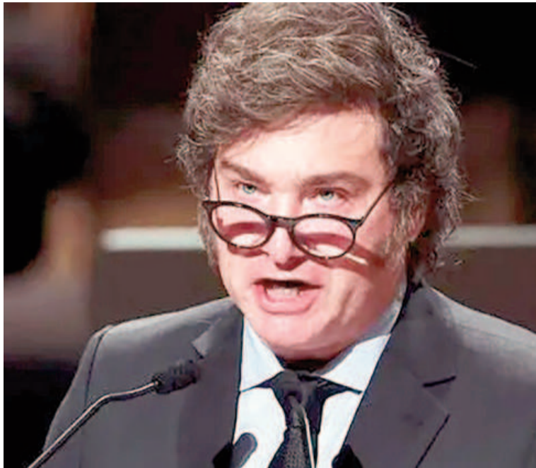
Milei tendrá nuevamente Presupuesto prorrogado.

Entre los principales puntos que exigían al Ejecutivo, se encontraban: financiamiento por compensación del pacto fiscal del 2017 celebrado entre las provincias y la administración de Cambiemos; coparticipación de los Aportes del Tesoro (ATN) no distribuidos durante este año; reducción del aporte realizado por las provincias de los fondos coparticipables por financiamiento a la ex AFIP; eliminación de las afectaciones específicas del impuesto a los combustibles, según los gobernadores,