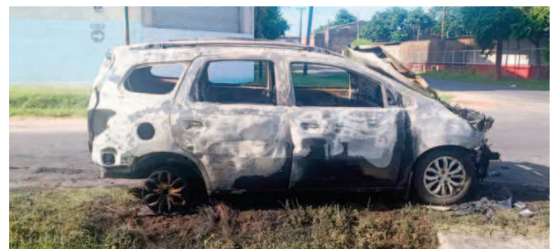
El Chevrolet quedó totalmente destruido.

Ayer lunes a la madrugada se produjo el incendio de una camioneta que estaba estacionado en la calle. El siniestro se registró poco antes de las 3 en Dean Funes al 3200, en la zona sudoeste de Rosario. Si bien el fuego destruyó por completo el vehículo, no se registraron heridos ni tampoco hubo riesgo de propagación. Según fuentes oficiales, el vehículo afectado fue una Chevrolet Spin de color azul, que se encontraba estacionado sobre la calle. De acuerdo con los voceros el propietario del rodado no se hizo presente y dentro del habitáculo se detectaba la pre-