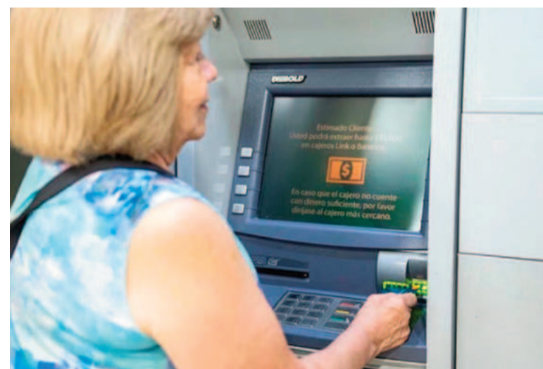
Algunos jubilados recibirán nuevo bono.

Al mismo tiempo, informaron que la Pensión Universal para el Adulto Mayor (PUAM), destinada a brindar cobertura a adultos mayores sin acceso a una jubilación tradicional,