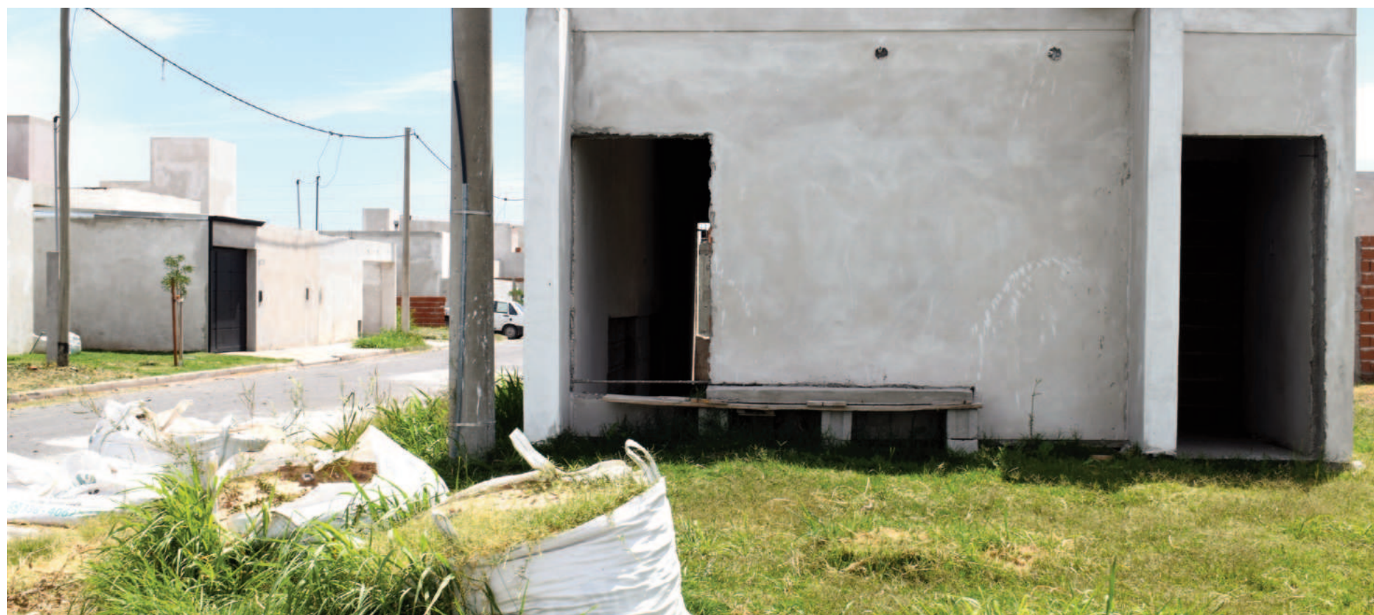
Uno de los vecinos afectados decidió dormir en su vehículo para evitar que le sigan robando los materiales de construcción.

No es la primera vez que los vecinos del barrio Tierras del Sol reclaman por mayor seguridad. En los últimos días, aunque ya con una constancia de años, los mismos aseguraron que hubo una oleada de robos y daños. “Intentamos tener una respuesta por parte de la policía, pero no fue satisfactoria”, manifestó uno de los ciudadanos.