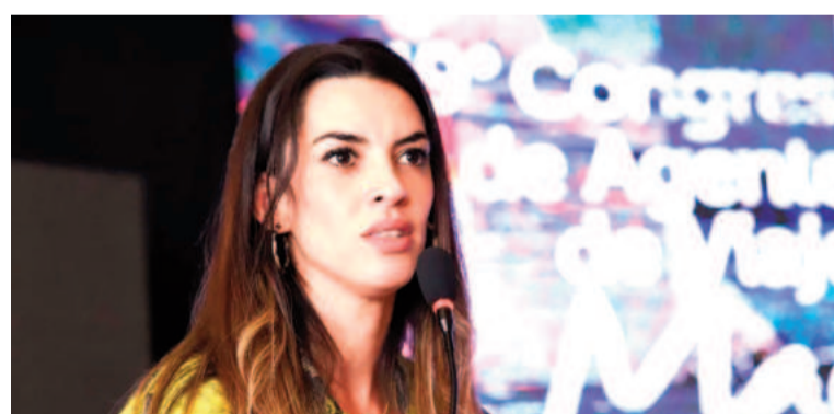
Echaron a la responsable de la subsecretaría de Turismo, Ambiente y Deportes.

Esta medida va en línea con lo que planteó el propio presidente Javier Milei, quien durante el verano permanecerá trabajando en Buenos Aires y les re-