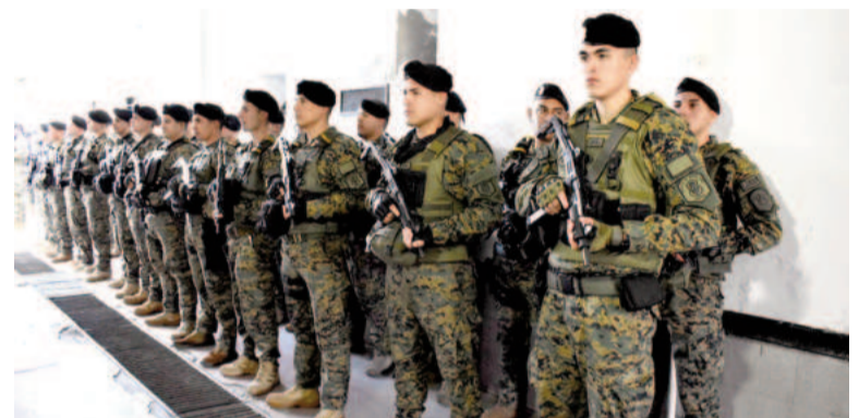
La Unidad Táctica de Operaciones Inmediatas (UTOI) de San Nicolás inició sus funciones con 136 efectivos, equipada con diez patrulleros y diez motos.

“La UTOI tiene, básicamente, dos funciones principales. Una tiene que ver con reforzar las tareas de prevención frente al avance del narcotráfico y la violencia en Rosario. Creo que es un acierto. Y, por otro lado, esta Unidad también cumplirá funciones de seguridad dentro de la ciudad, realizando operativos de satu-