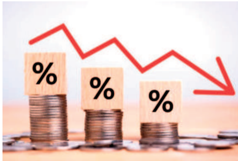
Notable caída de la inflación argentina.

Las perspectivas globales podrían ser favorables, no solo para Argentina sino para toda la región. Según el Banco Mundial, América Latina y el Caribe crecerá 1,9% en 2024, y otro