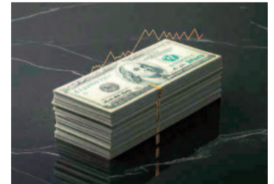
La inflación de 2024 le sacó 100 puntos de ventaja a la suba del dólar.

Los principales indicadores de las bolsas de Nueva York retrocedieron cerca de 1%, ante una tendencia vendedora por la incertidumbre que despierta la extensión del techo de la deuda pública en los EEUU. Con ese marco, el índice S&P Merval de la Bolsa de Co-