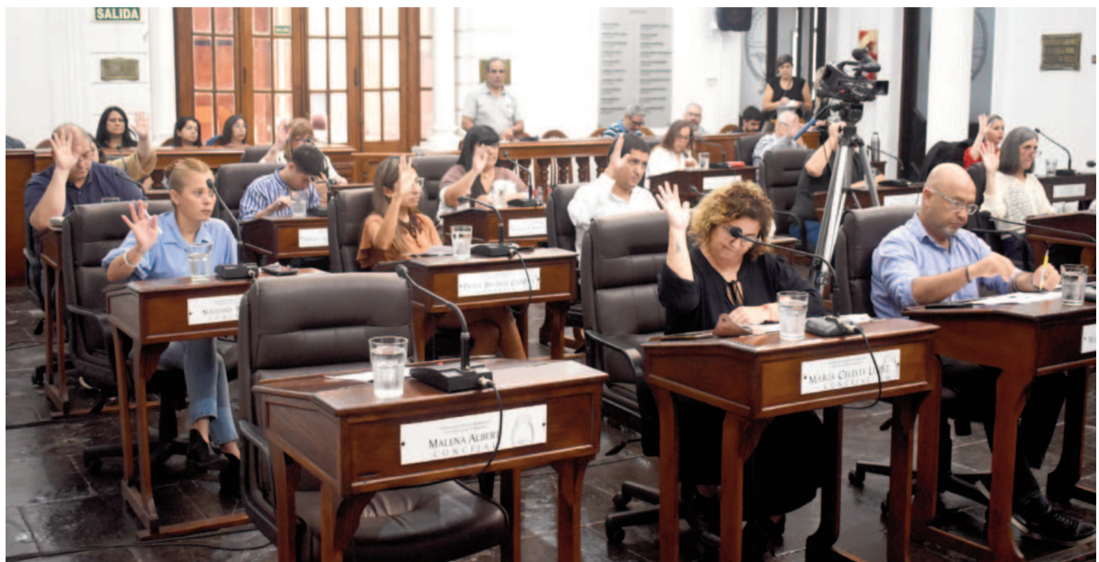
La Fundación Libertad dio a difusión su informe anual sobre el costo de los concejos municipales de las principales ciudades del país.

de los Concejos Municipales de las principales ciudades del país», elaborado por la Fundación Libertad: un trabajo cuyo objeto fue determinar cuánto gastan los municipios en el funcionamiento de sus concejos deliberantes. Para ello, se analizaron los importes destinados a esta institución según los respectivos pre-