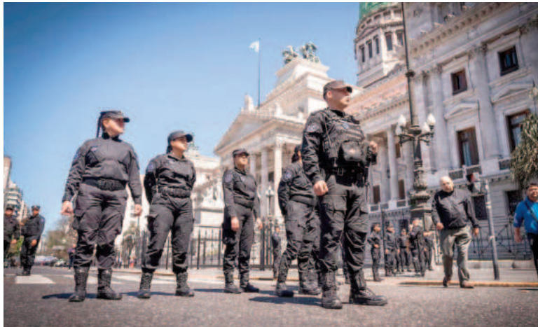
Custodia en los alrededores del Congreso.

Un incidente insólito encendió las alarmas en el Congreso Nacional. La Policía Federal encontró un dron que le pertenecía a un grupo de ciudadanos rusos. El dispositivo, que también podía grabar sonido, estaba en la terraza del Palacio Legislativo.