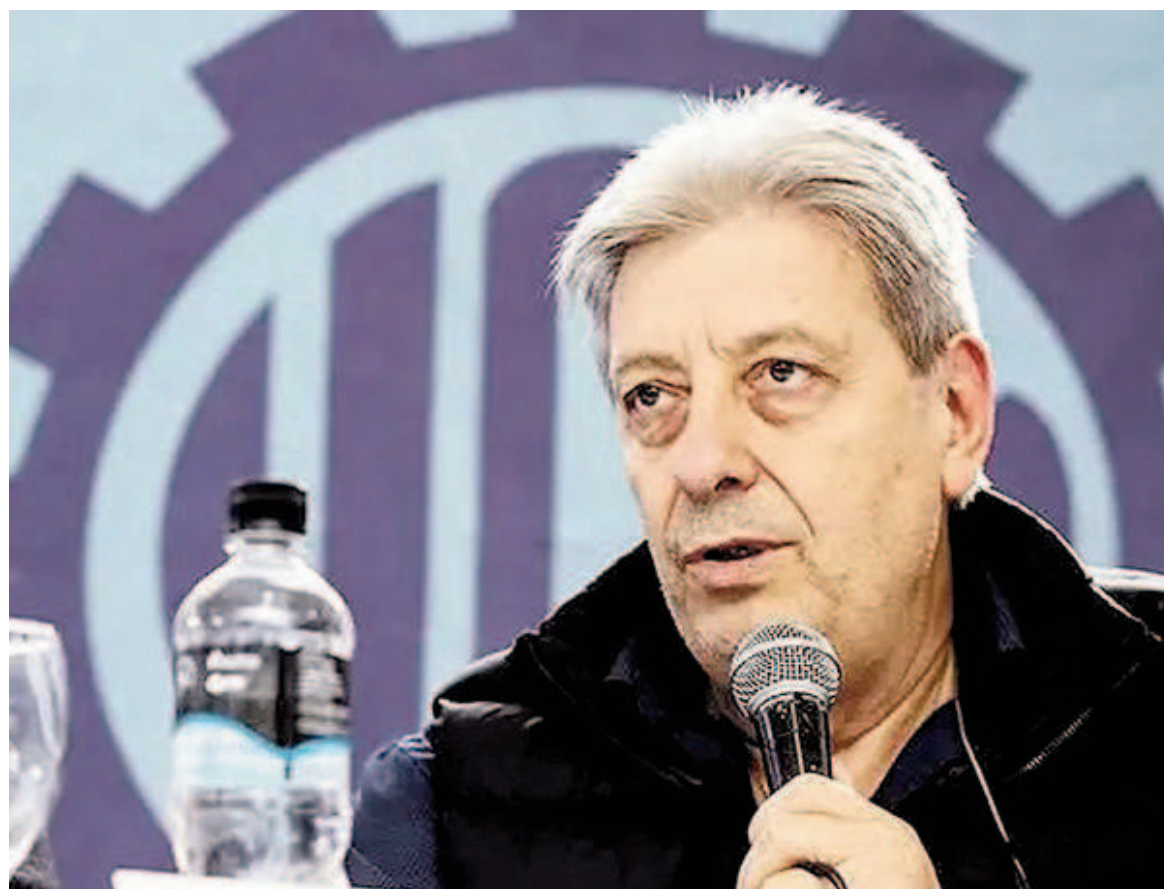
Abel Furlán, secretario general de la Unión Obrera Metalúrgica nacional.

Para Furlán, "la caída de la actividad económica se está haciendo con la corrección de los índices de inflación, con el déficit fiscal y reprimiendo a la economía de una manera nunca vista. Esto hace que haya desaparecido la demanda, y es una situación anormal. No es que nosotros estemos diciendo que no estamos de acuerdo en resolver el problema de inflación o del déficit fiscal. A mí, en parti-