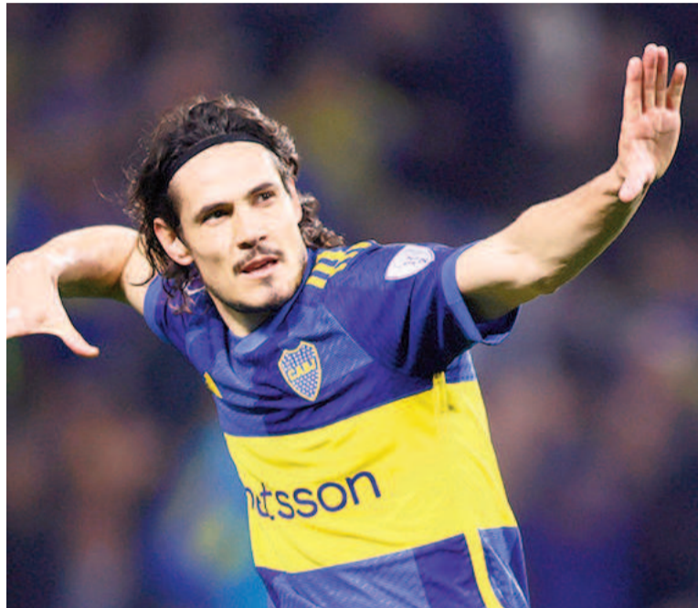
Edinson Cavani quiere finalizar su carrera en el Xeneize.

El uruguayo -la gran estrella que llegó al Xeneize a mediados de 2023- fue de menor a mayor en su etapa en Boca, hasta que se asentó como goleador y referente en 2024, más allá de algunas ausencias en partidos por molestias físicas. En esta temporada, el Matador convirtió 20 goles en 39 partidos entre los torneos locales y la Copa Sudamericana (incluyendo un gol contra River en el superclásico de los cuartos de