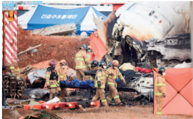
Al menos 179 personas murieron en el incendio.

entre los pasajeros del avión hay dos ciudadanos tailandeses.