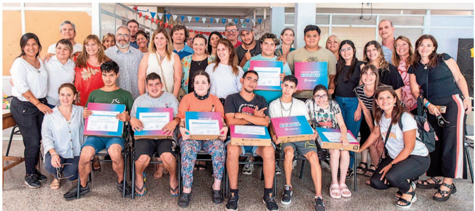
El bloque de concejales de Unión por la Patria (UP) defendió las políticas provinciales destinadas a "fortalecer el acceso a la tecnología y mejorar las condiciones de aprendizaje".

"Con estas iniciativas, el Estado provincial sigue trabajando para reducir las brechas digitales, educativas y sociales, tanto en las aulas