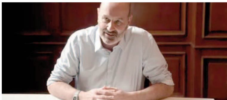
Unos 35.936 empleados públicos perdieron su trabajo en el Estado.

La publicación de los datos se da tras las declaraciones del secretario general de ATE, Rodolfo Aguiar, quien dijo "2025 tiene que ser el año en que le robemos la motosierra y le cortemos la cabeza a ellos", en referencia a los integrantes del Gobierno de Milei.