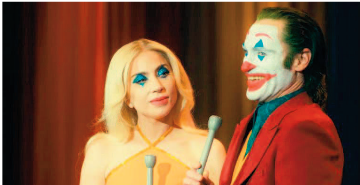
Guasón 2 decepcionó a muchos fanáticos.

Alex Garland, con Kirsten Dunst, Wagner Moura y Cailee Spaeny.