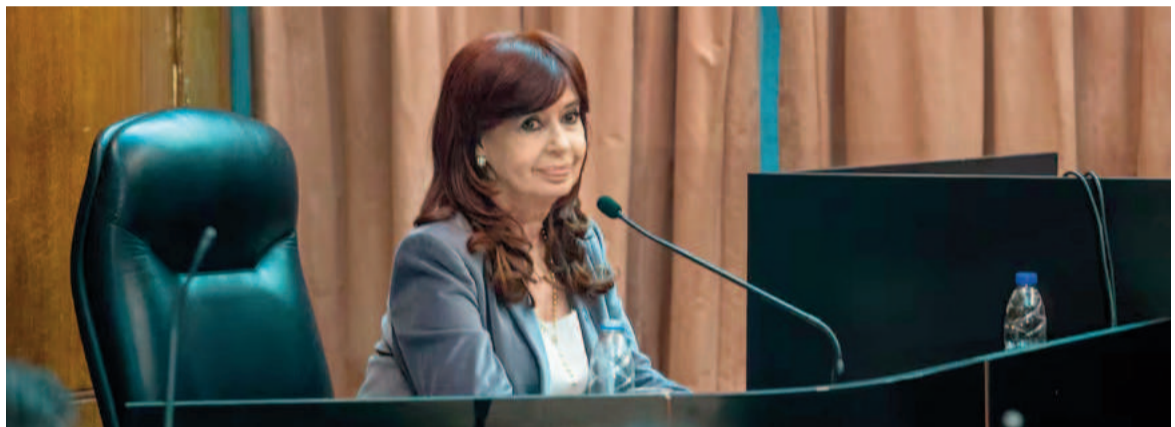
La Anses analiza denunciar a Cristina Kirchner por el plus de $6 millones en su jubilación por zona austral.

Esto se produjo luego de que la Cámara de Casación confirmó la condena contra la exvicepresidenta por el caso Vialidad a seis años de prisión. En paralelo, la Anses aún no descarta