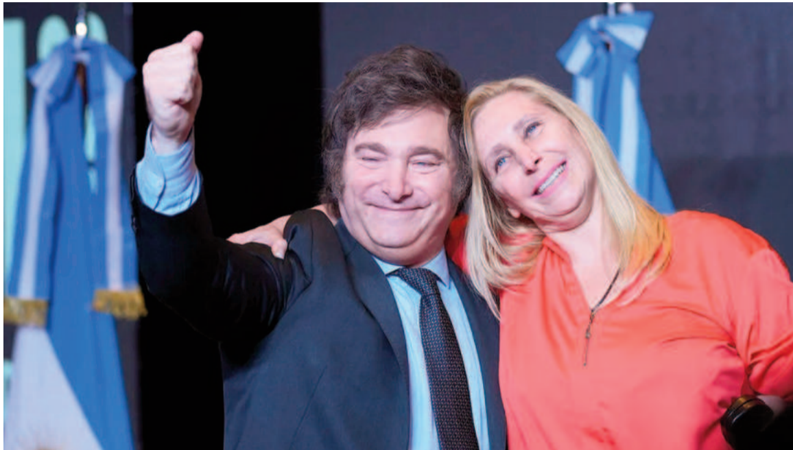
El presidente Javier Milei y la "jefe" Karina Milei

El mandatario planteó además que para abrir el cepo la inflación deberá reducir la inflación al 1,5% mensual, se deberán resolver los problemas de stock del Banco Central y la base monetaria en el formato tradicional tendría que coincidir con la base monetaria amplia. "Se tienen que cumplir esas tres metas para que podamos abrir el cepo sabiendo que no va a generar inestabilidad de la demanda de dinero. Ese es el eje central. Ya tenemos menos inflación que el mundo, porque sacas el crawl y estaríamos en deflación", diagnosticó. En otro pasaje de la entrevista, el libertario planteó además la necesidad de aplicar reformas estructurales en el gasto público, con una fuerte reducción presupuestaria en las áreas que considera poco necesarias, lo que configurará -según definió- un modelo de gobierno "eficiente y sostenible".