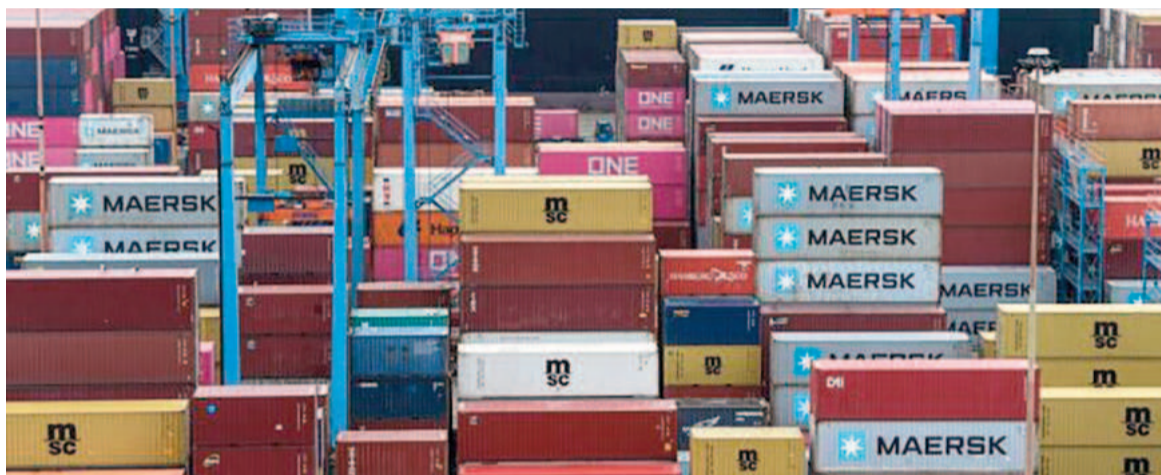
El Monitor de Exportación Pyme (MEP) es un indicador elaborado por el sector de Estadísticas e Informes de CAME.

Según el Monitor de Exportación Pyme (MEP) de la Confederación Argentina de la Mediana Empresa (CAME), en los primeros once meses del año, 4 de los 16 rubros analizados presentaron caídas, siendo nuevamente el