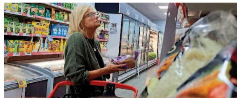
La inflación de diciembre sería inferior al 3%.

Por el lado de Analytica, registraron un 0,7% en alimentos y bebidas, dando un promedio de cuatro semanas del 2,8%.