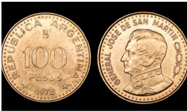
Las monedas híbridas de 100 pesos Ley incluyen un error histórico.

En 1979, la Casa de la Moneda dejó de usar este diseño y regresó a un modelo más sencillo. En lugar de las fechas conmemorativas, junto al busto de San Martín aparecía una rama de laureles, mientras que en el anverso se mantenían el valor nominal y el año de emisión. Sin embargo, debido a una confusión o error en la acuñación, los cuños de diferentes años y diseños se mezclaron, dando lugar a dos versiones únicas de monedas híbridas.