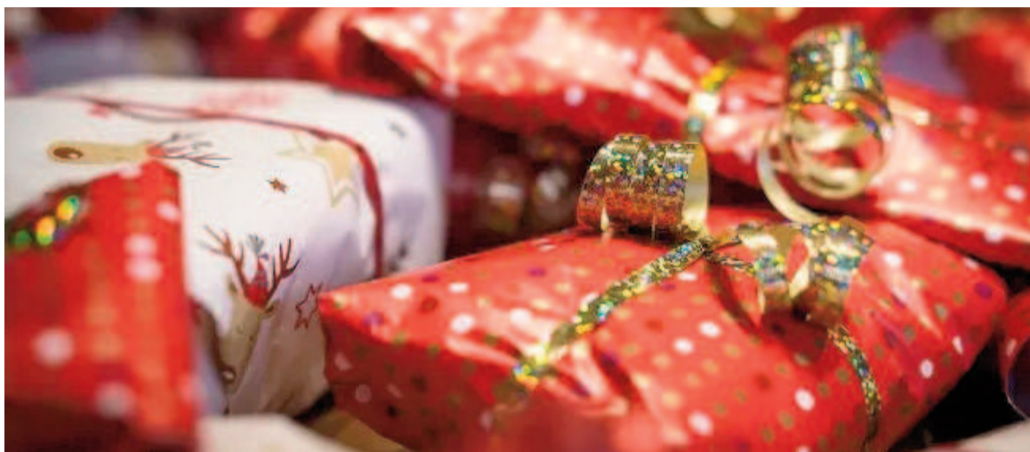
El ticket promedio se ubicó en $36.165.

Respecto a la afirmación de que "la Navidad impulsará sus ventas mensuales", el 95,3% de los comerciantes indicó estar total o parcialmente de acuerdo, mientras que solo