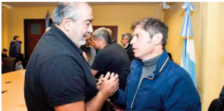
La CGT respalda el Presupuesto 2025 de Kicillof.

En un comunicado contundente, la Confederación General del Trabajo (CGT) expresó su total respaldo al Presupuesto Bonaerense 2025 presentado por Axel Kicillof, el cual se encuentra en el centro de una disputa política. A pesar de las resistencias internas dentro del kirchnerismo y de la oposición encabezada por La C mpora, la central obrera resalt  la importancia de que la Legislatura apruebe el proyecto. En el marco de tensas negociaciones, la CGT destac  que la aprobaci n del Presupuesto es "indispensable" para la gesti n del gobernador y para la estabilidad de la provincia.