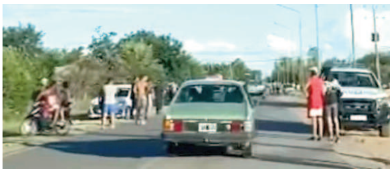
La avenida Rodríguez Jáuregui fue escenario del trágico hecho.

Los vehículos atravesaron la cinta asfáltica en medio de una humareda y alguno habría pasado a otro carril. El automóvil era un Chevrolet Ónix que iba al mando de una mujer de 40 años de edad.