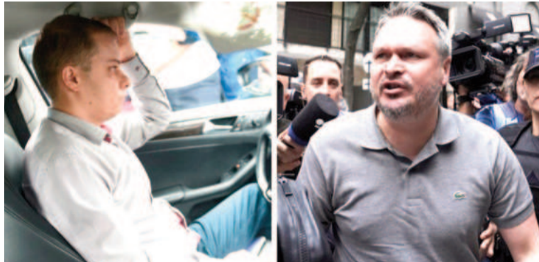
Diplomáticos rusos involucrados en la polémica.

"Tiene patente diplomática, deducimos que pertenece a la embajada rusa. Desconocemos su cargo o jerarquía", dijo uno de los agentes de tránsito que estaba a cargo del operativo que lleva adelante la Ciudad de Buenos Aires. Luego, dijo que estaba a la espera de los policías porteños "para que presente la documentación porque no había querido entregarla".