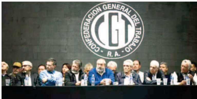
Integrantes de la CGT.

«Ojalá reflexionen sobre esta posición. Debemos avanzar en normativas y consensos que son esenciales para una Argentina que convierta en realidad sus propios