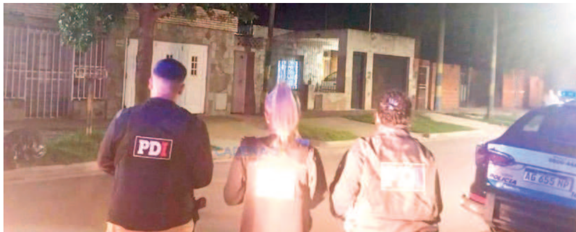
Bebé de un año y medio herida en una balacera de madrugada al norte de Rosario.

llevar a la menor al hospital, donde fue atendida de inmediato por el equipo médico. Al llegar al centro de salud, los profesionales de guardia examinaron a la niña y confirmaron que presentaba una herida de arma de fuego en la zona del omóplato izquierdo, además de otra herida en la oreja izquierda. Tras realizarle una serie de estudios, se determinó que el proyectil había quedado alojado en la zona media lateral posterior de su cuerpo. La pequeña quedó en observación, mientras se esperan más estudios para evaluar la magnitud de las lesiones.