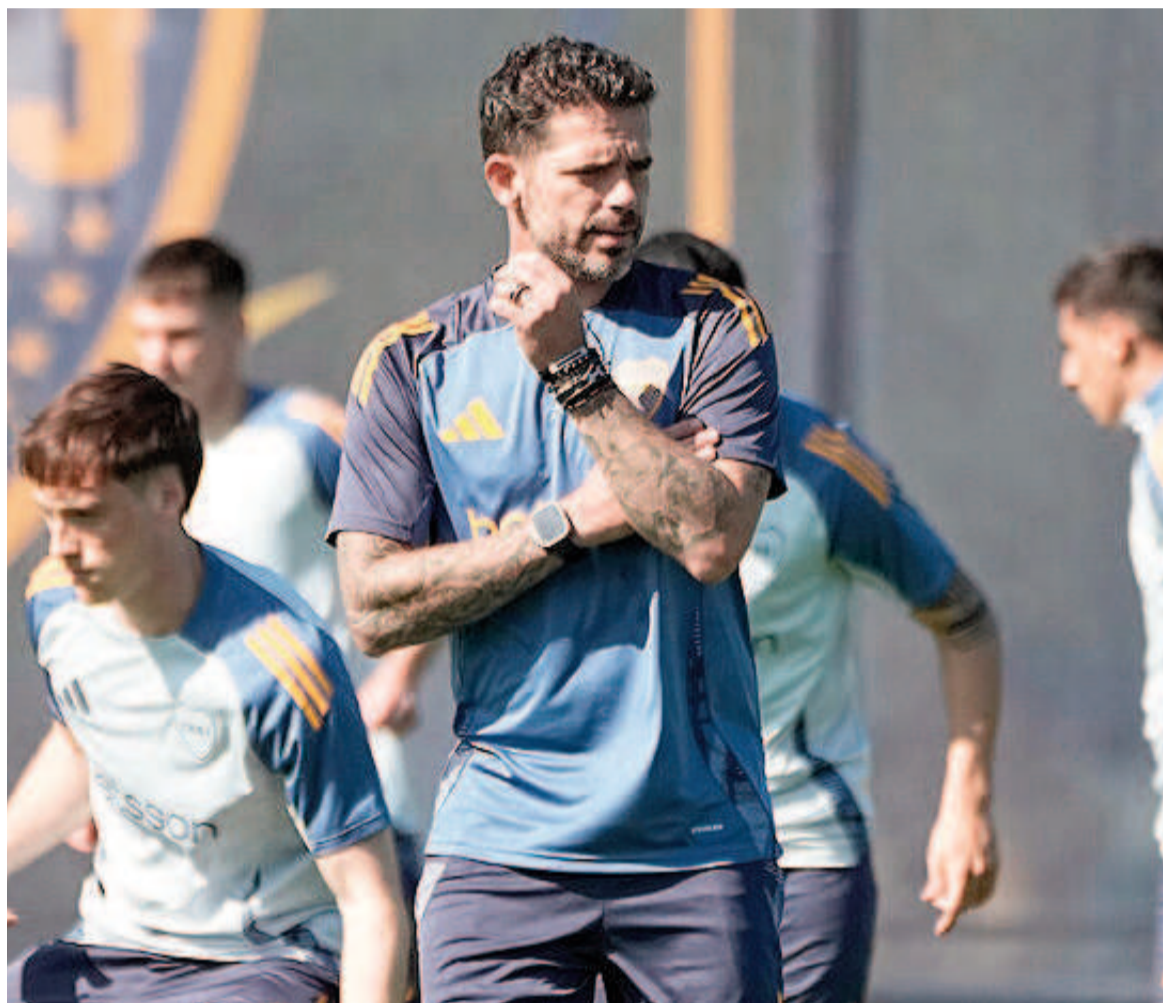
Fernando Gago busca refuerzos para potenciar el Boca modelo 2025.

Además de priorizar la llegada de un zaguero, Pintita apuntaría a reforzar la mitad de la cancha con jugadores con quienes compartió el día a día, ya sea como futbolista o entrenador.