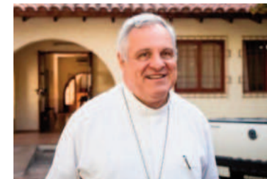
El arzobispo de Mendoza Marcelo Colombo.

La carta también incluyó un llamado a reflexionar sobre el mensaje de paz que representa la Navidad y a renovar la esperanza en un futuro mejor, en línea con el Jubileo de la Esperanza convocado por el papa Francisco. "Este tiempo especial nos invita a reflexionar sobre el mensaje de paz que el Niño de Belén trae al mundo, un mensaje que sigue siendo una guía luminosa para nuestras ac-