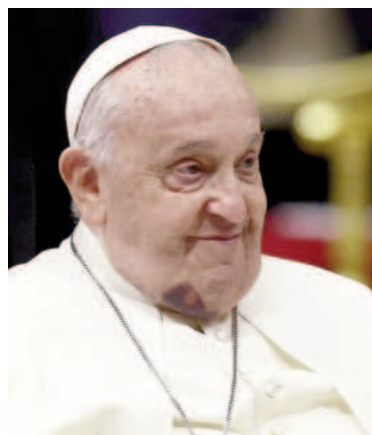
El papa Francisco exhibió un gran golpe en la barbilla.

al rango de cardenales a 21 prelados de los cinco continentes, con una importante presencia latinoamericana, reflejo de su interés por las periferias en una Iglesia cada vez más globalizada. Con este "consistorio ordinario", el décimo desde su elección en 2013, el papa argentino, que