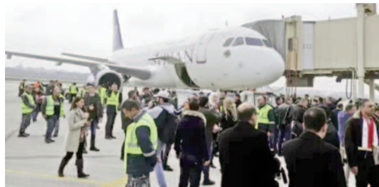
Se incrementa la tensión en el noroeste de Siria.

El mensaje subraya la importancia de actuar con rapidez ante un escenario cada vez más inestable, donde los enfrentamientos armados y el avance de las fuerzas opositoras han intensificado los riesgos para la población civil y los extranjeros en el territorio. La advertencia también incluye un llamado a quienes aún planeen visitar o permanecer en Siria para reconsiderar sus