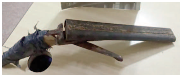
Arma que utilizaba

Por último, el caso del niño recayó en la UFI bajo la carátula de "tentativa de robo". Por el momento, se evalúan las causas del porqué el niño tomaba estos recaudos.