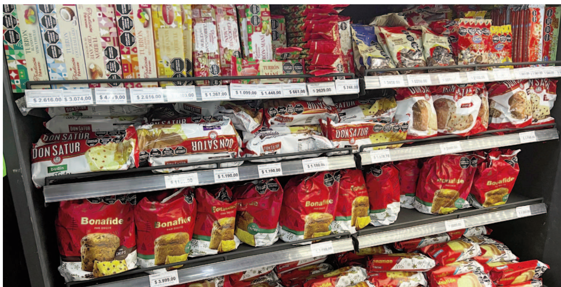
La variedad de opciones permite a los consumidores armar su mesa festiva según sus gustos y presupuestos.

Los productos típicos de la mesa dulce para las celebraciones de fin de año ya colmaron las góndolas de los supermercados, con precios que como mínimo duplican los valores que tenían el año pasado. En diciembre de 2023 componer una canasta navideña podía salir $5500; hoy cuesta $11.800. Por los mismos productos pero de marcas premium se pueden pagar hasta $50.000.