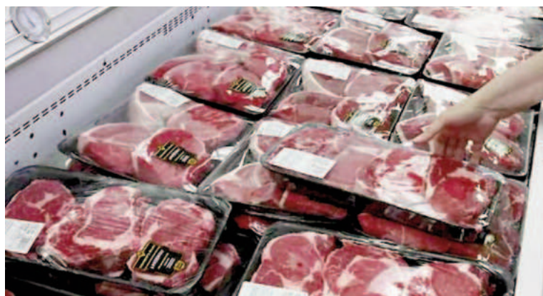
La carne picó en punta en los aumentos del mes.

La consultora recordó que la inflación de noviembre (que el INDEC va a informar el próximo miércoles 11) presentó los aumentos usuales de precios regulados (como prepagas, teléfonos, y electricidad, gas y agua) y otros que no estuvieron presentes el mes anterior (combustibles y taxis a mediados de mes en el AMBA) y contará con un mayor aporte de es-