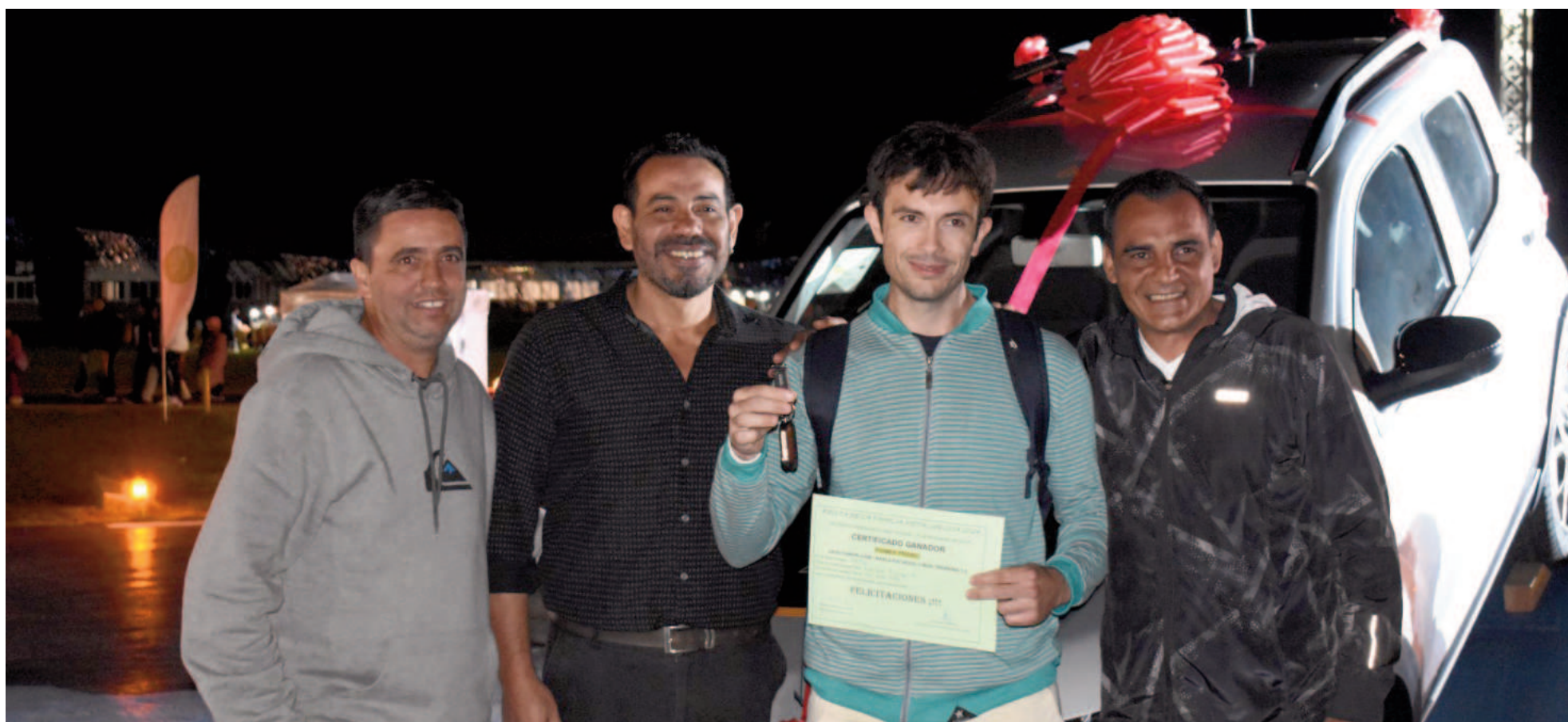
Alrededor de 18.000 personas participaron ayer de la Fiesta de la Familia Metalúrgica organizada por la UOM San Nicolás.