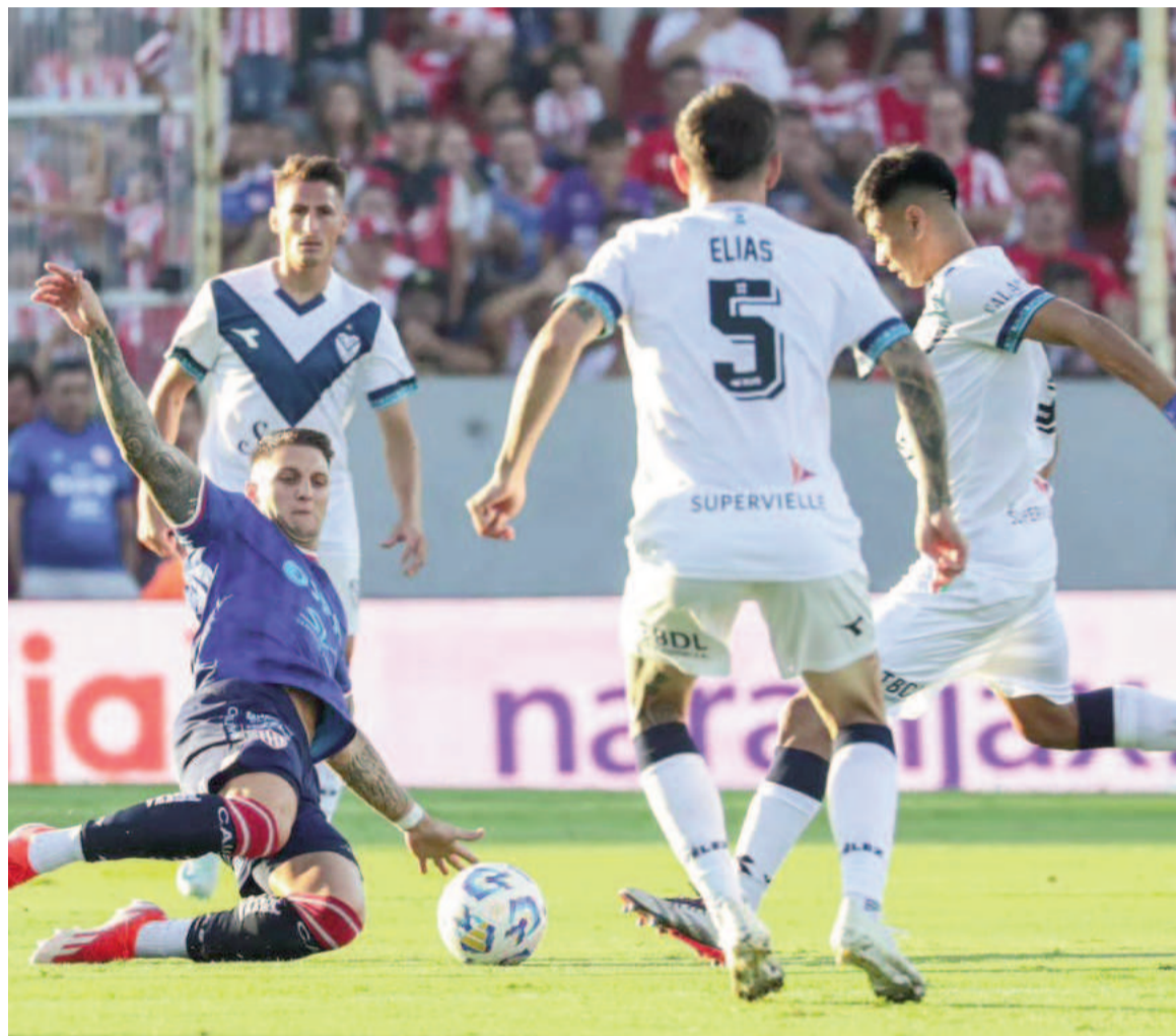
El Tatengue dio la nota ante Vélez.