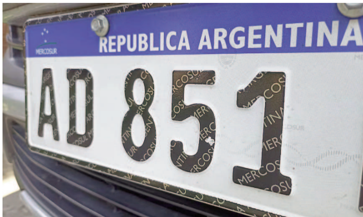
La falta de patentes metálicas podría impedir que muchos argentinos viajen en sus vacaciones de verano a países limítrofes.

La comunicación oficial, además, reafirmó algo que habían contestado la semana pasada cuando se consultó por la validez de la cédula verde digital