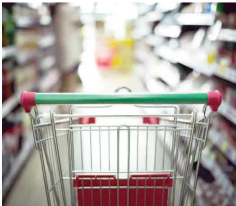
El consumo masivo presenta actualmente una caída del 15%.

Se observaron grandes cambios en las compras de los hogares, que achicaron el presupuesto del supermercado, prendas de vestir, recreación, entre otros, producto de la recomposición de las tarifas y servicios que empezaron a ocupar más lugar en las cuentas y salarios que no acompañaron la