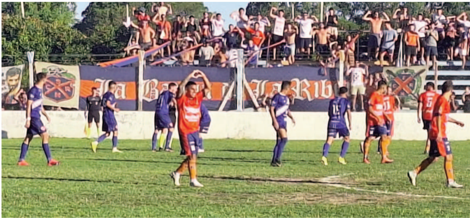
El conjunto de la ribera logró un triunfo en la ida.