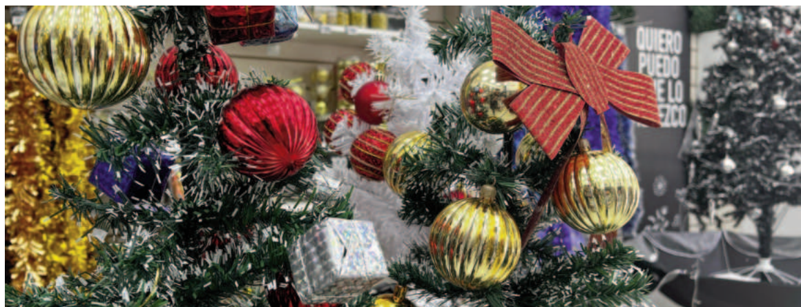
Los comerciantes locales destacaron que "todo lo importado subió muy poco, considerando el precio del dólar".

En nuestra ciudad, las ventas de adornos navideños estaban siendo moderadas en la semana, y se esperaba algo más de movimiento sobre todo para ayer a la tarde. "Este año la gente está comprando menos cantidad de accesorios y de precios más accesibles, y algunas familias optan por no reemplazar el árbol como otros años", comentaron a EL