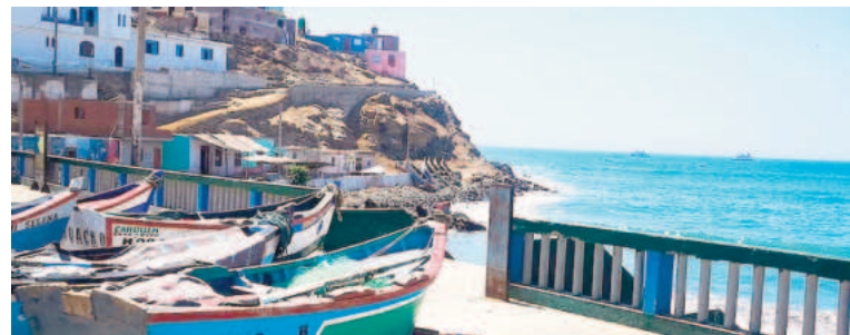
Cierran 91 puertos.

Según el reporte, 43 terminales portuarios cerrados se encuentran en el litoral norte (7 en Zorritos, 11 en Talara, 15 en Paita y 10 en Salaverry). Asimismo, 40 puertos están cerrados en el centro (12 en Chimbote, 8 en el Callao, 10 en