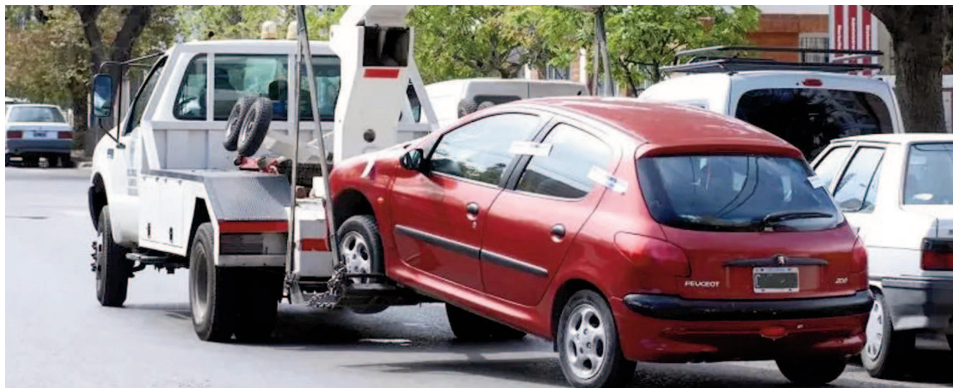
Los valores que se abonan por los servicios de acarreo y estadía están definidos en San Nicolás a través de la Ordenanza Tarifaria de cada año. ILUSTRACIÓN

Los nuevos valores quedaron establecidos en la Ordenanza Fiscal y Tarifaria para 2025. Desde el 1º de enero se multiplican por 2,2 los valores que el Municipio cobrará por el acarreo de los vehículos secuestrados en la vía pública por diversas infracciones. Y también el valor que se paga por la estadía de esos vehículos en el corralón.