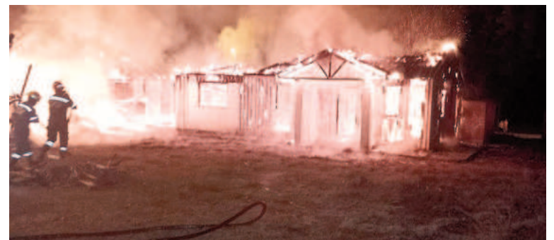
Las llamas consumieron el lugar.

Ambos incendios fueron extinguidos en su totalidad y solo se registraron daños materiales.