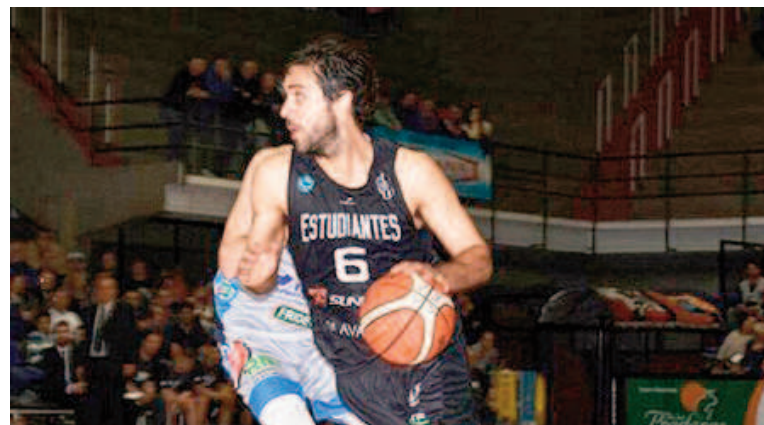
En Estudiantes de Olavarría el nicoleño fue figura. WEB