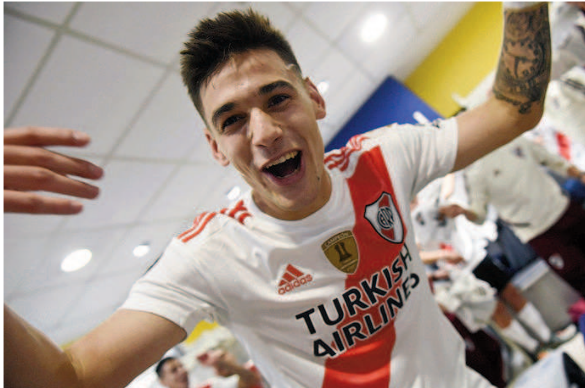
Martínez Quarta a un paso del conjunto de Núñez.

A pesar de estar convocado para el próximo partido y a sabiendas de que está a detalles de firmar con el Millonario, el conjunto italiano tiene al español Pablo Mari en carpeta.