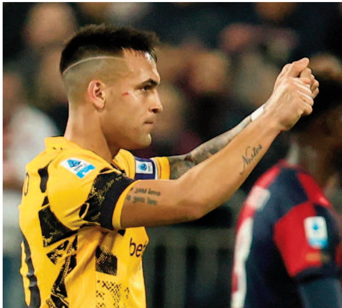
Inter ganó y se acercó a la punta.

El equipo lombardo se impuso por 3 a 0 como visitante y con un partido menos marcha segundo a un punto del Atalanta, que empató ante Lazio. El delantero bahiense fue autor del segundo gol del neroazzurro.