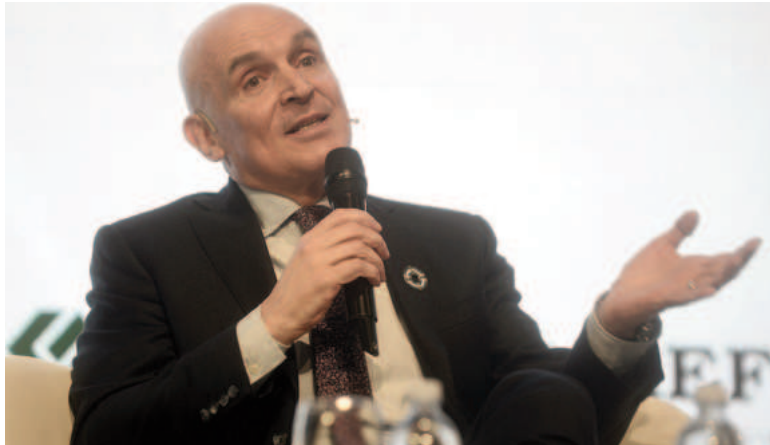
José Luis Espert.

El diputado José Luis Espert no perdió la oportunidad de salir a pegarle a su blanco favorito de los últimos tiempos, el gobernador de la provincia de Buenos Aires, Axel Kicillof, que denunció un "golpe" de la oposición después de quedarse sin un presupuesto aprobado para 2025.