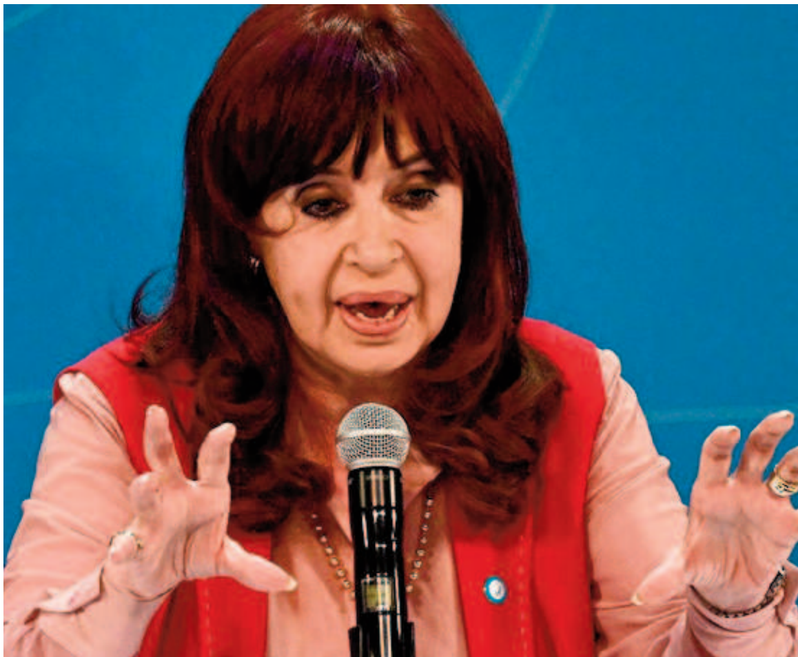
Cristina Kirchner criticó un fallo a favor de Mauricio Macri.

Este planteo de la ex mandataria tiene que ver con la resolución judicial que le otorgó al Tribunal Superior de Justicia de la Ciudad la posibilidad de ser el órgano encargado de intervenir en los recursos extraordinarios que se presenten en