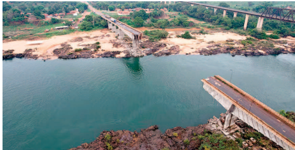
El puente Juscelino Kubitschek, derrumbado sobre el río Tocantins en Estreito.

Equipos de rescate continúan buscando a siete desaparecidos; también se investiga el mal estado de la estructura.