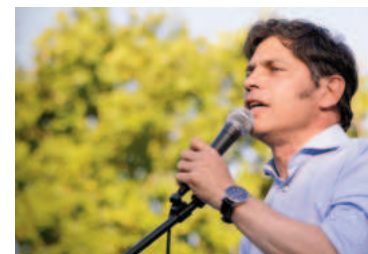
Kicillof afirmó que Milei quiere fundir a la provincia de Buenos Aires.

"A la gravísima situación a la que nos sometió el presidente Milei durante este año, se agrega ahora un