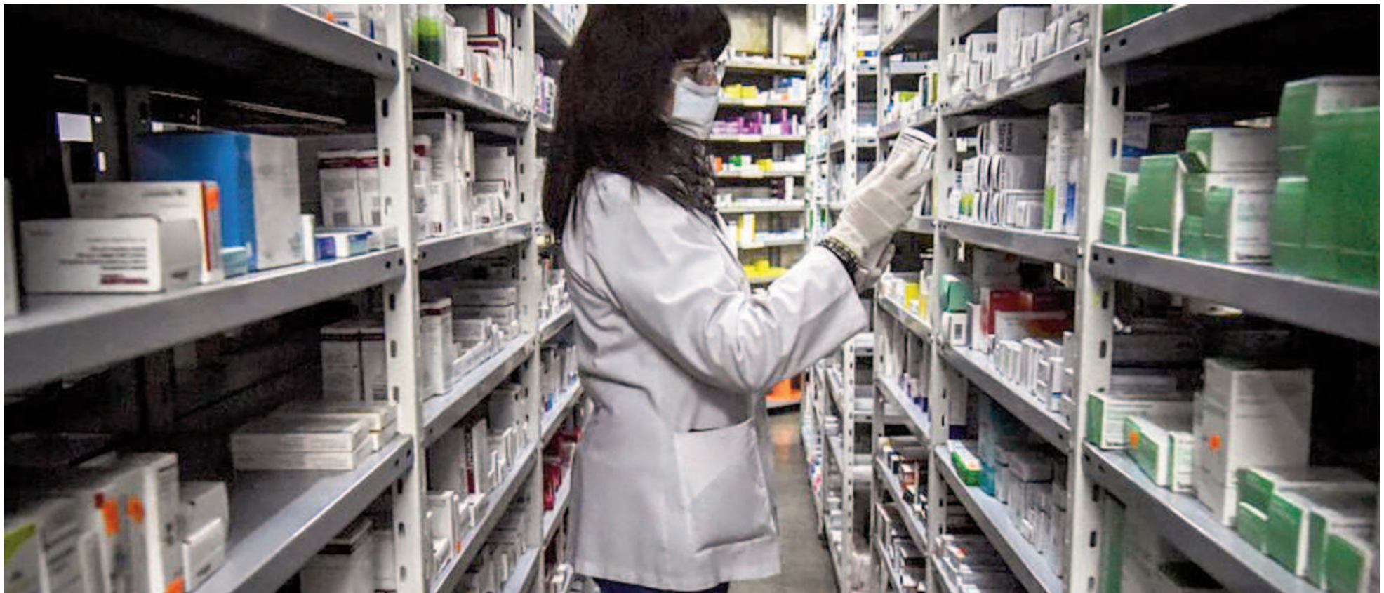
La Dirección de Farmacia aseguró que evaluará caso por caso la pertinencia de realizar controles virtuales o presenciales. ILUSTRACIÓN