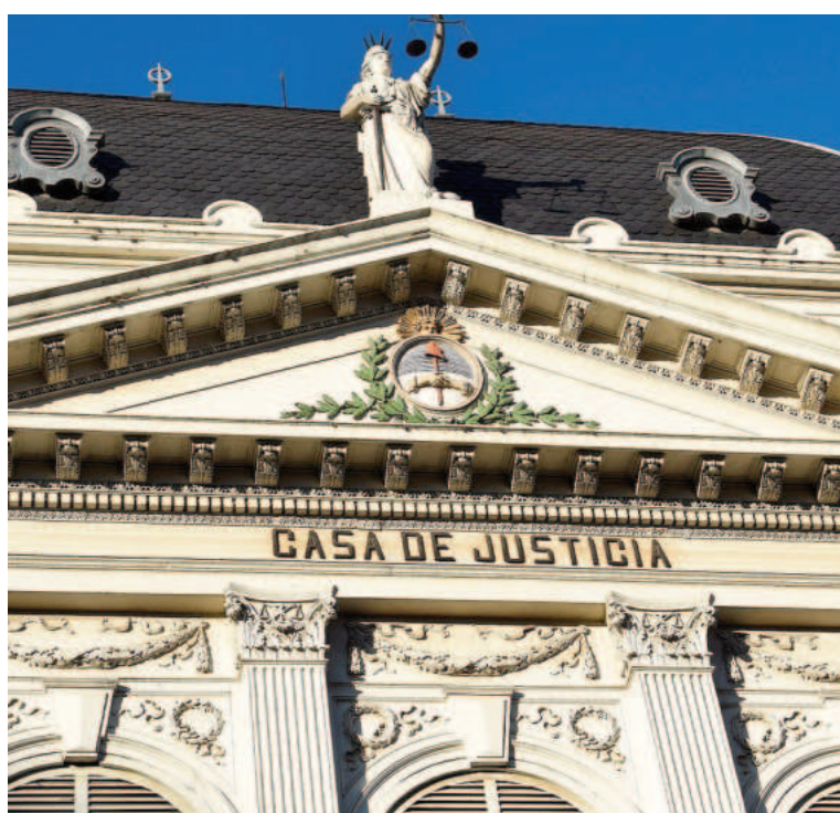
Suprema Corte de Justicia de la Provincia de Buenos Aires.