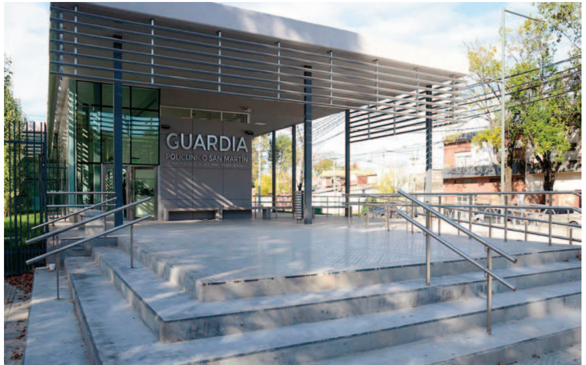
El sujeto fue trasladado al Policlínico San Martín.

Las actuaciones judiciales están a cargo de la Comisaría 32ª.