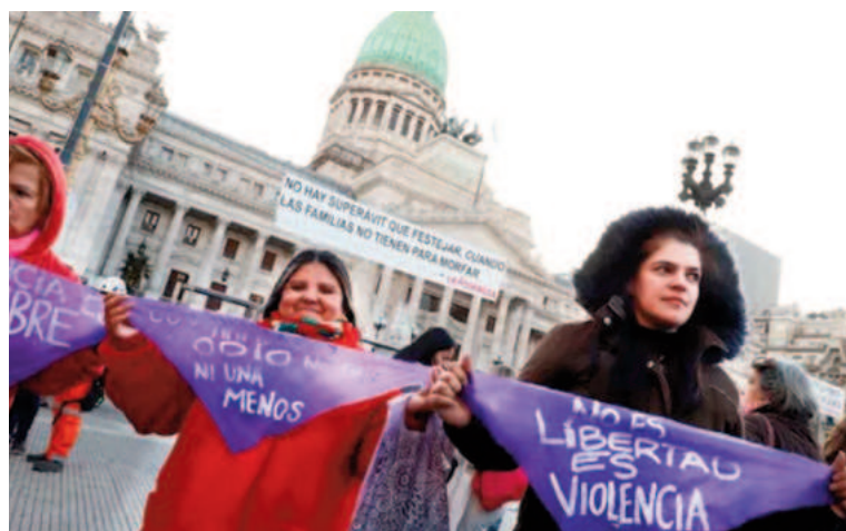
La Justicia dio lugar a una cautelar de organizaciones feministas.

La respuesta del ministerio fue difundida por el conjunto de organizaciones que motorizaron la demanda. En un comunicado conjunto, el Equipo Latinoamericano de Justicia