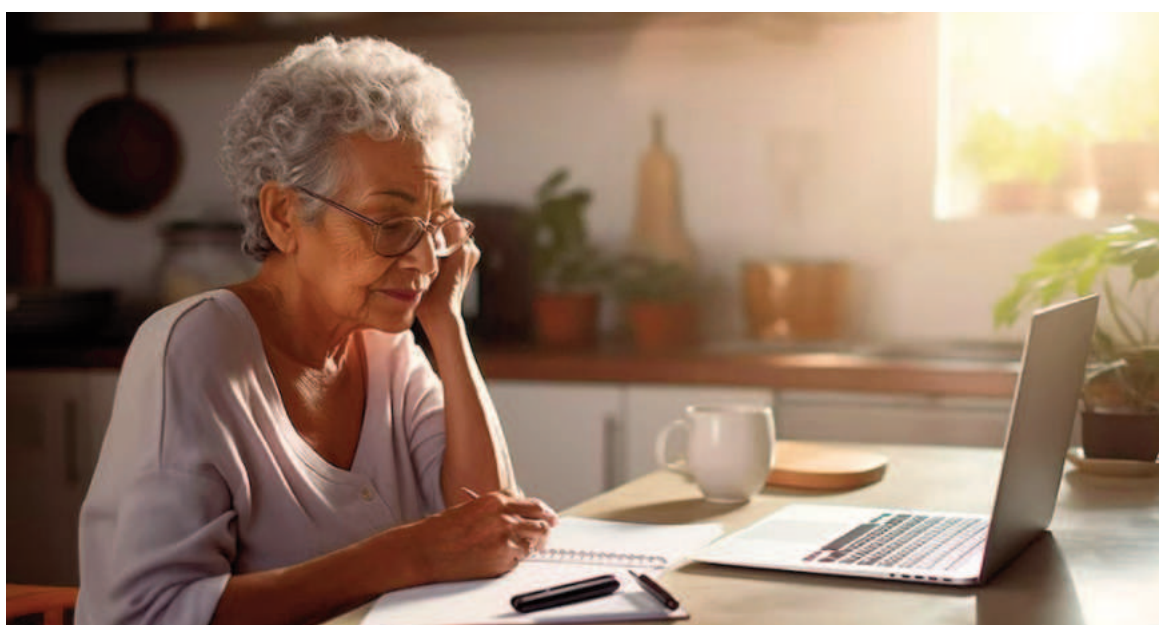
La brecha digital afecta especialmente a los adultos mayores, quienes enfrentan barreras personales y sociales para acceder a la tecnología.

“Posteriormente, en Argentina nos dimos cuenta de otro aspecto de la realidad, siendo los adultos mayores los más afectados. En ese punto adoptamos el nombre del programa de inclusión digital ClicMayores. Por ello comenzamos nuestra red de ayuda vía Internet, ya que la alta demanda y la logística de seguir trasladándonos, como lo hicimos en 2013 en Ecuador y Colombia, se volvió insostenible debido a los altos costos. Nuestro proyecto es gratuito y está costado completamente por nuestros medios, lo que nos limitó a abarcar toda Latinoamérica, dado que los viajes representaban un gasto significativo”, sumó Zuppelli.