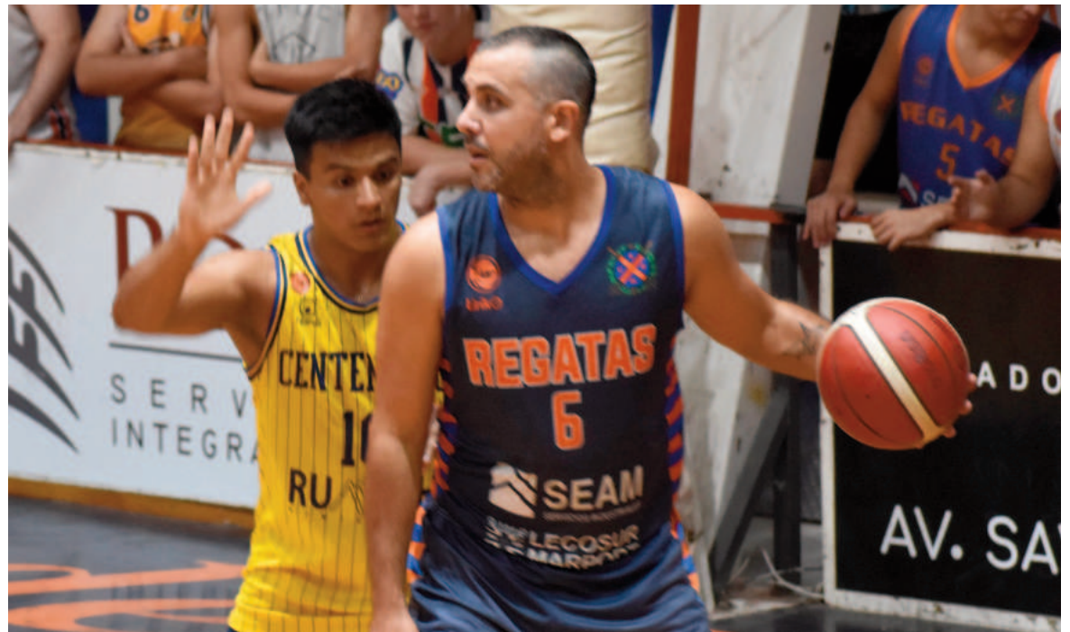
Pato volvió a Regatas en 2021 y cerró su carrera con la camiseta azul naranja.

“A pesar de los sacrificios, también hubo momentos de gran alegría y satisfacción. Pude recorrer muchos países gracias a la pelota naranja, forjé amistades que durarán toda la vida. Y, por supuesto, tuve el honor de representar a la Selección Argentina, lo que fue un sueño cumplido y un momento inolvidable en mi vida”, agregó en el posteo, que acompaña un video con fotos de su carrera y el tema “You shook me all night