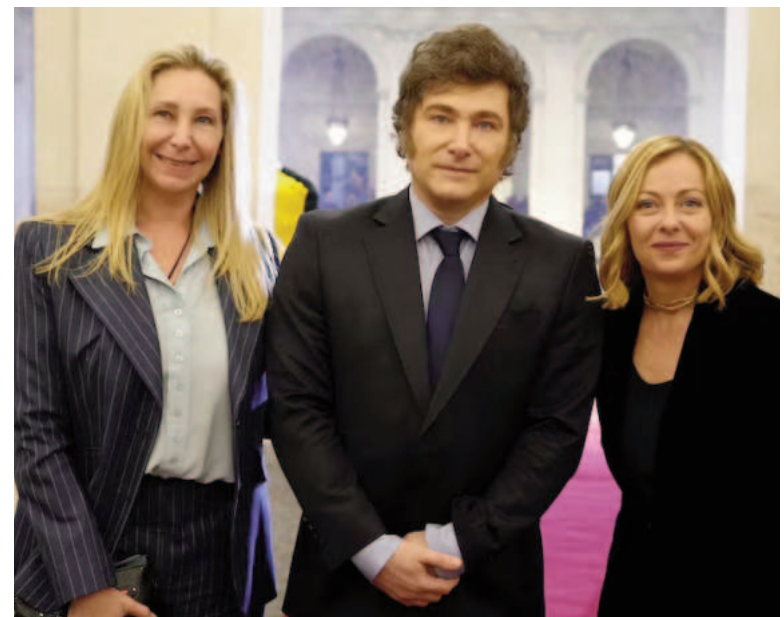
Javier Milei junto a Karina Milei y Giorgia Meloni en Italia

El Presidente, de inscribirse finalmente su acta de nacimiento argentina en el registro italiano de su abuelo, será también ciudadano italiano residente en el exterior, en el registro del Consulado General de Italia de Buenos Aires. Así como Milei, otros políticos como Daniel Scioli, Sergio Massa, Mauricio Macri y más atrás incluso, Julio Frondizi, tuvieron o tienen la doble nacionalidad. Pertenecen a un inmenso grupo conformado por un millón de argentinos, según los registros anagráficos de la Cancillería italiana. Y forman parte de una lista de celebridades nacionales con sangre "tana" como Emanuel Ginóbili, Lionel Messi o Lionel Scaloni.