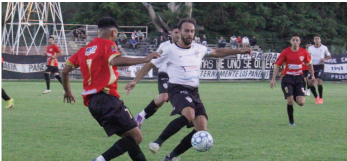
Hoy quedarán definidos los cuartos de final de la Región Pampeana Norte. EL NORTE.