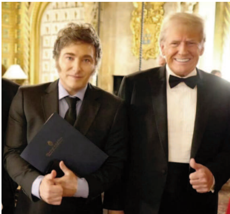
Javier Milei y Donald Trump en Mar-a-Lago.

El presidente Javier Milei fue invitado por su par electo de los Estados Unidos, Donald Trump, a su asunción presidencial. Será el próximo 20 de enero en Washington. Milei será el primer presidente argentino en asistir a la ceremonia de juramento de un mandatario estadounidense. Lo confirmó ayer el propio Presidente en varios posts en sus redes sociales. La acción fue promovida directamente por el republicano. Más allá de que en un primer momento no estaba previsto, debido a que por temas de protocolo, debido a que por temas de protocolo en ese país no se estilaba invitar a los mandatarios internacionales a la ceremonia, Trump se comunicó directamente con el Presidente argentino para invitarlo. Según informan medios porteños, hubo un diálogo informal entre los dos líderes de derecha, en el que Trump invitó a Milei a participar en la toma de poder de su segundo mandato, luego de su paso por la Casa Blanca entre 2017 y 2021.