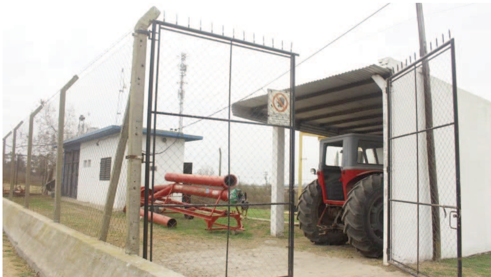
La firma Maragua deberá ejecutar una serie de tareas en el terraplén y en la estación de bombeo en un plazo de tres años.

Las tareas incluyen el mantenimiento de la estación de bombeo, mediante trabajos de pintura y reparaciones menores, además de operación, mantenimiento preventivo y correctivo de tableros eléctricos,