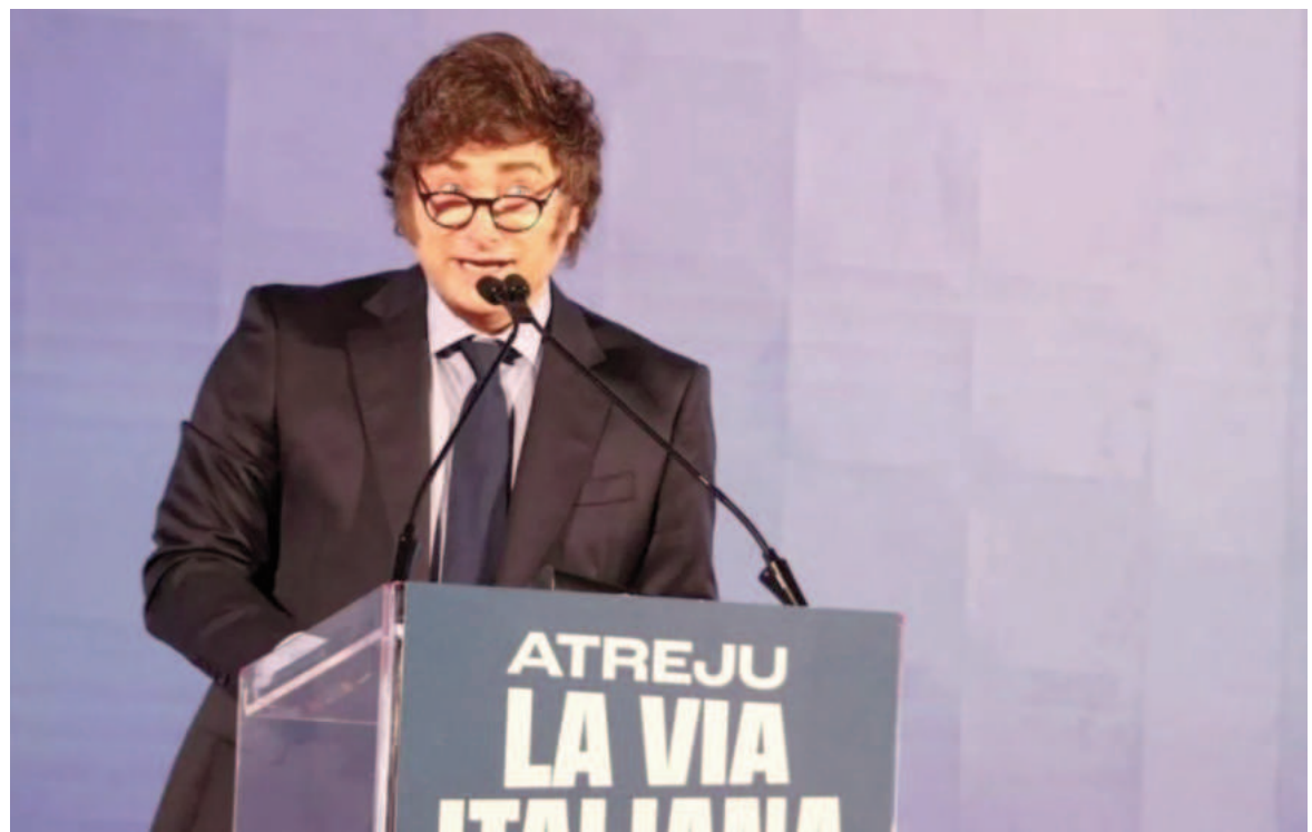
Javier Milei volvió a defender su gestión.

de la polémica por la sesión en el Senado presidida por la vicepresidenta Victoria Villarruel, que el propio Milei calificó de "inválida", y el desplazamiento del senador Edgardo Kueider. Al respecto, Milei reiteró que "en La Libertad Avanza, quien se desordena se va a su casa",