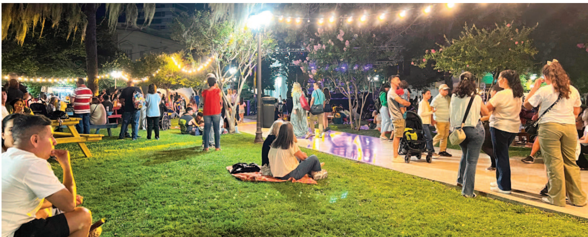
En las noches de viernes y sábado, «La Hora de la Navidad» convocó a miles de personas en la plaza Mitre.

Con una plaza Mitre adornada como nunca antes, cerró anoche la cuarta edición de «La Noche de la Navidad»: el evento municipal que desde 2021 viene conjugando música en vivo, propuestas gastronómicas y la presencia de Papá Noel en un único espacio de encuentro social. Anoche el escenario fue para Los Cadillosos Fabulacs.