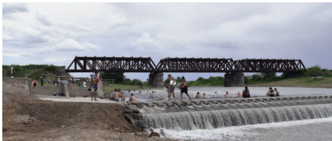
En el restaurado balneario del Molino Santa Clara, nicoleños y nicoleñas decidieron hacer una escapada y pasar la jornada de ayer al aire libre. EL NORTE

Además, serán un atractivo más para los turistas que lleguen a San Nicolás.