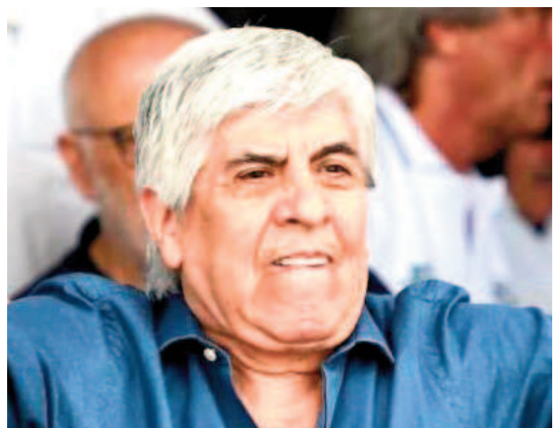
El secretario general de Camioneros, Hugo Moyano.

El conflicto refleja la tensión entre los intereses del sector sindical y las políticas económicas del Gobierno, que intenta evitar un desborde de los acuerdos salariales en medio de un contexto inflacionario complejo. La próxima reunión será clave para definir si el paro nacional anunciado por Moyano se convierte en una realidad.