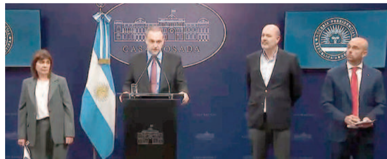
El Gobierno anunció la «desregulación» del servicio de rampas en los aeropuertos.