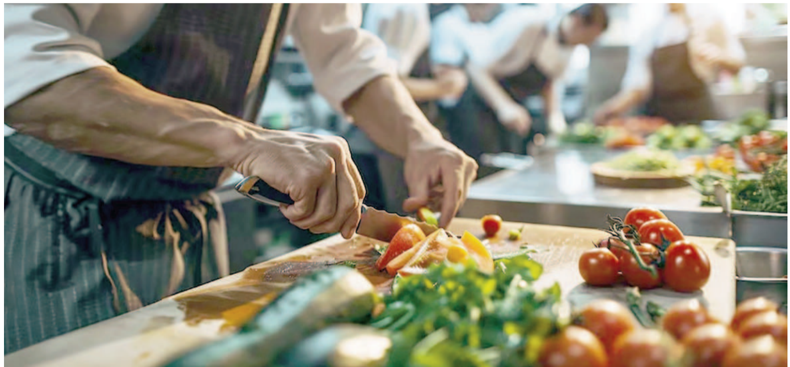
La nueva clasificación de los Best Chef Awards está basada en cuchillos y no en un ranking de los 100 mejores. ILUSTRACIÓN

En esta nueva edición se ha implementado un nuevo sistema de clasificación por niveles, sustituyendo la tradicional lista de los 100 mejores. En este formato, los chefs reciben de uno a tres cuchillos para reflejar