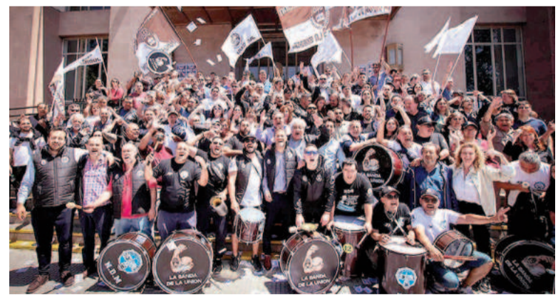
Unión de Empleados de la Justicia.

Además, los judiciales cargaron contra la Corte y le exigió que el 1.5%