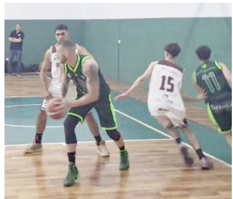
Defensores le ganó con lo justo 81 a 77 a Los Andes en la rueda inicial del torneo.

Grupo C Hoy: 21.00, Colón de Chivilcoy-San Martín de Junín (Castroagudín-JM. Tenaglia), Argentino de Pergamino-Boca del Tigre de Escobar (Geada-Daiub) y Comunicaciones de Pergamino-Los Indios de Junín (F. Tenaglia-Placentini); 21.30, Estudiantes de La Plata-Náutico de San Pedro (Dell Aquila-Almandoz).