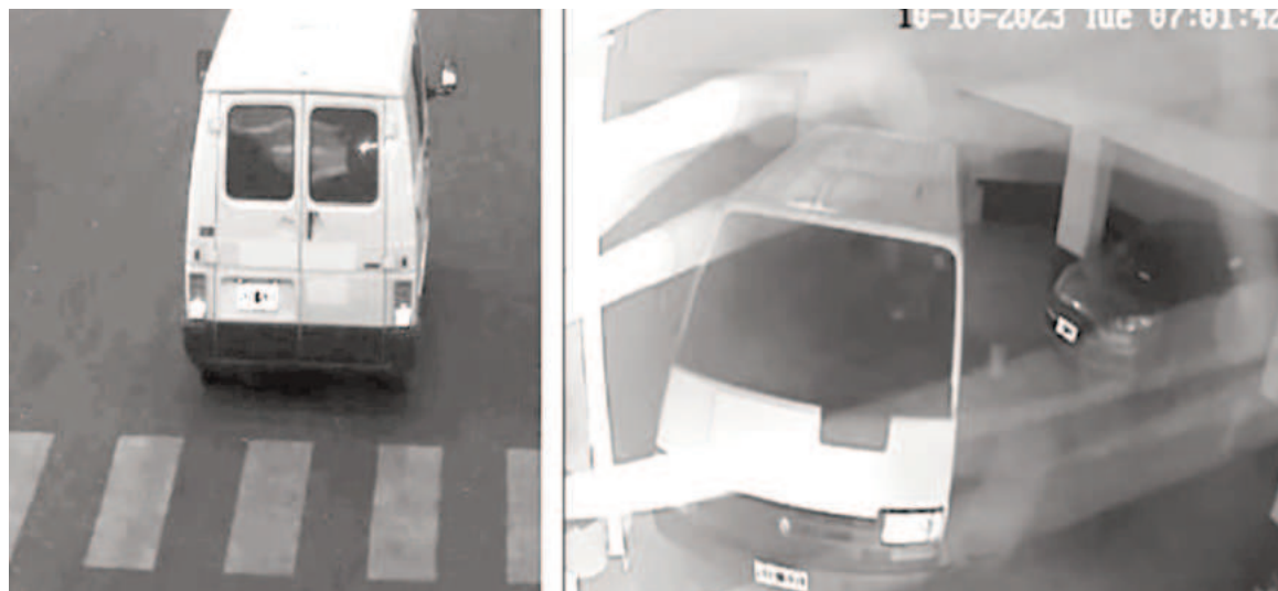
Según los fiscales Di Lello y Markevich, los secuestros extorsivos «fueron ejecutados con un grado de sofisticación que supera el estándar medio de este tipo de delitos».

Santabaya hijo solo quedó imputado por asociación ilícita y por la tenencia