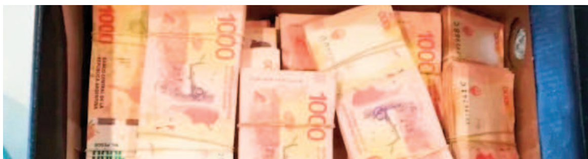
El prestamista pretende una actualización monetaria onerosa, de acuerdo al relato de la víctima.

de la deuda es muy onerosa e imposible de pagar y no se condice con los índices inflacionarios del país. El mayor temor es que cumpla con la amenaza de atentar contra la vida suya y de sus familiares al no poder cumplir con semejante exigencia de pago. El damnificado en sede policial manifestó ser desempleado y no poder afrontar el pago exigido por el prestamista.