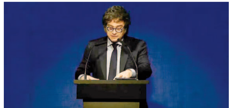
Milei celebró los datos económicos alcanzados.

Antes de comenzar con su clásico repaso de gestión económica, con fuertes críticas al kirchnerismo, el presidente insistió con que "el esfuerzo es un condimento necesario de progreso" y afirmó: "Los argentinos con suficiente edad tienen recuerdo de haber vivido épocas mejores. Pero quiero decir que de aquí en más estaremos cada vez un poco mejor. Ya hay sectores que perciben una mejora incipiente. Pronto será una realidad para todos".