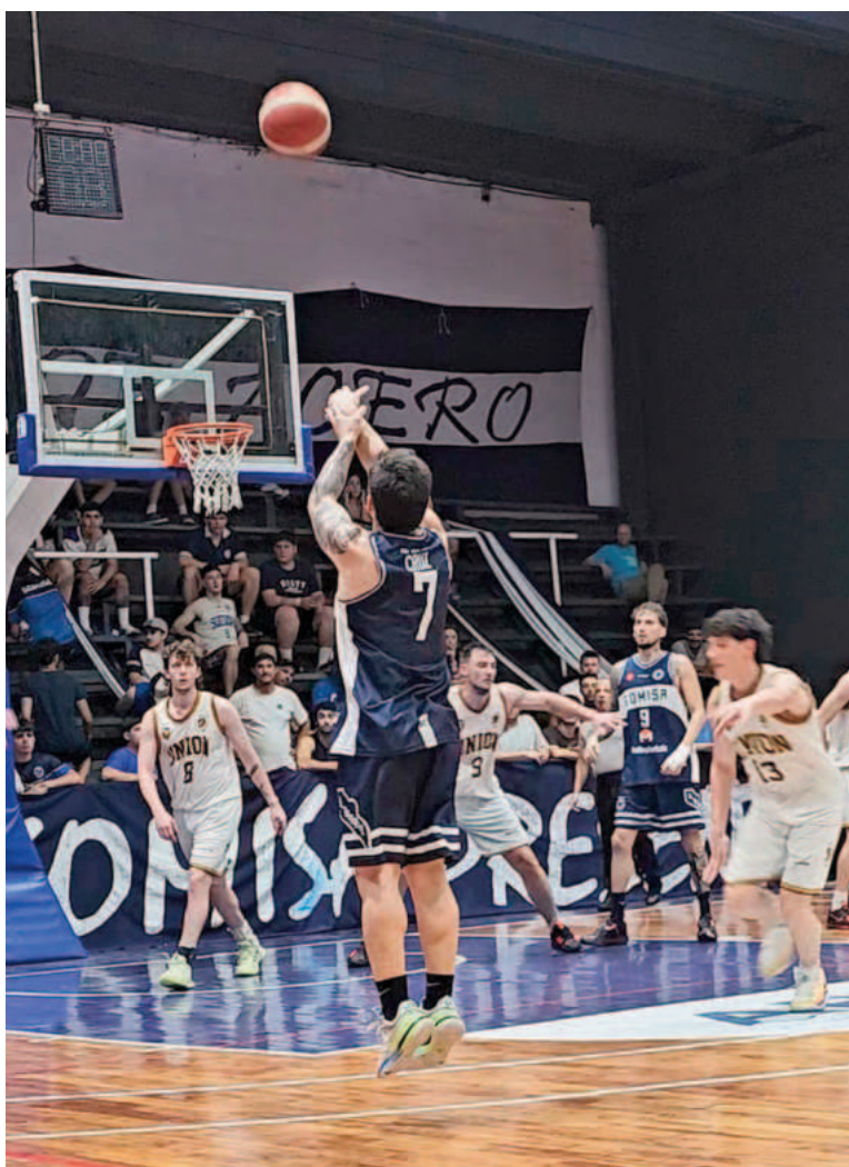
En todas las canchas habrá cosas en juego esta noche.

En el Grupo B, cada vez más sólido y más fuerte tanto en lo individual como en lo colectivo, ya a Somisa nadie podrá correrlo de las dos pri-