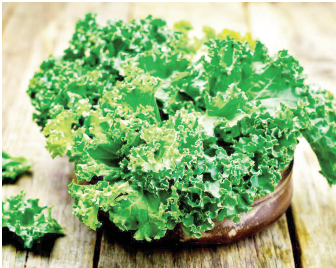
Este superalimento es conocido por su alta concentración de vitamina K, esencial para la salud ósea y la coagulación sanguínea.

mg de calcio por cada 100 gramos, el kale supera a la leche en su aporte de este mineral, contribuyendo a la salud ósea y a la prevención de enfermedades como la osteoporosis.