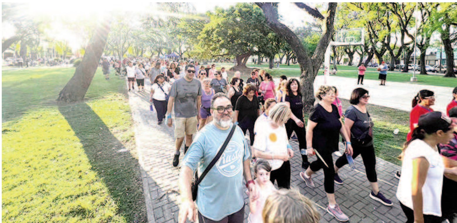
Como todos los años, la “Caminata por la salud” convocó a los nicoleños en la plaza Sarmiento.

La actividad tuvo una amplia participación de la comunidad y contó con el impulso de la Municipalidad de San Nicolás, el Círculo Médico local, CEF N° 19, EEST N° 3, ADISAN y ATLANSAD. Además, se aprovechó la oportunidad para recolectar alimentos no perecederos para Cáritas a partir de la colaboración de los participantes.