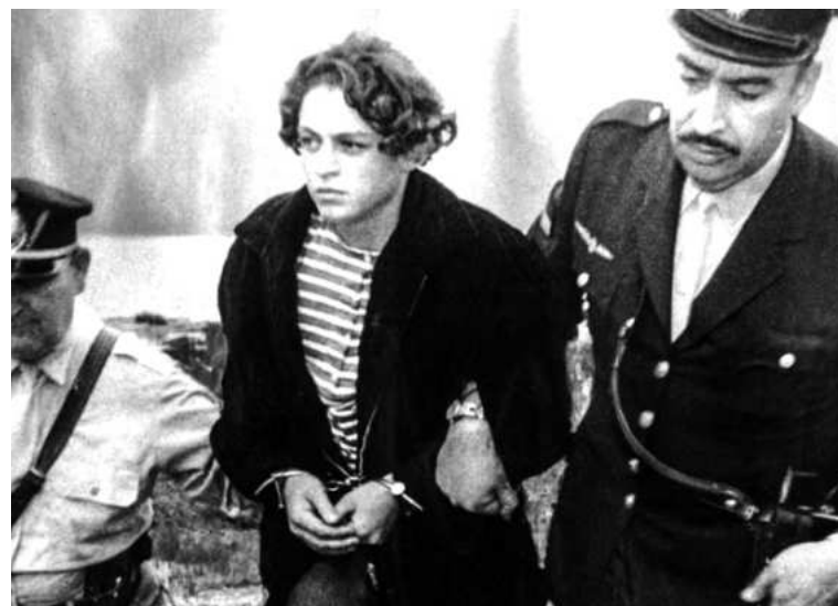
Carlos Eduardo Robledo Puch, el "Ángel de la Muerte".

La defensa deberá convencer al hombre condenado por once asesinatos para que acepte el beneficio. El obstáculo principal es la actitud del propio Robledo Puch, quien en entrevistas previas expresó que para él solo existen dos opciones: "Libertad o nada". En varias ocasiones dejó claro que no aceptará ninguna forma de régimen intermedio y solicitó in-