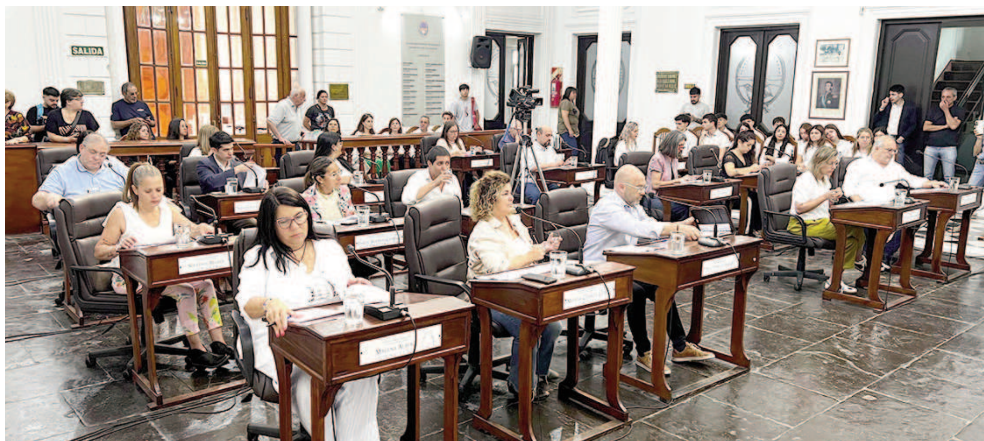
Enviados por el Ejecutivo, los proyectos de ordenanza ingresaron en el Concejo Deliberante en la sesión ordinaria celebrada ayer.