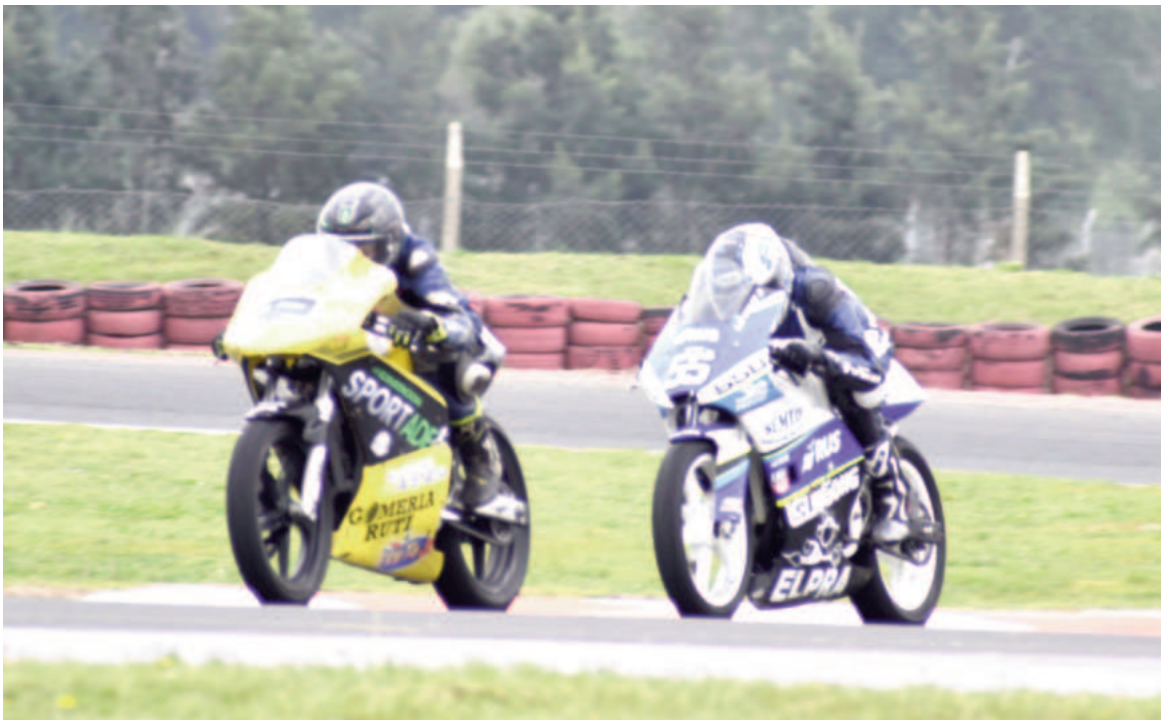
San Nicolás recibió a la categoría en varias fechas este año.

Con los primeros entrenamientos libres, hoy por la mañana comenzará la acción de la novena fecha del Superbike Bonaerense en el Circuito "Juan María Traverso". Debido al pronóstico del tiempo adverso para el domingo, todas las clasificaciones y las finales se correrán mañana sábado.