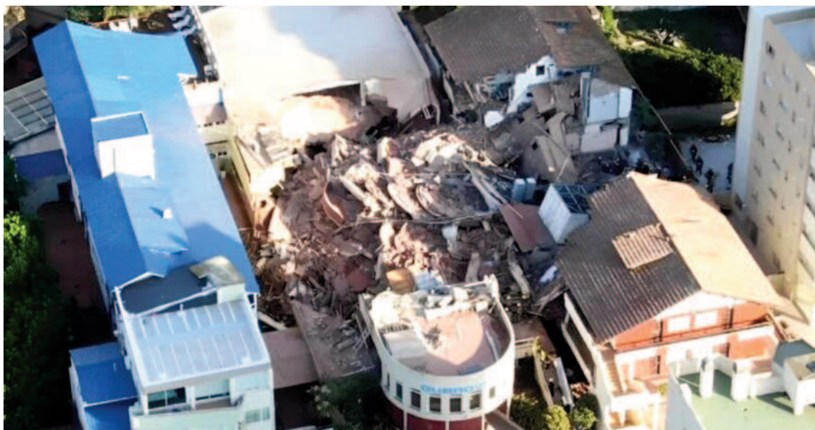
Vista aérea del colapso del Hotel Dubrovnik.