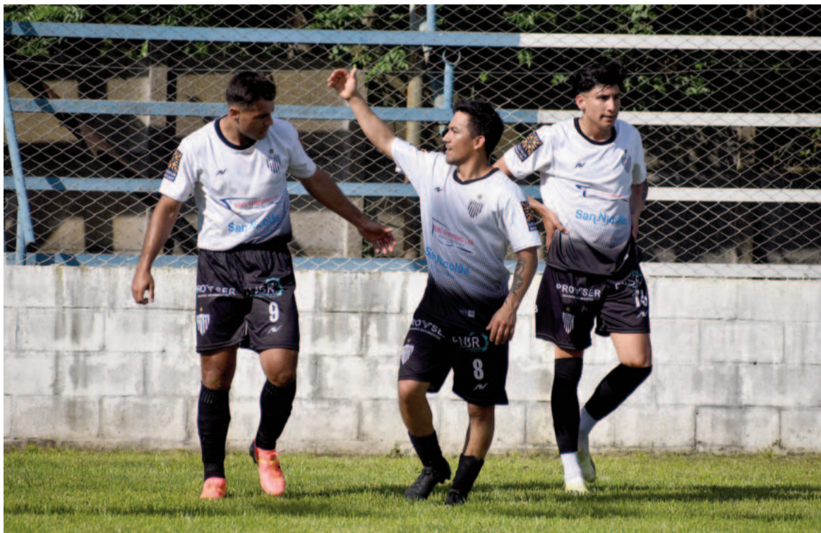
El Pañero está invicto y buscará mantener dicha condición en Zárate. EL NORTE

El Pañero visitará a Central Buenos Aires desde las 17.00 en cancha de CADU, en el encuentro de ida de los 16avos de final de la Región Pampeana Norte. Tras haber sido el mejor de la zona 8, los de Nardoni irán por un buen resultado hoy para definir la semana que viene en casa.