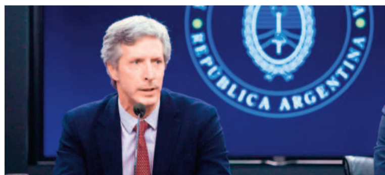
El presidente del Banco Central, Santiago Bausili.

“¿Por qué alguien pagaría $ 1500 con el dólar tarjeta, como lo hacen por u$s 400 millones al