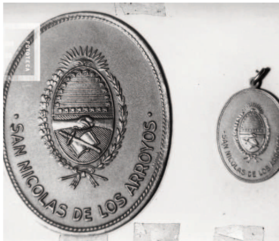
Plaqueta y medalla conmemorativa del 150º aniversario de la efeméride.

Desde el Sanatorio de la Fundación Nuestra Señora del Rosario (UOM) saludamos a todos los vecinos de San Nicolás, reconociendo que integramos una ciudad que fue epicentro de notables acontecimientos históricos, que le abrieron la declaración como tal hace 205 años.