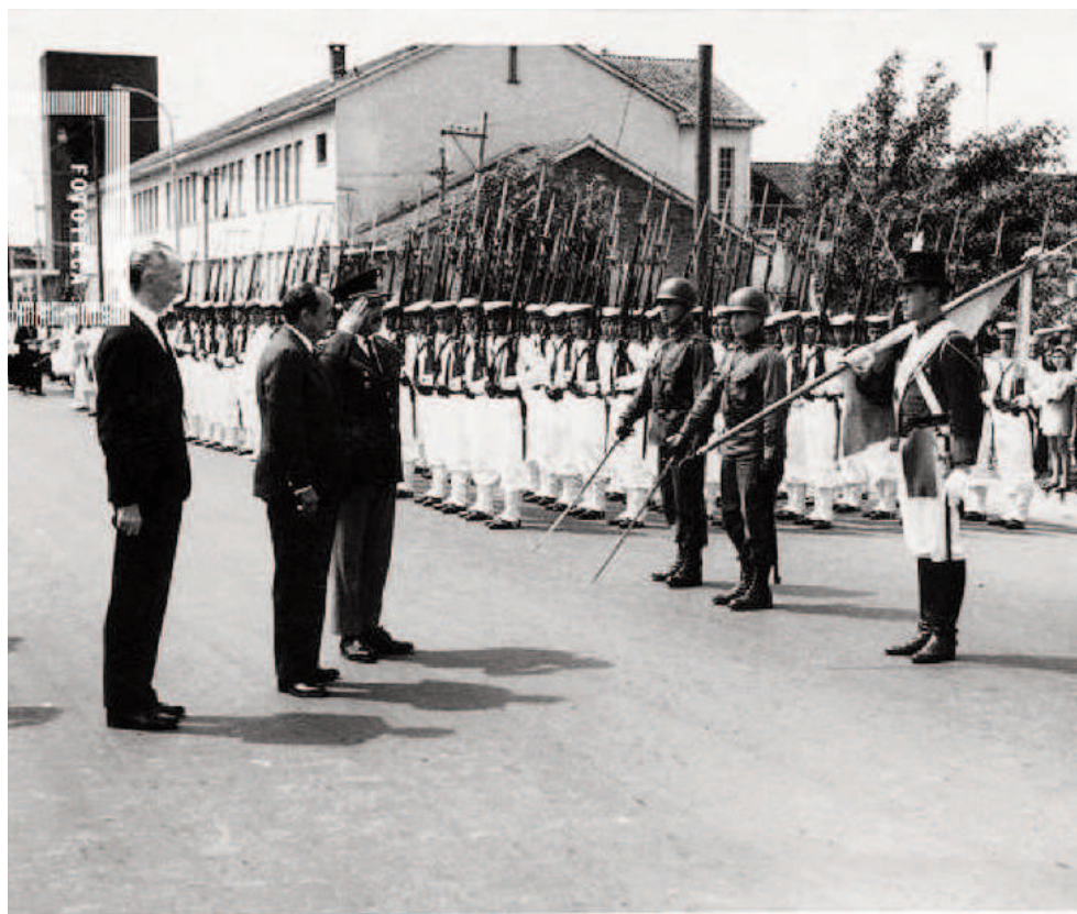
Sesquicentenario de la Declaración de Ciudad.

La Declaración de Ciudad fue conmemorada en diversas oportunidades mediante actos, desfiles, medallas, monumentos de personas significativas que posibilitaron esta efeméride como el Pbro. Antonio Sáenz y con el nombre de una plaza que se denomina como la fecha especial: 23 de Noviembre (donde hoy se emplaza la Escuela Normal).