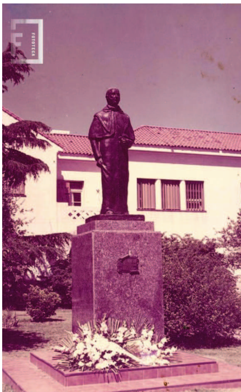
Monumento al Pbro. Antonio Sáenz, en la Plaza 23 de Noviembre.