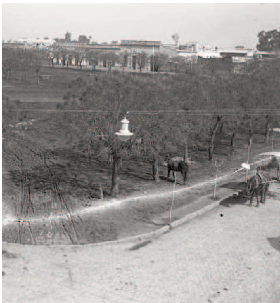
Plaza del Marchamo, 1915 (hoy 23 de Noviembre, Escuela Normal).