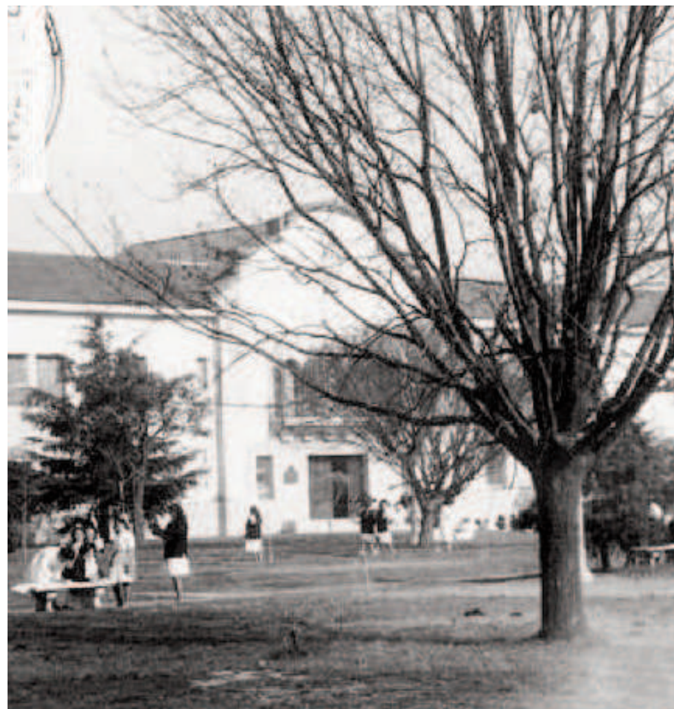
Escuela Normal, 1963.