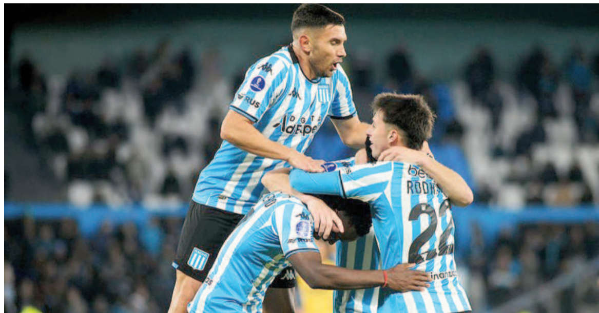
La Academia quiere coronarse en Paraguay ante Cruzeiro.

En relación con el equipo que se enfrentó a Corinthians, Costas