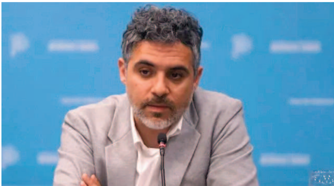
Cristian Girard, titular de ARBA, defendió el proyecto de ley impositiva de 2025.

"Para casi el 90 por ciento de los contribuyentes, el incremento en la patente será del 13,8 por ciento, muy por debajo de la inflación proyectada", afirmó Girard. Según el Relevamiento de Expectativas del Mercado (REM) elaborado por el Banco Central, la inflación de 2025 será de 35 por ciento y según