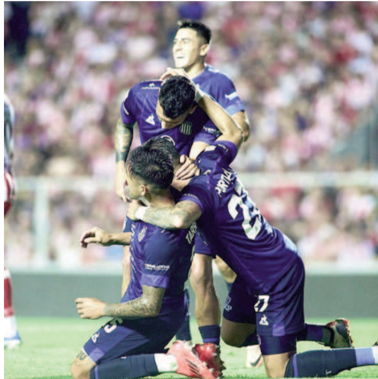
El equipo cordobés se quedó con un partidazo ante Unión y sueña. WEB

minutos, el equipo de Medina amplió la ventaja en el marcador con el gol de Tarragona. Desde el sector izquierdo desbordó Galarza, el paraguayo tiró el centro y el ex San Lorenzo de volea definió al primer palo para poner el 3-1 a favor de Talleres.