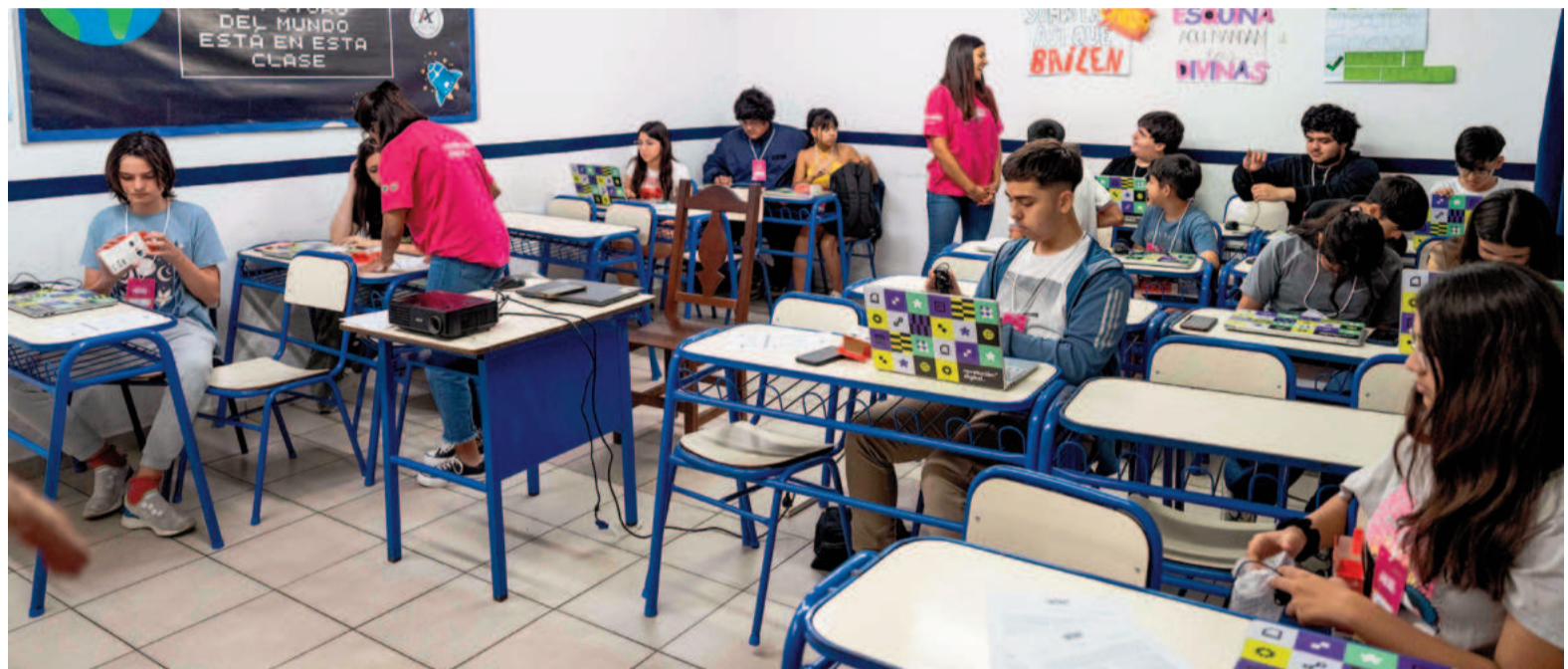
A través del curso los participantes no solo sumarán habilidades técnicas, sino que desarrollarán videojuegos inspirados en el Eco Parque.

Cabe destacar que para las clases se utilizan las computadoras gestionadas a través del