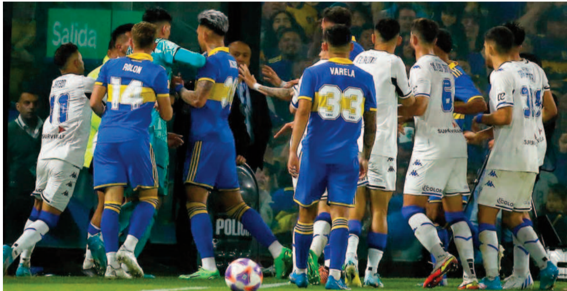
Boca y Vélez, un duelo clave esta noche en el Kempes. ARCHIVO

El equipo de La Ribera viene de igualar ante Huracán 0 a 0 y comenzó su participación en la Copa Argentina con un triunfo ante Central Norte 3 a 0, luego superó a Almirante Brown 2 a 1 y tanto en octavos como cuartos de final necesitó de los penales para avanzar. Primero eliminó a Talleres de