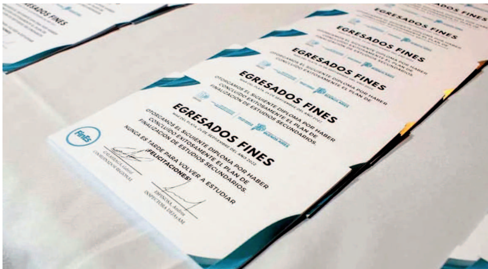
El plan FinEs es gratuito y se caracteriza por su modalidad semipresencial con acompañamiento de docentes tutores.

Ambas modalidades tienen un enfoque flexible y personalizado. Una vez realizada la inscripción, se asignará un establecimiento de cur-