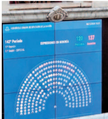
Sin quorum para derogar el decreto de canje de deuda.

No fueron los únicos. El bloque Unión por la Patria –uno de los convocantes– tuvo seis deserciones, cuatro de los cuales responden al gobernador de Catamarca, Raúl Jalil.