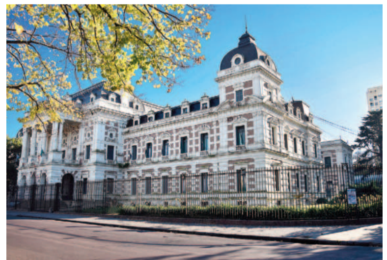
Casa de Gobierno bonaerense.

Además, se estableció en 325.551 la cantidad de horas cátedra para el Personal Docente Titular (Planta Permanente) y en 3.222.505 la correspondiente al Personal Docente Provisional (Planta Temporaria). En tanto, se propone en 15.867 el número de cargos de la Planta Permanente y en 1.882 el número de cargos de la Planta Temporaria de la Caja de Jubilaciones, Subsidios y Pensiones del Banco Provincia; Instituto de Obra Médico Asistencia (IOMA); Instituto Provincial de Lotería y Casinos y del Banco de la Provincia de Buenos Aires.