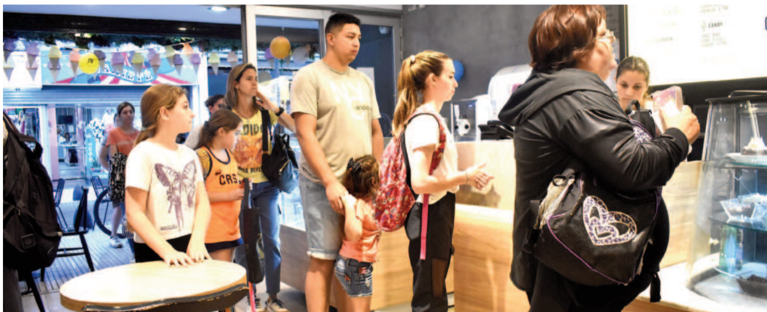
El evento promete atraer a cientos de personas en busca de los mejores sabores artesanales.

La cita es hoy a partir de las 19 horas, cuando más de 500 heladerías de todo el país abrirán sus puertas con descuentos y promociones especiales. En esta jornada especial, las heladerías ad-