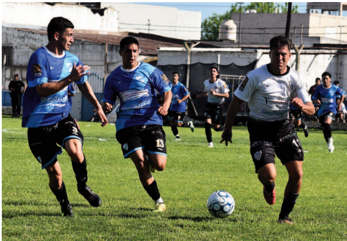
La Emilia y Paraná jugarán sus fichas esta noche.

Se enfrentarán hoy a partir de las 20:00 en el Estadio "Jacinto 'Gato' López" por la sexta fecha de la zona 8 de la Región Pampeana Norte. Al pañero le alcanza un empate para avanzar, y el Albiceleste necesita ganar.