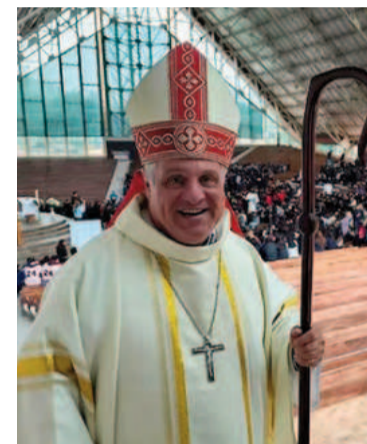
El arzobispo de Mendoza, Marcelo Colombo.

El arzobispo de Mendoza, Marcelo Colombo, fue elegido ayer como nuevo presidente de la Conferencia Episcopal Argentina, en una señal de continuidad y alineamiento sin fisuras con el magisterio del papa Francisco.