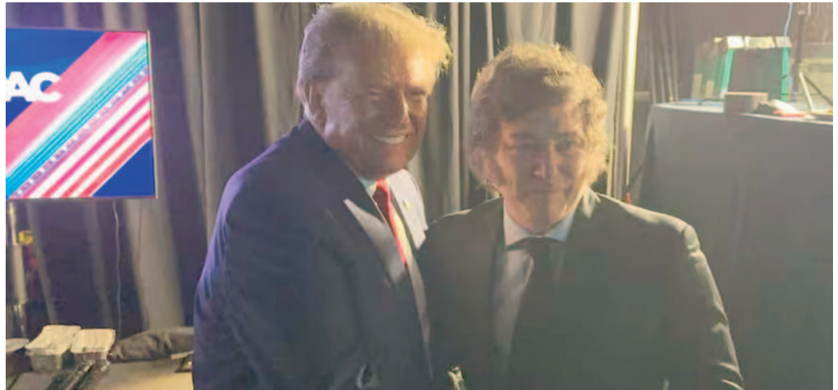
Donald Trump y Javier Milei, en la cumbre de conservadores en la que se encontraron por primera vez.

Conversaron durante 10 minutos y también participó el canciller Gerardo Werthein; según Adorni, el norteamericano le dijo a Milei: «Usted es mi presidente favorito».