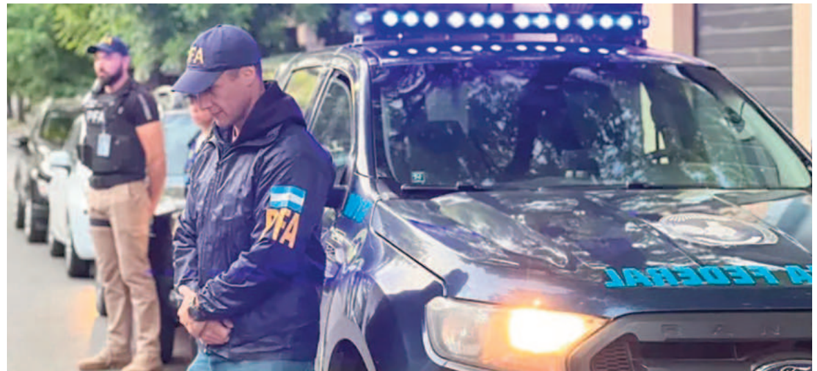
La Policía Federal desarrolló un amplio despliegue.

En una masiva operación de alcance provincial, el Ministerio Público de Buenos Aires llevó a cabo 114 allanamientos simultáneos en 65 localidades, incluyendo San Nicolás, para dismantelar redes de pornografía y abuso sexual infantil.