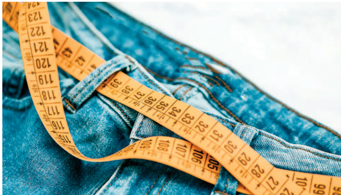
El Estudio Antropométrico Argentino tiene un fin claro: precisar las dimensiones corporales de la población en relación con su género, edad y región. ILUSTRACIÓN

Como ya reflejó en varias oportunidades este medio, muchos lo-