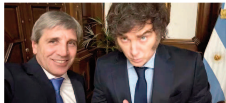
Javier Milei junto a Luis «Toto» Caputo.

El presidente viene señalando en sus intervenciones públicas que la