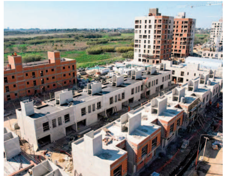
Actualmente, hay 17 mil casas en construcción.

Este plan está contemplado en el artículo 5 de la Ley Bases, que establece que el Poder Ejecutivo puede "modificar, transformar, unificar, disolver o liquidar los fondos fiduciarios públicos", en cumplimiento con las reglas específicas de cada fondo y las disposiciones de sus normas constitutivas. Esta normativa, que define el manejo de este tipo de fondos, otorga al gobierno la facultad de intervenir y ajustar su estructura según las disposiciones aplicables.