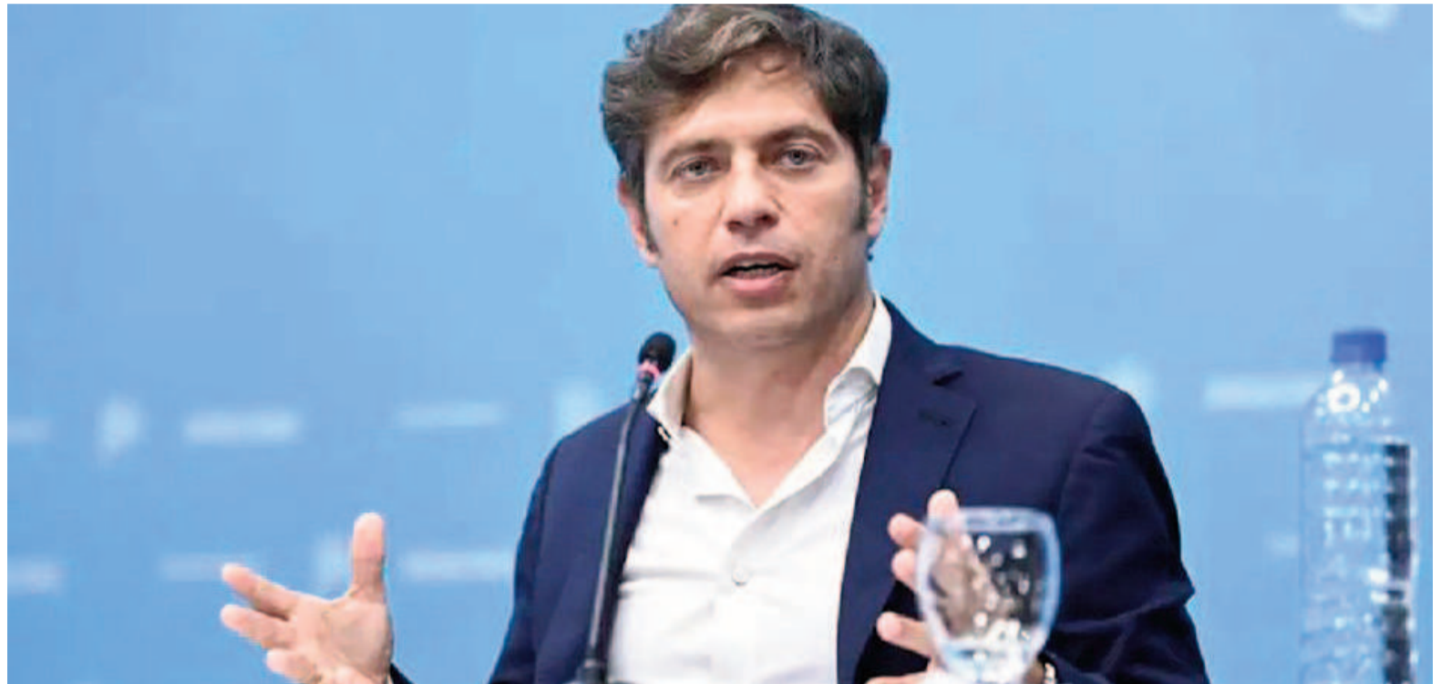
Kicillof pidió permiso para contraer importante deuda.

En este marco, el Poder Ejecutivo solicitó contraer deuda al Sector Público Provincial en pesos por un monto equivalente a USD1.045.000.000. También pidió permiso para emitir Letras del Tesoro en pesos u otras monedas por hasta la suma equivalente USD250.000.000. De este modo, la suma total asciende a USD1.295.000.000. En el artículo 33 de la iniciativa presupuestaria se pide autorización "al Sector Público Provincial a endeudarse en pesos u otras monedas por hasta un monto equivalente a la suma de dólares estadounidenses un mil cuarenta y cinco millones (USD1.045.000.000)". La intención es "afrontar la cancelación y/o renegociación de deudas financieras y/o judiciales no previsionales, y/o de los servicios de deudas, como así también tender a mejorar el perfil de vencimientos y/o las condiciones financieras de la deuda pública, atender el déficit financiero, regularizar atrasos de Tesorería, otorgar avales, fianzas y/u otras garantías, financiar la ejecución de proyectos y/o programas sociales