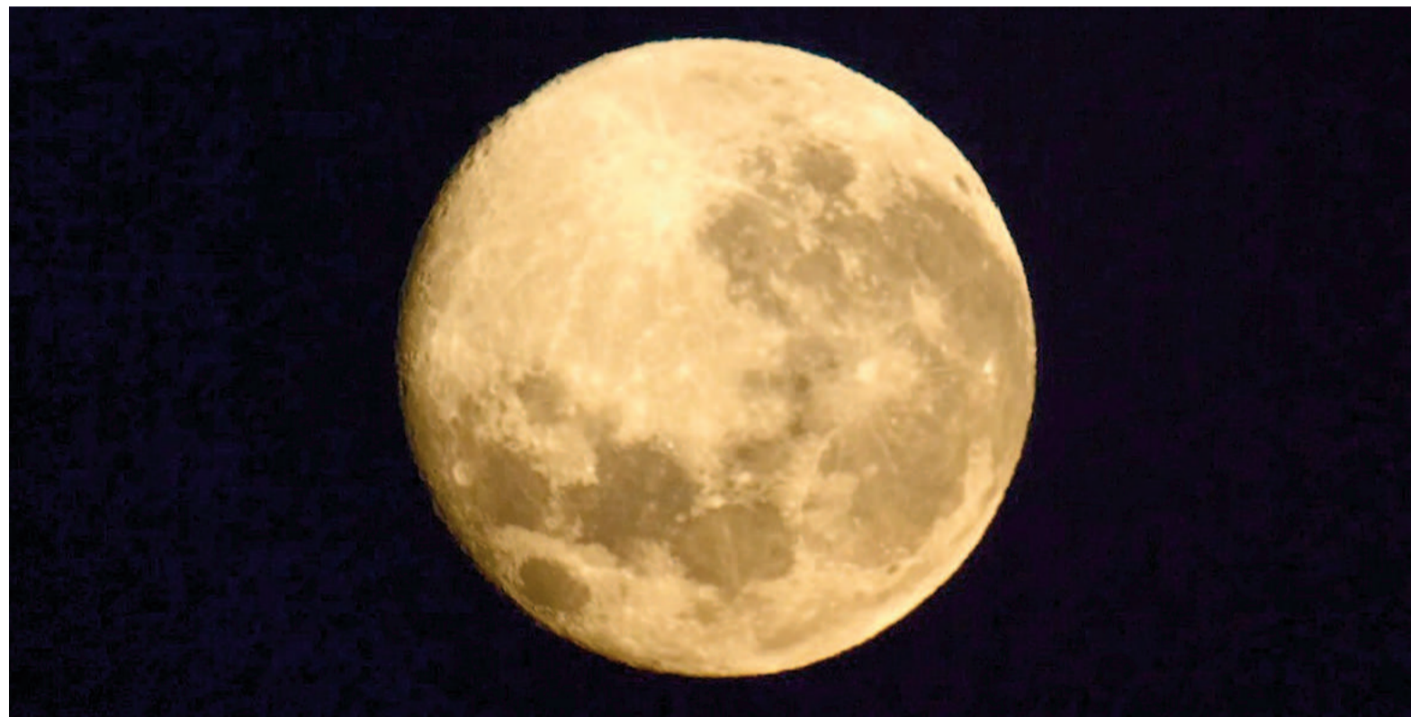
La superluna de noviembre coincidirá con el perigeo lunar, el punto más cercano de la Luna a la Tierra, aumentando su tamaño y luminosidad.

bre será la cuarta y última de 2024. De esta manera, completará un ciclo que también incluyó las superlunas de agosto, septiembre y octubre.