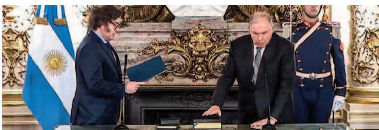
Asumió el nuevo canciller.

Gerardo Werthein asumió ayer como nuevo canciller de Argentina, después de haber jurado ante el presidente Javier Milei en un acto que se llevó a cabo en el Salón Blanco de la Casa de Gobierno. El exembajador en los Estados Unidos juró por «Dios, la Patria y sobre la Torá». Se trató de la primera vez que un funcionario jura con una alusión al libro sagrado de la religión judía. La breve ceremonia se realizó en el Salón Blanco de la Casa Rosada con la presencia de familiares del nuevo canciller y los ministros del Gabinete. Werthein, de 68 años, toma el control de la diplomacia argentina