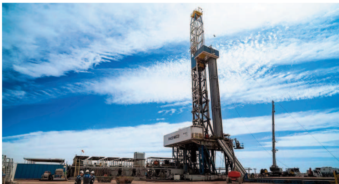
Con la reversión se beneficiarán Córdoba, Tucumán, La Rioja, Catamarca, Santiago del Estero, Salta y Jujuy.