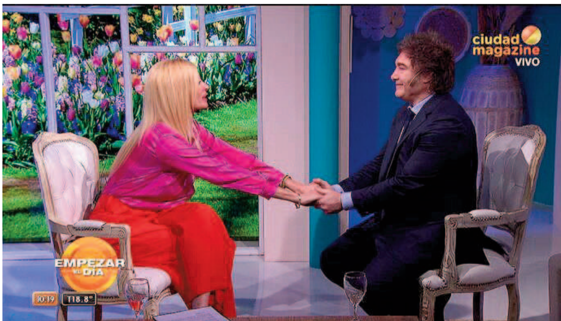
Milei visita el programa de su novia, Yuyito González.

Luego arremetió contra los diplomáticos de carrera que integran la Cancillería: “Entiendo que ellos están enamorados de la burocracia internacional, viven una vida parasitaria, es la agenda woke dentro de la agenda 2030, que busca avanzar sobre las libertades individuales; es un conjunto de imbéciles y arrogantes que se creen que le pueden manejar la vida al resto, pero si quieren manejar un país, que vayan y ganen las elecciones”, los desafió.