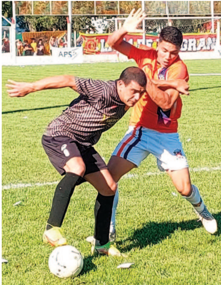
Belgrano se medirá ante La Emilia en cuartos de final. EL NORTE

La Zona C ya tenía a Conesa y Paraná clasificados con anticipación. Defensores tenía chances de ser uno de los mejores terceros y goleó al Albiceleste por 5 a 1 en el "Salomón Boeseldín". De esa manera totalizó 12 puntos, pero no le alcanzó para lograr su objetivo y quedó como el peor tercero. En el Apertura había clasificado en la última jornada y después se consagró