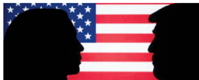
Las encuestas muestran un empate técnico entre ambos candidatos.

En Nevada, la ventaja es mínima pero favorece a Kamala Harris, con un 47,4% frente al 47,1% de Trump. En Michigan y Carolina del Norte, los márgenes también son estrechos: Trump supera a Harris por 0,4% y 0,6%, respectivamente. En Wisconsin, Harris saca ventaja con un 48,2% frente al 47,5% de Trump. Estos «swing states» son cruciales, ya que