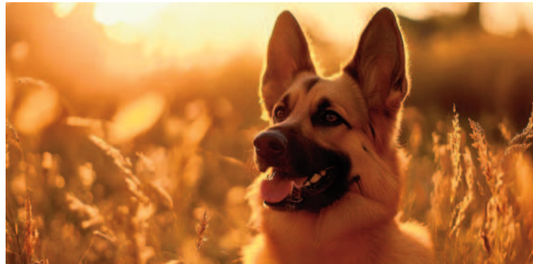
Respetar la personalidad de cada perro refuerza su bienestar.

● 1. Permitirles olfatear: una actividad esencial para su felicidad. Los perros viven en un mundo de olores, y el olfato es su sentido más desarrollado. Según la ciencia del bienestar animal, permitirles olfatear a su gusto en los paseos mejora su felicidad y les ofrece una experiencia enriquecedora. Este acto, comparable a una "vista panorámica" para ellos, no solo les proporciona información importante, sino que también los ayuda a relajarse y disfrutar el momento. No hay que apu-