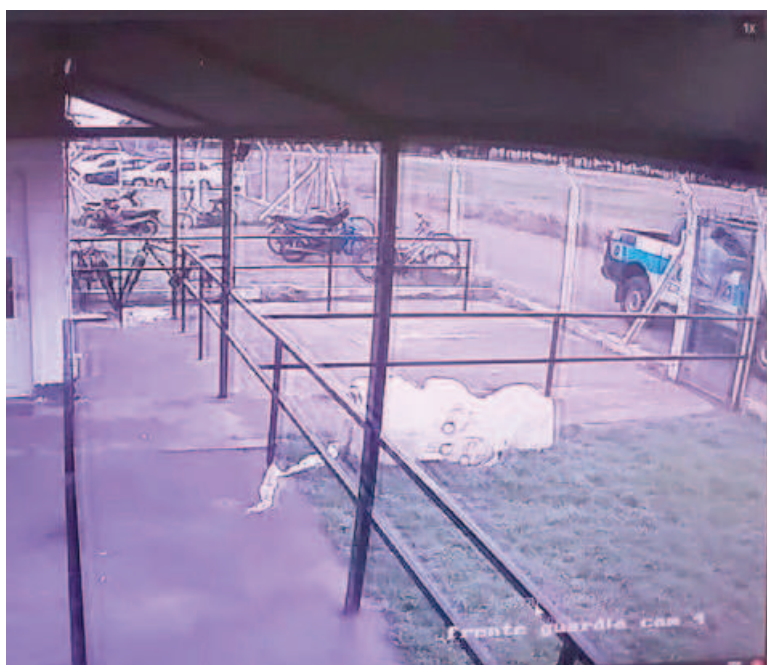
Las cámaras de seguridad registraron el móvil policial dentro del predio avícola de Guerrico.

Con estas evidencias, el fiscal Fernando Delío elevó las actuaciones iniciales al Juzgado Fe-