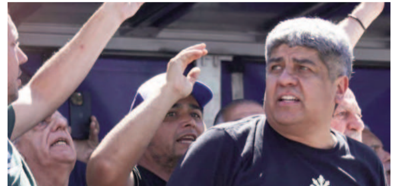
Moyano adelantó que están preparando un paro general para diciembre.

Luego, al referirse a las políticas económicas del gobierno, el líder de los Camioneros señaló que los índices difundidos por el INDEC no reflejan lo que sucede en la calle, donde el