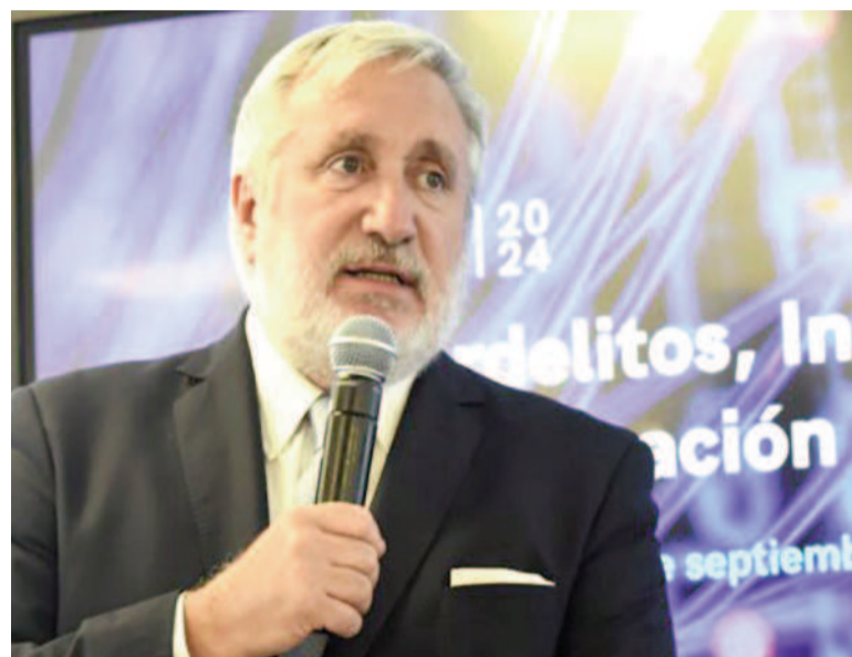
El procurador general de la Suprema Corte de Justicia, Julio Conte-Grand.

“No los considera incapaces a determinada edad, sino que reconoce que hay una evolución y esa evolución corresponderá a los casos particulares, que habrá que examinar individualmente”, dijo Conte-Grand. Señaló que cree que “esta figura puede ser algo que también deba tenerse en cuenta al tiempo de, eventualmente, modificar el régimen de disponibilidad de los menores. Pero sostenemos que la baja de la imputabilidad aislada no es una solución”.