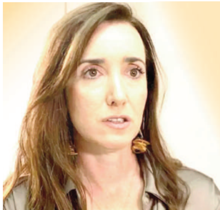
La vicepresidenta Victoria Villarruel.

El mensaje hace referencia a la polémica abierta desde hace varias