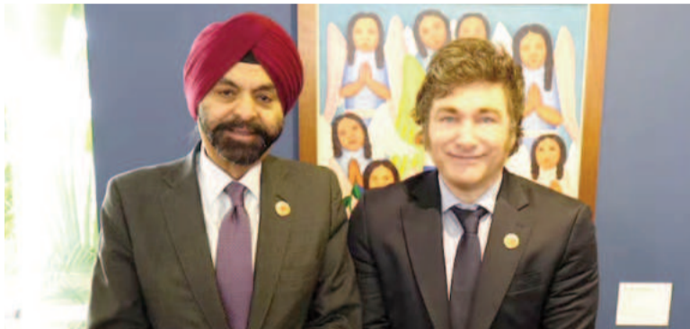
El presidente argentino junto al titular del Banco Mundial, Ajay Banga.