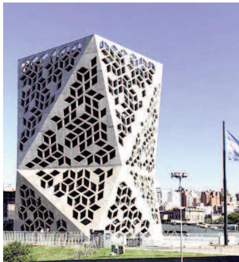
Casa de Gobierno de la provincia de Córdoba.

«No me dieron la contención que necesitaba. Hace 15 días que vengo con estudios de psicólogos en el Cen-