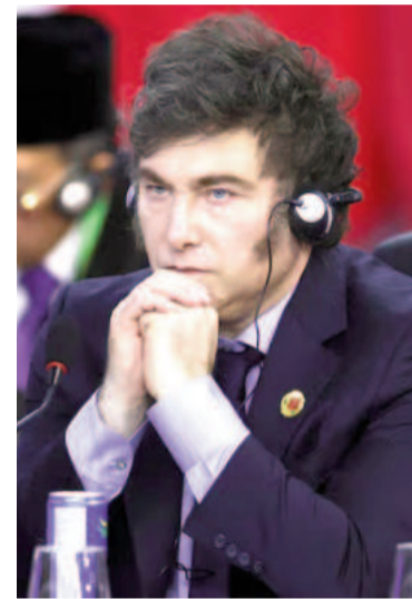
El presidente Milei en el G20.

“Nunca verán a nuestra administración defender propuestas que impliquen mayor presión fiscal —insistió Milei en su primer discurso del día—, ni propuestas de desarrollo sostenible que prioricen caprichos de políticos con la panza llena en países ricos, cuando los países pobres necesitan