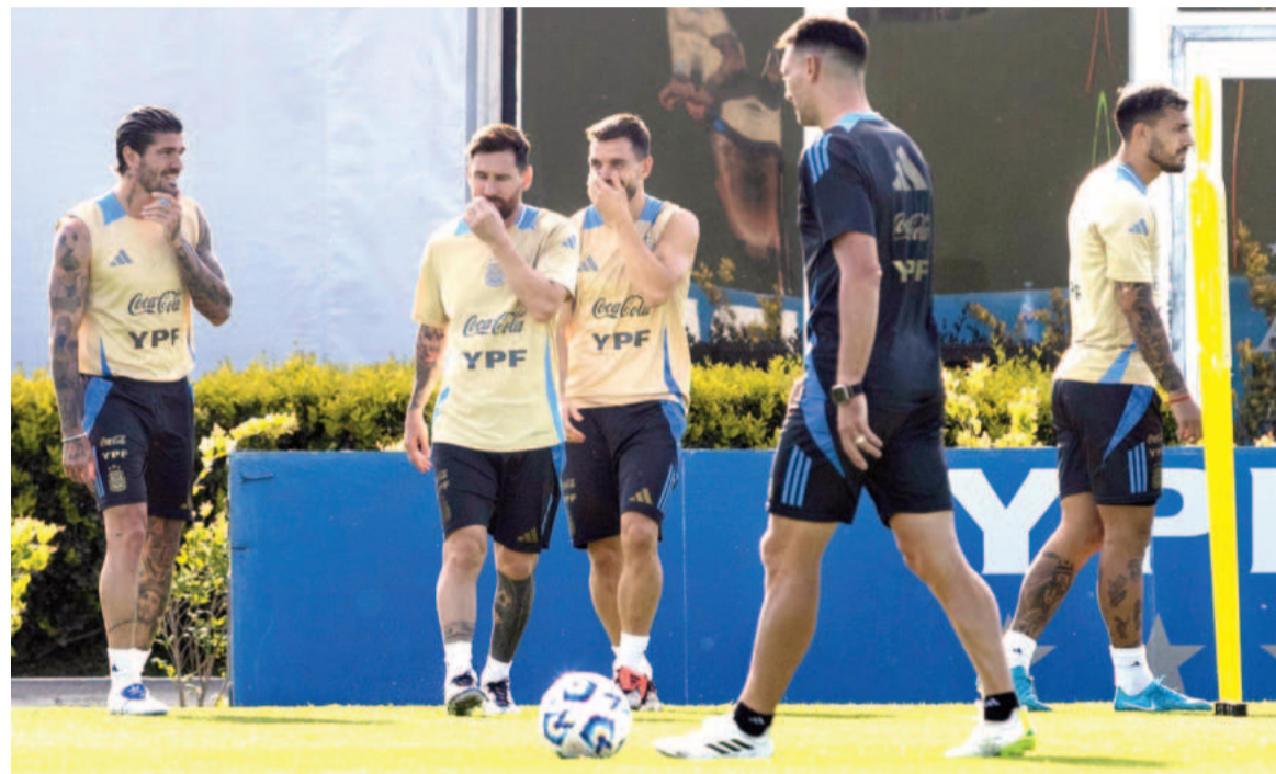
La Selección argentina quiere terminar bien el año.

La «Albiceleste» que viene de caer ante Paraguay, recibirá hoy a Perú en la Bombonera con la ambición de recuperar el camino del triunfo en el último partido de 2024.