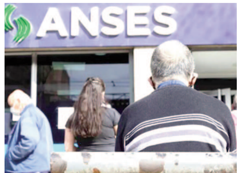
Novedades para los jubilados.

No obstante, subrayó que un ajuste aislado de la edad de jubilación no resolvería los problemas estructurales del sistema. «Considero que el cambio de la edad puede ser uno de los puntos de una futura reforma previsional, pero en forma aislada no es conducente», sostuvo.