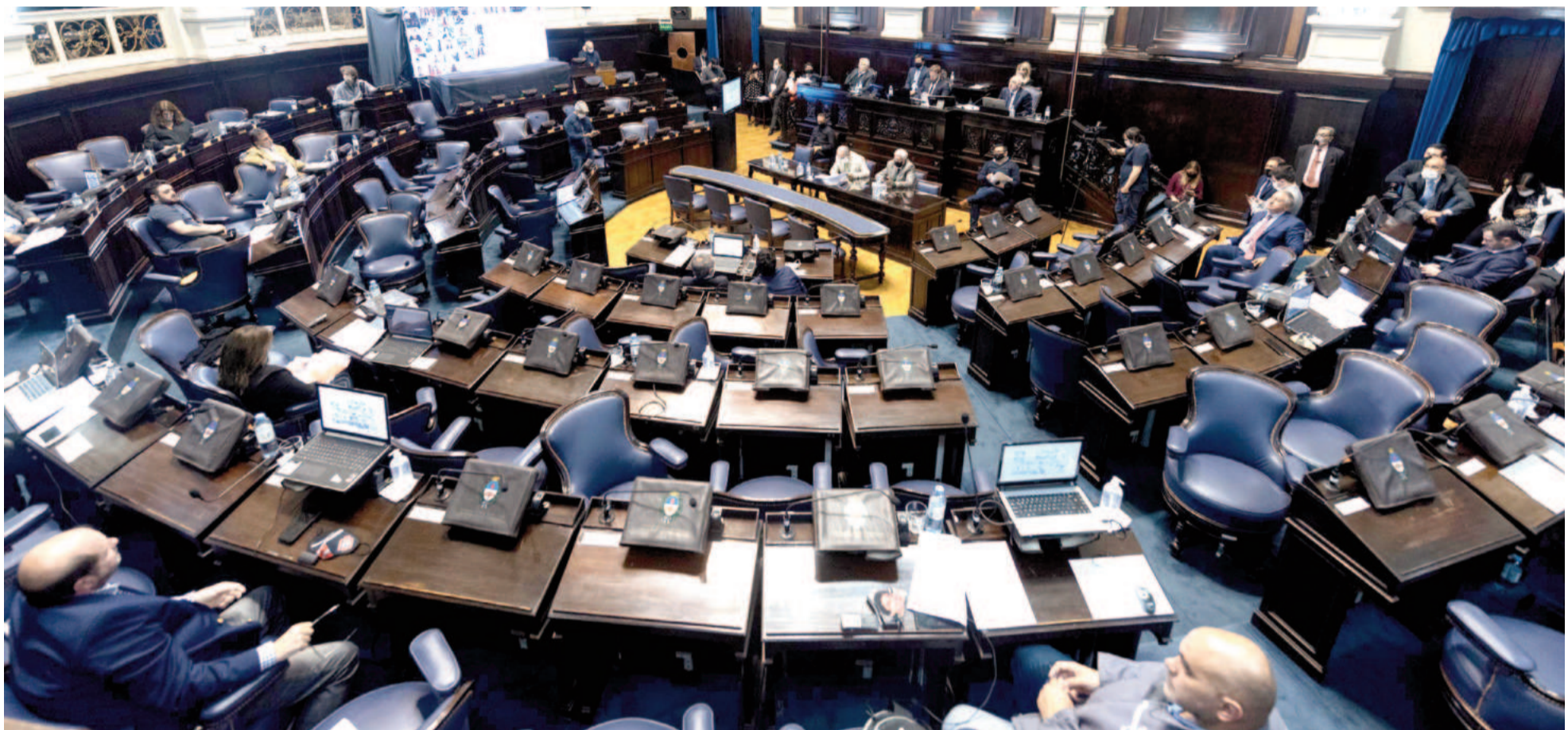
El proyecto fue impulsado por referentes de La Cámpora en la Cámara de Diputados, donde ya obtuvo media sanción.

Con media sanción en Diputados, el proyecto busca modificar el Régimen legal de la Caja de Previsión Social para Abogados de la provincia de Buenos Aires. El Colegio de Abogados del Departamento Judicial San Nicolás expresó que la aprobación de la iniciativa constituiría una “intromisión” y un “precedente peligroso”.