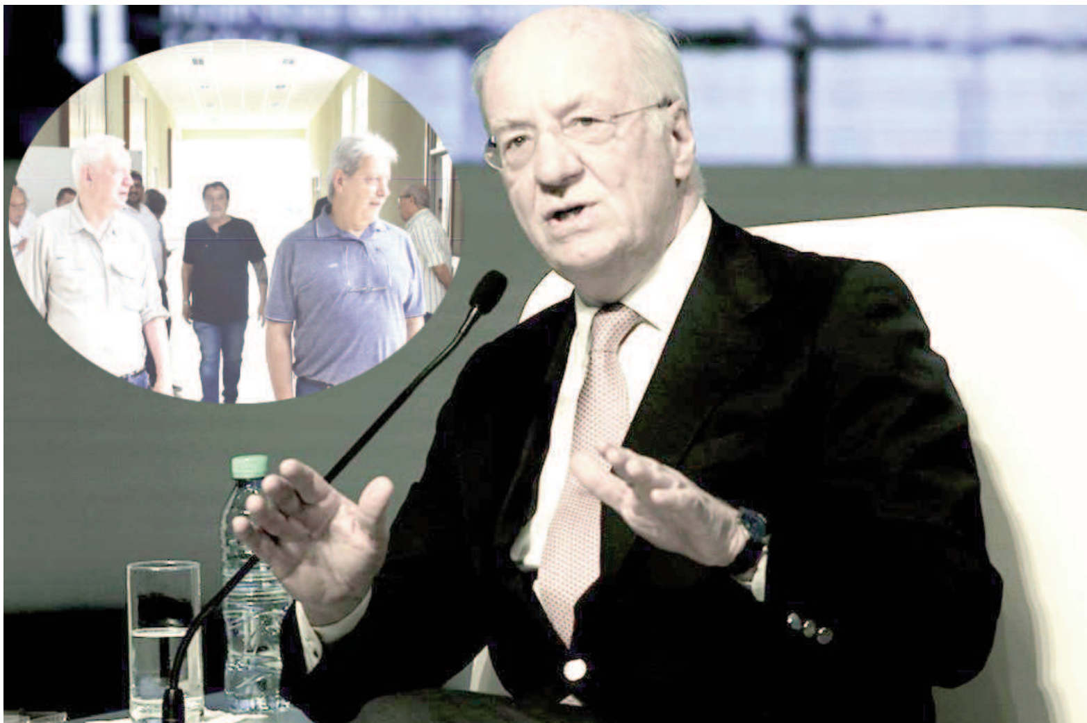
El encuentro entre los dirigentes gremiales y el CEO de Techint se produciría el viernes en la planta industrial General Savio.