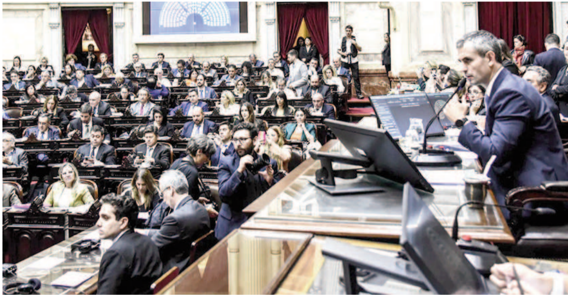
La Cámara de Diputados vuelve a sesionar mañana.

Hasta ahora, no tienen esa mayoría por lo cual es posible que deban hacer cambios para asegurar los votos para aprobar el proyecto.