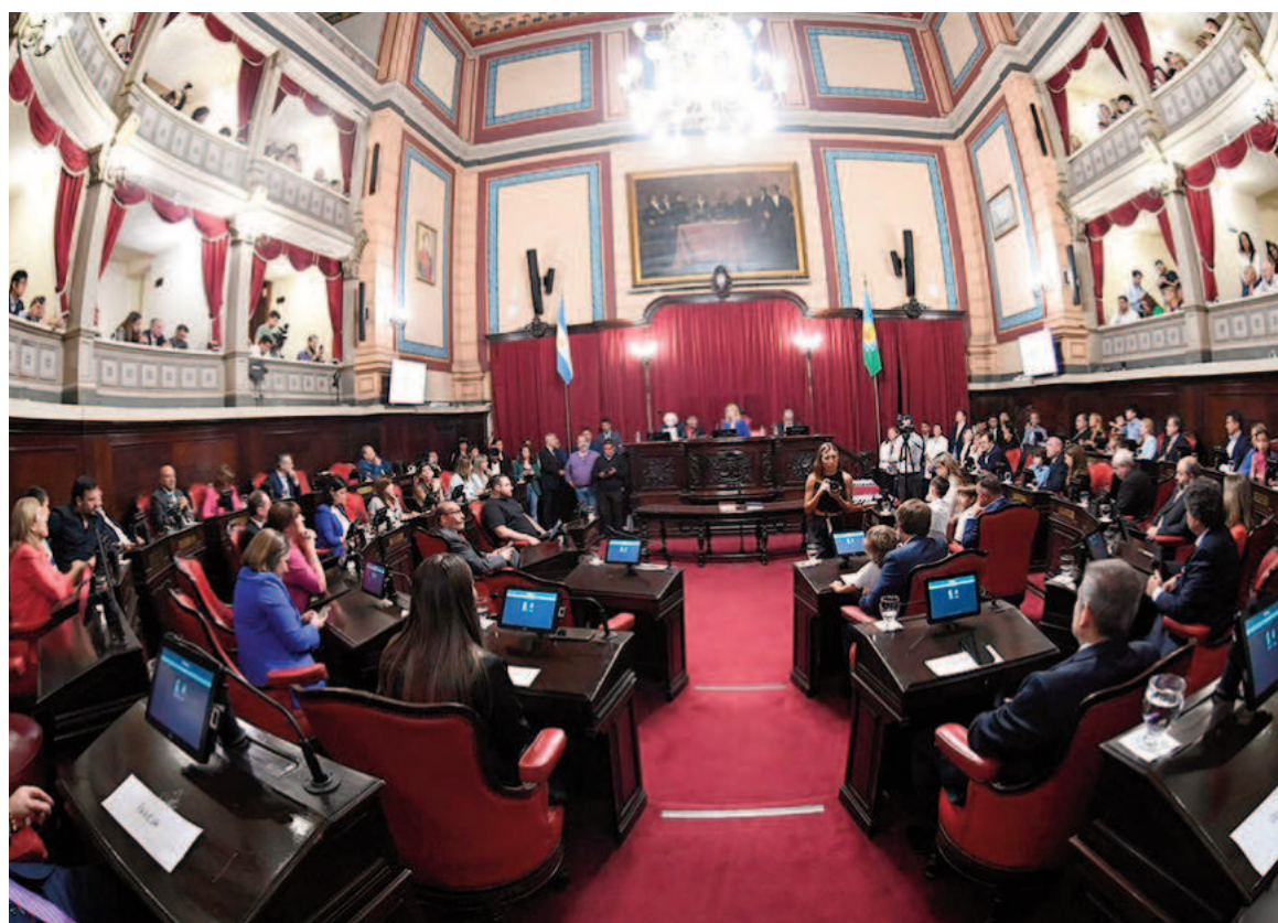
Los pliegos ingresaron al Senado, y con esta segunda etapa se cierra una cifra total en el año de unos 400, aproximadamente.