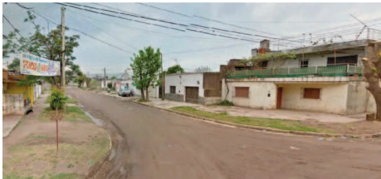
Robo en barrio 21 de Octubre.

Un comerciante denunció ayer domingo que entraron a robar por la madrugada a su departamento ubicado en la zona norte de Santa Fe capital. Apenas llegó la policía, la víctima informó que se habían llevado un botín equivalente a 1.300.000 dólares, pero más tarde cambió su versión. La mecánica del robo y todo lo que ocurrió a continuación abrieron varios interrogantes alrededor del hecho, que ya están siendo investigados por la Justicia.