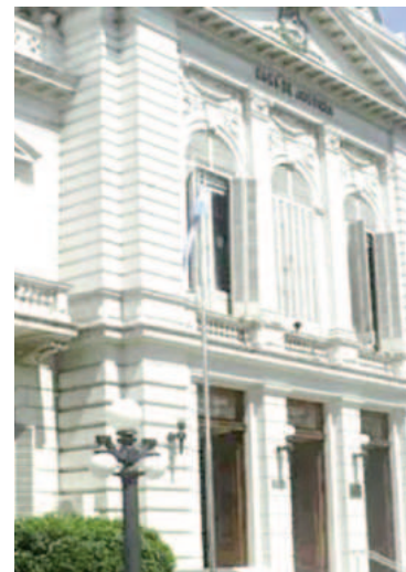
El edificio de la Corte Suprema bonaerense.