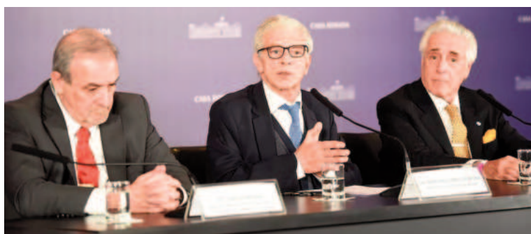
El ministro de Justicia, Mariano Cúneo Libarona.

Según Losada, es necesario cambiar la lógica de “te creo porque sos mujer” al “te creo porque decís la verdad”, y mencionó al “hembrismo” como el equivalente al “machismo”, lo que hizo “un verdadero daño al feminismo”. Además, recordó que la falsa denuncia está tipificada en la actualidad – “un chiste”, dijo-, con “una multa que va