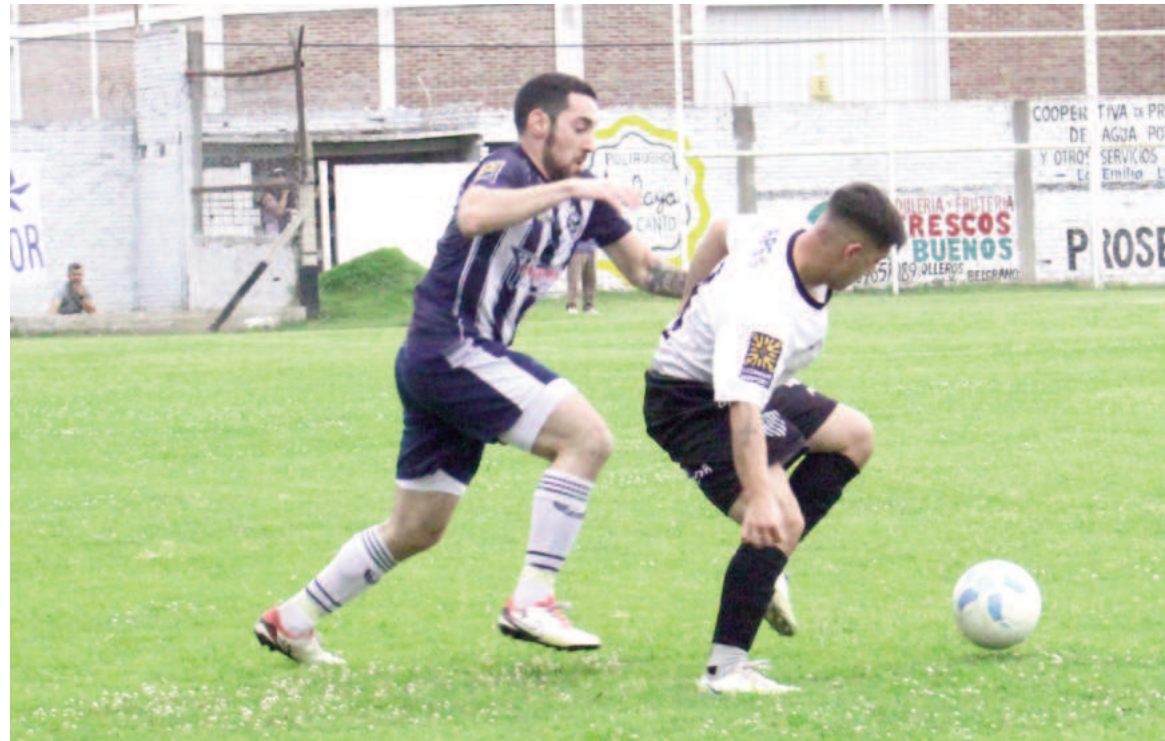
El Pañero irá a la revancha con la mínima ventaja.