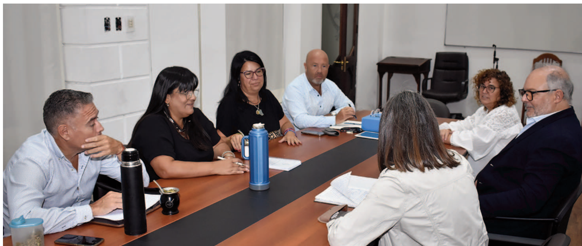
El proyecto será materia de análisis hoy en la comisión de Presupuesto y Hacienda del Concejo Deliberante.

De cara a la última sesión ordinaria del año, los concejales de Juntos por el Cambio buscarán asegurarse que el jueves llegue al recinto el proyecto de ordenanza que el Departamento Ejecutivo Municipal propone para reducir la carga tributaria sobre pequeñas y medianas empresas, comercios y emprendimientos. Será en el marco de la comisión de Presupuesto y Hacienda que se reúne a las 8:30.