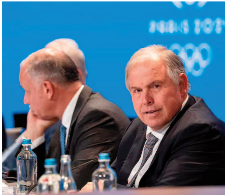
El canciller Gerardo Werthein