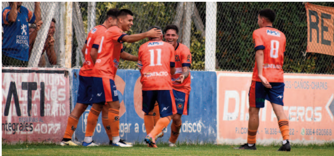
El Náutico goleó y sueña con los octavos de final.