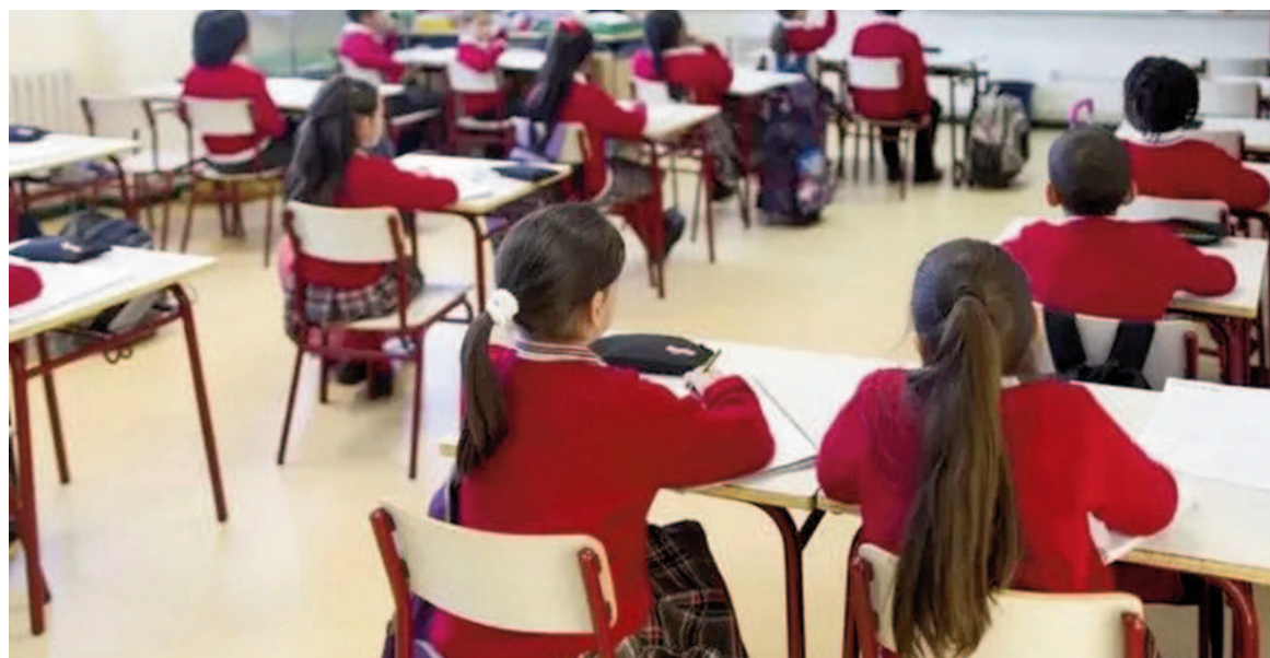
Las instituciones escolares con subvención estatal de gestión privada tendrán una actualización en su cuota de diciembre. ILUSTRACIÓN