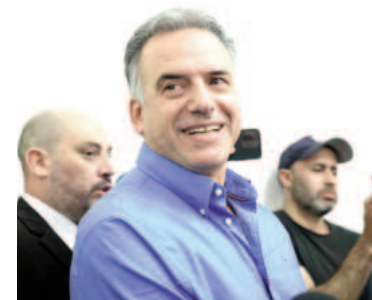
El candidato opositor se quedó con la victoria en Uruguay.

El candidato opositor derrotó al oficialista Álvaro Delgado, del Partido Nacional. El Frente Amplio volverá al poder luego de cinco años.