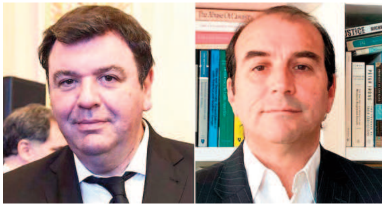
Ariel Lijo y Manuel García Mansilla, los candidatos del Ejecutivo a integrar la Corte.

La semana pasada, la senadora kirchnerista por Catamarca, Lucía Corpacci, aportó la novena firma necesaria para el dictamen del pliego de Lijo en el Senado, y permitió que el pliego sea sometido a votación. Sin embargo, aún no están garantizados los dos tercios de los votos requeridos para su designación. En diciembre la Corte quedará con tres integrantes ya que se jubilará Juan Carlos Maqueda, que el 29 de ese mes cumplirá 75 años, la edad límite para integrar el Máximo Tribunal. La Constitución establece que cualquier juez, luego de cumplir 75, puede permanecer en el cargo por otros cinco años, si el presidente vuelve a proponerlo para continuar y el Senado aprueba su pliego, en un proceso igual al nombramiento de un nuevo juez. En el caso de Maqueda, Milei no se lo propuso, por lo tanto pasará a retiro.