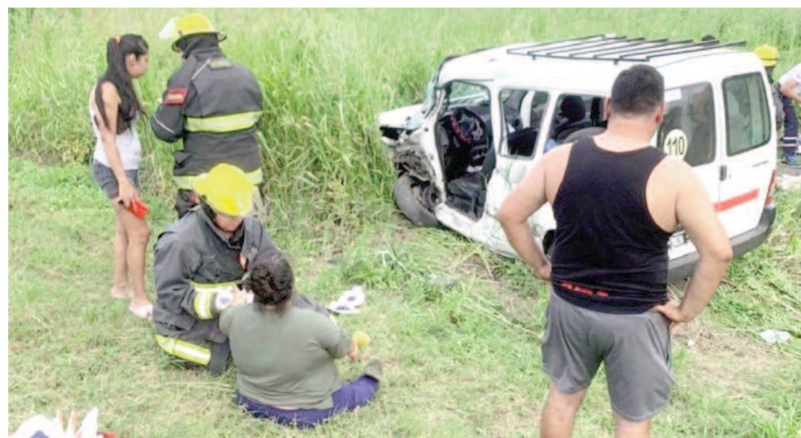
La Peugeot Partner involucrada en el accidente.