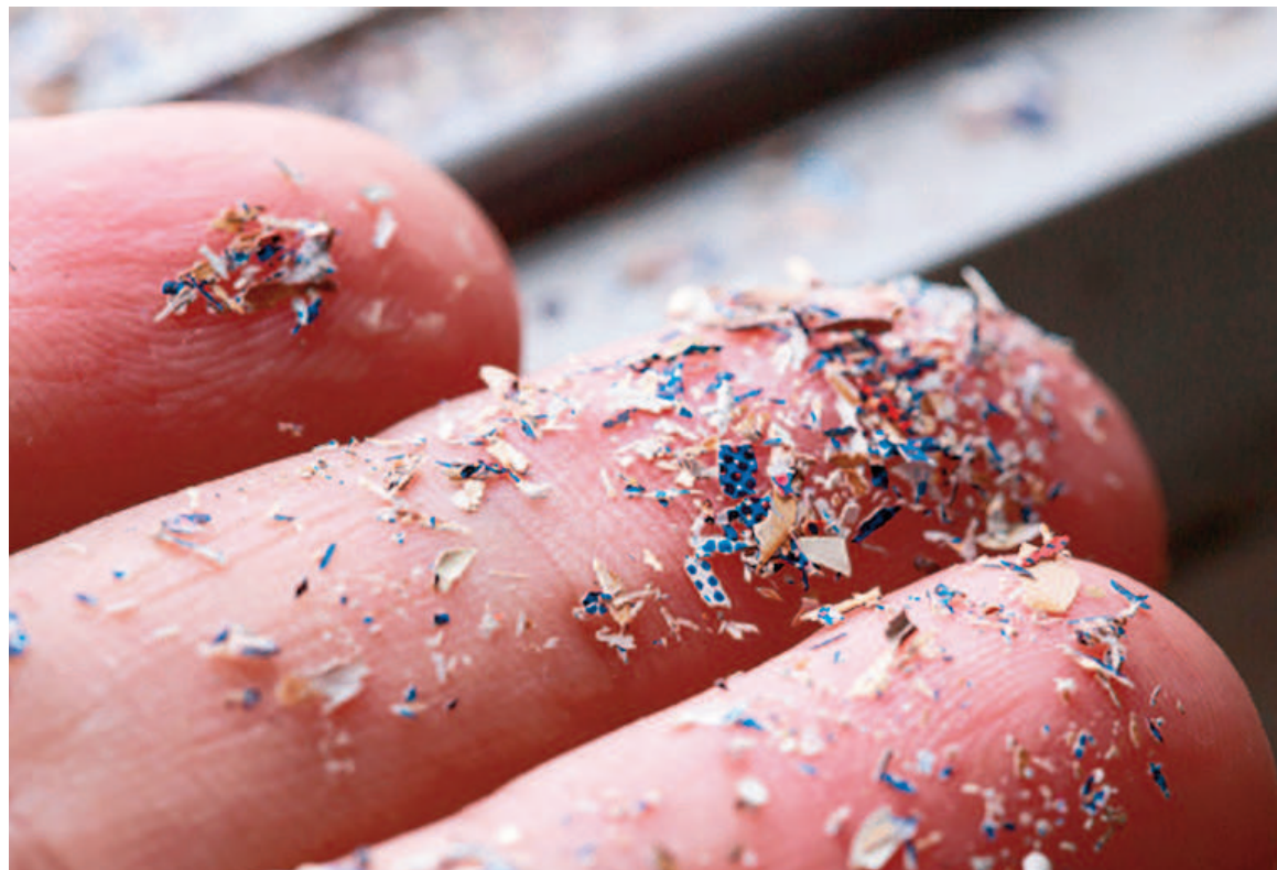
Los nanoplásticos, que pueden estar en alimentos y bebidas, han despertado la alarma en la comunidad científica.

en la salud humana se están investigando aún. Existe una gran preocupación por el ritmo actual de producción de plástico, que se estima en 460 millones de toneladas al año. En marzo pasado, se había publicado otro estudio en la revista New England Journal of Medicine, que relacionó los microplásticos y nanoplásticos hallados en las placas de los vasos sanguíneos humanos, que se asocia con un posible aumento del riesgo de infarto de miocardio, ataque cerebrovascular o muerte.