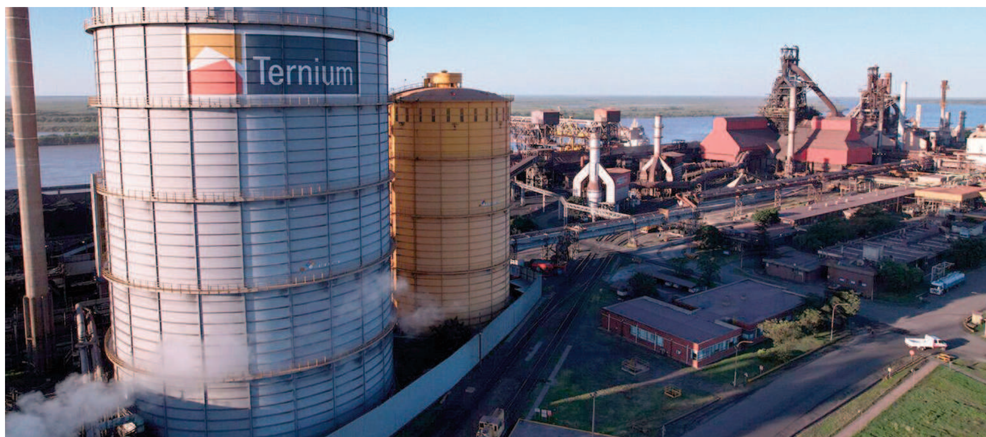
“Tenemos tremendos problemas en el cumplimiento de las obligaciones para con el personal contratado”, aseguró una alta fuente de la UOM local.

El panorama en la principal acería de Argentina es complejo, y se funda en un escenario multicausal. A la caída del mercado interno se suma el ingreso al país de productos a bajo costo, los reclamos por mejoras salariales y roces con el Gobierno. Desde la UOM San Nicolás cargan muy fuerte contra Ternium por las condiciones laborales y salariales de los trabajadores de contratistas. Denuncian falta de inversiones y pedidos a las empresas tercerizadas de reducir un 15 por ciento los costos.