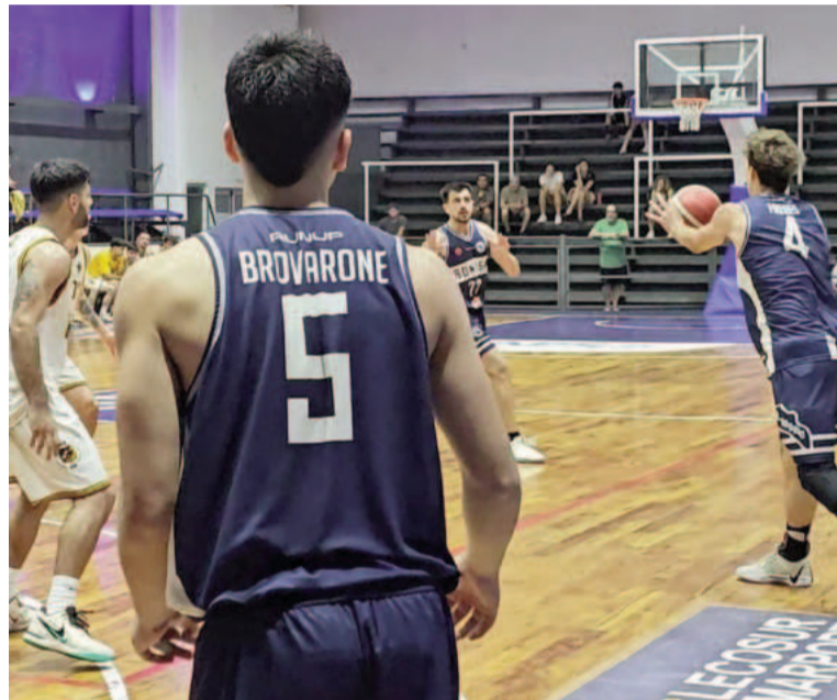
Somisa tiene al alcance de sus manos la clasificación a la Liga Federal. Y luego intentará llegar al Final Four.

En el reñido grupo C, todo puede pasar. San Martín de Junín es pun-