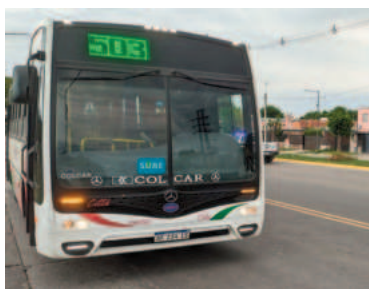
El colectivo involucrado en el accidente