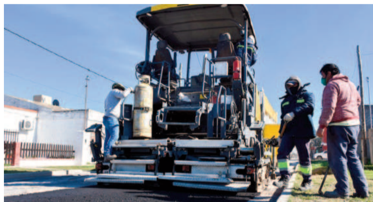
“Los recursos que tenemos de provincia son los que nos deben girar por Ley como la Coparticipación, pero no hay ninguna obra provincial”, afirmaron desde el Ejecutivo local.

En el Ejecutivo comandado por Santiago Passaglia indicaron, según publica el portal La Tecla, que “el sistema está invertido. Se ayuda con recursos y obras como premio a los que hacen las cosas mal. En cambio, en San Nicolás, como tenemos las cuentas ordenadas y seguimos siendo el municipio récord