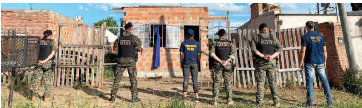
Una de las viviendas allanadas el día de ayer

La investigación comenzó tras una denuncia anónima que alertaba sobre un presunto punto de venta de drogas en un domicilio de la mencionada avenida, donde un hombre y su pareja habrían estado comer-