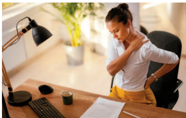
Advierten que estar más de 10 horas diarias sentado incrementa el riesgo de enfermedades cardiovasculares.

Diversos estudios subrayan los efectos devastadores de permanecer sentado por largos períodos en la salud física. Sentarse afecta negativamente el sistema cardiovascular, ya que reduce la circulación sanguínea y propicia el desarrollo de enfermedades cardíacas. La American Heart Association ha advertido que sentarse más de 30 minutos sin interrupciones puede comenzar a comprometer el flujo sanguíneo, aumentando los riesgos de sufrir enfermedades cardíacas y derrames cerebrales. En el caso de las personas que pasan más de ocho horas al día en sus escritorios, las probabilidades de padecer enfermedades cardiovasculares aumentan considerablemente, independientemente de si cumplen con las pautas recomendadas de actividad física. El impacto también alcanza la regulación del azúcar en la sangre y el control del peso corporal. Permanecer