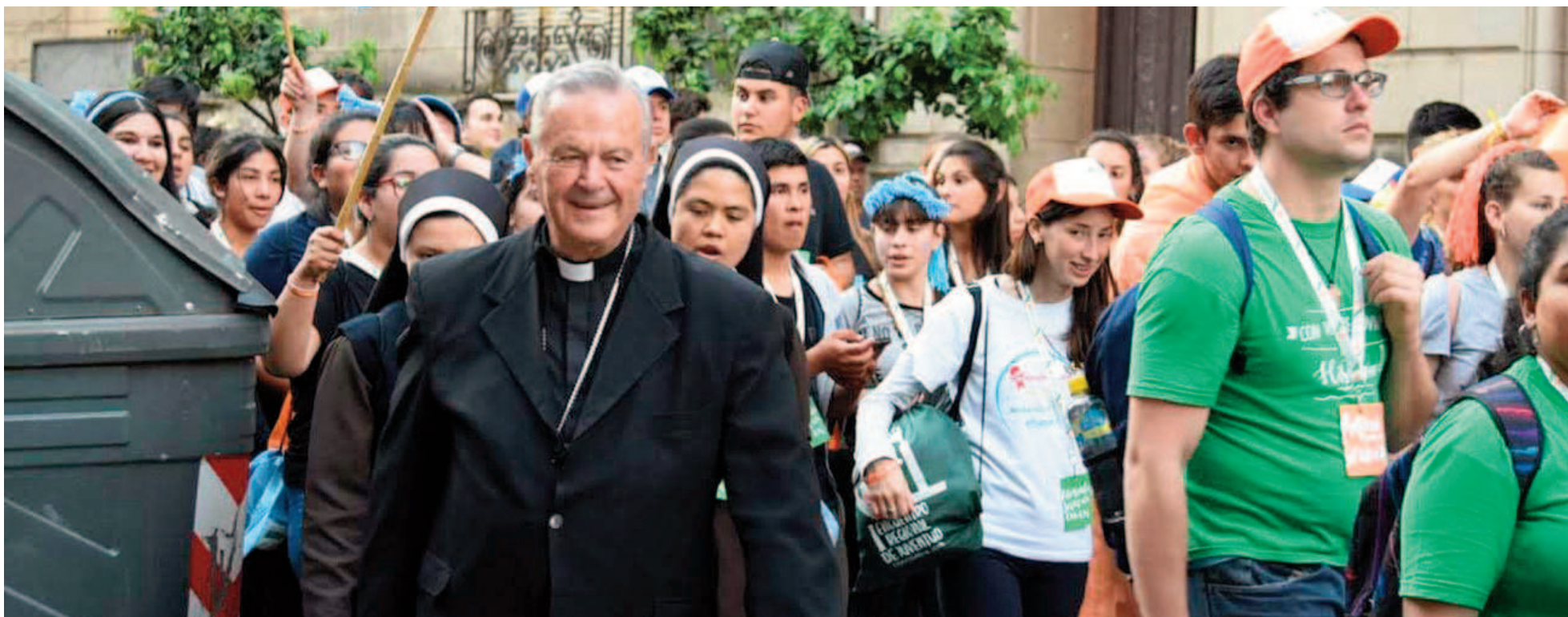
Los restos de Monseñor Héctor Cardelli serán los primeros -como obispo y sacerdote- en reposar dentro del Santuario.

La ceremonia y misa de exequias está prevista para las 16, y será presidida por el actual obispo local, Mons. Santiago, en el santuario mariano. "El último deseo de Monseñor Cardelli era descansar junto a la Virgen", destacó Ana Pose, vocera de prensa del Obispado de San Nicolás.