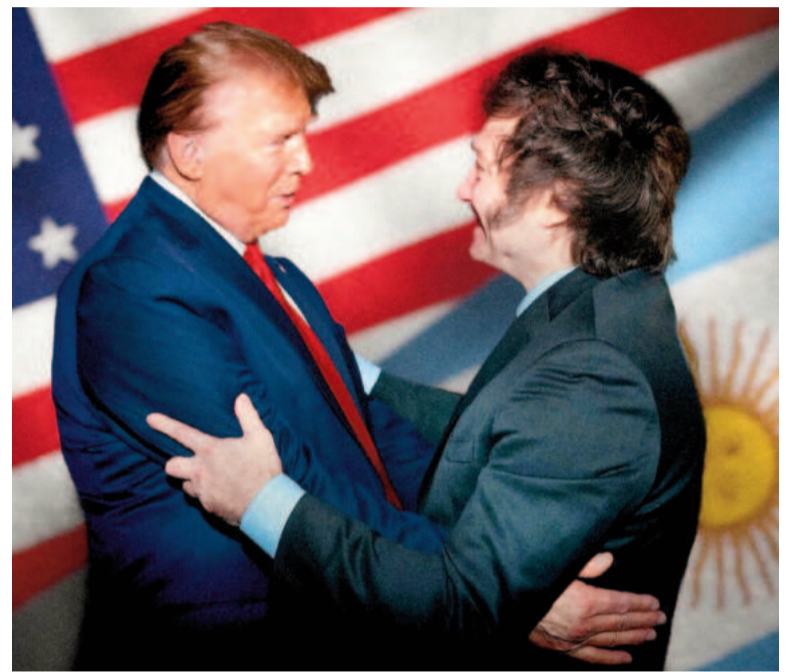
La imagen que compartió el presidente argentino

Ayer el portavoz presidencial, Manuel Adorni afirmó: "El Gobierno del presidente Milei felicita a Donald Trump por su triunfo en las elecciones presidenciales de los Estados Unidos. Trump es un ex-