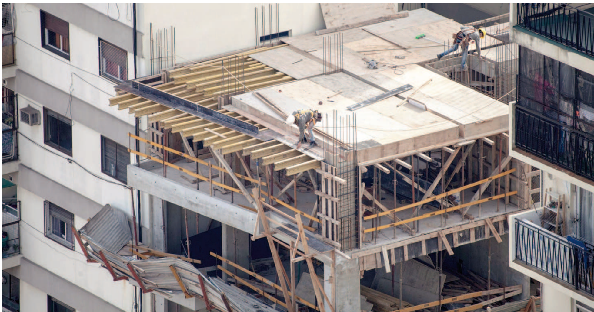
Tras oficializarse la disposición impulsada por el Gobierno, EL NORTE relevó opiniones de operadores del mercado inmobiliario local.