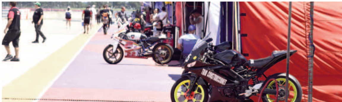
El Autódromo San Nicolás Ciudad vibró una vez más con el Superbike Bonaerense.