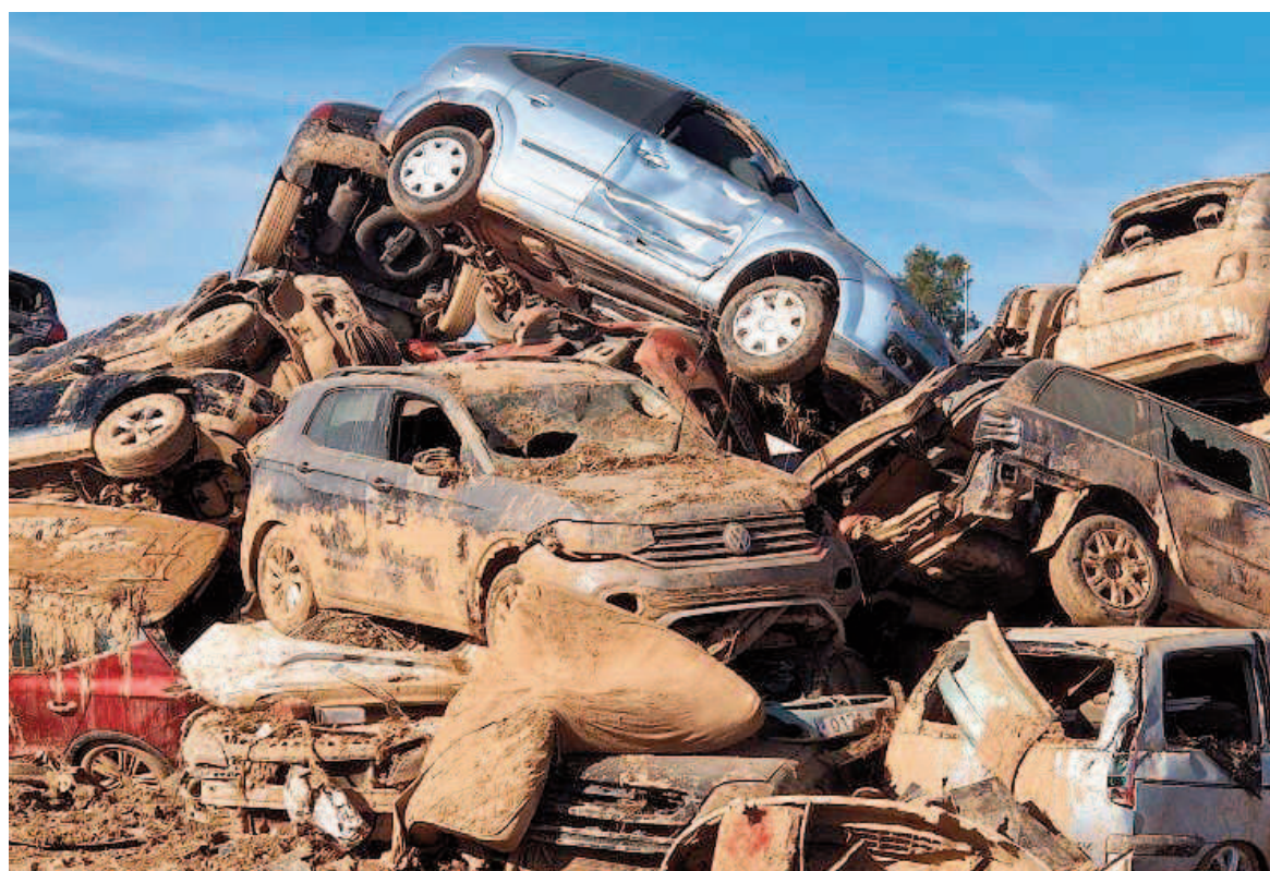
El impacto de la DANA es devastador: 16 ciudades han sido declaradas zonas de catástrofe.