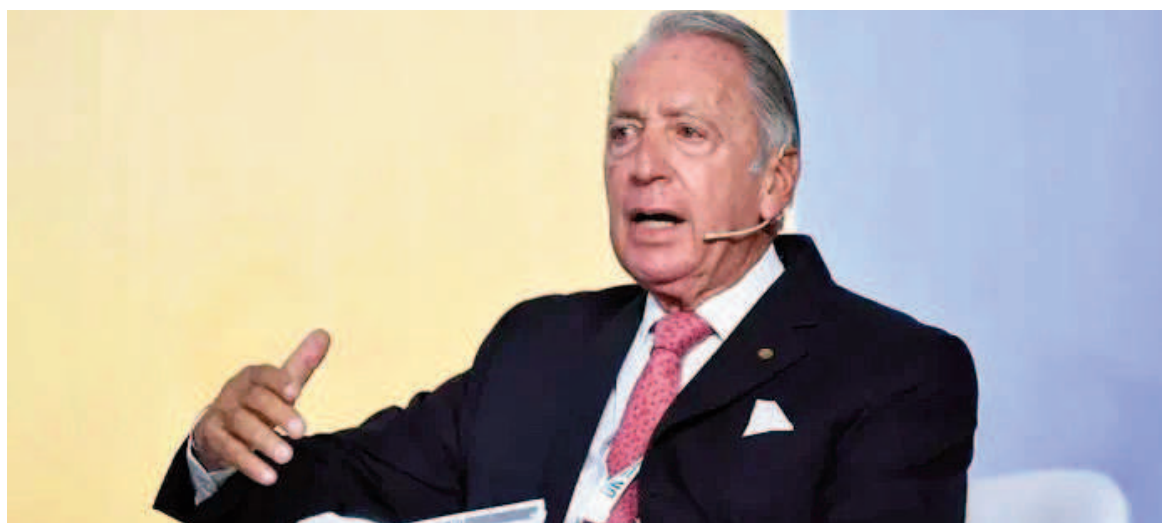
Daniel Funes de Rioja, presidente de la Unión Industrial Argentina (UIA).

"No es cuestión de que la gente compre más caro, es cuestión de que equilibremos la cancha. Hay una cantidad