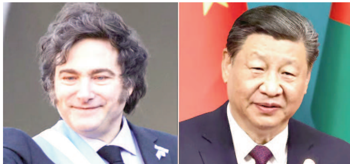
Milei y Xi Jinping se reunirán por primera vez en Río de Janeiro.

El presidente cambió su postura hacia China tras meses de tensiones y declaraciones polémicas. En septiembre pasado, Milei expresó una nueva visión sobre el país asiático