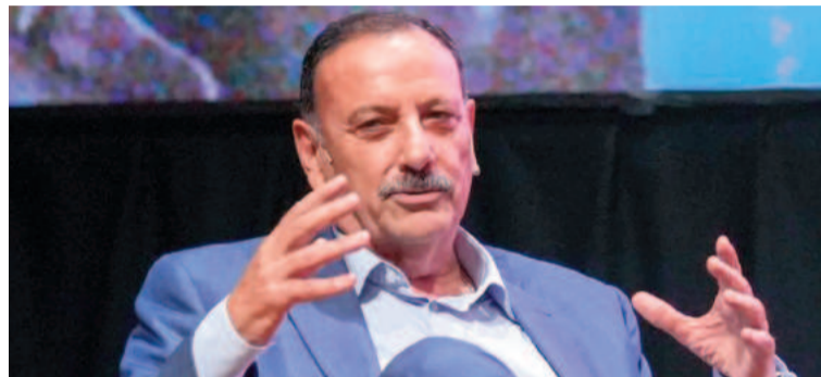
El gobernador de La Rioja, Ricardo Quintela.

En cuanto a la crisis social y económica, el gobernador cuestionó las políticas actuales y advirtió sobre posibles reacciones sociales. "La economía debe ser sinónimo de crecimiento, desarrollo, generación de bienes y distribución de la riqueza. No podemos seguir