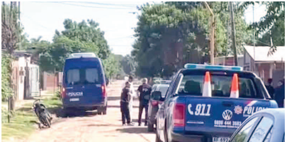
En el límite de los barrios Loyola Sur y Los Troncos ocurrió el asesinato.

L. O. quedó detenido en el mismo hospital donde se encontraba internado. Quedó a disposición del fiscal a cargo del caso, Carlos Lacuadra, de la Unidad Especial de Homicidio del Ministerio Público de la Acusación.