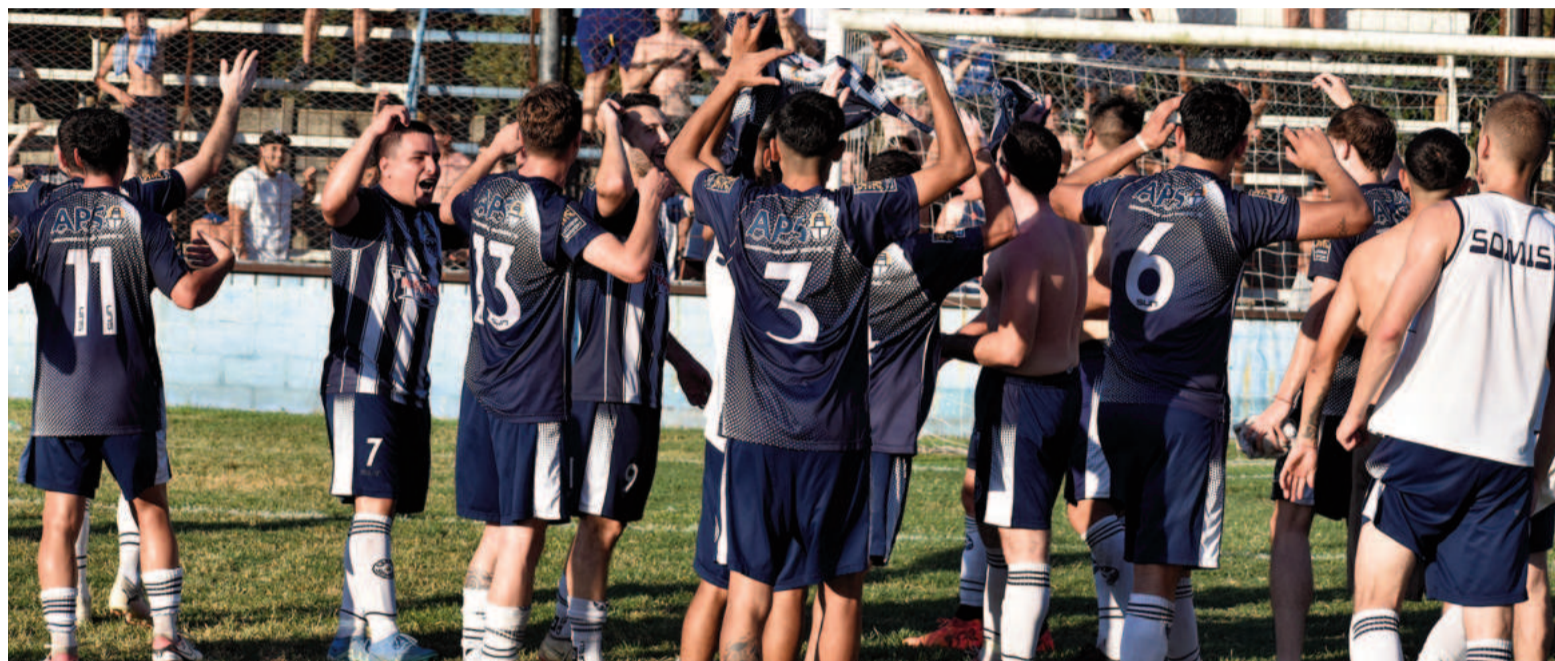
Somisa fue más certero y está entre los cuatro mejores. EL NORTE

Somisa avanzó a las semifinales del Torneo Clausura "Javier Yacuzzi" luego de eliminar a Paraná en definición por penales 3 a 0 tras igualar 1 a 1 en los 90 en cancha de Rivadavia y Necochea. Emanuel Ojeda hizo tres cambios con respecto a la formación anunciada en la previa, y en la etapa inicial el visitante fue superior. Manejó mejor la pelota y fue más profundo, con un Joaquín Cámpora des-