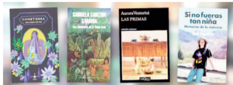
Algunos de los libros de la polémica.

En medio de la polémica generada en la provincia a raíz del programa “Identidades bonaerenses”, donde se distribuyó un catálogo de lecturas sugeridas en el marco de la Educación Sexual Integral, la Asociación de Institutos de Enseñanza Privada de la provincia de Buenos Aires (AIEPBA) salió a aclarar que “los colegios” no tienen la obligación de utilizarlos.