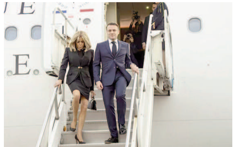
El presidente francés, Emmanuel Macron, llegó a la Argentina antes de viajar al G20 en Brasil.

Esta lista corresponde a anuncios de inversión. Pero la que sí se concretó fue la de la empresa francesa Eramet, quienes en julio de este año pusieron en marcha una planta de extracción de litio junto a socios chinos y en octubre adquirió la parte china por casi 700 millones de dó-