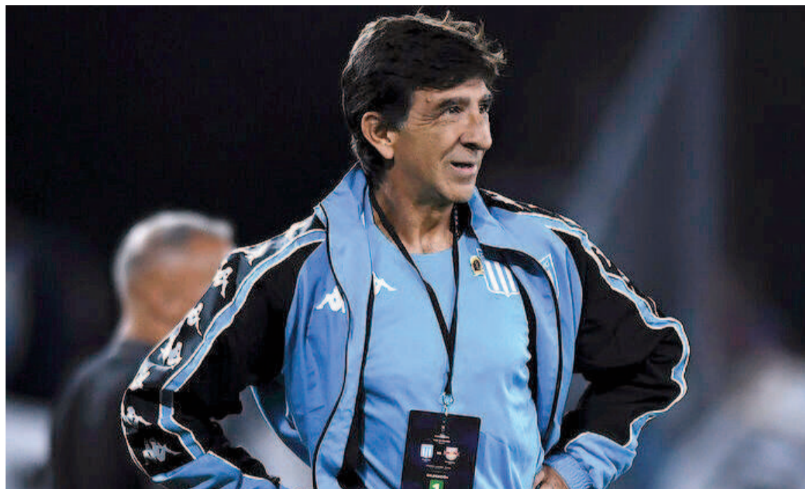
La Academia irá por los tres puntos al Nuevo Gasómetro. WEB

La Academia visitará al Ciclón en un encuentro correspondiente a la vigesimotercera jornada desde las 17.30. El equipo de Costas necesita ganar para seguir con chances de ser campeón.