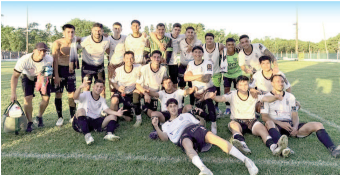
El Pañero rescató el empate que necesitaba para meterse entre los cuatro mejores. LA EMILIA FÚTBOL

Tras igualar 1 a 1 en el Camping ante Belgrano por el partido de vuelta del «Javier Yacuzzi», el Pañero se metió en las semifinales. Nehemías Scoppa marcó el tanto del equipo del Bicho mientras que Brizuela en contra anotó el empate del Rojo.