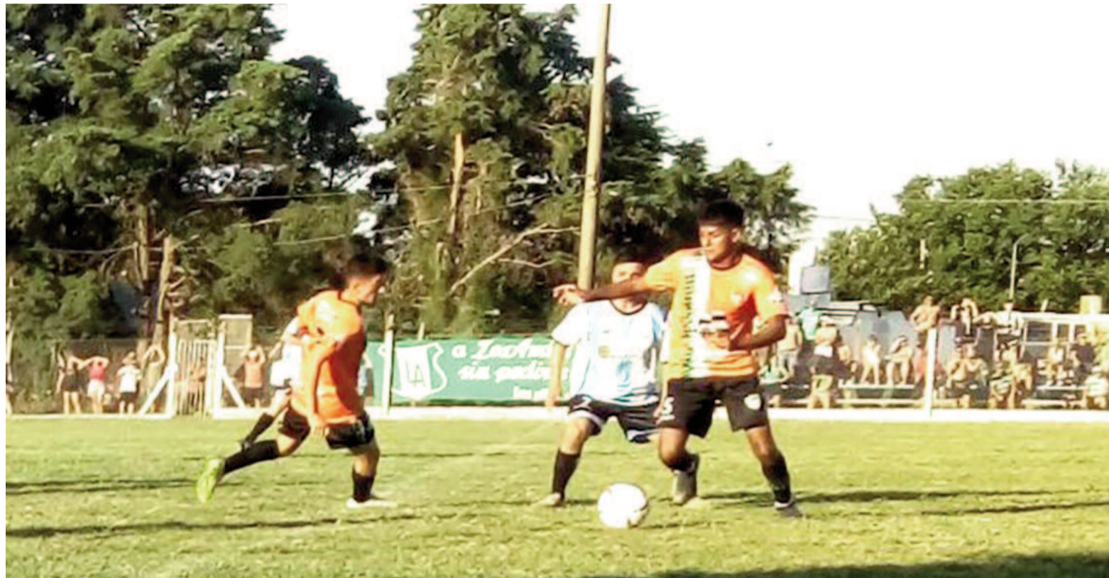
El Verdolaga goleó y avanzó a semis.