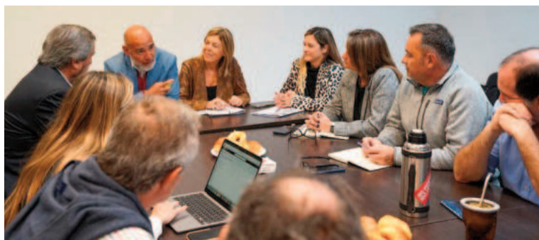
Reunión de la Mesa de Enlace de la Legislatura bonaerense.

Además, se refirieron a la iniciativa enviada por el Ejecutivo y cuestionaron la forma en que se trabajó: “Ese es el proyecto que mandan ellos, donde ellos mismos se autorizan a aumentar”, y esa rueda donde las decisiones pasan por un solo espacio fue una de las principales críticas de la oposición que se mostró muy cercana a las ideas planteadas por Luciano Bugallo de la