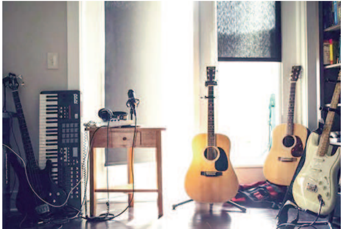
Cada 22 de noviembre se celebra el Día Internacional de la Música.

Por este motivo, Valeriano y Tiburcio resultaron arrestados y luego,