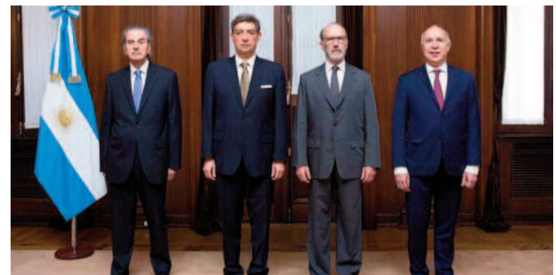
Los cuatro jueces de la Corte Suprema de la Nación.

A doce años del hecho, el fallo avala una postura que permitiría la libertad del condenado con independencia de la afectación de las víctimas. La sentencia se basa en "el