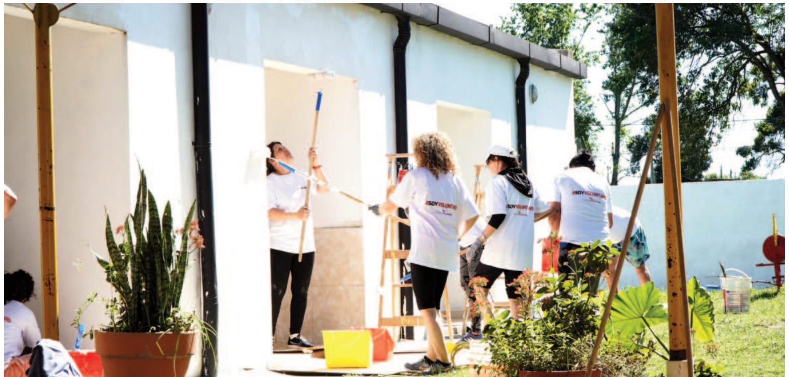
El programa llevó adelante acciones de acondicionamiento y pintura del patio de juegos del Jardín de Infantes N° 907 de Ramallo.

«El DHB es un reflejo de la misión de Fundación Loma Negra: generar alianzas con actores locales para construir un futuro más sostenible. Esta jornada no solo refuerza el vínculo entre colabo-