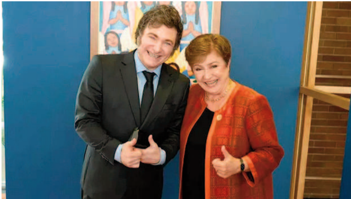
El presidente Milei, optimista, junto a Kristalina Georgieva.

Por otro lado, el vocero presidencial, Manuel Adorni, admitió en una conferencia de prensa las posibilidades de que se produzca otro acuerdo con el organismo: "Seguro que habrá un nuevo acuerdo y entende-