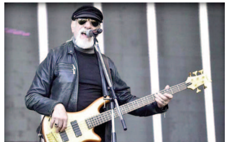
Willy Quiroga, adiós a una leyenda del rock nacional.

"Hola amigos... Bueno, tengo que, desgraciadamente, darles una noticia que jamás quise dar. A mis 84 años, con todas las ganas de continuar, me ha aparecido una enfermedad, que no me permite cantar, ni tocar, ni continuar con la banda. Pero quiero agradecerles a todos mis amigos y a todos los que me han hecho el aguante durante tantos años. Se los agradezco, de todo corazón. Ya no puedo continuar", había dicho en redes sociales unos meses atrás.