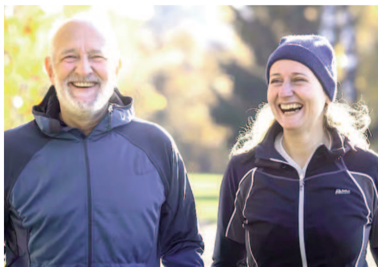
Las personas con mejor aptitud cardiorrespiratoria presentan menos riesgos de desarrollar demencia. ILUSTRACIÓN

El efecto protector del ejercicio es aún más significativo en personas con predisposición genética al Alz-