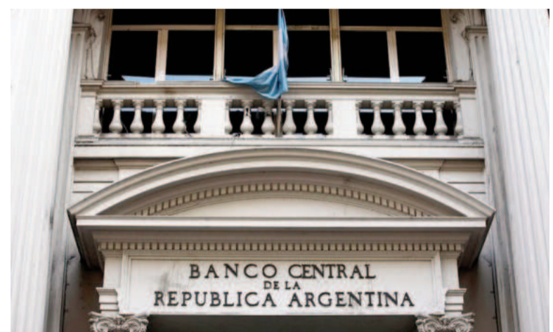
Nueva medida del BCRA para flexibilizar el cepo.

Los pagos de importaciones de bienes tienen un plazo unificado de 30 días, excepto la energía, que es inmediato.