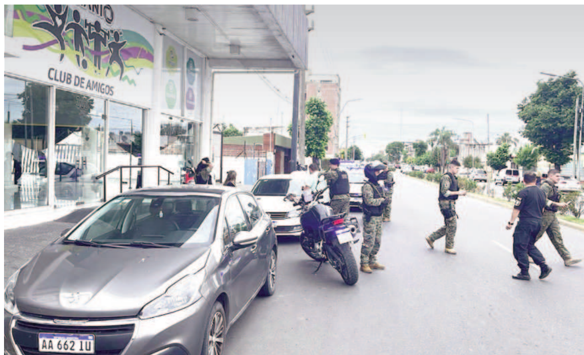
La aprehensión se produjo poco antes del mediodía de este jueves en jurisdicción de la Comisaría Primera.

El hombre que manejaba el auto buscado, de 35 años, y la mujer que lo acompañaba, de 36, fueron interceptados en avenida Moreno entre José Ingenieros y Bustamante. La aprehensión se produjo poco antes del mediodía de este