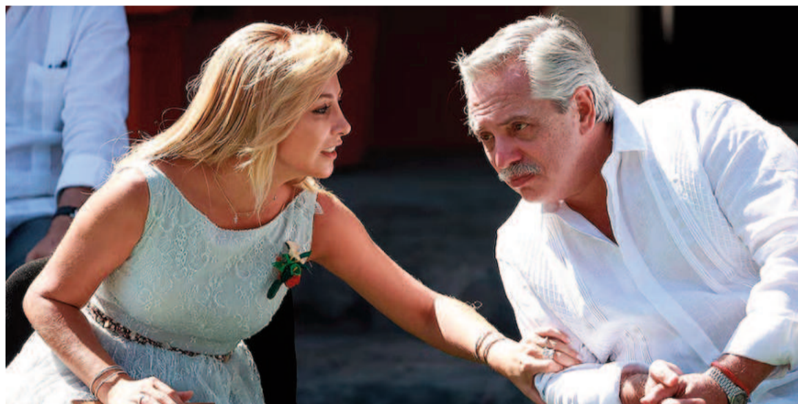
Fabiola Yañez y Alberto Fernández.

El juez convocó a Fernández mediante un escrito en la que le adelantó la imputación: "En un contexto de violencia de género signado por la particular relación asimétrica de poder entre Alberto Ángel Fernández y Fabiola Andrea Yañez, por lo menos desde el año 2016 hasta el 6 de agosto del 2024 (fecha en la cual la víctima instó la acción penal en el presente expediente y se impuso la consecuente prohibición de contacto al nombrado), el imputado se habría aprovechado de la especial situación de vulnerabilidad preexistente al vínculo en la que se encontraba inmersa la nombrada, y ejercido con habitualidad y de modo continuo, violencia psicoló-