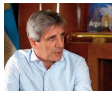
Caputo habló sobre el acuerdo con el FMI.

La situación actual comparada con la que llegamos, que el dólar haya bajado, la inflación en 1,2%, la actividad económica recuperada, creo que nadie