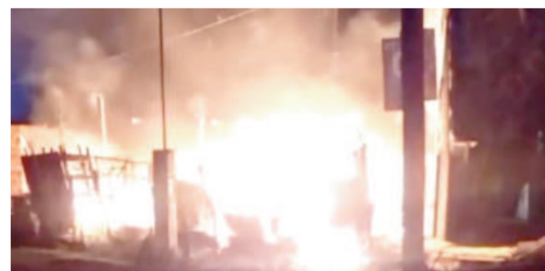
Ardió una vivienda y una niña resultó lesionada.

Las causas del incendio están bajo investigación, pero Perazzo señaló que este tipo de depósitos de cartón en la zona costera de Villa Constitución son frecuentes y representan un riesgo significativo para las viviendas cercanas. Las autoridades continúan trabajando para esclarecer lo ocurrido.