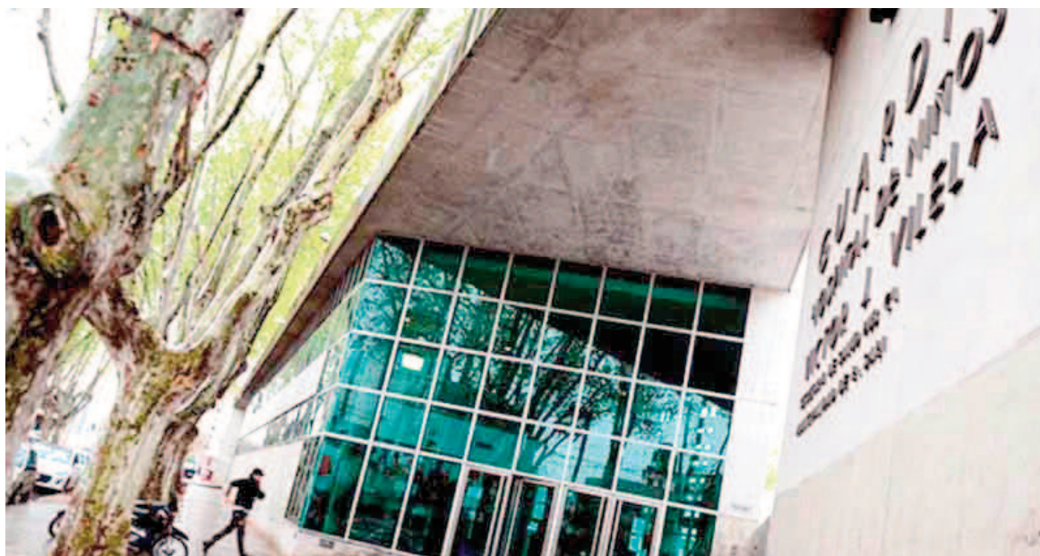
El menor permaneció internado, hasta su deceso, en el Vilela.

A pesar de su estado crítico, el niño llegó lúcido al hospital y pudo relatar parte de lo sucedido antes de ser internado. Sin embargo, el cuadro fue de tal gravedad que, tras casi dos días de lucha, se confirmó su deceso este miércoles.