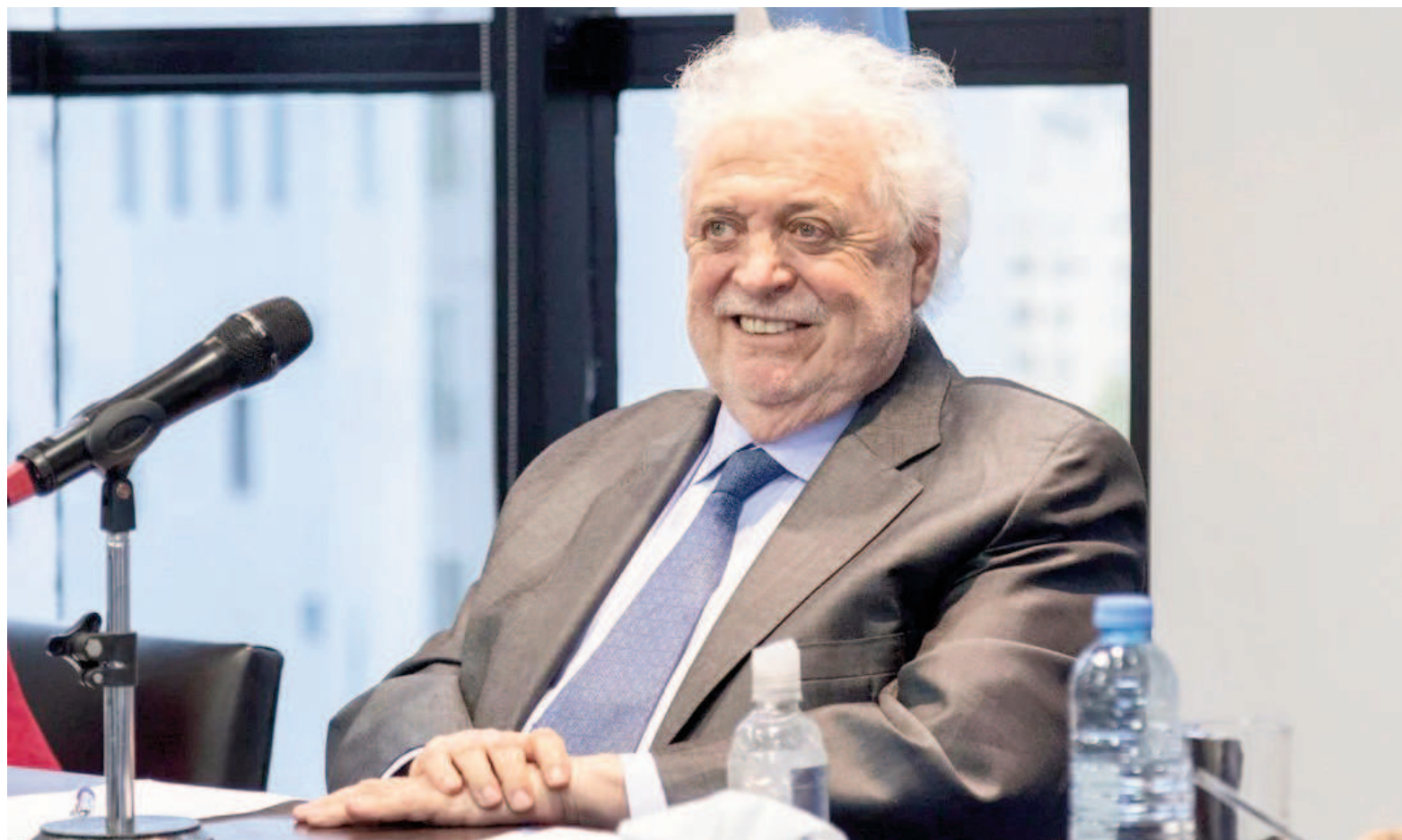
El médico cirujano y sanitarista Ginés González García había nacido en San Nicolás el 31 de agosto de 1945.

En la misma línea, escribieron: "Recordaremos sus risas, su mirada siempre distinta, sus ideales por una Argentina mejor, y su eterna pasión por Racing. Gracias Ginés. Por ser un hombre extraordinario, el sanitarista contemporáneo que