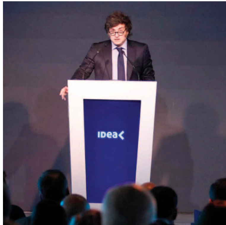
Javier Milei, en el cierre del Coloquio de IDEA.

Sobre el ajuste que realizó apenas asumió, Milei consideró que "era probable que el impacto más fuerte se sintiera en el primer trimestre y