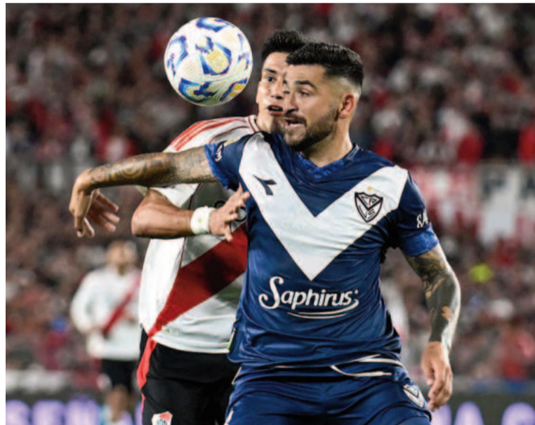
El equipo de Quinteros sumó un valioso punto.

Los cambios de Marcelo Gallardo le aportaron jerarquía al equipo con Facundo Colidio, Pablo Solari y -luego- Marcos Acuña. Del lado