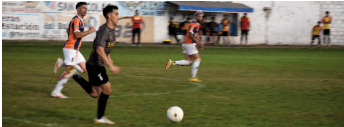
El Rojo buscará sumar ante el Náutico para sellar su boleto.

Por su parte, Regatas llega en el segundo puesto con 10 unidades tras