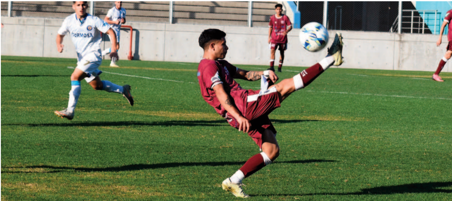
El Granate buscará un triunfo esta tarde para viajar más tranquilo a Bahía Blanca. EL NORTE

El Granate recibirá esta tarde en el Estadio San Nicolás al equipo de Bahía Blanca, en el partido de ida de la tercera fase de la Reválida del Torneo Federal A. En esta serie, el equipo de Villa Ramallo no tendrá ventaja deportiva, por lo que tendrá sí o sí que imponerse en alguno de los dos partidos. El encuentro comienza a las 17.00.