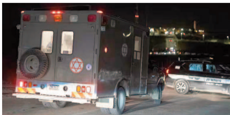
Una ambulancia militar israelí llega al lugar de un ataque con drones cerca de la ciudad de Binyamina, en el norte de Israel.

Hezbollah, una organización chi con base en Líbano, ha sido un actor central en el conflicto con Israel desde su creación en la década de 1980. Con un arsenal militar considerable y apoyo de Irán, Hezbollah ha utilizado tácticas de guerrilla y ataques directos en ocasiones, pero el uso de drones representa un cambio estratégico en su enfoque. Este ataque reciente se produce en un momento crítico, donde las tensiones en la región están en su punto más alto, impulsadas por conflictos políticos