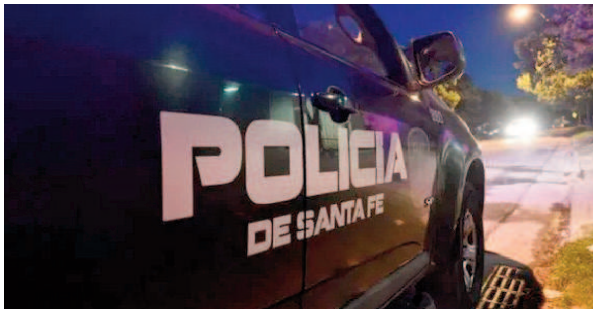
Un doble homicidio se produjo en Rosario.