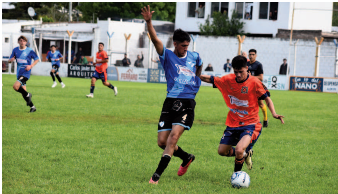
Regatas fue efectivo y atesoró la victoria. EL NORTE

Por su parte el Albiceste utilizó su habitual esquema 4-3-3, pero le costó llegar al arco rival. La primera