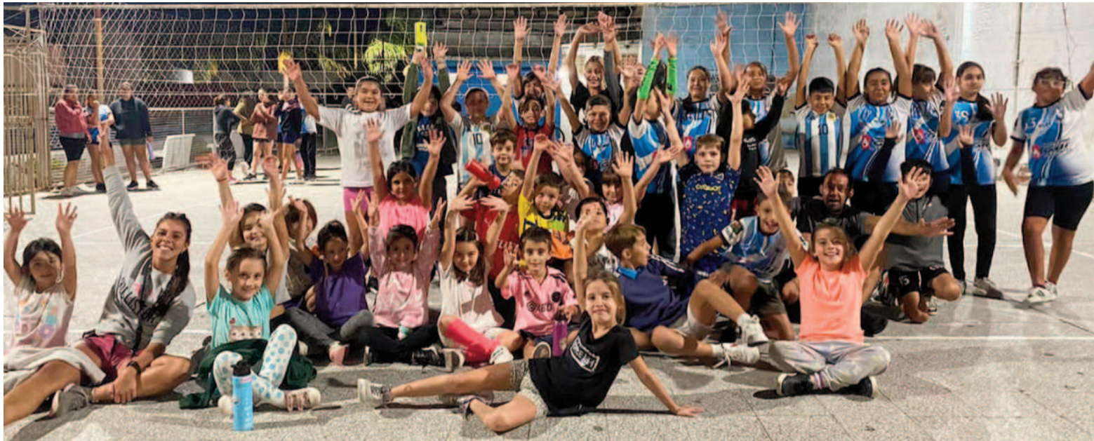
El vóley es furor en el Club Social y Democrático de Rojo.