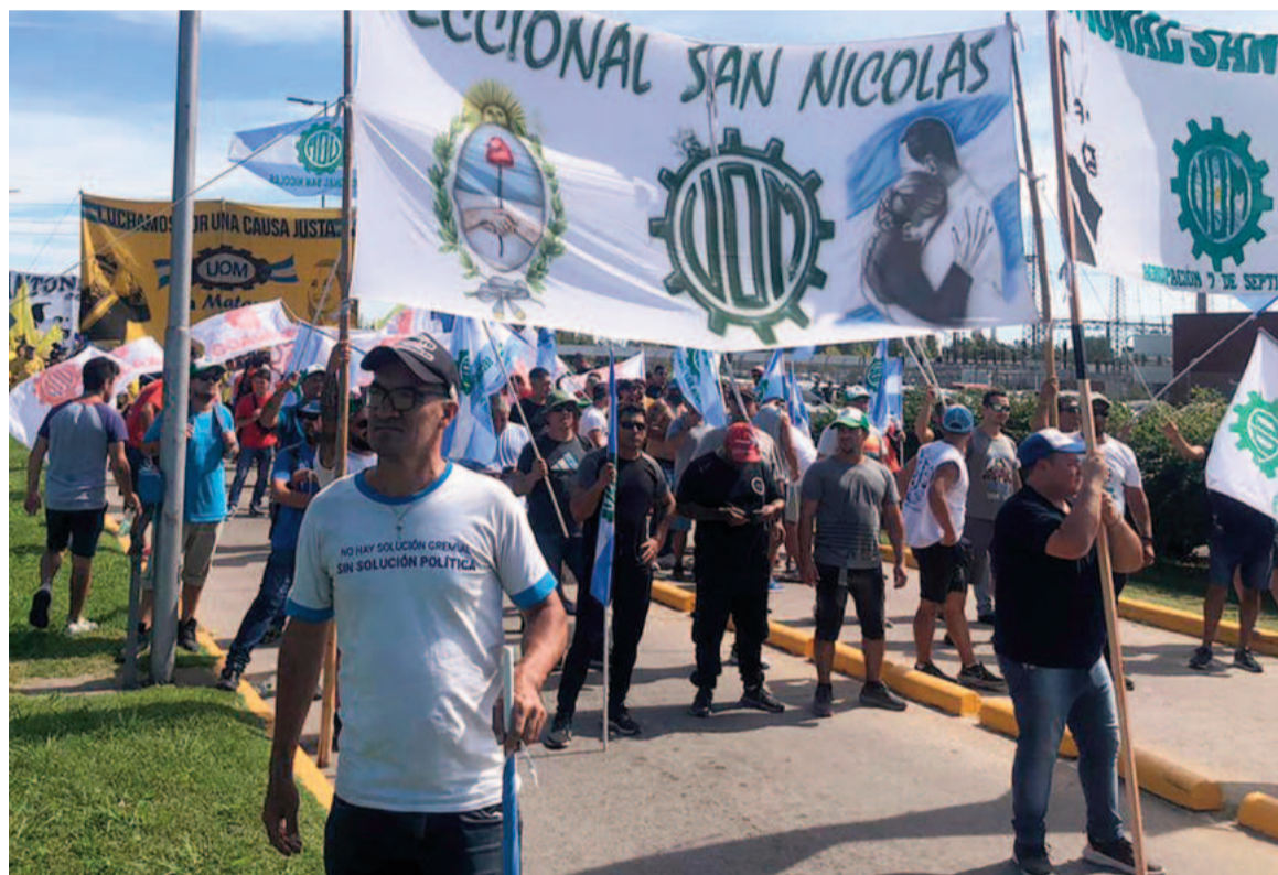
La UOM y la Cámara Argentina del Acero vuelven a reunirse mañana en audiencia paritaria convocada por la Secretaría de Trabajo.

«Queremos expresarles nuestro total desacuerdo y repudiar la actitud arbitraria que ha tomado nuevamente la Cámara Argentina del Acero y, por consiguiente, la empresa por ustedes representada. Tal cual lo sucedido en la anterior negociación salarial, hemos sido informados nuevamente de un pago en concepto de anticipo, de un porcentaje que ustedes pretenden imponer en la actual discusión paritaria, que se