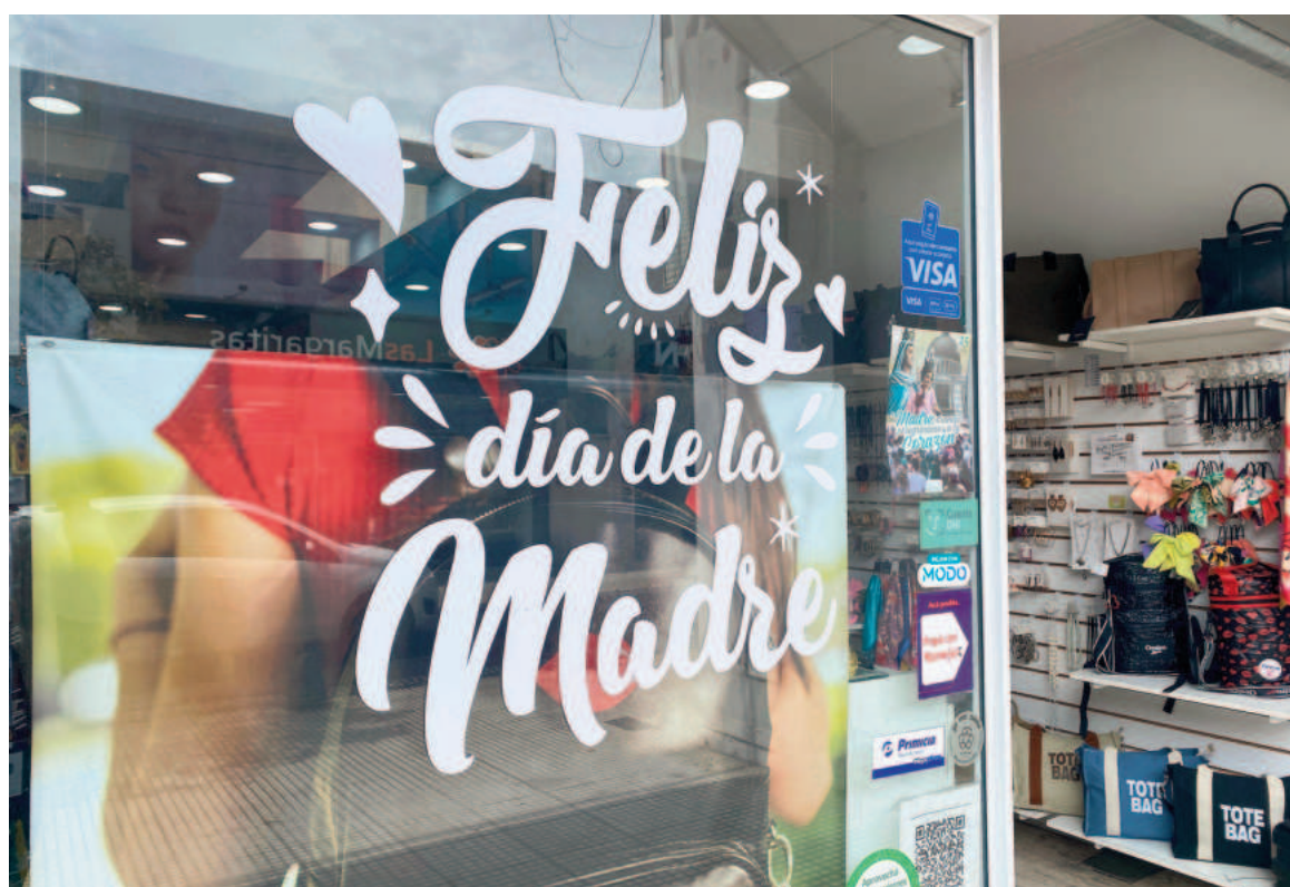
Para el Día de la Madre muchos comercios en San Nicolás extienden su horario de atención.

Los perfumes son un habitual presente para este tipo de ocasiones, en detrimento del maquillaje, según ase-