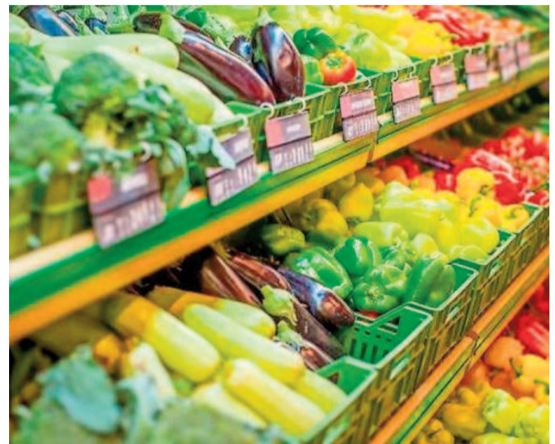
En septiembre, el consumidor pagó $3,4 por cada $1 que recibió el productor.

Al mismo tiempo, señalaron que "además debe considerarse el fuerte incremento de costos, tanto en insumos dolarizados y tasas municipales, como también en transporte, logística, arrendamientos y salarios, por mencionar algunos". Otro aspecto que también contribuye a la situación descrita es que "se está viviendo cierta incertidumbre, natural de la época del año, donde algunas regiones ingresan con su producción al mercado, mientras otras están en retirada".