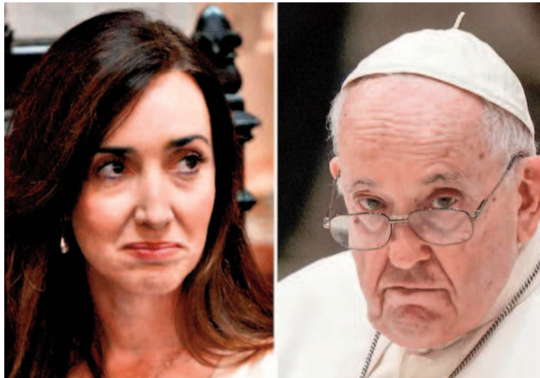
Victoria Villarruel y el papa Francisco se verán hoy las caras en el Vaticano.

Lo más llamativo del paso de Sotelo por el Palacio Apostólico fue su posteo en redes sociales,