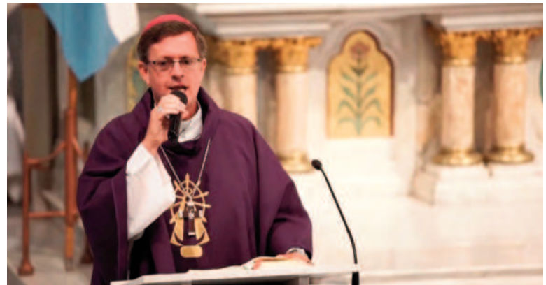
El arzobispo de Buenos Aires disertará en un encuentro de Cáritas, Techo y Fundar.