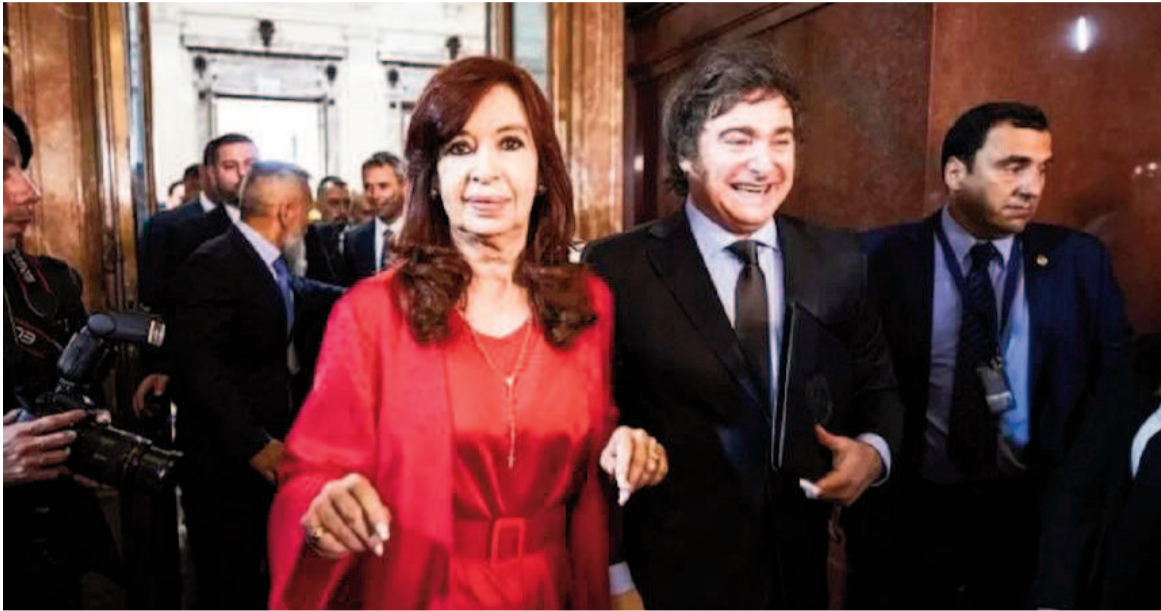
El peronismo y La Libertad Avanza se pelean el primer puesto en la provincia.

La confirmación de que Cristina Kirchner está en carrera para presidir el PJ fue interpretada en ámbitos políticos como el paso inicial de una jugada mayor: una candidatura en las Legislativas 2025 en la provincia de Buenos Aires. En ese contexto, una encuesta la midió para esa contienda clave.