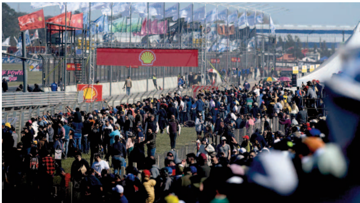
San Nicolás vuelve a recibir a La Máxima. Enorme expectativa. ACTC

Esta tarde, desde las 17, se llevará a cabo la presentación oficial de la