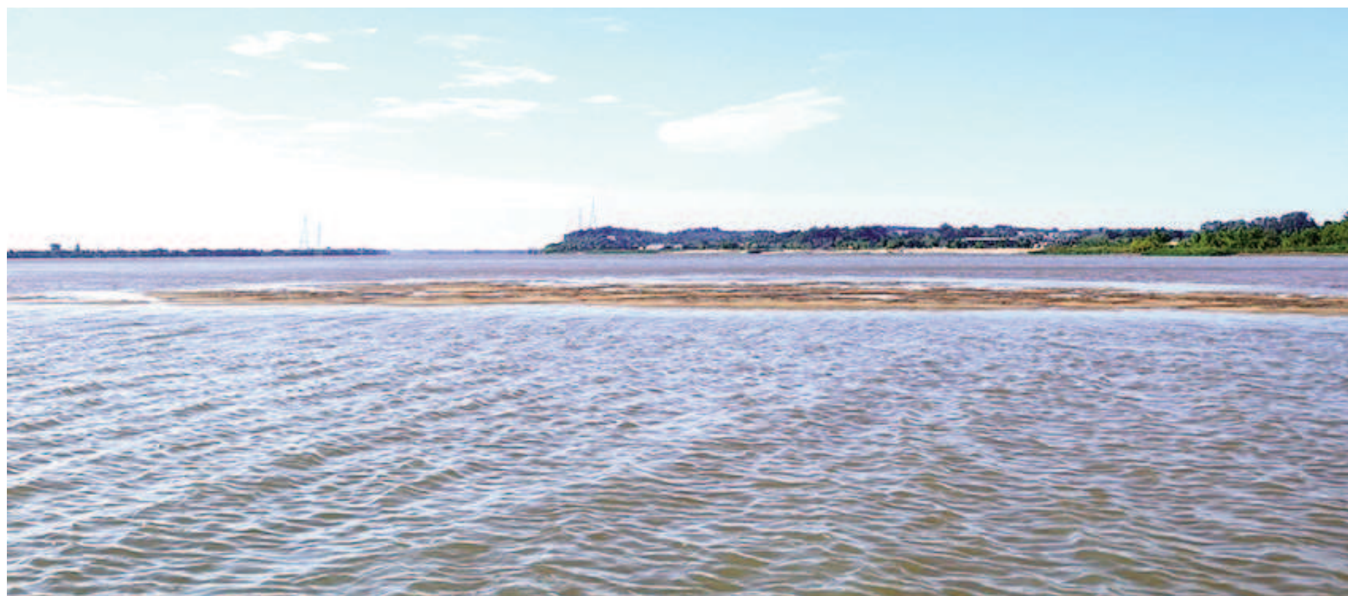
El nivel del río fue disminuyendo al promediar el invierno; tendencia que se consolidó entrada la primavera.