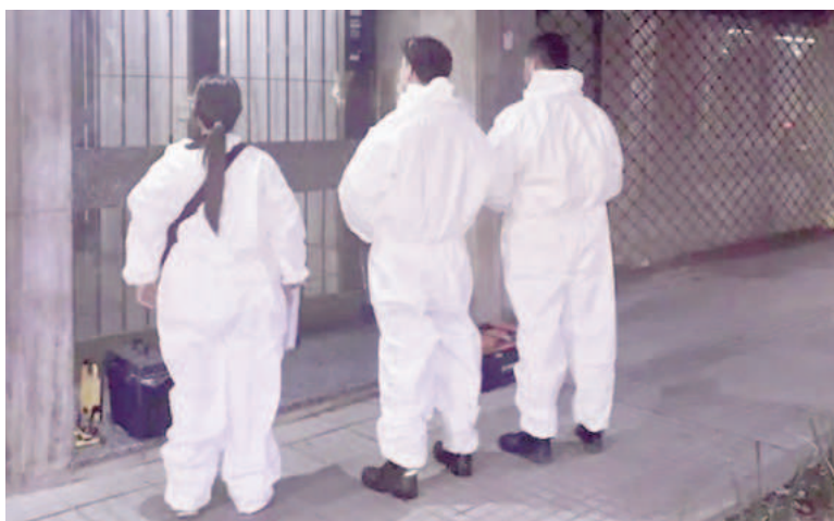
Personal de la PDI trabajó en la escena del crimen en el edificio de Santa Fe al 1200.