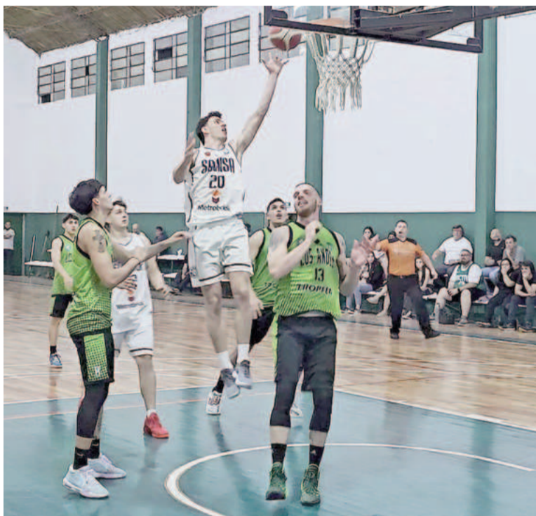
Somisa viene de ganarle a Los Andes en Villa Ramallo.

También en La Plata jugará hoy Sacachispas, que, en el marco del Grupo