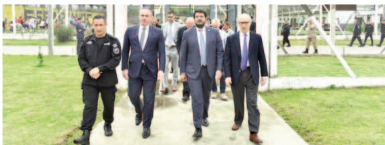
El ministro de Justicia de la Nación, Juan Martín Mena, y el vicepresidente de la Corte Suprema, Carlos Rosenkrantz.

La visita fue organizada por los Espartanos, una fundación que supo ganarse renombre por su capacidad para reducir los índices de reincidencia entre las personas privadas de libertad,