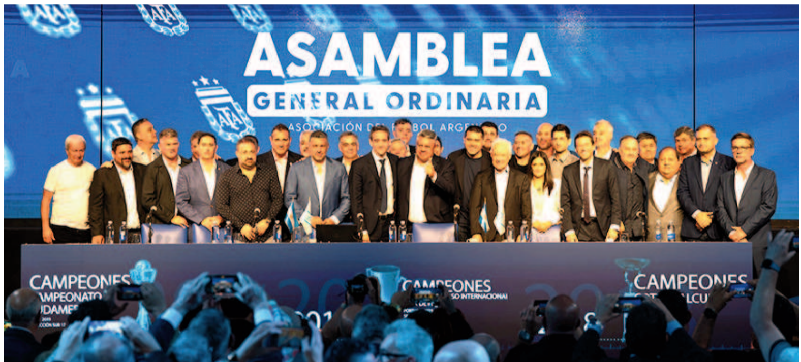
La cuestionada asamblea finalmente se llevó a cabo: hay Chiqui Tapia para rato.

En la asamblea que se desarrolló ayer, legitimada por la Justicia más allá de la decisión de la IGJ, se definieron modificaciones del estatuto. Claudio Tapia comenzó su tercer mandato y se resolvió que habrá 30 equipos en la Primera División en 2025.