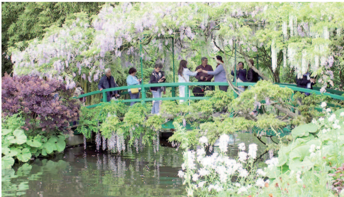
Los nenúfares y el puente japonés se convirtieron en motivos centrales en la obra de Monet, representando su constante búsqueda de la luz y el movimiento.

Monet, quien nació en París en 1840, pasó gran parte de su vida capturando el juego de luces y colores en el paisaje. Aunque fue rechazado por las academias tradicionales de arte en sus primeros años, su tenacidad lo llevó a convertirse en el líder del movimiento impresionista, un estilo que revolucionó la pintura en su época. A través de obras como "Impresión, sol naciente", que dio nombre al movimiento, y sus famosas series de nenúfares, Monet desafió las convenciones, enfocándose en la percepción