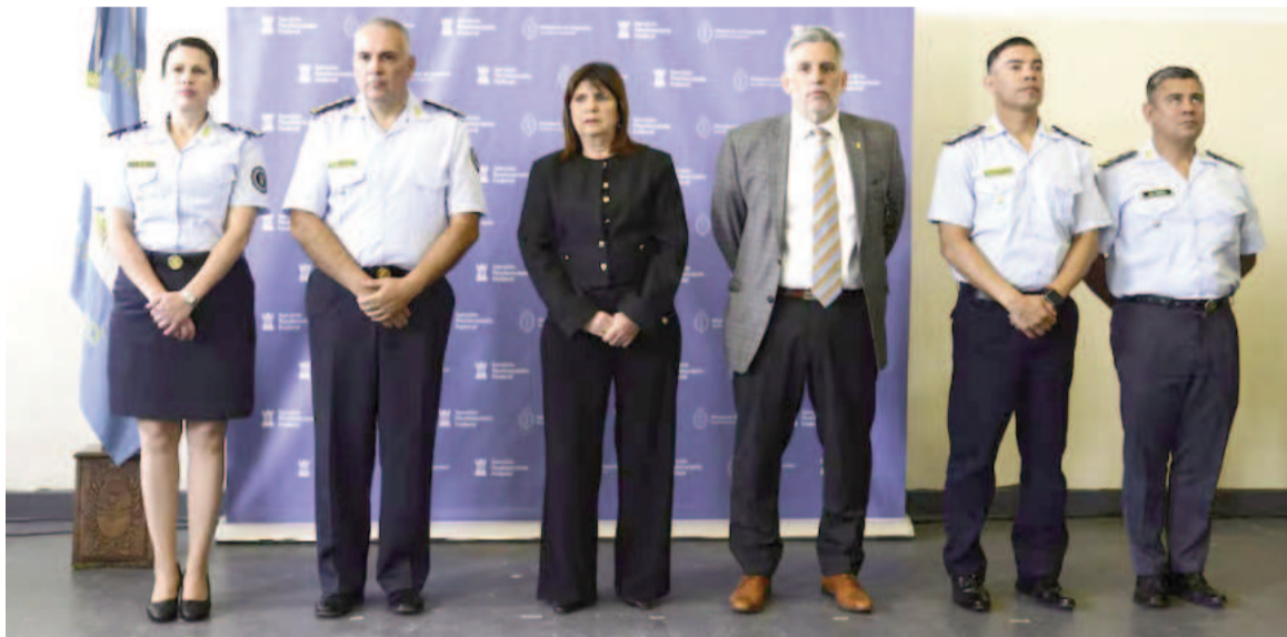
Patricia Bullrich junto a la plana mayor del Servicio Penitenciario Federal y sus colaboradores.

“Nosotros conocemos bien nuestra Constitución. Las cárceles tienen que ser sanas y limpias, no para castigos sino para la reinserción. Y el Código Penal de la Nación dice que las personas privadas de su libertad deben hacerse cargo de mantener las instalaciones penitenciarias y de pagar con su trabajo aquello por lo que hoy están detenidas. Con este programa no estamos haciendo ni más ni menos que cumplir con nuestro Código Penal”, afirmó la integrante del Gabinete de Javier Milei y sostuvo: “Si un juez nos dice que le tenemos que pagar por no trabajar, vamos a llegar hasta la Corte Suprema de Justicia de la Nación, porque eso es una injusticia para la sociedad. Nosotros queremos