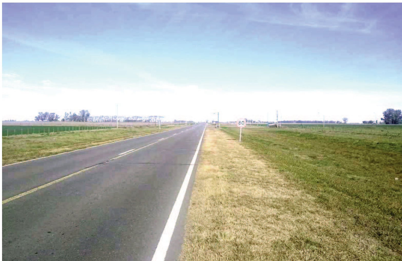
En el momento de su construcción, la Ruta Nacional 188 era una de las rutas más importantes de Argentina.

Uno de los argumentos clave para avanzar en esta concesión es el déficit operativo acumulado por la empresa estatal Corredores Viales S.A., que