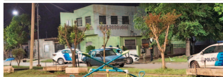
Distintas fuerzas policiales participaron del operativo.

En el marco de una causa investigada por la fiscalía de la Dra. Marcantonio, más de 80 policías, junto con la UTOI, llevaron a cabo allanamientos en el barrio 17 de Octubre (ex Cooperación). Durante el operativo, algunos vecinos arrojaron piedras a las fuerzas de seguridad.