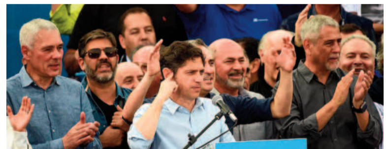
Axel Kicillof, con decenas de dirigentes peronistas que lo respaldaron.

que quiere colaborar "en la construcción de una alternativa superadora".