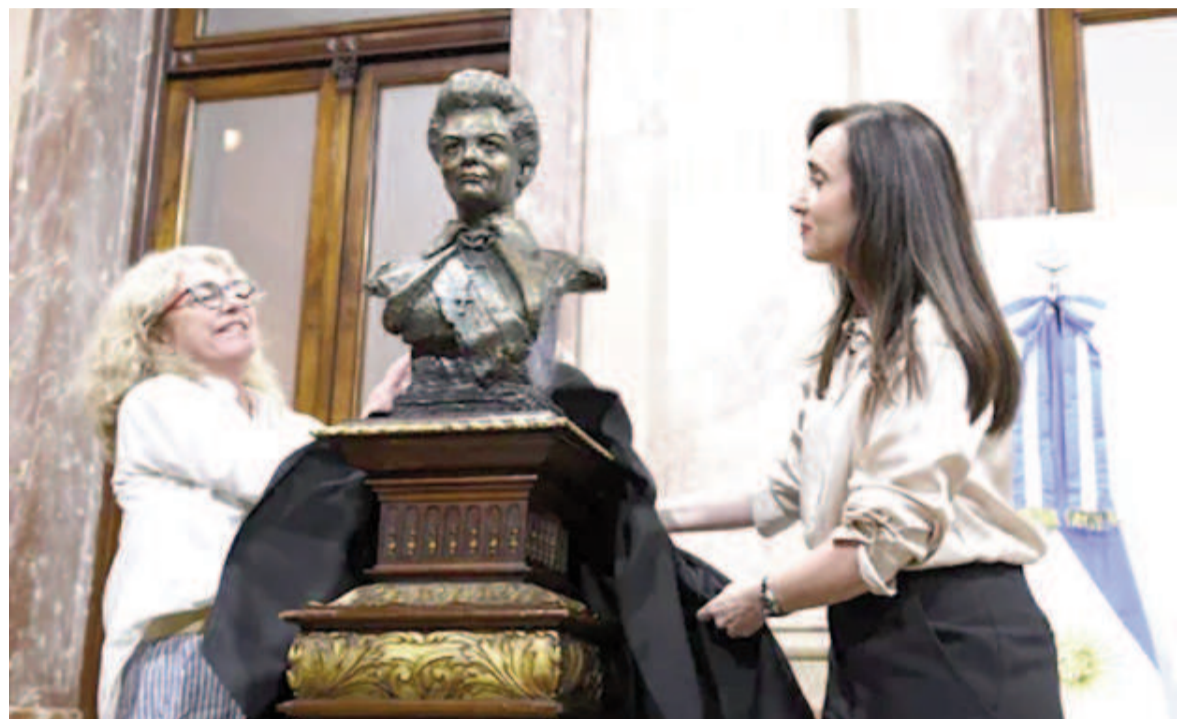
La vicepresidenta Victoria Villarruel homenajeó a Isabel Martínez de Perón.

«Por el contrario, revelando una dignidad tan elevada como su coraje, hizo del silencio un martirio», agregó la vicepresidenta ante la atenta mirada y aplausos de un