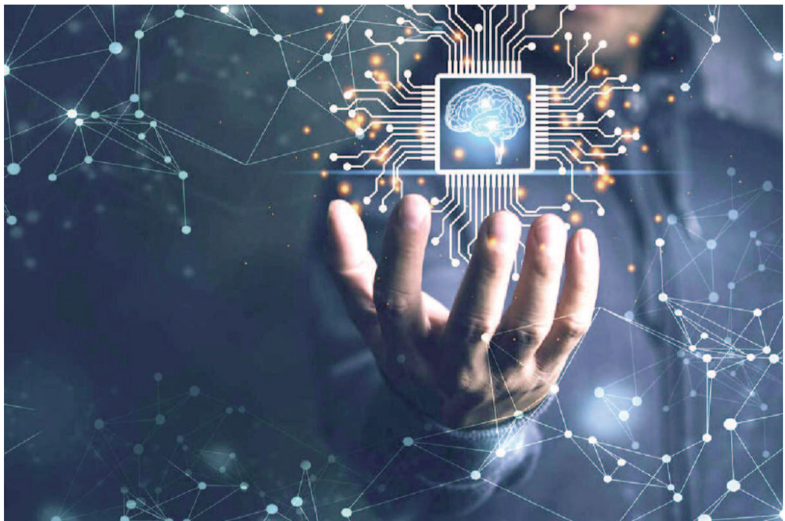
La segunda edición de SAIA CONF 2024, el evento más importante de inteligencia artificial en Argentina, será a fines de octubre en la Usina del Arte. ILUSTRACIÓN

En términos simples, IA se refiere a la capacidad de sistemas de computación para realizar tareas que, hasta hace poco, parecían exclusivas de los seres humanos, como escribir textos, entender imágenes y tomar decisiones. "Lo que hace la IA es empezar a realizar tareas que pensábamos que solo los humanos podían hacer", explicó el especialista. Esta