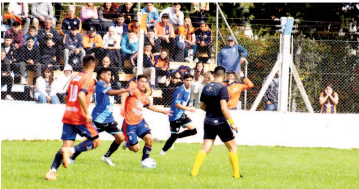
El equipo de la ribera tratará de conseguir un buen resultado como visitante.

Se enfrentarán hoy desde las 20.00 en el "Jacinto 'Gato' López" por la zona 8 de la Región Pampeana Norte. El Pañero presentará varios refuerzos, mientras que el Náutico viene de vencer a Paraná.