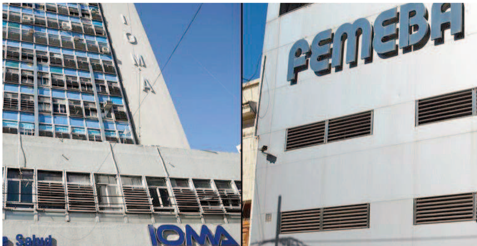
El próximo encuentro del Consejo de Femeba –del que podrían surgir novedades en relación con el conflicto con IOMA– será el martes en La Plata. ILUSTRACIÓN

Los consejeros votamos no hacer ningún corte. Así según el resultado de la votación, por ahora no se hará ningún corte de servicios esta semana que viene”, aseguró y explicó: “Cuando se hace un corte, no se puede facturar por IOMA pero se atiende igual a la gente, las guardias están permanente, todos los médicos atienden, no se hacen cirugías programadas sino las de urgencias solamente y el médico tiene cortado el sistema para facturar con Femeba, por lo que no puede pasar la consulta”.