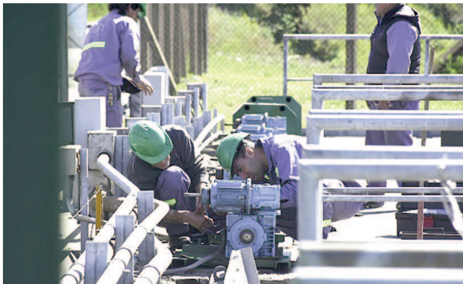
La obra que se licita incluye una serie de tareas a desarrollar en el terraplén y la estación de bombeo en un plazo de tres años.