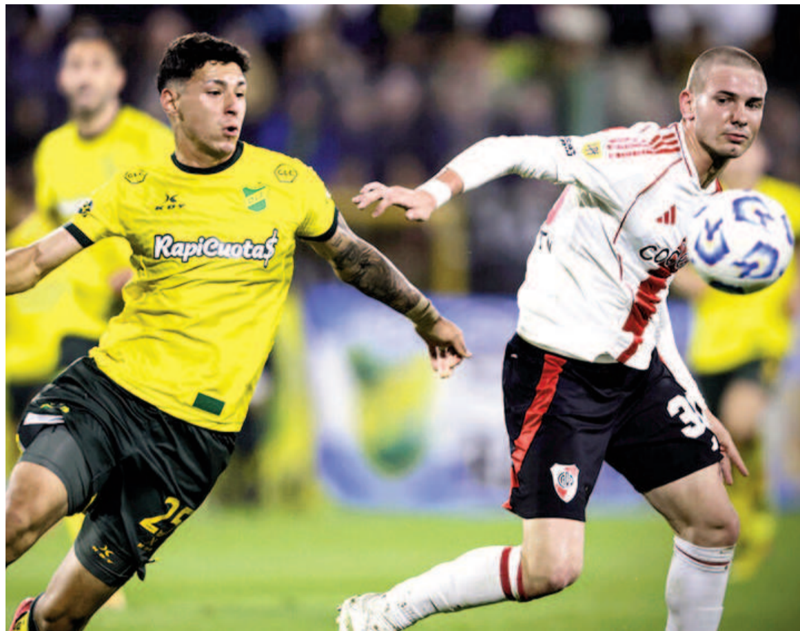
El equipo de Gallardo debió conformarse con un punto.

En el primer tiempo el Millonario se quedó en amagues y terminó pasándola mal frente al local, que incluso no se fue al descanso arriba por una muy polémica participación del VAR. Enrique Bologna intervino muy bien en la primera cuando lo fusilaba Franco Mastantuono, pero cuando creció el Halcón, hizo figura a Jeremías Ledesma.