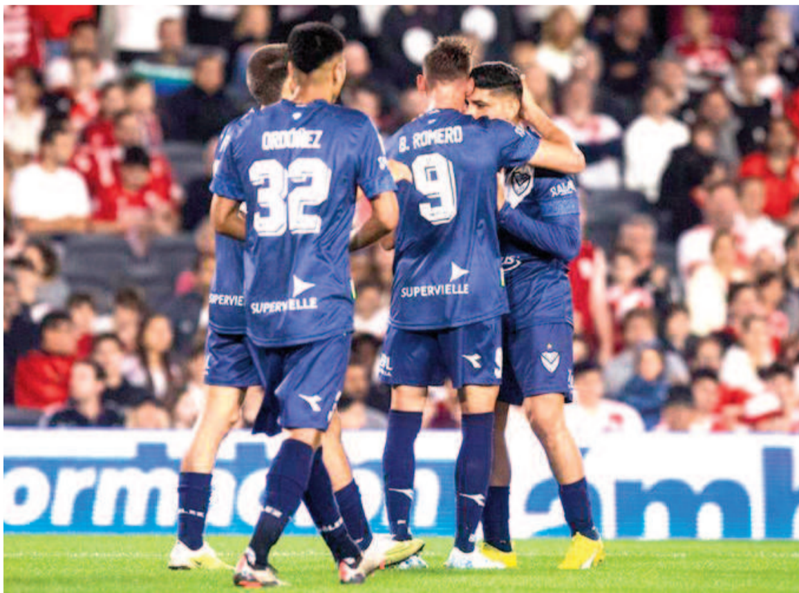
El Fortín viene de empatar ante River en el Monumental.